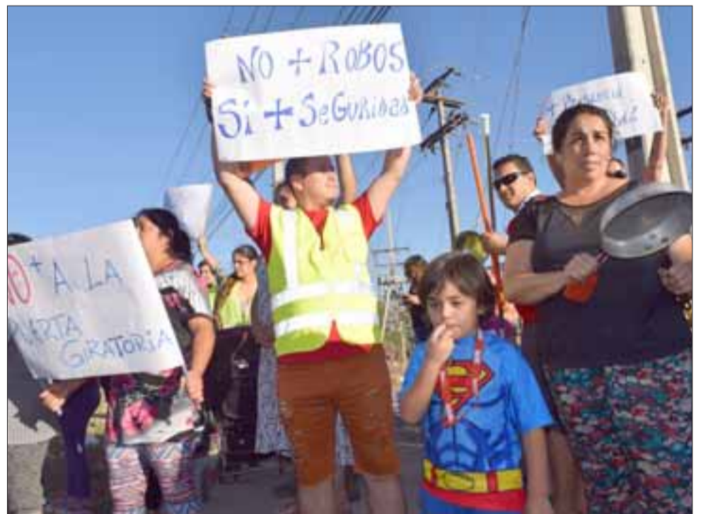
NO + ROBOS.- Hasta este Superman sanfelipeño salió a las calles a protestar por la ola de robos que vulnera la paz y seguridad de estos vecinos en Villa El Carmen.

«Desde hace un mes y medio que entendemos empezó esta nueva ola de robos en ese sector, yo concurrí personalmente a sentarme a dialogar con los vecinos para organizarnos en un plan de trabajo (...) en materia de acciones concretas lo que se hará en estos días será la limpieza perimetral de toda la zarzamora y árboles, para que los vecinos tengan una adecuada visibilidad en ese sector. La empresa F y Parques Johnson, las que se encargarán de dicha limpieza. Contrario a lo que los vecinos creen, el tema de crear un muro en ese sector de la línea del tren no es la solución, pues perderán ellos mismos la visibilidad. Nosotros como Municipio no podemos dar órdenes a Carabineros de hacer o no rondas en algún sector, eso es resorte directamente de Gobernación (...) ellos hasta ahora se organizan, pero estuvieron como ocho años sin juntas vecinales ni alguna iniciativa vecinal, porque cuando ellos ven Carabineros entonces bajan los brazos y se relajan, sin tener ninguna comunicación con las autoridades, ellos tienen que tener delegados por cada pasaje y sólo así podremos trabajar y tener resultados positivos», indicó a Diario El Trabajo el coordinador del Plan Comunal de Seguridad Pública, Alexis Guerrero López. Roberto González Short