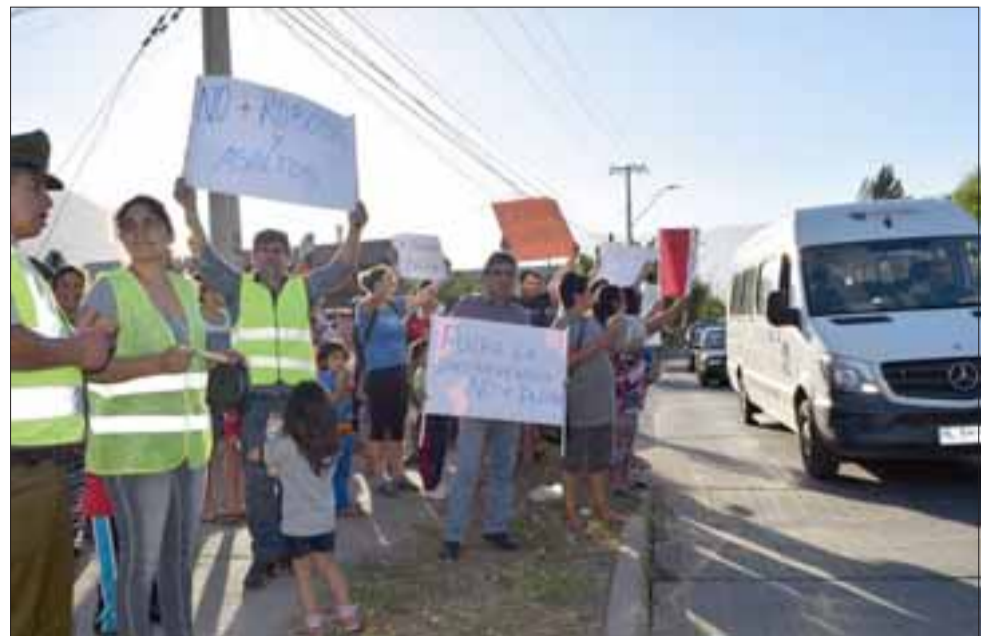
ORDENADO DESORDEN.- Los indignados vecinos por algunos minutos se tomaron la calle, paralizando el flujo vehicular, hasta que Carabineros intervino para poner orden.

TRABAJO INSUFICIENTE.- Estos vecinos desde el 18 de febrero vienen trabajando con la subsecretaría de prevención del delito, programa Plan Comunal de Seguridad.