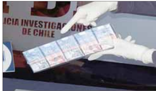
Cigarrillos incautados de la marca Pall Mall resultaron ser falsificados, con lo cual se configura otro delito de infracción a la propiedad intelectual.

En lo que va del año la PDI ha decomisado 11.527.200 cigarrillos avaluados en más de mil millones de pesos.