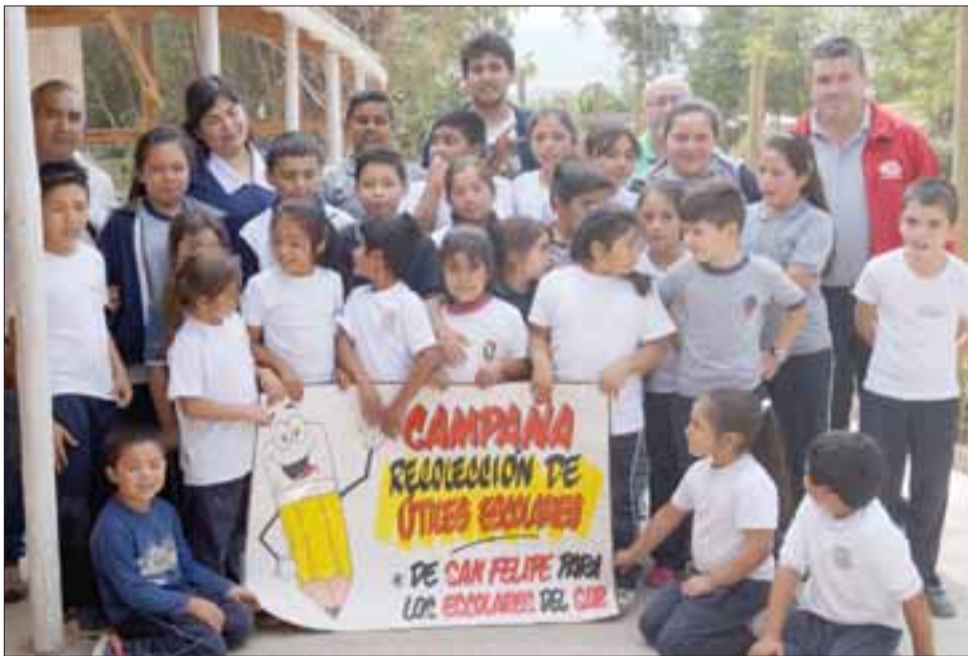
SOLIDARIDAD.- Fueron más de $2 millones en útiles escolares los que se recibieron de los clientes de Karnes KAR y de los lectores de Diario El Trabajo.