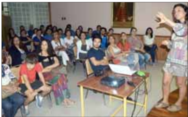
LLENO TOTAL. - Lleno estaba el salón de honor del municipio, pues muchas personas asistieron para aprender cómo alimentarse saludablemente.