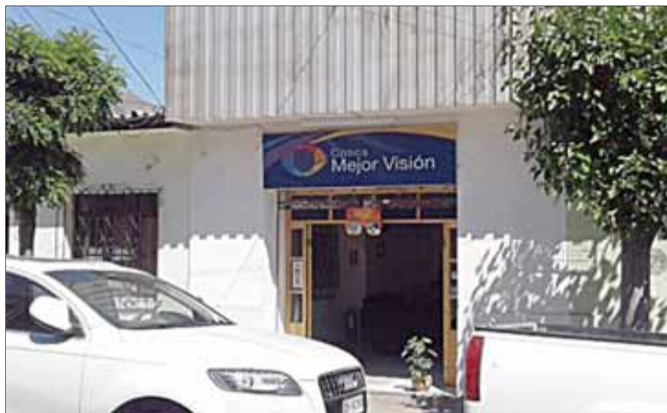
La óptica 'Mejor Visión' se ubica en Traslaviña y al momento del robo llevaba poco más de un mes funcionando.

indaguen más y que pongan mano dura, la puerta giratoria está muy rápido”, finalizó Boris González.