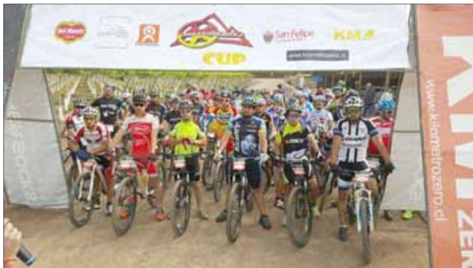
Ciento sesenta fueron los ciclistas que cumplieron el duro trazado de 100 kilómetros que comprendió carrera realizada el domingo pasado en San Felipe.

Los más de 160 participantes debieron dar cinco vueltas para completar los 100 kilómetros que era la distancia total de la carrera, es decir la exigencia fue al