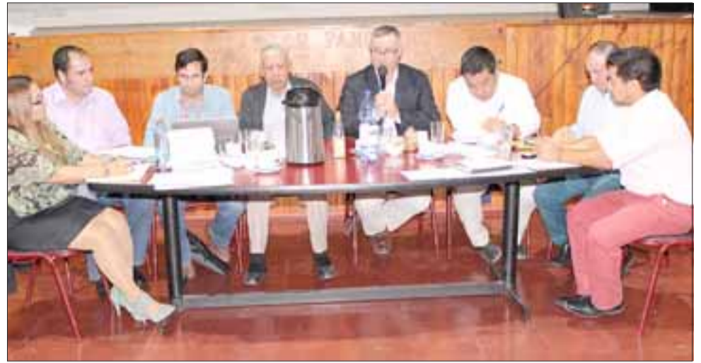
El Concejo Municipal de Panquehue acordó por unanimidad pedir una nueva reunión con el MOP, donde solicitarán obras complementarias al proyecto nueva ruta 60CH.