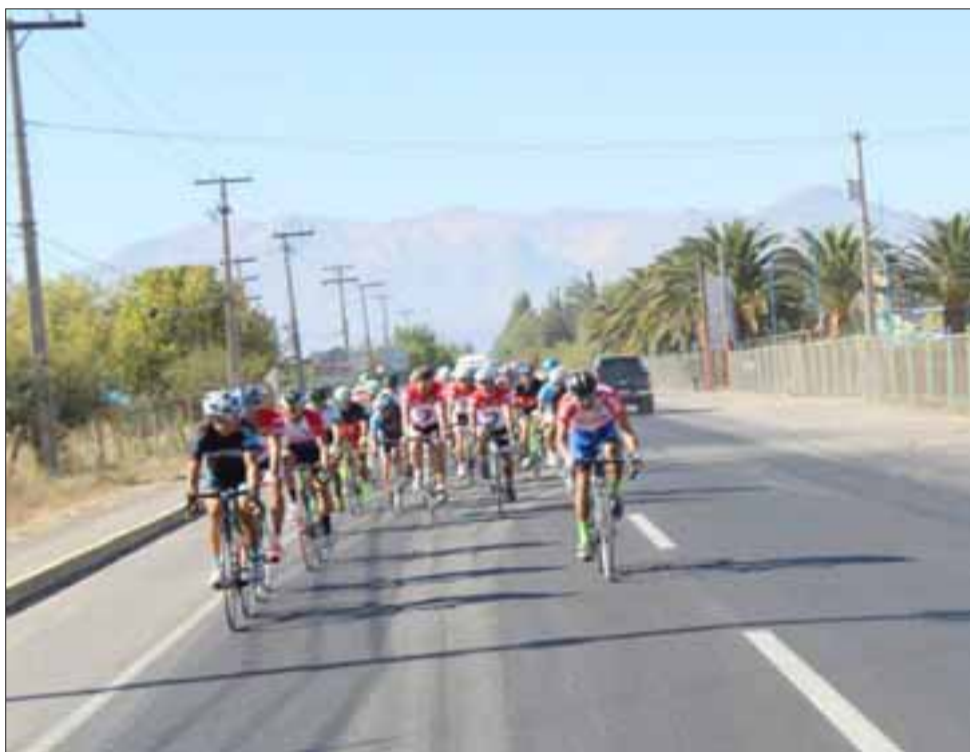
La carrera que fue para celebrar el tercer Año de San Felipe Bike, marcó el regreso del ciclismo de ruta al valle de Aconcagua.

máximo, por lo que cada competidor debió hacer su mejor esfuerzo para poder culminar la prueba con la que después de mucho tiempo regresaron los torneos de ruta al valle de Aconcagua, en lo que sin lugar a dudas es una tremenda y positiva noticia para todo el deporte aconcaguino.