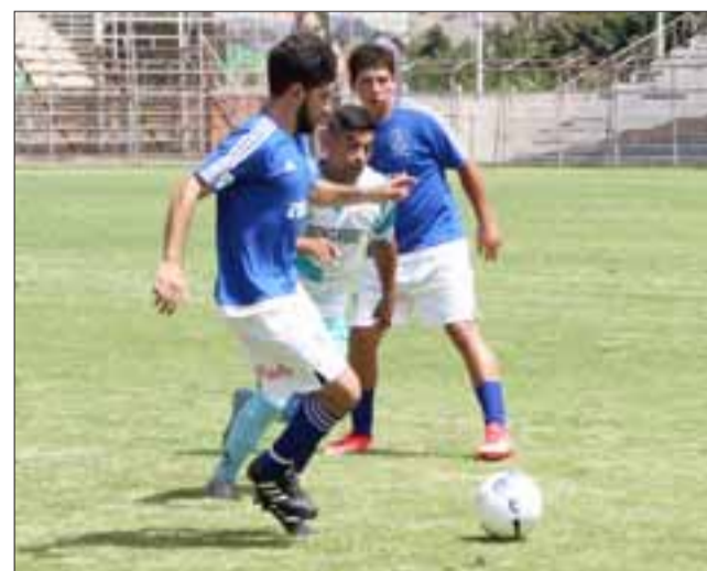
El equipo sanfelipeño de Juventud La Troya no jugará en la segunda fase de la Copa de Campeones, al estar clasificado a la tercera ronda.

En el partido con San Francisco, que se disputó en Valparaíso, el club Diamante sufrió un verdadero robo ya que les anularon cuatro goles y les cobraron un penal en contra fuera del área.