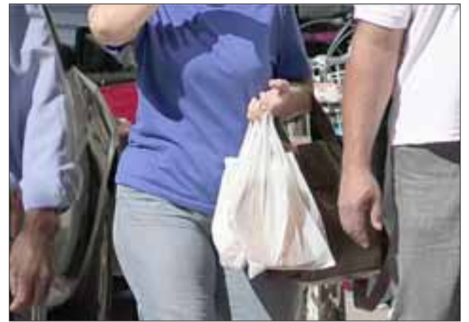
En 18 meses las bolsas plásticas deberían desaparecer de San Felipe, dejando en el pasado escenas como la que se aprecia en la imagen.

“Se va a informar al comercio local, a los supermercados, feriantes, qué opinión tienen de este tema y de qué manera podemos ayudar como municipio, y posteriormente los siguientes seis meses se entregarían en los establecimientos sólo tres bolsas, para que la gente se empie-