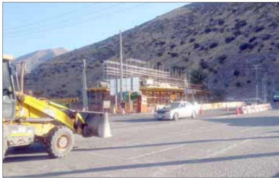
Estado actual de las obras de la nueva carretera 60 CH, que se ejecutan a la altura del Puente El Rey.

miento de tierra importante porque ya se están comenzando a instalar los enrocados, por lo tanto, efectivamente esperamos que de aquí a fin de año podamos tener terminada esta carretera”, advirtió el Secretario Ministerial.