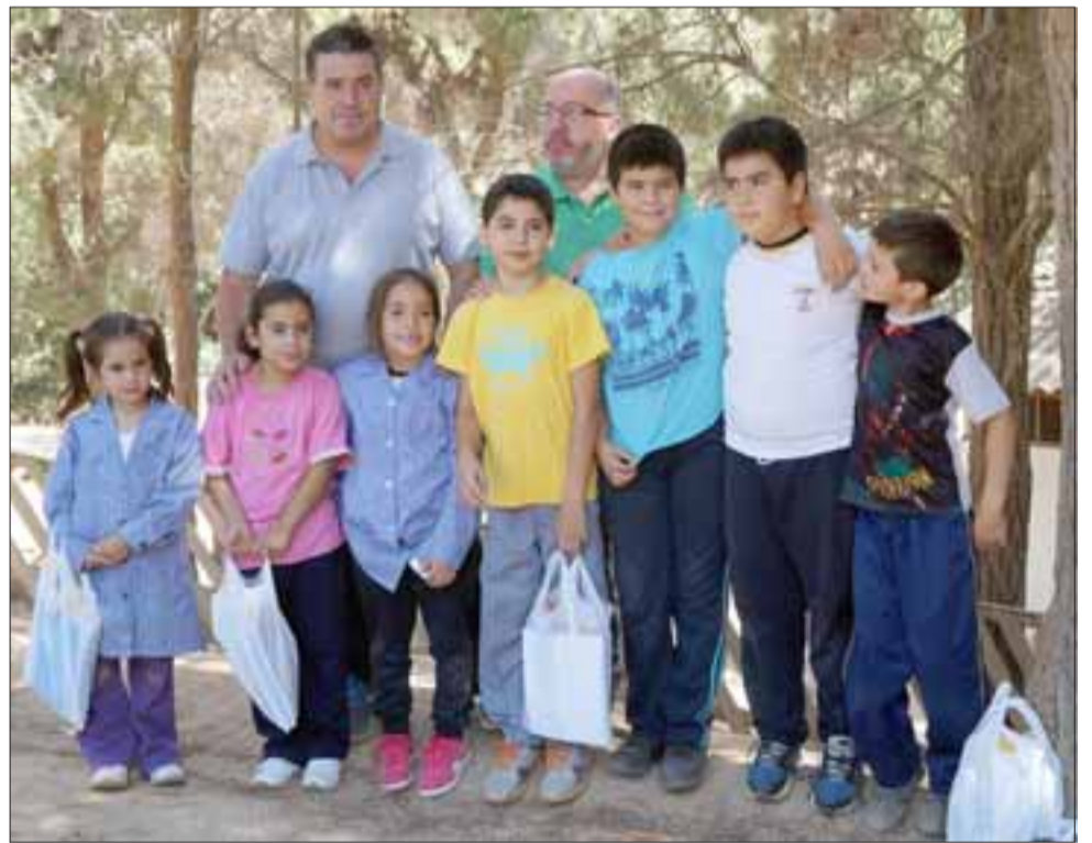
PEQUES AGRADECIDOS.- Estos niños, poquitos por cierto, son toda la matrícula de una de estas escolitas rurales en Curicó.