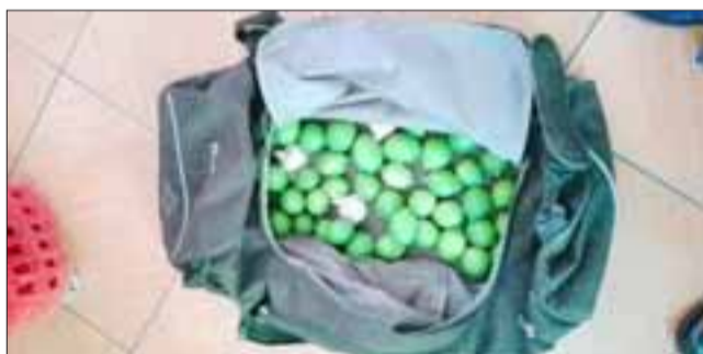
Alrededor de tres kilos de limones lograron extraer los imputados desde el Fundo Valle Aconcagua de Santa María, siendo advertidos por su propietario que los denunció ante Carabineros.

Los detenidos fueron formalizados por robo en lugar no habitado quedando requeridos por la Fiscalía para resolver el caso.