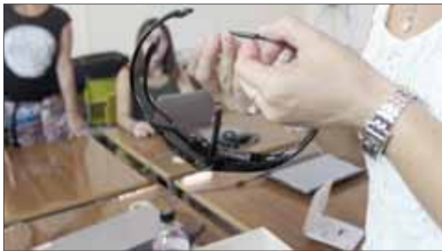
Este es el moderno cintillo que permite controlar el computador y que ambas alumnas recibieron junto a un notebook.

nas y sus familiares para obtener estos computadores y programas.