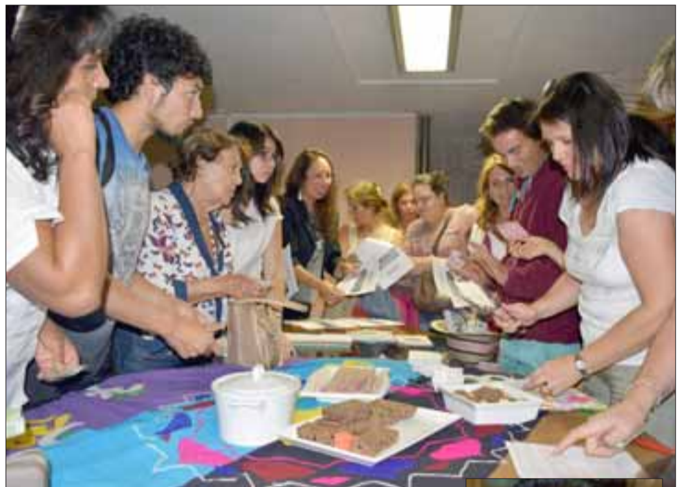
COMIDA VEGANA. - La conferencista internacional ofreció algunos alimentos naturales para que los presentes degustaran de esas delicias.

El interés por conocer estos conceptos de alimen-