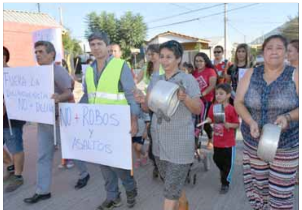
ESTÁN INDIGNADOS.- Con ollas, sartenes y pancartas en mano, los vecinos de Villa El Carmen hicieron oír sus voces en Calle Michimalongo.