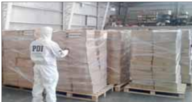
Un total de 301.500 cajetillas de cigarrillos fueron incautadas, avaluadas en 603 millones de pesos.

Al igual que en caso anterior, el conductor de nacionalidad argentina quedó a la espera de ser citado a declarar.