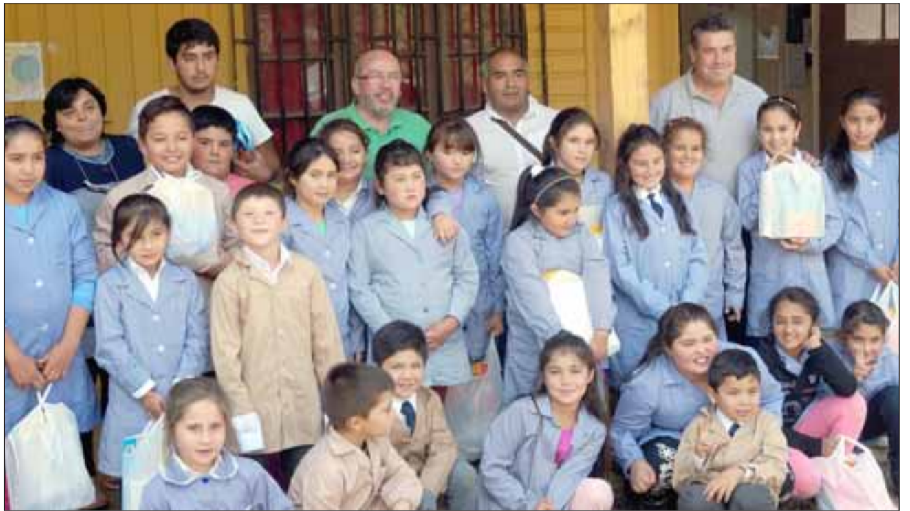
SÍ SE PUDO.- Los niños recibieron la muestra de cariño y solidaridad que los sanfelipeños enviaron a través de esta campaña comunitaria.