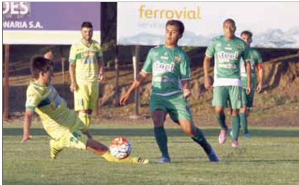
Trasandino debe hacer suyo sí o sí los tres puntos en disputa frente a Malleco.

Pasito a pasito, así, como dice la canción del momento, ha sido la resurrección de Trasandino en el torneo de la Segunda División, donde el conjunto andino ha experimentado una importante alza que le ha permitido comenzar a cimentar su lucha para escapar del descenso.