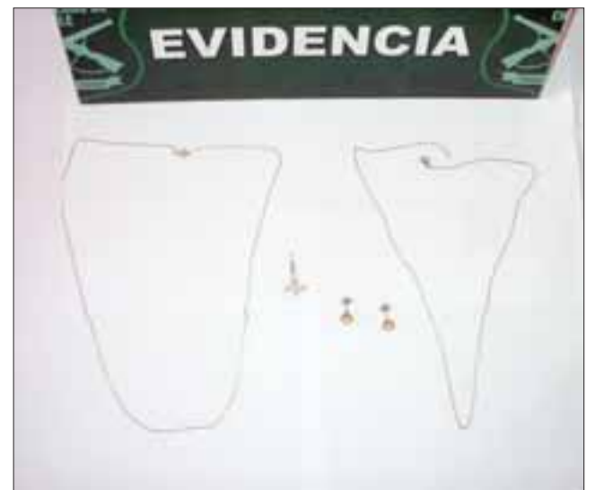
La SIP de Carabineros recuperó parte de las joyas que se encontraban empeñadas en una compra y venta de oro en San Felipe, siendo regresadas a su propietaria.

OS7 incautó drogas en domicilio de Villa Bernardo Cruz