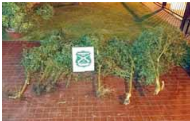
Carabineros incautó 10 plantas de cannabis sativa desde el interior del domicilio siniestrado.