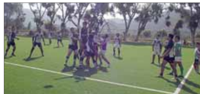
El equipo San Felipe Rugby invita a toda la comunidad a presenciar este domingo en el estadio Fiscal, un gran festival del deporte de la ovalada.

Respecto a la importancia que tiene para el nacimiento del equipo sanfelipeño la actividad del domingo, el en-