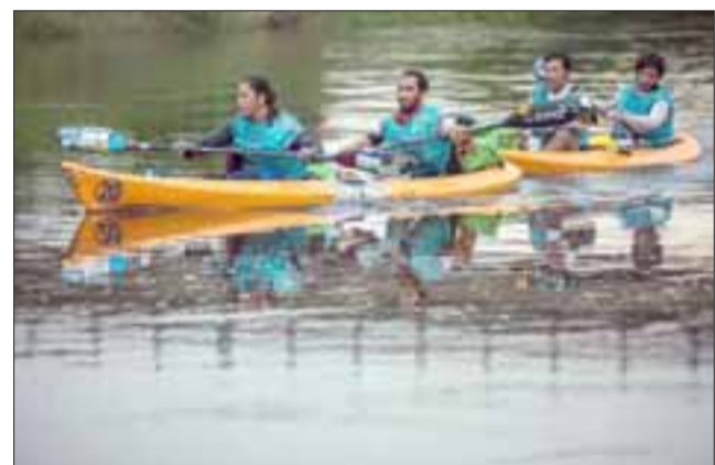
La atleta santamariana demostró en la Expedición Guaraní que tiene nivel para pelear contra las mejores del orbe.

Sobre la progresión y avances que está teniendo el equipo Sporttotal, del cual ella es parte, es muy clara en sus conceptos: “Cuando se