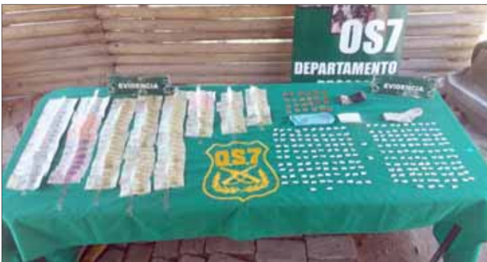
Personal del OS7 de Carabineros Aconcagua incautó 64 gramos de pasta base de cocaína y $418.900 en efectivo desde el interior de una vivienda ubicada en la Villa Bernardo Cruz de San Felipe.

Un total de 64 gramos de pasta base de cocaína y $418.900 en efectivo fue el resultado de un allanamiento concretado al mediodía de este jueves por efectivos del OS7 de Carabineros Aconcagua, al interior de una vivienda ubicada en la Villa Bernardo Cruz de San Felipe.