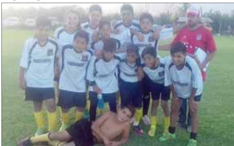
Los niños del Pentzke fueron muy buenos anfitriones en el encuentro formativo del sábado recién pasado.

La tercera serie infantil del club Unión Sargento Aldea fue uno de los participantes del festival futbolístico.