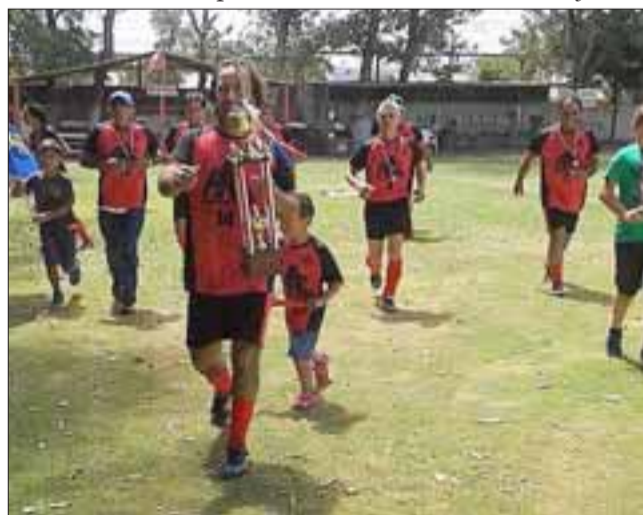
El domingo comenzará a jugarse un nuevo campeonato en la serie de honor de la Liga Vecinal y en el cual todos buscarán evitar que PAC dé su tercera vuelta olímpica consecutiva.

Programación 1 a Fecha 9:45 Unión Esfuerzo – Barcelona; 11:10 Carlos Barrera – Andacollo; 12:20 Aconcagua – Santos; 14:00 Pedro Aguirre Cerda – Unión Esperanza; 15:10 Los Amigos – Hernán Pérez Quijanes; 16:45 Resto del Mundo – Tsunami; 18:00 Villa Argelia – Villa Los Álamos.