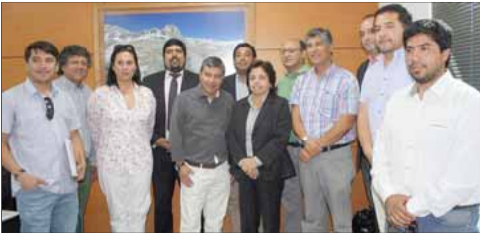
La ministra Williams se reunió con los representantes del Sindicato Industrial de Integración Laboral (SIIL); Unificado de Trabajadores (SUT) y de Supervisores (SISAN) de División Andina de Codelco.

trial de Integración Laboral (SIIL); Unificado de Trabajadores (SUT) y de Supervisores (SISAN) de la División Andina de Codelco.