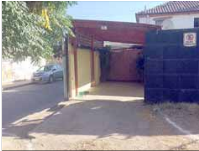
Acá se guardaba el auto, el portón eléctrico tiene un candado, el cual fue abierto sin necesidad de romperlo.

"Entraron por el lado, reventaron las puertas, encontraron adentro las llaves del portón eléctrico, que incluso tiene candado, ese lo abrieron, no lo reventaron, ahí se llevaron el auto, un televisor grande que cuesta un montón desmontarlo y yo no me di cuenta de nada hasta hoy (ayer en la mañana) cuando vi el portón abierto", describió la