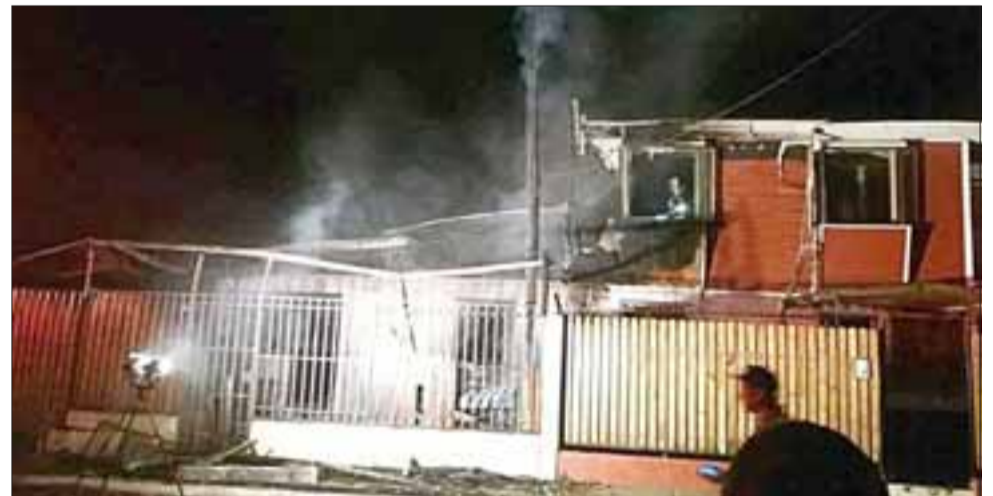
El incendio afectó dos viviendas de Santa Rosa de Llay Llay.

Ante la flagrancia del delito los efectivos policiales procedieron a la detención del propietario de la casa, conocido intérprete musical