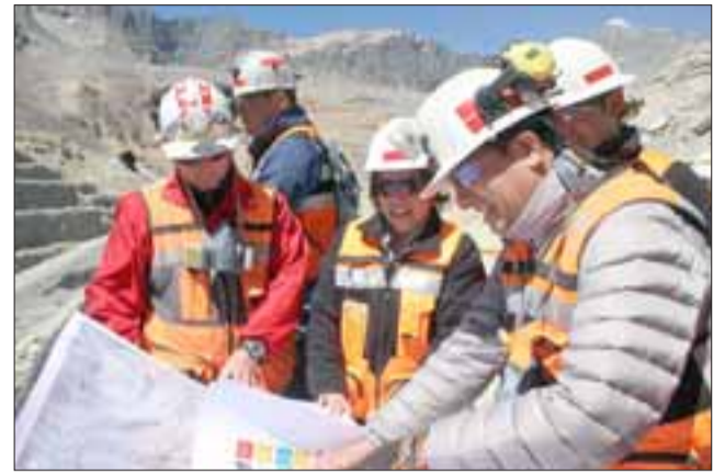
En la Mina Rajo, la secretaria de Estado conoció avances del Proyecto Traspaso por parte de profesionales de Andina y la Vicepresidencia de Proyectos.

En la mina rajo, la visita se centró en conocer en terreno los avances del Proyecto Nuevo Sistema Traspaso Mina-Planta -uno de los proyectos estructurales de Codelco-, que busca asegurar el procesamiento de mineral hasta el año 2050, con una inversión cercana a