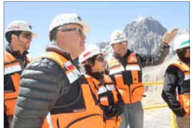
En visita técnica, la ministra de Minería, Aurora Williams, entregó su irrestricto respaldo a los proyectos de División Andina.