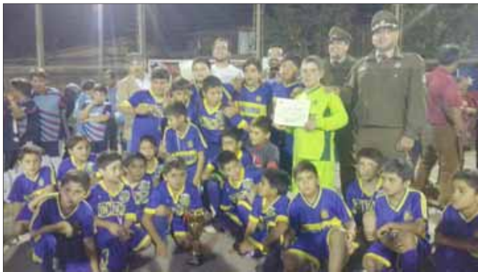
Los niños fueron los protagonistas de este campeonato.