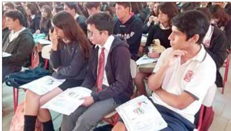
Alrededor de 350 alumnos del Liceo Mixto de San Felipe participarán como voluntarios en el censo del 19 de abril.

Por su parte, la Encargada Provincial del Instituto