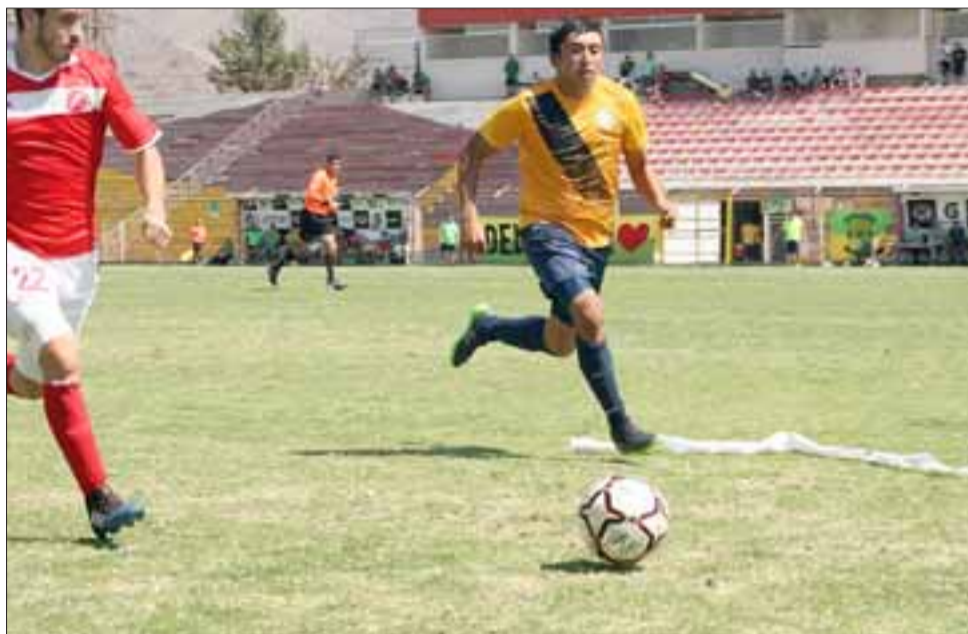
Unión Delicias de San Felipe entregó una muestra de fuerza y calidad al imponerse de manera brillante a San Francisco por 3 goles a 1.

Deportivo Colunquén 1 (Panquehue) – Las Colinas (Viña del Mar) 2; Las Bandurrias (San Esteban) 2- Independiente (Unión Del Pacífico) 1; Enrique Meiggs (Rural Llay Llay) 2 - Unión Placilla (Puerta del Pacífico) 7; Huracán (Puerta del Pacífico) 2 – Fundición Chagres (Panquehue) 2; Nacional (Quillota) 2 – Almendral Alto (Santa María) 0; Unión Delicias (San Felipe) 3 – San Francisco (Valparaíso) 1; Santa Rosa (Santa María) 1 – Pullally (La Ligua) 2.