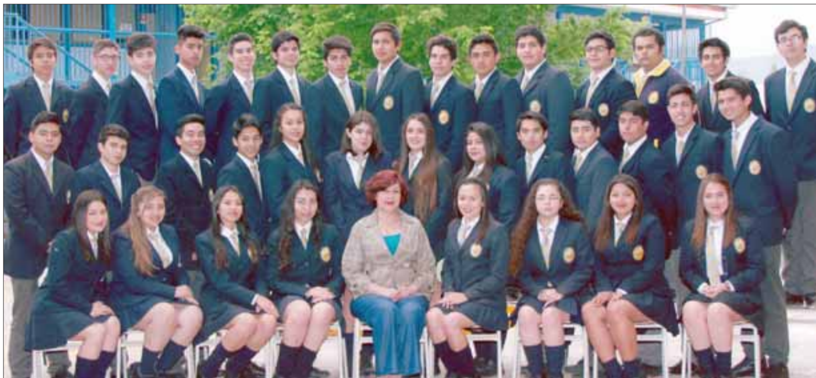
A LA CARGA.- Aquí tenemos a la Generación 2016 del Liceo Bicentenario Cordillera, chicos sanfelipeños que ahora están volando alto en las mejores universidades del país.

En 2016 egresaron 42 estudiantes de 4° Medio de esta casa de estudios, jóvenes que ya están incorporados en las mejores universidades de Chile, dándose a la tarea de forjar ellos mismos su futuro a fuerza de estudio, sacrificio de sus padres y a veces hasta de una vida de trabajos informales para llegar a sus metas.