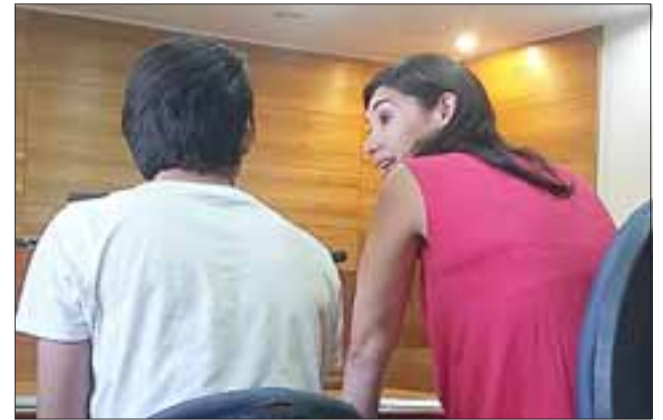
El joven estudiante, sin antecedentes penales, fue formalizado y quedó en libertad.