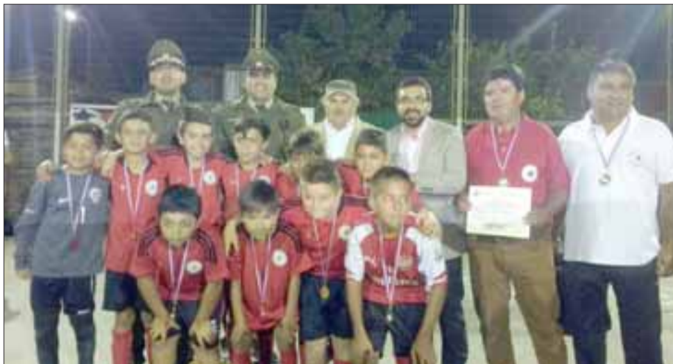
Promover la vida sana y el deporte fue el objetivo de esta iniciativa de Carabineros y la Municipalidad de Llay Llay.