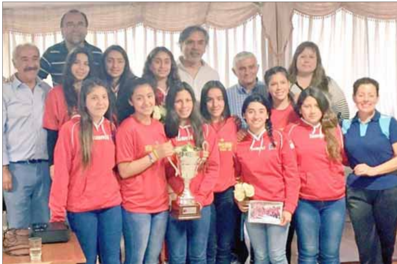
FRUTOS DE ALEGRÍA.- Es muy importante destacar las excelentes hazañas deportivas que este colegio sanfelipeño ha logrado durante 2016, ganando la U-14 de voleibol del campeonato nacional 2016, tras vencer en una infartante final al representativo de la Región Metropolitana.