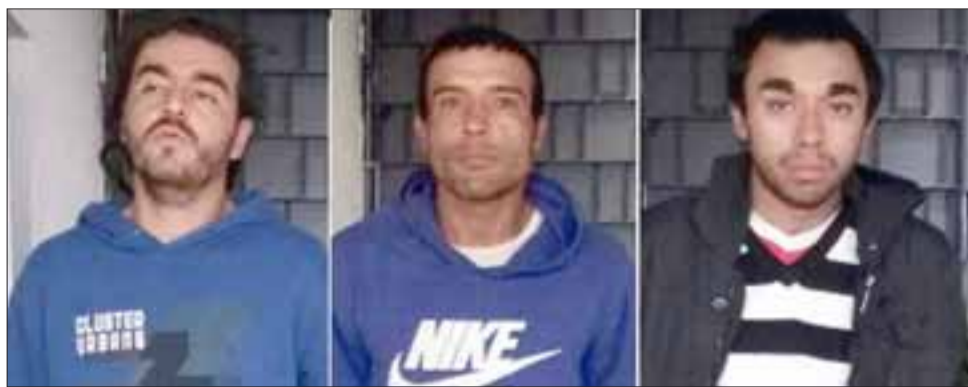
Los imputados tras ser detenidos por Carabineros fueron formalizados en tribunales quedando en libertad bajo cautelar de firma.

Carabineros al inspeccionar la vivienda constató que los delincuentes escalearon la reja de cierre perimetral para luego acceder por la puerta prin-