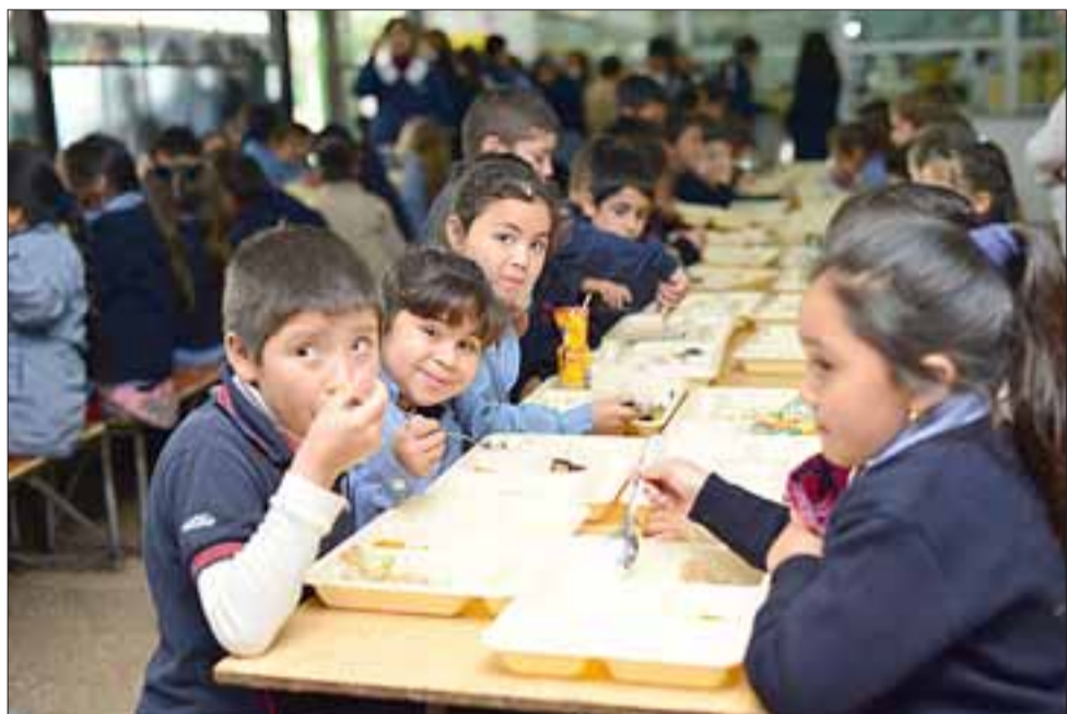
Ningún alumno se va a quedar sin almuerzo, aseguró Junaeb, señalando que el «ajuste» es solo para evitar desperdiciar los alimentos.

Góngora recordó que los establecimientos que ofrecen el beneficio de alimentación a sus alumnos, pueden solicitar a Junaeb mensualmente el aumento o rebaja de raciones, dependiendo de las necesidades que presente cada uno, por lo tanto, “basta con que el apoderado solicite en el establecimiento que se gestione con Junaeb el aumento de las raciones y nosotros vamos a proceder a generar ese incremento y garantizar alimentación a todos los estudiantes que hayan tenido este beneficio