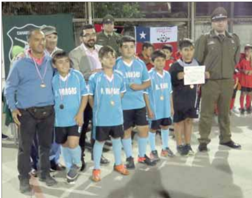
Se entregaron reconocimientos a los ocho equipos que participaron del campeonato.