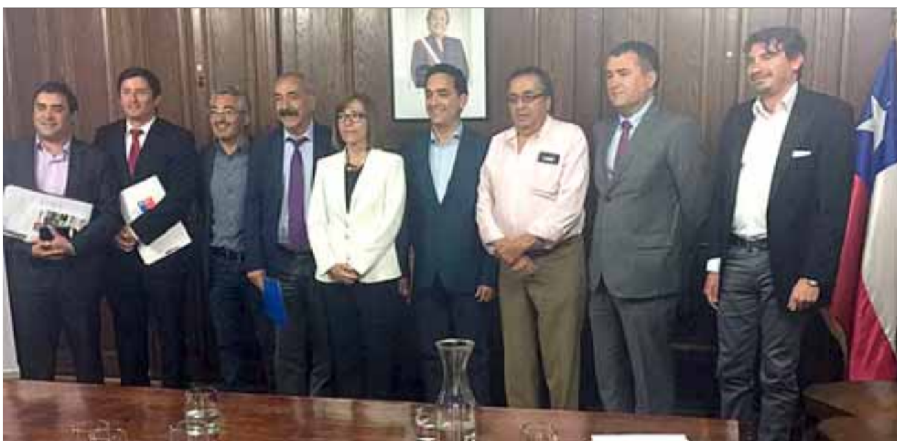
La delegación de San Felipe junto a la Ministra de Bienes Nacionales Nivia Palma.

Cabe destacar que en el lugar viven unas seis familias en toma, por lo que no se descarta dejar algún espacio para viviendas.