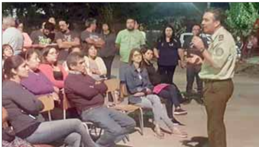
Vecinos de la Villa El Carmen escucharon atentamente al Comisario de Carabineros de San Felipe, Mayor Héctor Soto Möeller.

Es por ello que el jefe de Carabineros de San Felipe dialogó con los vecinos para evaluar los factores de riesgo, para determinar los mecanismos de acción por parte de la institución uniformada que vaya directamente en el bien común de la ciudadanía.