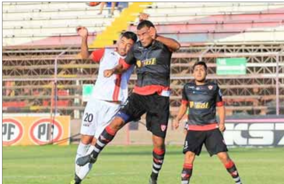
El Uní será forastero en la próxima jornada del torneo de la Primera B.

Para el próximo domingo 26 de marzo y a las cuatro de la tarde en punto quedó amarrado el partido correspondiente a la décima fecha de la segunda rueda del torneo de la Primera B entre Cobreloa y Unión San Felipe.