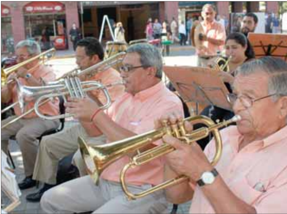
MADRUGARON. - Muy tempranito los músicos del Orfeón Aconcagua se dieron cita para dar la bienvenida al Otoño, la estación de las cosechas en ambos hemisferios del planeta.

EN MARZO CHEVROLET TRAE SOLO BUENAS NOTICIAS PARA QUE TE SUBAS A TU O KM.