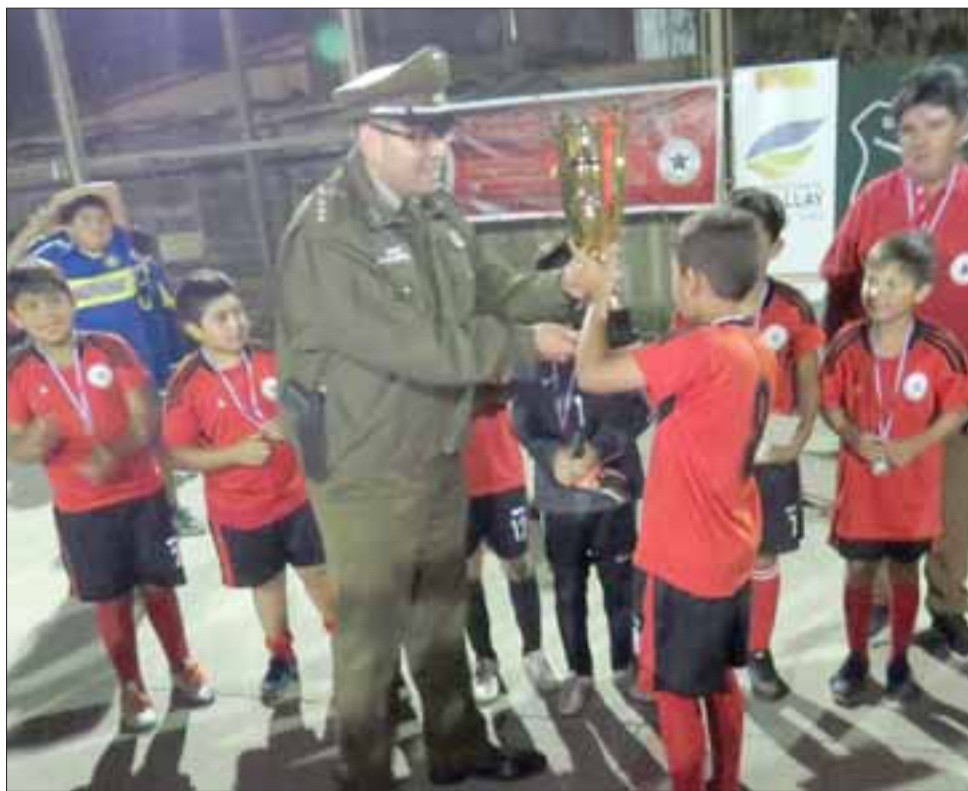
El equipo ganador Estrella Sector 9 recibiendo la copa de manos del Capitán de Carabineros, Osvaldo Villarroel.