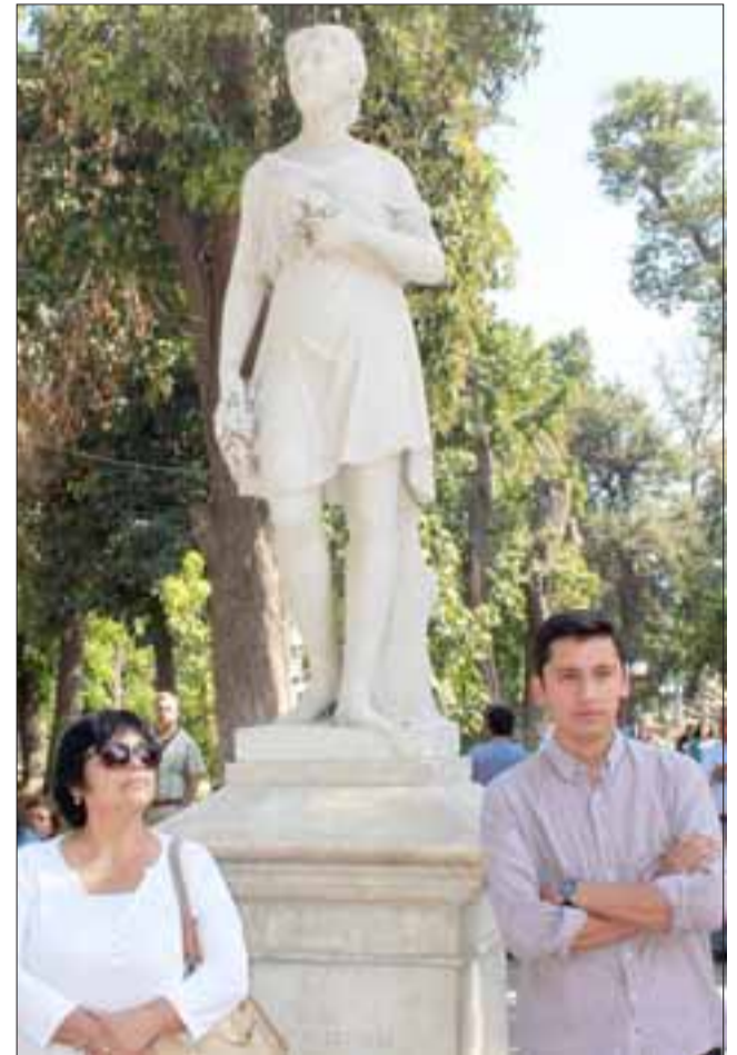
REFRESCANTE OTOÑO. - Esta estatua, modelada por Sofía Mascayano en 1883, representa la estación en la que ya estamos, y que está ubicada en nuestra plaza de Armas frente al centro comercial El Caracol.