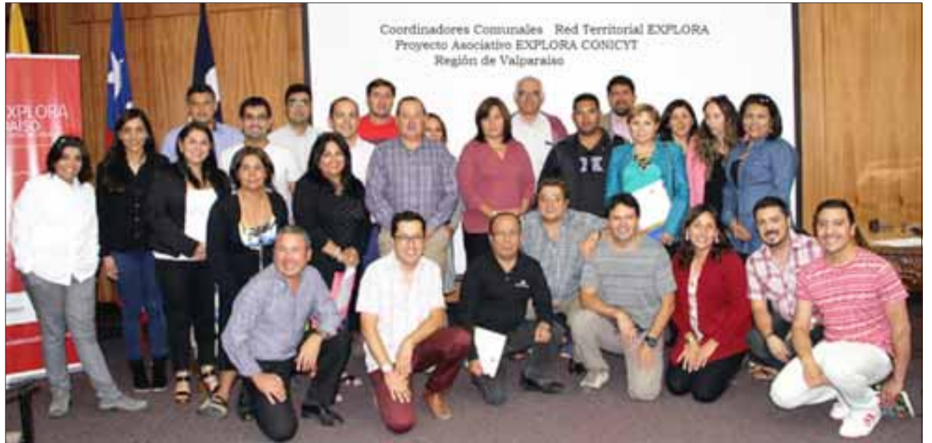
Profesores de todas las comunas del valle de Aconcagua asistieron al encuentro realizado el lunes pasado en Valparaíso.