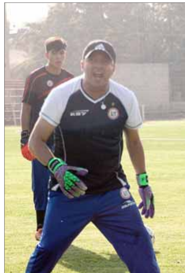
El nuevo miembro del staff técnico del club aconcagüino cuenta con una amplia experiencia en la función de preparar arqueros.

có el nuevo integrante del cuerpo técnico de los sanfelipeños.