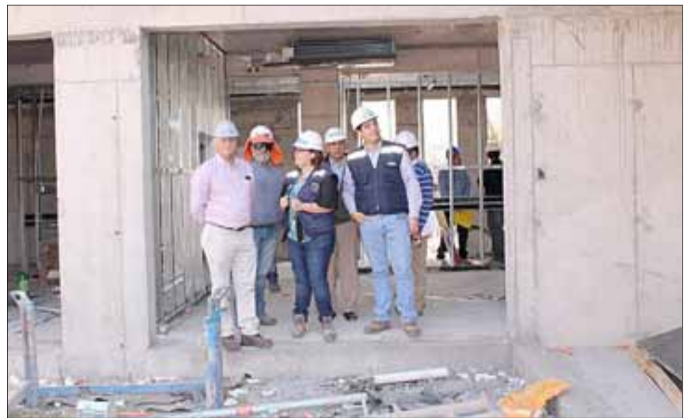
Los concejales junto al alcalde quedaron satisfechos con el avance de la obra que debería ser entregada en junio próximo.

“Es una visita que nos permite conocer el grado de avance de su construcción, por lo mismo, como Concejo Municipal nos interesaba visitar el proyecto y así