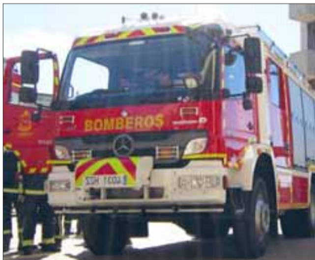
Tres de los diez vehículos de última tecnología que entregará el Core en la región, serán para el Valle de Aconcagua.

Felipe; Quinta de Los Andes; Primera de Quillota; Primera de Quintero; Segunda de La Calera; Quinta de Viña del Mar; Segunda de Villa Alemana; Tercera de Villa Alemana; Segunda de Quilpué.