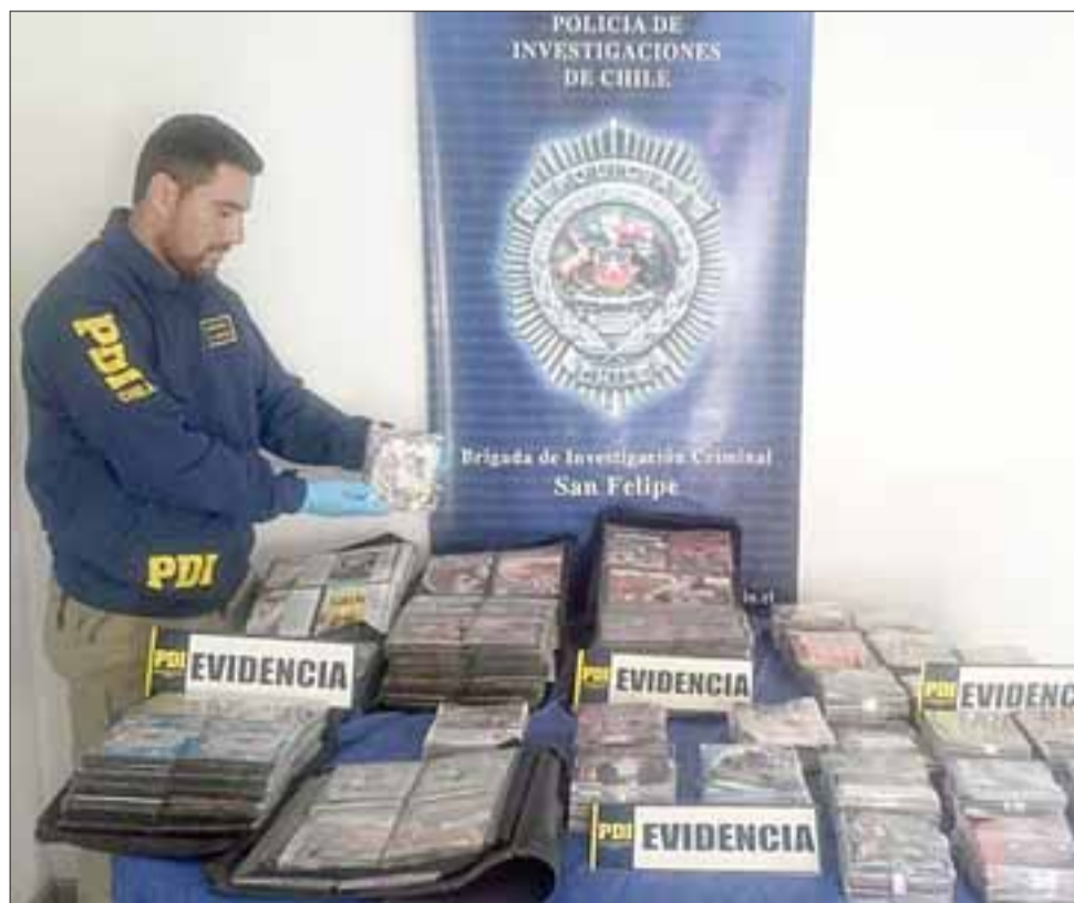
La Policía de Investigaciones incautó un total de 1.796 discos de películas y juegos piratas, siendo detenida una comerciante del Caracol Los Portales de San Felipe.