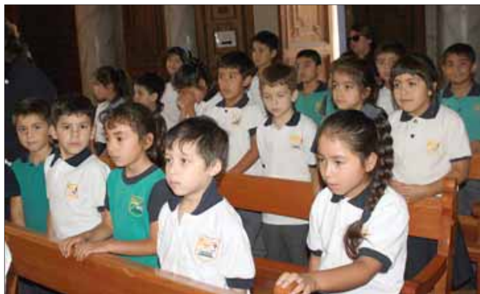
ESCOLARES PRESENTES. - Estudiantes de la Escuela Almendral llegaron por cursos a despedir al párroco. Hoy será sepultado.