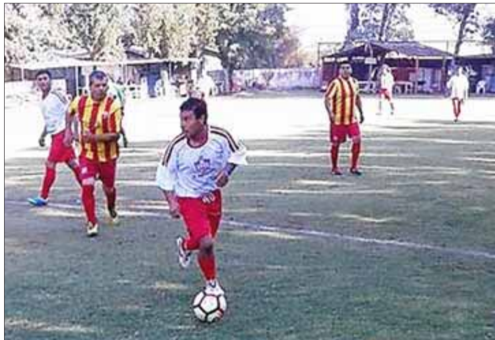
Marcadores muy ajustados se registraron en la primera fecha del nuevo campeonato estelar de la Liga Vecinal.

Tsunami 15 – Resto del Mundo 0; Carlos Barrera 1 – Andacollo 1; Los Amigos 2 – Hernán Pérez Quijanes 0; Santos 2 – Aconcagua 1; Barcelona 3 – Unión Esfuerzo 1; Villa Los Álamos 4 – Villa Argelia 2; Pedro Aguirre Cerda 1 – Unión Esperanza 1.