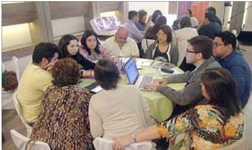
La jornada contó con representantes de todos los establecimientos de la red, incluidos dirigentes gremiales y Consejos de Desarrollo Local de las comunas del valle.

Entre las conclusiones, principalmente se destacaron el énfasis en la perspectiva de derechos en salud como un derecho humano fundamental: La salud no es servicio o bien de consumo, es consustancial a cada sujeto por su sola condición de ser humano. Los derechos se materializan en su ejercicio, por lo que los Estados están obligados a proporcionar las condiciones necesarias para su apli-