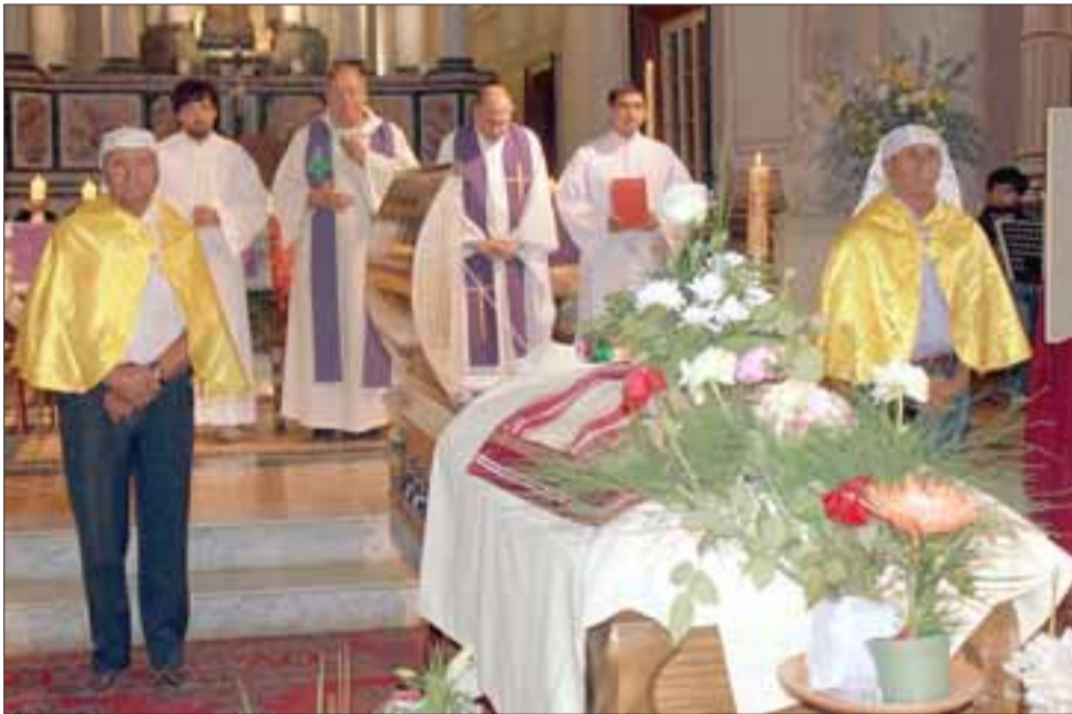
HOY SERÁ SEPULTADO. - El velatorio se efectuó desde la noche misma del martes. Hoy jueves a las 11:00 horas será la Misa correspondiente, descansando sus restos en el Monasterio Antiguo, en Los Andes, en el mausoleo a él asignado.