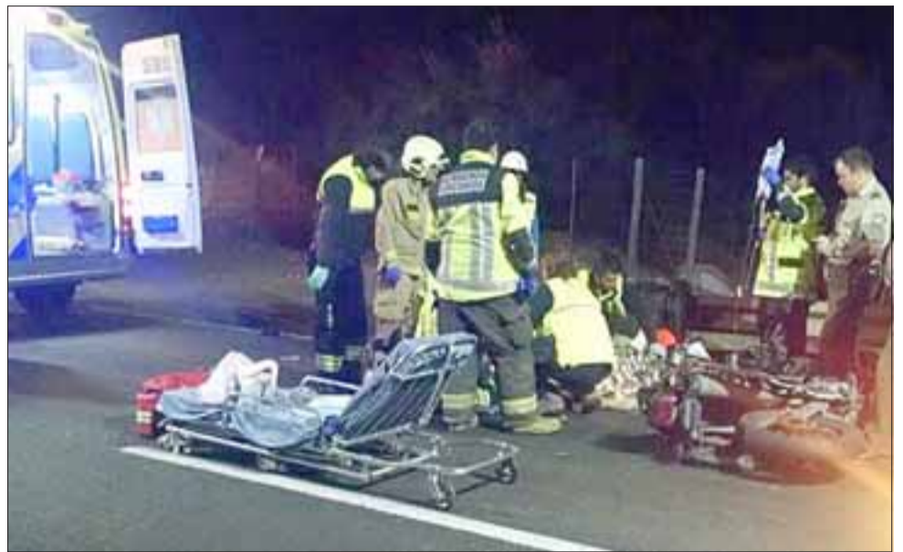
Personal del Samu intentó durante media hora reanimar al motociclista, quien finalmente falleció en el lugar.

Acerca de este accidente, el Subcomisario de los Servicios de la Tercera Comisaría de Carabineros,