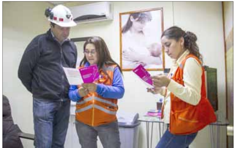
SALA LACTANCIA.- Ochenta y ocho mujeres son parte de la dotación propia de Andina y cuentan con instalaciones especiales, como las salas de lactancia materna en el área industrial.

AVISO: Por extravío quedan nulos cheques desde N° 9323118 al 9323155, Cta. Cte. N° 23100019434 del Banco Estado, Suc. Llay Llay. 24/3