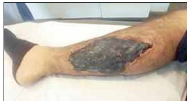
Actualmente la lesión pasó hasta este estado de necrosis. El joven afectado será sometido a intervención quirúrgica en las próximas horas.

de síntomas sistémicos, como ocurrió en las primeras consultas a Urgencia de este caso, ya que la sintomatología fue de progresión lenta y tal como está demostrado, el manejo y terapia del paciente dependerán de si tiene o no compromiso sistémico y del nivel de complicación de la lesión cutánea.