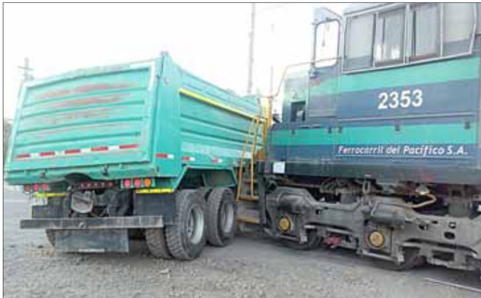
Acá se puede apreciar que la parte delantera del tren, donde está la muela de acople del convoy, quedó enganchada con el camión.

Una milagrosa escapada tuvo el conductor de un camión que este lunes en la mañana colisionó con el tren de la empresa Fepasa, en el cruce de línea que hay a la entrada de San Felipe.