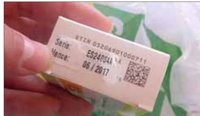
Arriba se muestra el medicamento cuya fecha de vencimiento es en 06-2017. Abajo el mismo medicamento que en definitiva vencía en 06 del 2016.

Este lunes la afectada concurrió hasta las oficinas de la Autoridad Sanitaria ubicadas en calle San Martín esquina Salinas, donde estampó la denuncia correspondiente contra la farmacia, más que nada por una