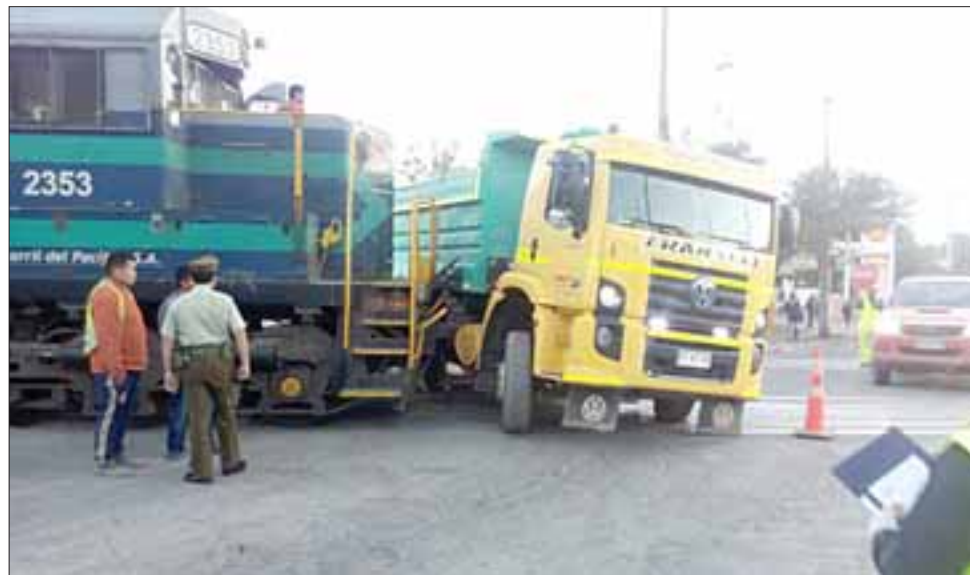
Así quedaron ambos vehículos. Personal de Carabineros ya está en el lugar.

Finalmente el tránsito fue repuesto y Carabineros adoptó el procedimiento de rigor.