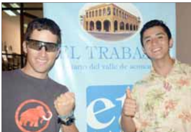
LA CREMA. - Diario El Trabajo se honra en patrocinar a estos dos referentes deportivos de Chile, jóvenes que saben lo que quieren y luchan para lograrlo.