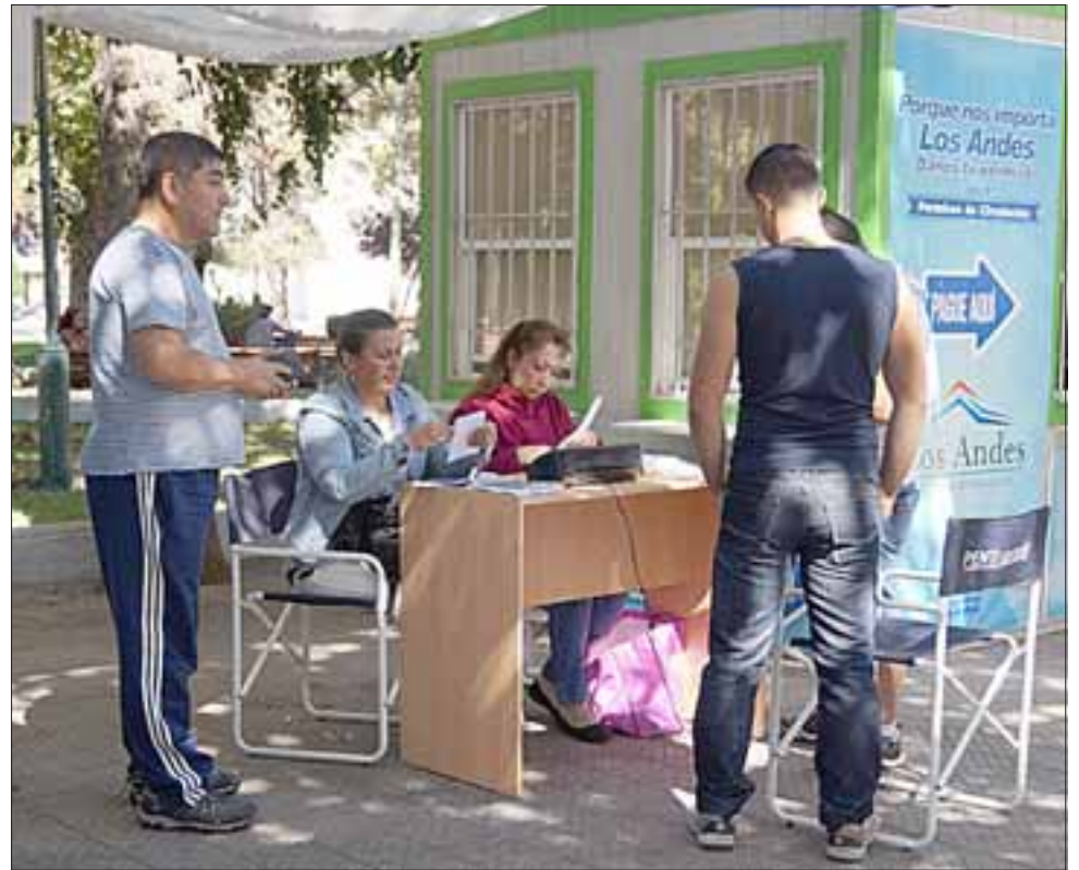
El 31 de marzo vence el plazo para realizar el trámite de renovación de permisos de circulación, que en el caso de Los Andes espera recaudar casi mil millones de pesos.

yentes se ha hecho más expedita, así como también a través de la página web www.losandes.cl