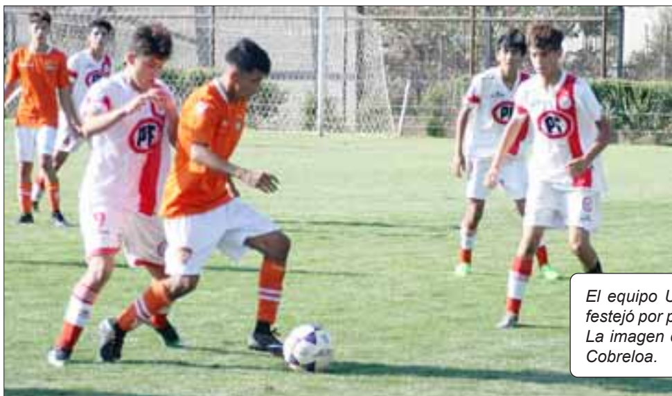
El equipo U16 del Uní fue el único que festejó por partida doble el fin de semana. La imagen corresponde al partido contra Cobreloa.

Solo el conjunto menor de 16 años de Unión San Felipe fue capaz de conseguir los seis puntos en la fecha doble que afrontaron los sanfelipeños durante el fin de semana pasado, y en la cual debieron medirse con las canteras de Cobreloa y Deportes Antofagasta, cuadros a los que tuvieron que enfrentar respectiva-