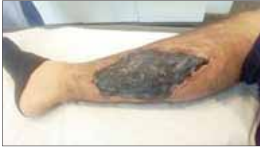
Así luce hoy herida de joven mordido por araña.

Acusa negligencia en servicio de urgencia