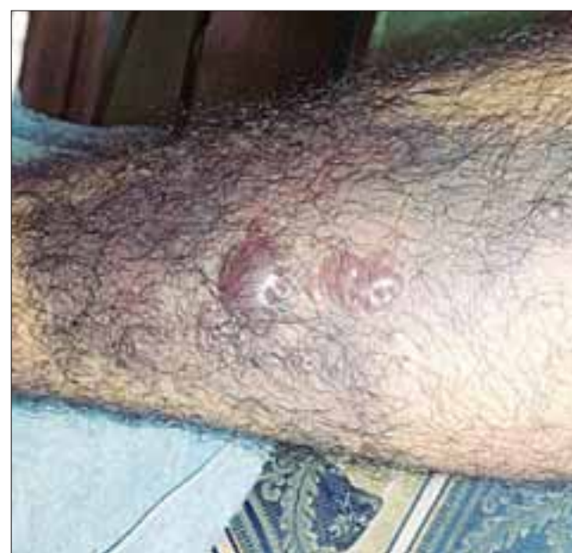
En la primera semana el paciente presentaba este estado su pierna.