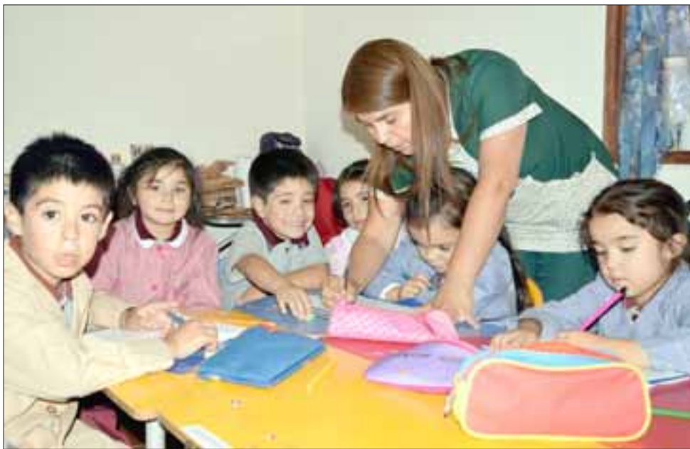
PREKINDER.- Aquí tenemos a los más pequeñitos de esta comunidad escolar, los niños de prebásica no pierden el tiempo.