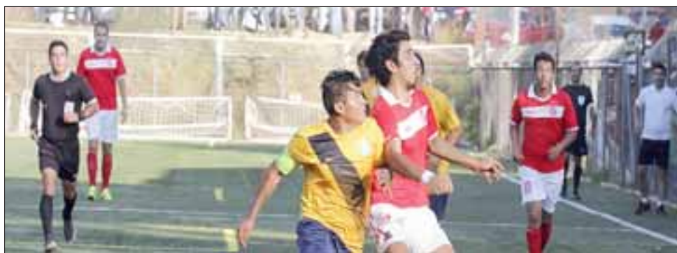
Unión Delicias fue eliminado después de protagonizar una ajustada llave con San Francisco de Valparaíso.

Colinas, Minas Melón, Bandera de Chile, Granadillas, Cóndor, José Fernán-