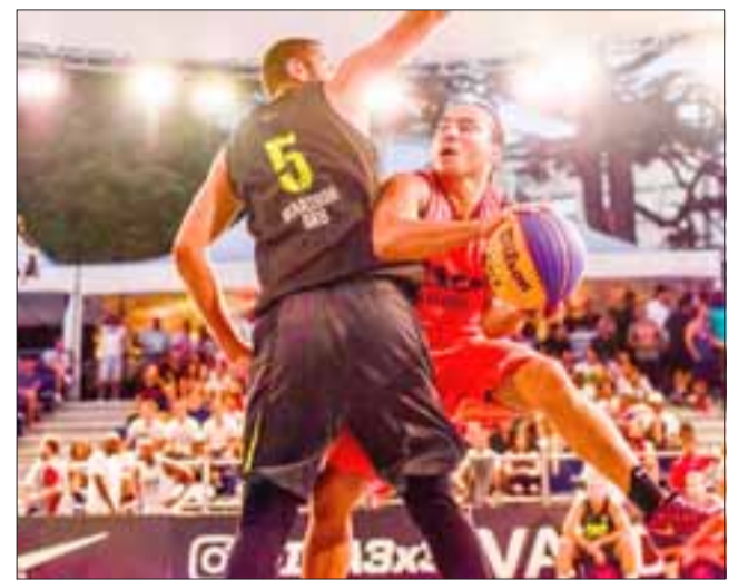
ENTRADA LIBERADA.- Este torneo se desarrollará el sábado 8 de abril en el Club San Felipe desde las 10:00 hasta las 22:00 horas. (Referencial)

Esta modalidad de básquetbol se juega con un solo tablero, es en una cancha más pequeña y en equipos con tres jugadores. El básquetbol 3x3 tiene su origen en las calles, donde la falta de espacio crea esta nueva