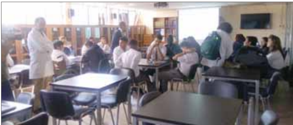
Actualmente el SII de San Felipe se encuentra desarrollando capacitaciones a los estudiantes de 3° y 4° medio de las carreras técnicas de administración y contabilidad del Liceo Politécnico Dr. Roberto Humeres de San Felipe, que participarán de la Operación Renta 2017.