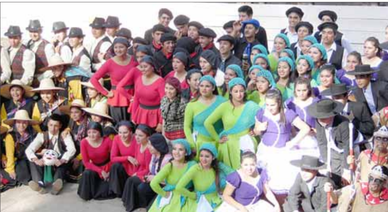
FUERZA CABROS.- Unos 20 colegios SNA Educa se darán cita el 12 y 13 de abril en Duao, para intentar quitarles a nuestros chicos sanfelipeños el título de Campeones Nacionales que ostentan.