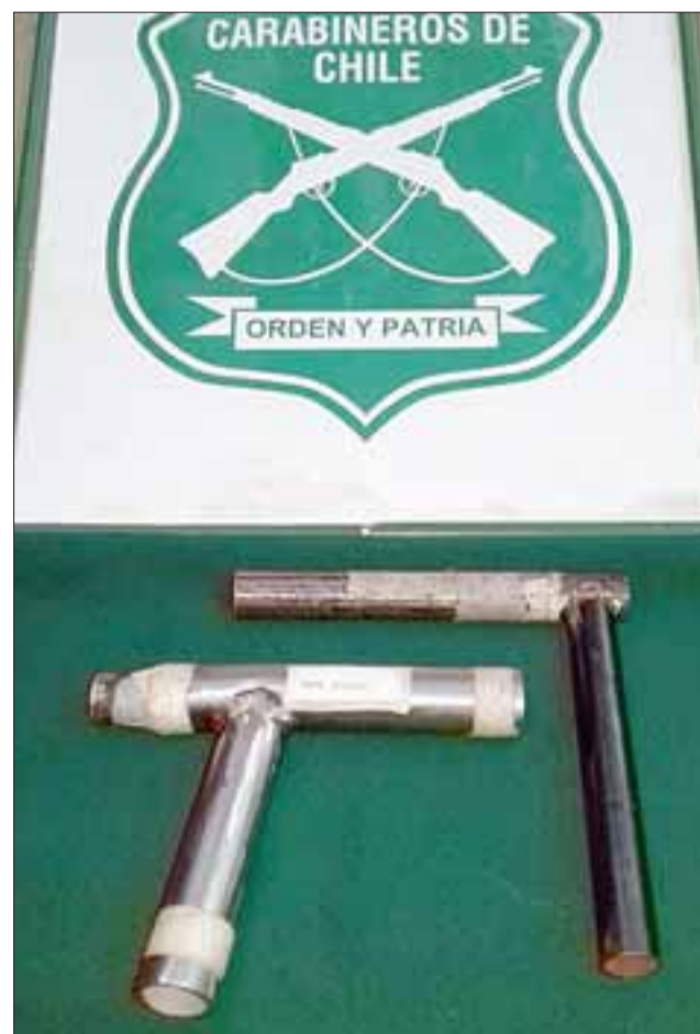
Carabineros de Llay Llay detuvo al imputado por los delitos de desacato y porte de arma hechiza.