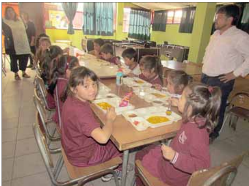
Más de un centenar de alumnos del Colegio Bucalemu comenzaron a recibir las raciones diarias de desayunos, almuerzos y colaciones como parte del PAE 2017, garantizando la ingesta de alimentos saludables entre estudiantes de educación prebásica y básica en la Provincia de San Felipe.

“Hemos tenido un muy buen inicio (del PAE), con algunas pequeñas cosas que son propias de un inicio de programas. Pero como ustedes pudieron ver, los niños comen muy bien su alimentación: ésta corresponde a lo mismo que uno puede darles en sus casas, es una alimentación muy balanceada, que tiene postre, guiso, ensalada y agua. Estamos en una acción que se llama programa ‘Contrapeso’ y dentro de este programa hay algunas cosas que estamos haciendo que tienen que ver con alimen-