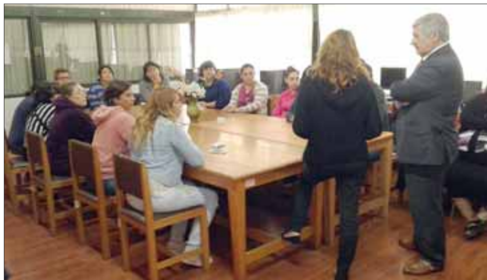
Los apoderados en reunión con el Director de la Daem y la Dirección del establecimiento.

Almuerzos / colación Buffetes 997924526 984795518