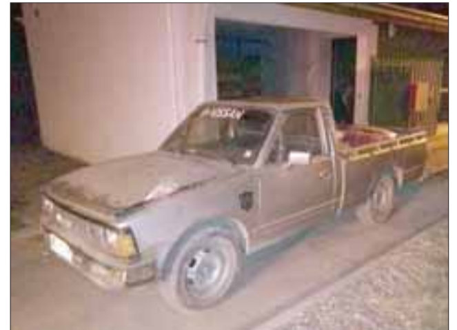
Antisociales fueron sorprendidos in fraganti cuando cargaban los sacos con frutos secos en una camioneta.

En uno de los robos los maleantes sustrajeron 1.900 kilos de pasas valuadas en más de un millón de pesos.