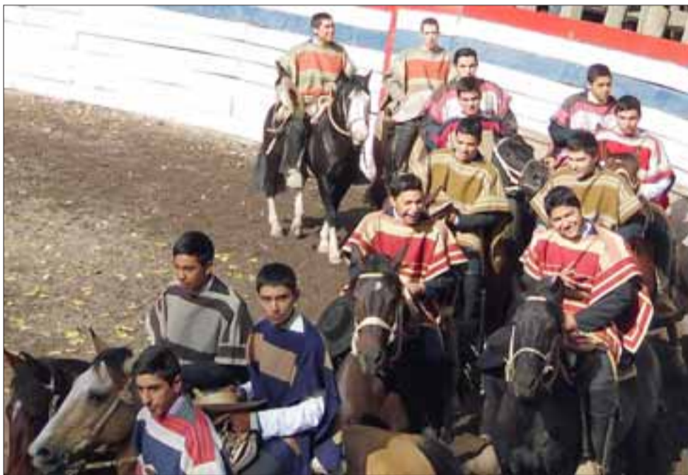
COLLERAS INDUSTRIALINAS.- Ellos son la delegación que en 2016 nos representó y que este año regresan a Duao para hacerse respetar con sus colleras.