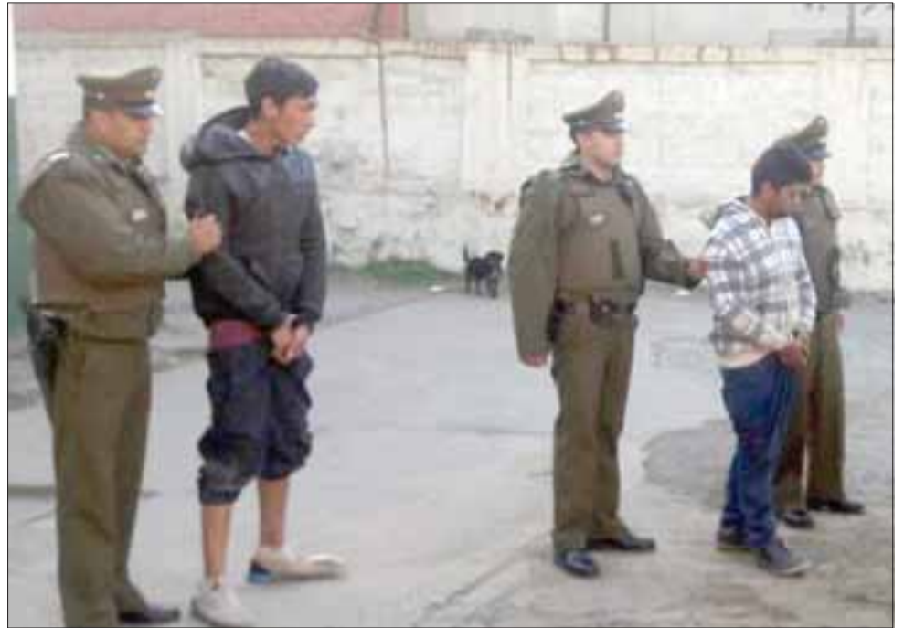
Los asaltantes fueron capturados por Carabineros de la Tenencia de Catemu la madrugada de ayer martes, tras el reconocimiento de la víctima que resultó con lesiones leves.

Los imputados fueron individualizados con las iniciales P.A.R.G. de 31 años de edad y G.A.J.B. de 19 años de edad, ambos sin antecedentes delictuales, quienes fueron derivados hasta el Juzgado de Garan-