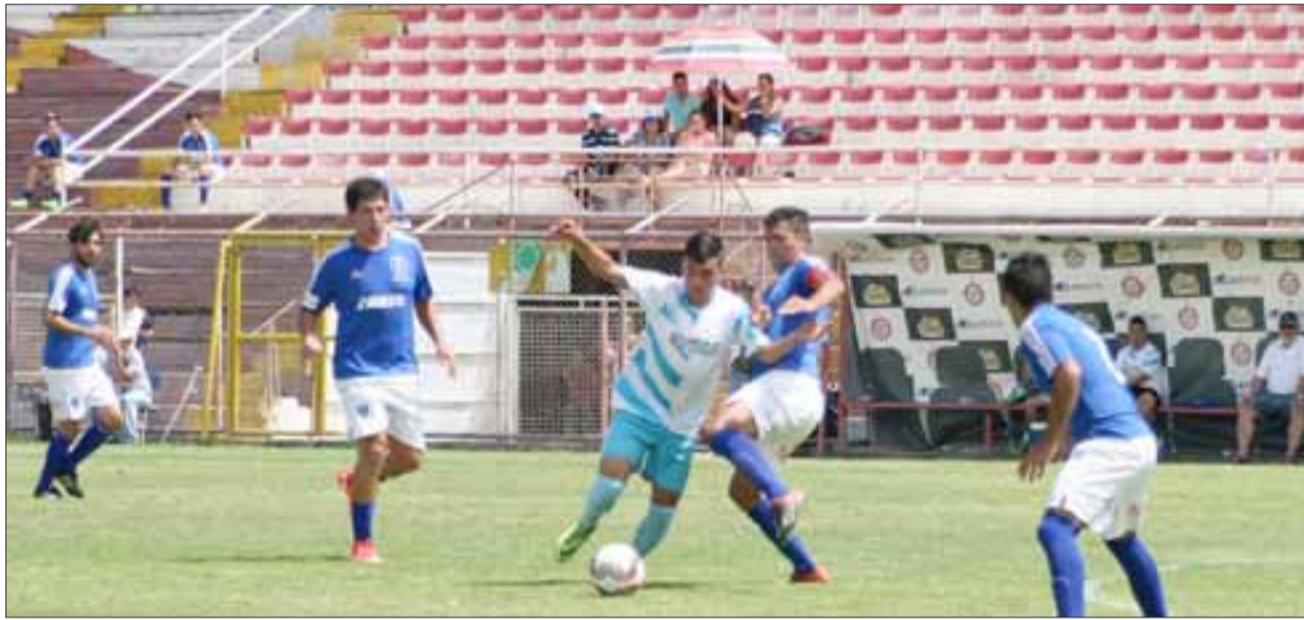
En el estadio Municipal se jugará el partido de ida de la llave de octavos de final entre Juventud La Troya y Almendral Alto

Respecto a la revancha en la cual Almendral Alto (milita en Santa María) será local, también se jugará en dicho estadio, así lo hizo saber el timonel de Arfa Quinta Región, Cristian Ibaceta.