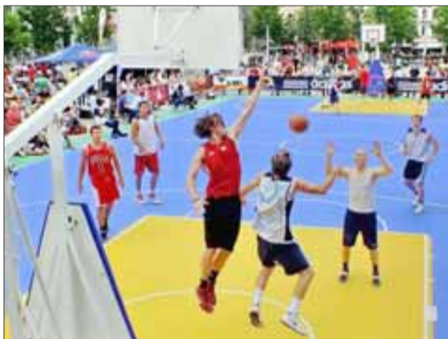
Este campeonato tiene varias categorías, entre ellas Adulto Masculino U15 y U18, en Femenino todas las que quieran participar. (Referencial)