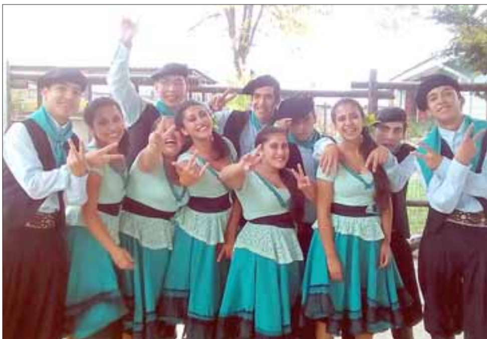
CAMPEONES NACIONALES.- Ellos son los actuales campeones nacionales en Folklore, del campeonato general que SNA desarrolla cada año en Duao.