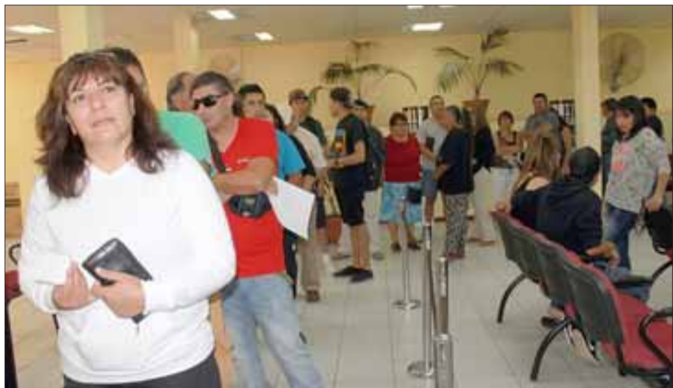
LARGAS FILAS. - Así lucen las filas en el Municipio en los últimos tres días, como siempre a los chilenos nos cuesta acudir a pagar los permisos de circulación a tiempo.

- Lo que pasa es que legalmente no podemos como Municipio dar ningún tipo de prórroga de manera autónoma, puesto que este procedimiento es ley de La República, pero podemos decir que nosotros vamos a seguir atendiendo con la misma intensidad en los cuatro puntos de ventas que