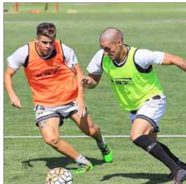
Las determinaciones de la ANFP de validar los puntos de esta temporada con la próxima, hacen urgente que el Uní se imponga mañana a La Serena.