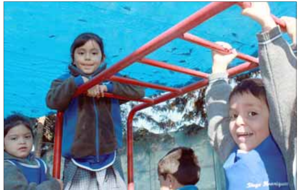
MÁS LIMPIO. - Los pequeñitos están ahora protegidos de las hojas, sol y viento que les impactaba directamente en su piel.