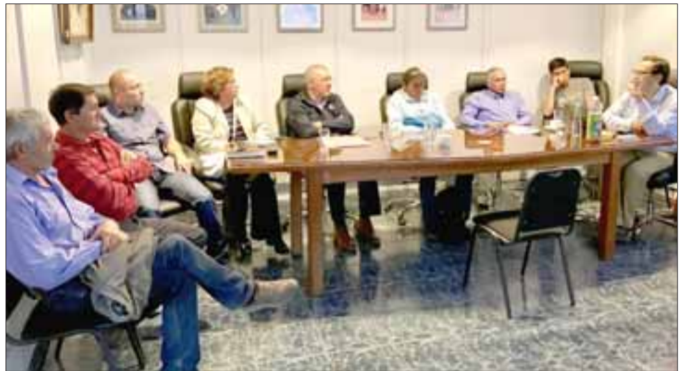
Este miércoles se realizó la reunión del Concejo Municipal con los arrieros, donde se estableció una propuesta de ruta para exigir el acceso a los ríos.

El oficio que preparó el municipio invoca el artículo 13 de la Ley 1.933 “Normas Sobre Adquisición, Administración y Disposición de Bienes del Estado”. Uno de los requisitos para la aplicación de dicha Ley es proponer un trazado que, justamente, se trabajó en esta reunión con el alcalde, los concejales y la Agrupación de Arrieros, actores relevantes por su importante conocimiento de la zona cordillerana y las activida-