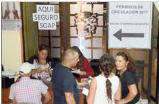
TODO PARA EL FINAL. - La venta de los SOAP se dispararon en las últimas horas en todos los puestos donde se venden, muestra indiscutible de la cultura del chileno.