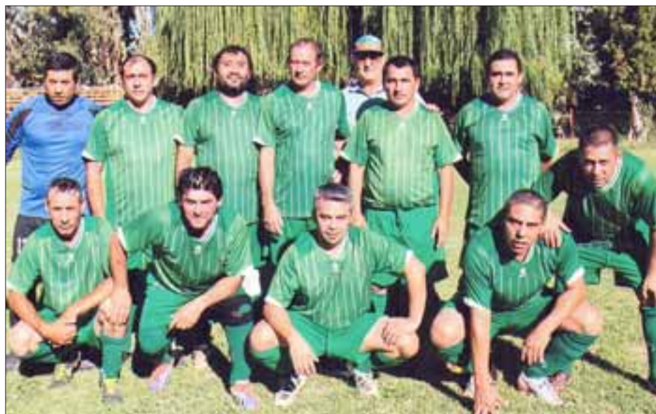
Serie Sénior de El Asiento.

El Asiento en la actualidad participa en el torneo 'Selim Amar Pozo por Amor a la Camiseta' y su asociación de origen es la de Putaendo, donde destaca por su buena organización y espíritu deportivo.