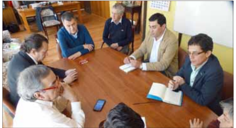
El Gobernador Eduardo León y representantes de varias cooperativas, se reunieron en la gobernación con el Presidente de la Confederación General de Cooperativas de Chile, Horacio Azócar Bustamante, quien se mostró bastante optimista.