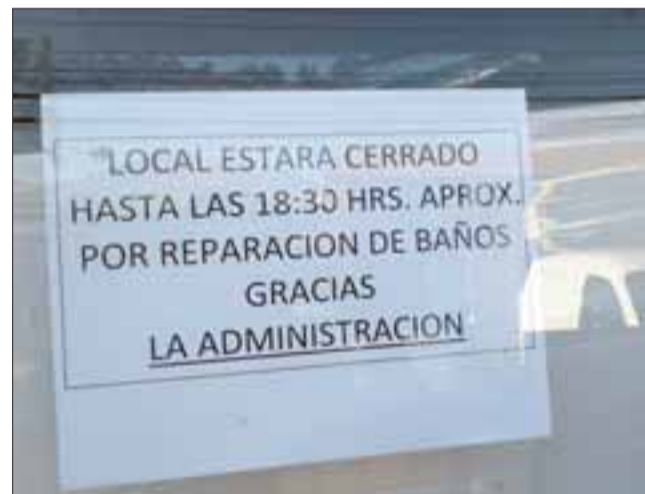
El Supermercado Mayorista 10 cerró ayer sus puertas mientras se reparan los servicios higiénicos del personal.

Los alimentos y mercadería del establecimiento se encontraban en buenas condiciones.