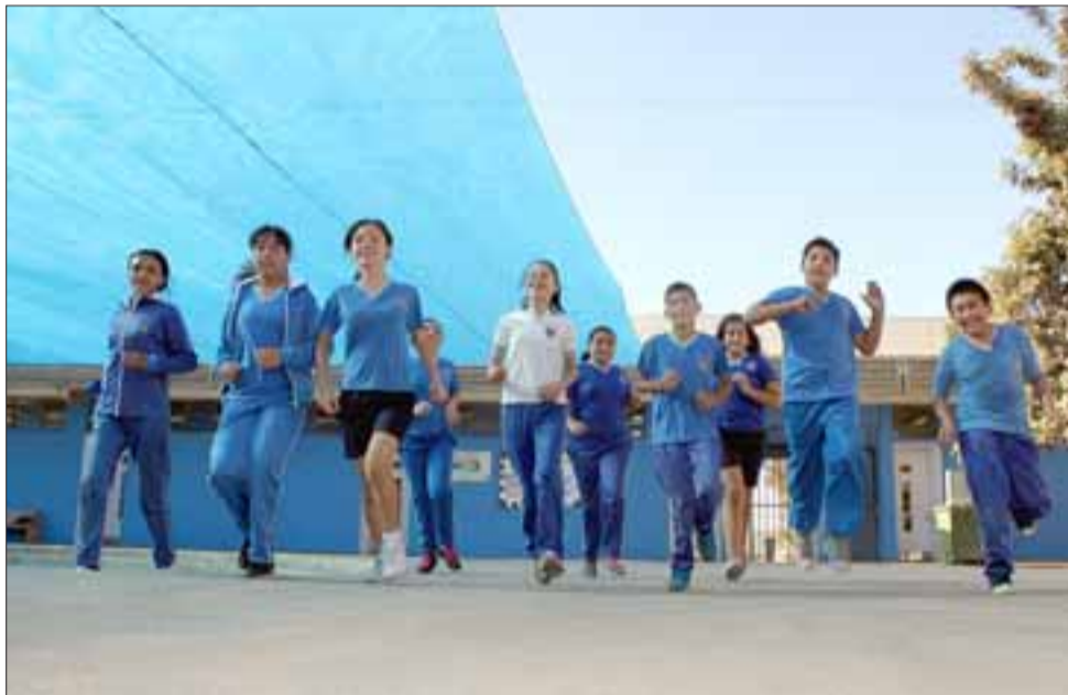
MALLA PROTECTORA. - Ahora los escolares de esta escuela municipalizada aprovechan sus clases de educación física activamente bajo una protectora y refrescante malla raschel.