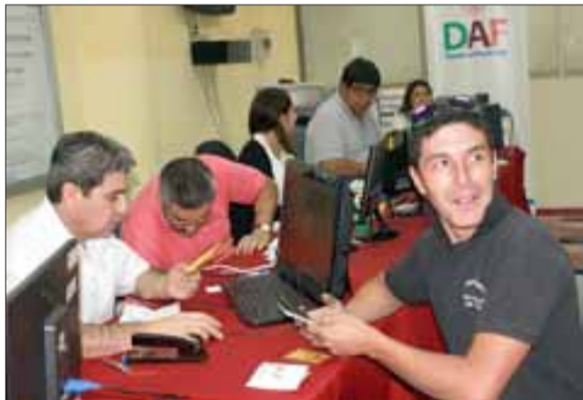
HOY VENCE PLAZO. - Miles de sanfelipeños dejaron para último momento los pagos relacionados con sus vehículos.