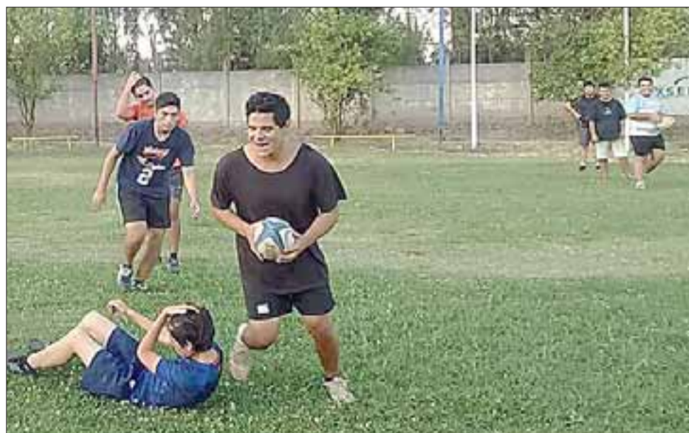
El equipo sanfelipeño se está preparando para intervenir en un torneo Metropolitano.

- «Que se acerquen todos los martes y jueves a la cancha Exser para que conozcan el rugby y veamos la posibilidad que puedan integrarse y jugar. Necesitamos niños, mujeres, porque formaremos equipos femeninos y de menores, entonces necesitamos el apoyo del público, la empresa privada y toda la prensa deportiva».