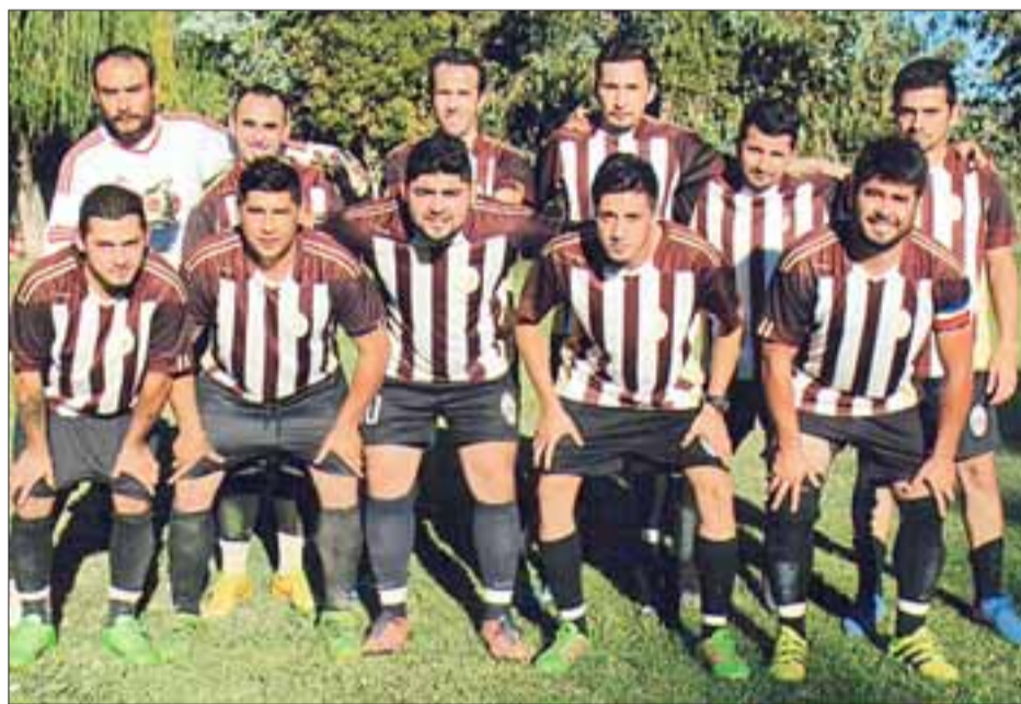
Serie de Honor de El Asiento.