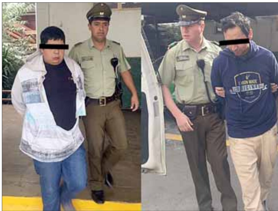
Carabineros logró capturar a dos de los cuatro sujetos que habrían cometido el delito a primeras horas de este sábado en Avenida Yungay de San Felipe. Los imputados ya formalizados deberán permanecer reclusos las 24 horas en sus domicilios.

en que la víctima se encontraría durmiendo al interior del vehículo, cuando repentinamente un desconocido golpeó uno de los vidrios si-