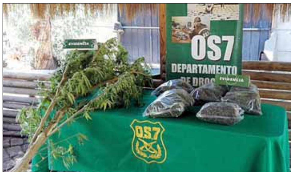
Efectivos de OS7 de Carabineros incautaron más de tres kilos de marihuana elaborada y una planta de cannabis sativa al mediodía de este viernes en Catemu.

orden de entrada y registro judicial para concretar un allanamiento al domicilio del imputado.