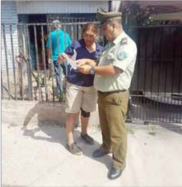
Con la entrega de volantes informativos, Carabineros aconseja a los vecinos a evitar el robo en viviendas.

La idea es que cada dueño o dueña de casa tome conciencia ser parte de la seguridad de la vivienda poniendo en práctica algunos sencillos consejos: Cuando reciban visita no