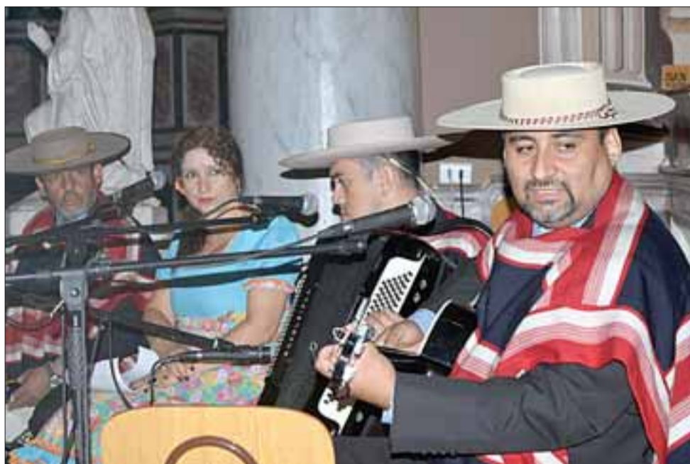
LOS ROBLERINOS. - Ellos son Los Roblerinos, de Linares, folcloristas que animaron la Misa a la Chilena, desarrollada al mediodía de ayer domingo.

la fiesta musical, jornada animada por Los cuequeros de Putaendo, Teocalán y Los Wayras de Los Andes y Santa Feria. Misa a la Chile-