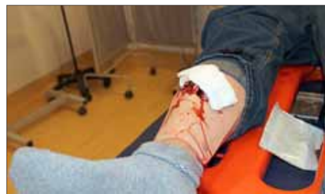
Las jornadas de capacitación se desarrollaron en el Centro de Simulación Clínica de la Facultad de Medicina en San Felipe.

Cerca de 40 profesionales de la salud, de servicios