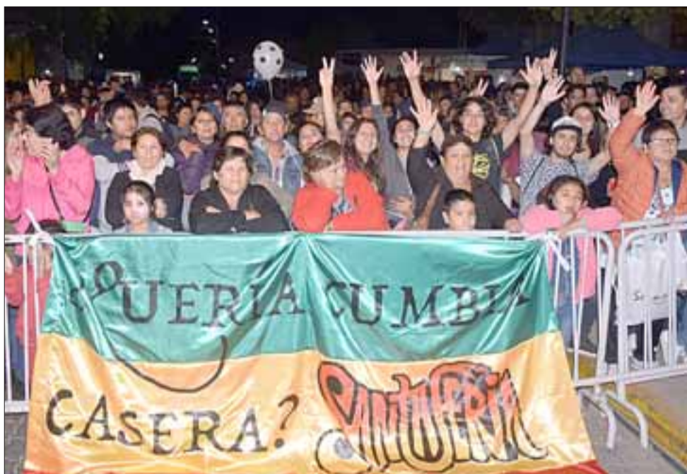
SANTA FERIA. - Santa Feria atrajo también a sus fans, algunos llegaron con enormes banderas para aplaudir a sus ídolos.