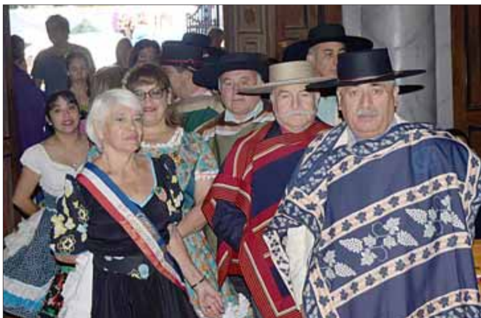
SIEMPRE LA CUECA. - Mi Tierra querida, agrupación folclórica sanfelipeña a cargo de los bailes en esta Misa.