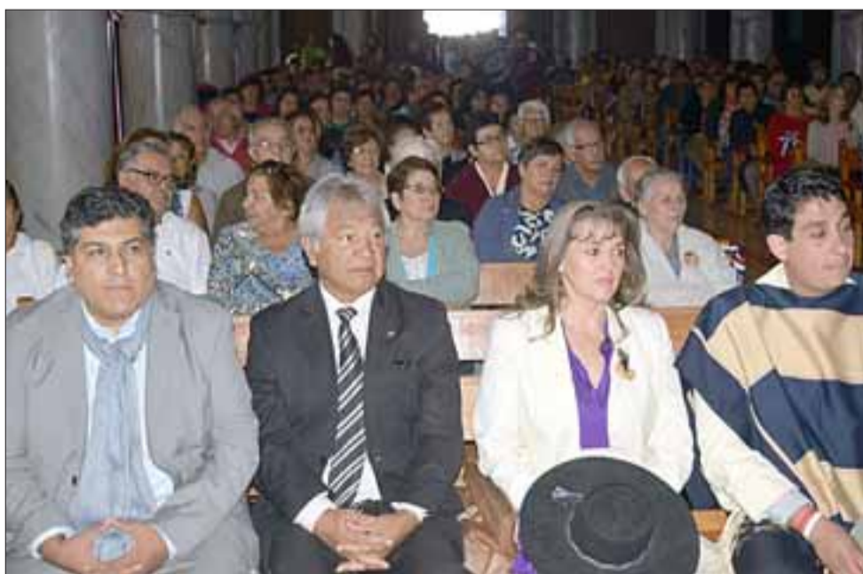
AUTORIDADES. - Autoridades provinciales y regionales participaron solemnemente de esta tradicional Misa a la Chilena.