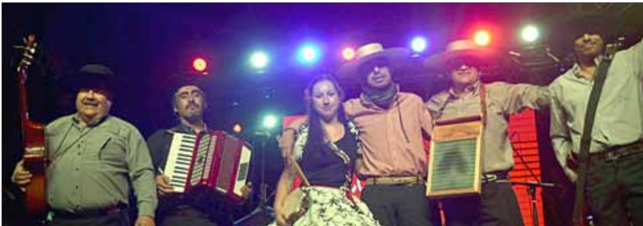
EXCELENCIA.- Los Cuequeros de Putaendo alegraron la jornada, dieron el Vamos oficial y la locura se desató en El Almendral.