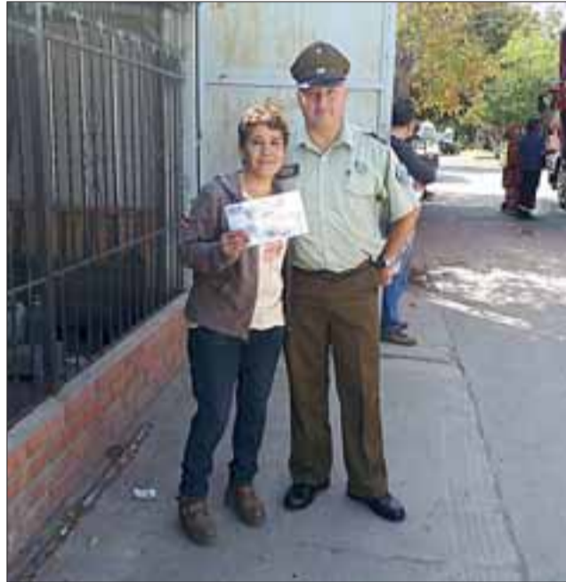
Ante cualquier sospecha de robo se debe dar aviso a Carabineros al 133 ó al teléfono del cuadrante de su localidad.