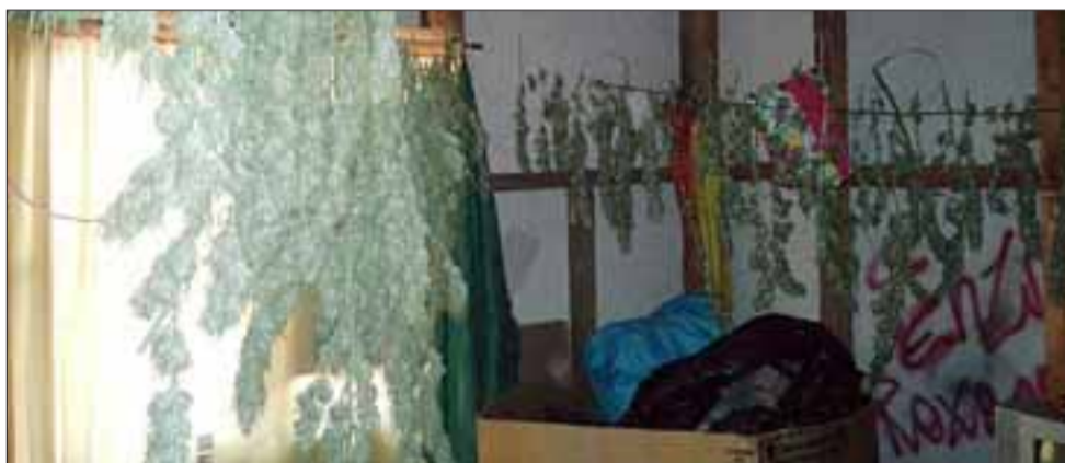
El imputado mantenía la marihuana en proceso de secado al interior de su domicilio en el sector Las Compuertas de Catemu.

se originaron tras denuncias de vecinos de esa localidad que informaban la comercialización de drogas, coordinándose a través de la Fiscalía de San Felipe una