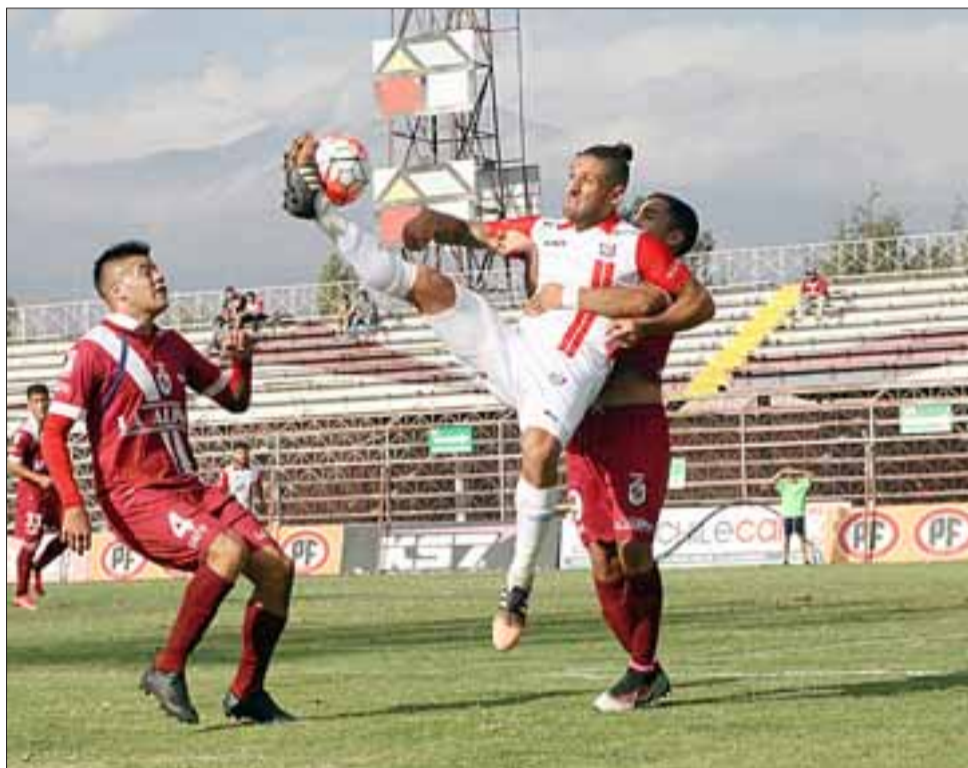
La falta de elaboración se tradujo que los delanteros sanfelipeños debieron luchar en desventaja ante los defensores rivales.