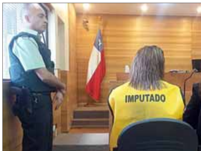
La mujer pasó a control de detención en el Tribunal de Garantía de Los Andes, en donde fue requerida en procedimiento simplificado por el delito de Hurto simple frustrado.