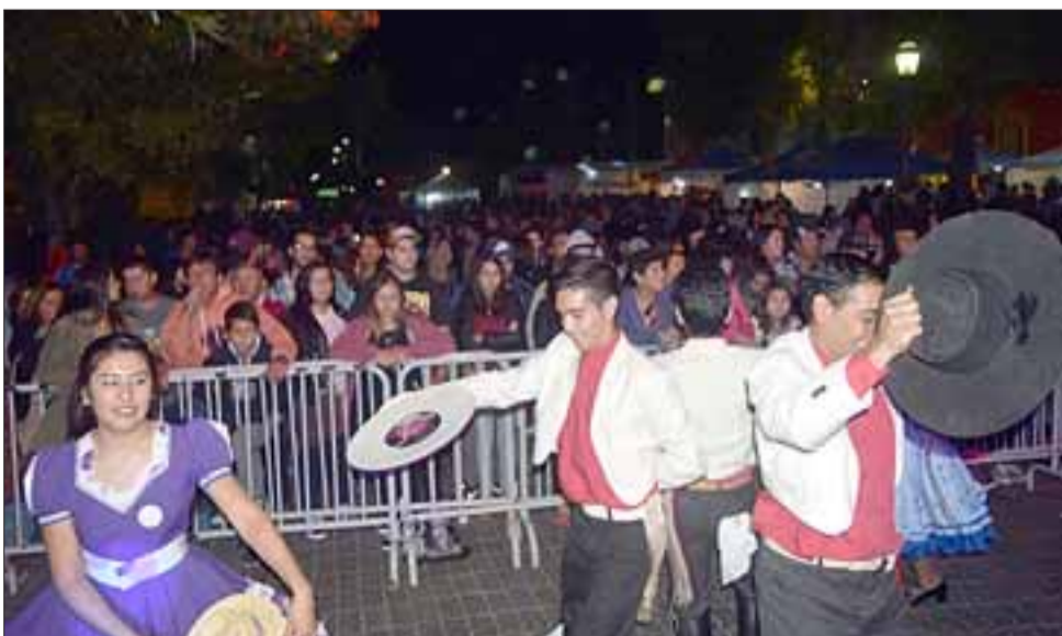
SIEMPRE TEOCALÁN.- Los artistas de Teocalán hicieron de las suyas frente al gran público presente. Gracia y excelencia fue lo ofrecido.