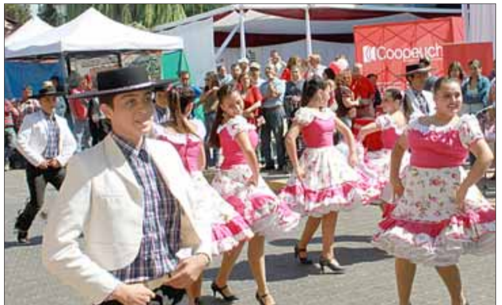
NUESTRO BALLE.- El Ballet Municipal de San Felipe lució sus mejores galas en este esquinazo ofrecido a los presentes.