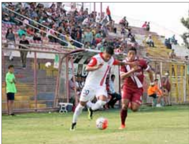
El Uní una vez más decepciono en casa al igualar con Deportes La Serena.