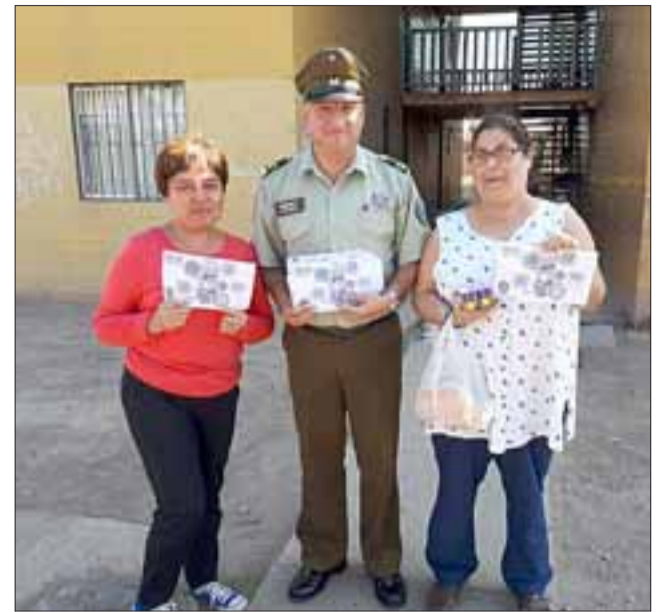
Personal de la Oficina de Integración Comunitaria de Carabineros en terreno junto a los vecinos.

demorar en la bienvenida y despedida en la puerta. Cuando llegues a tu casa, hágalo con las llaves en la mano para no perder tiempo.