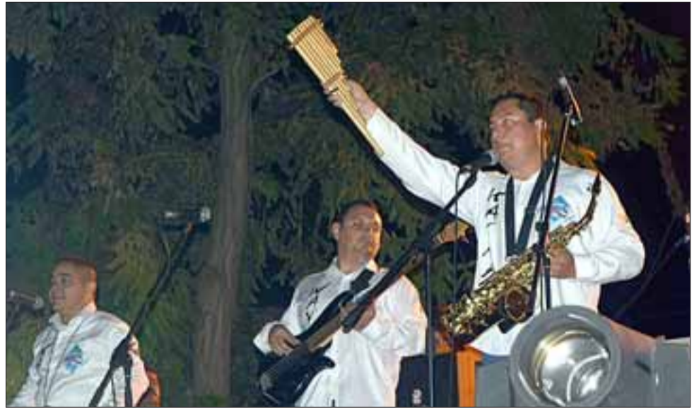
Así lució Los Wuayras durante su aplaudida presentación en esta Fiesta de la Vendimia 2017.