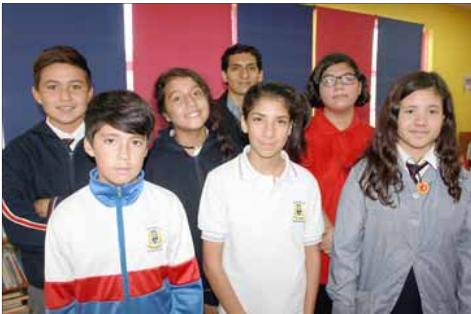
LAS ELECCIONES. - Fueron más de 110 estudiantes los que emitieron su voto secreto, para elegir así a su Directorio Escolar 2017.