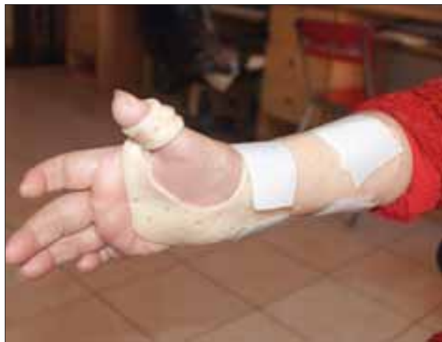
Doña Sara necesita esta tablilla, pues sólo con esta férula podrá recuperar poco a poco la movilidad de su mano.