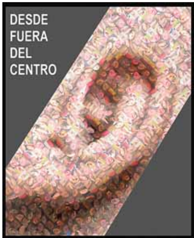
Este es la imagen visual del proyecto 'Desde fuera del Centro'.

(Desde Fuera del Centro I y II) se encuentran disponibles en Youtube.