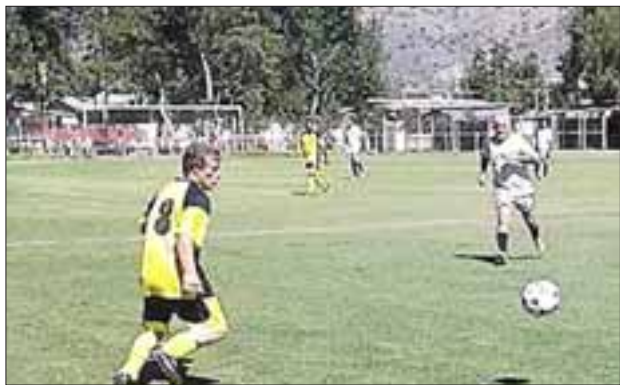
En el nuevo campeonato de la Liga Vecinal se han jugado tres fechas.

Tsunami 1 – Pedro Aguirre Cerda 0; Santos 2 – Villa Argelia 0; Barcelona 2 – Hernán Pérez Quijanes 0; Andacollo 3 – Unión Esfuerzo 1; Carlos Barrera 2 – Villa Los Álamos 1; Los Amigos 4 – Unión Esperanza 0; Aconcagua 7 – Resto del Mundo 0.