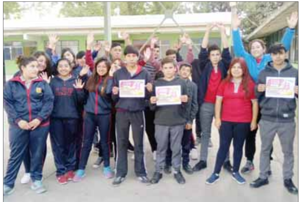
Los alumnos del Liceo San Felipe estarán participando hoy de la primera corrida familiar exclusiva de esa comunidad educativa.

“Por ser esta la primera vez que hacemos una actividad, nos enfocamos en la integración y la familia, queremos que vengan los abuelos, los papás, las mamás, los tíos y eso buscamos, que nos acompañen a