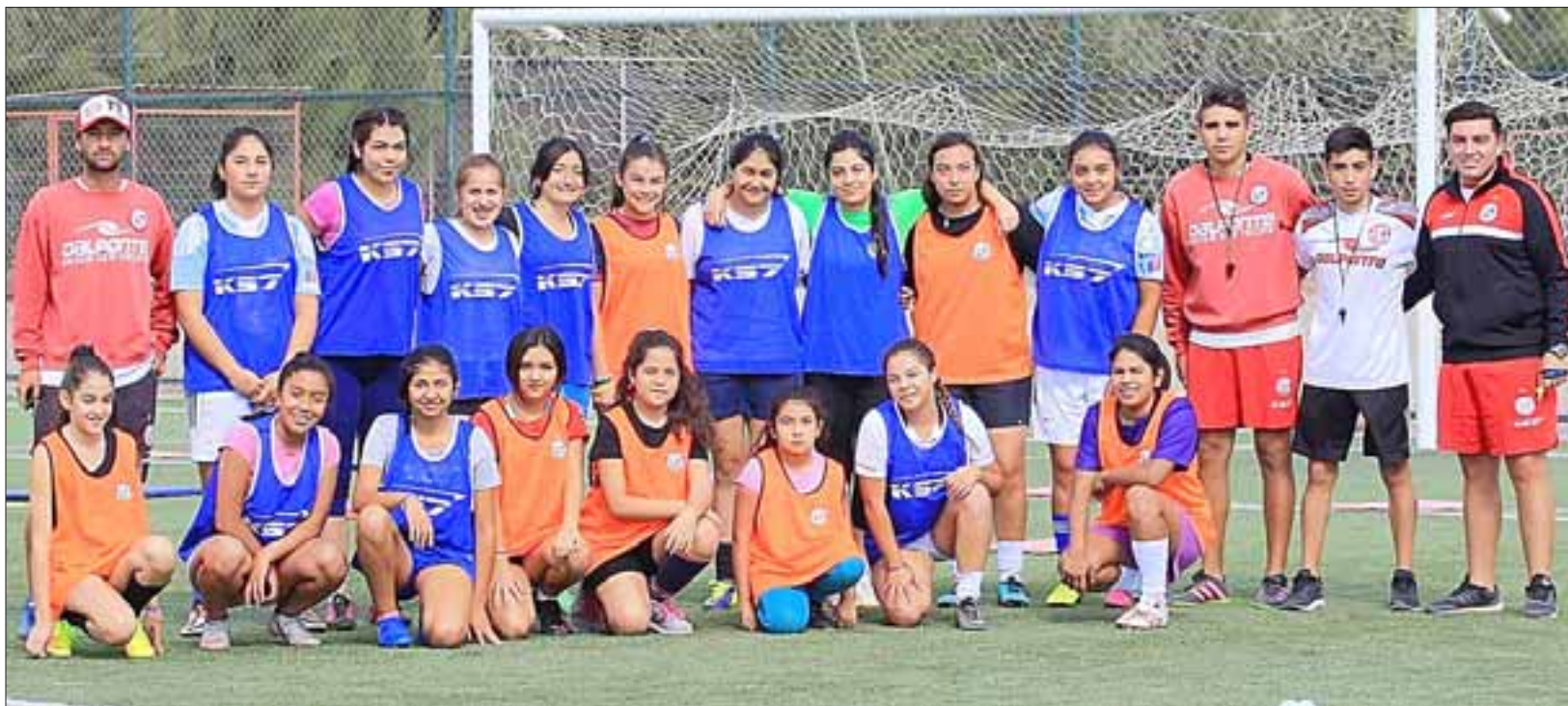
Entusiastas niñas de distintas edades llegaron al primer entrenamiento de la Escuela de Fútbol femenino de Unión San Felipe.

Los entrenamientos se realizarán durante las