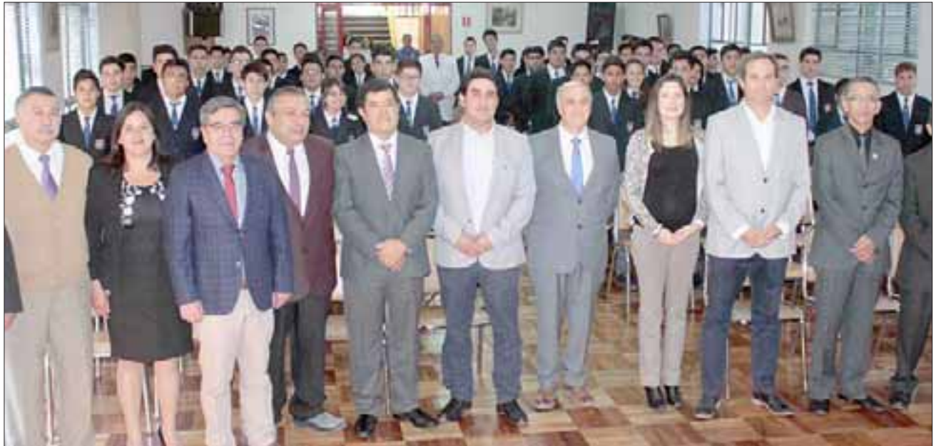
Más de 500 estudiantes de las carreras técnico-profesionales de la Escuela Industrial Guillermo Richard Cuevas son favorecidos gracias a este convenio de cooperación con Codelco Andina.

El convenio contempla la realización de una charla mensual por parte de profesionales voluntarios de Andina en ámbitos operacionales, de sustentabilidad, seguridad y recursos humanos; pasantías para doce alumnos con los mejores desempeños académicos, visitas al Centro Integrado de Operaciones y Simuladores; jornadas para profesores en las operaciones de la empresa; y la entrega de dos