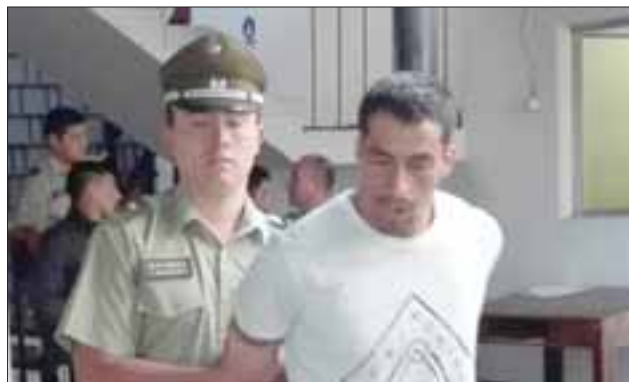
El imputado fue detenido por Carabineros en la Villa Santa Teresita de San Felipe.