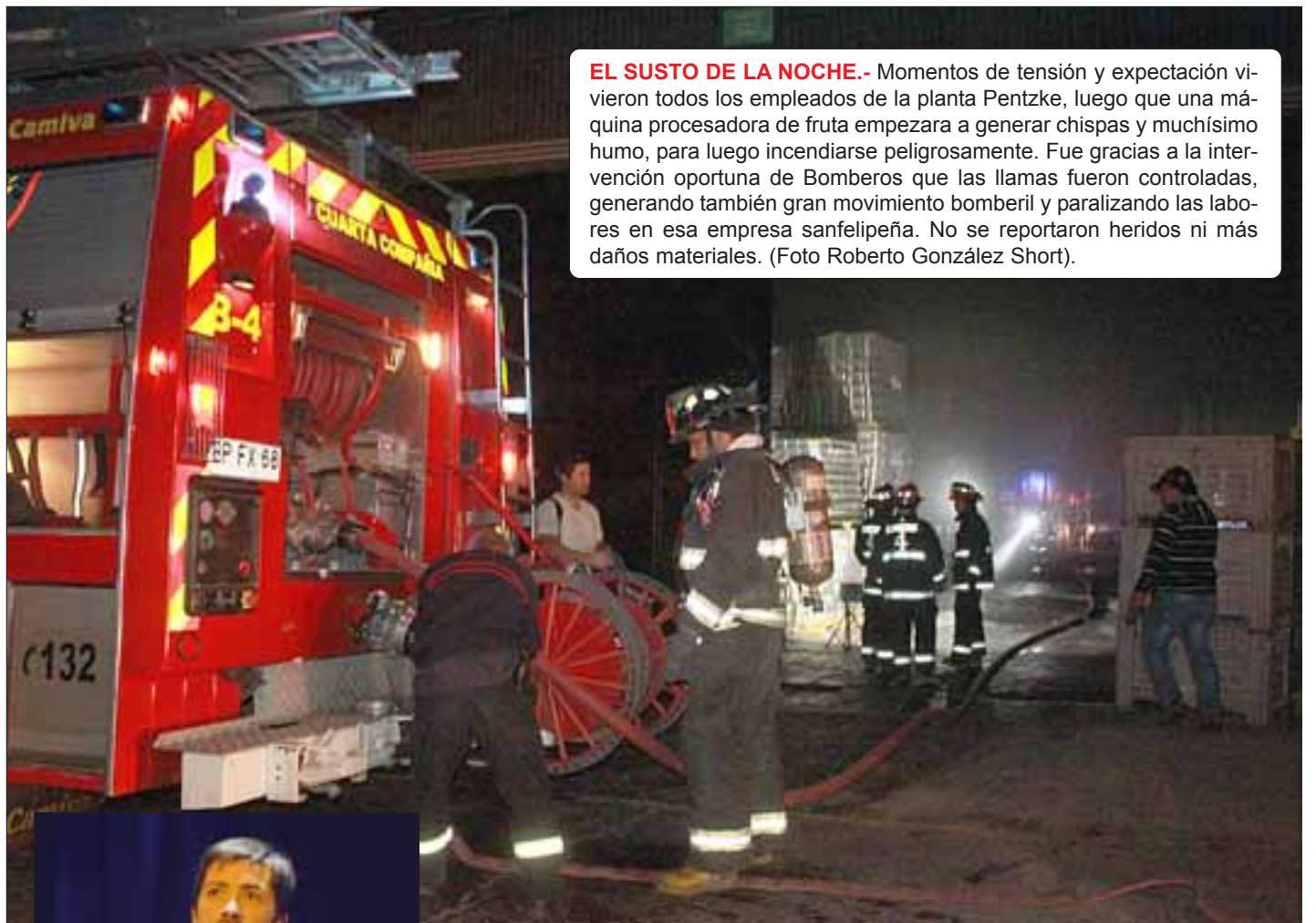
EL SUSTO DE LA NOCHE. - Momentos de tensión y expectación vivieron todos los empleados de la planta Pentzke, luego que una máquina procesadora de fruta empezara a generar chispas y muchísimo humo, para luego incendiarse peligrosamente. Fue gracias a la intervención oportuna de Bomberos que las llamas fueron controladas, generando también gran movimiento bomberil y paralizando las labores en esa empresa sanfelipeña. No se reportaron heridos ni más daños materiales.