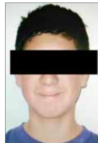
El joven de 20 años de edad, Cristian S.L. , se le imputan los delitos de violación de menor de 12 años y estupro.