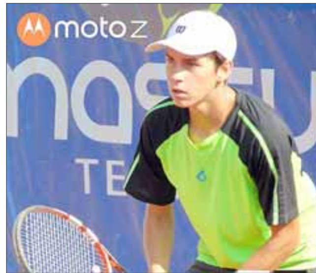
El tenista sanfelipeño irá Turquía con la misión de sumar sus primeros puntos ATP.

El futuro viaje del aconcagüino no ha estado exento de contratiempos debido a que a su familia le ha costado mucho poder financiar esta gira, la que si bien es cierto ya está asegurada al tener los pasajes comprados, aún resta allegar más dinero para los gastos de