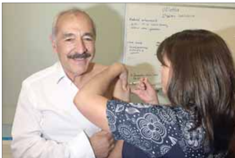
Alcalde de San Felipe Patricio Freire, acudió al vacunatorio del Cesfam Segismundo Iturra a vacunarse contra la Influenza

Según Venegas, “la tendencia a nivel nacional de los grupos objetivos con más baja cobertura, son los adultos mayores y los niños de 6 meses a 5 años”, sien-