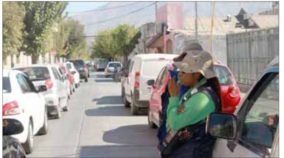
Hoy martes debieran aprobarse las nuevas bases para la licitación de parquímetros en San Felipe.