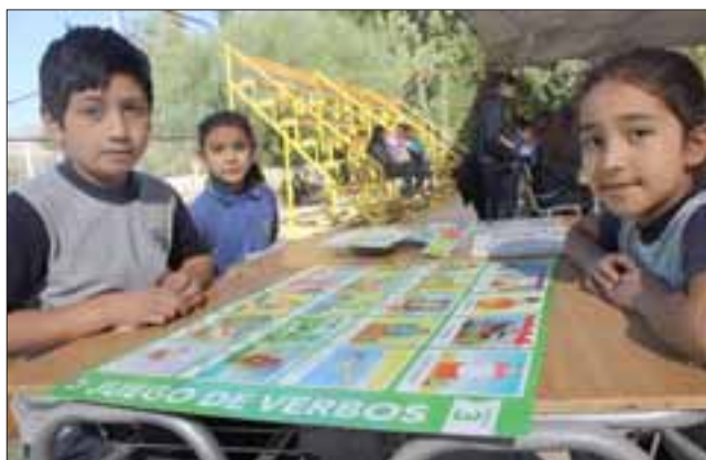
‘Aprender Haciendo’ está arrojando positivos resultados en las escuelas rurales, aseguraron desde la Daem San Felipe.