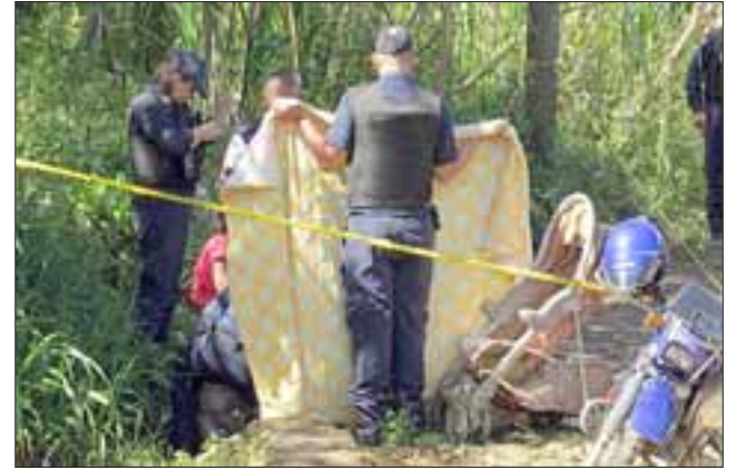
Pese a celeridad con que familiares lo rescataron y trasladaron al hospital, no fue posible salvarle la vida. (Foto referencial).

También se realizaron otras diligencias en el lugar donde ocurrió el accidente para establecer la dinámica de los hechos.