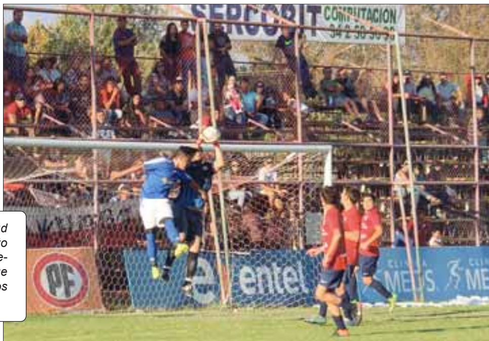
Los sanfelipeños Juventud La Troya y Almendral Alto protagonizaron una entretenida llave clasificatoria que se inclinó hacia el lado de los almendralinos.

Almendral Alto, Las Bandurrias, El Bajío (Quillota), Bandera de Chile (Viña del Mar), Cóndor (Puerta del Pacífico), Glorias Navales (Viña del Mar), Monjas (Osman Pérez Freire), San Francisco (Valparaíso).