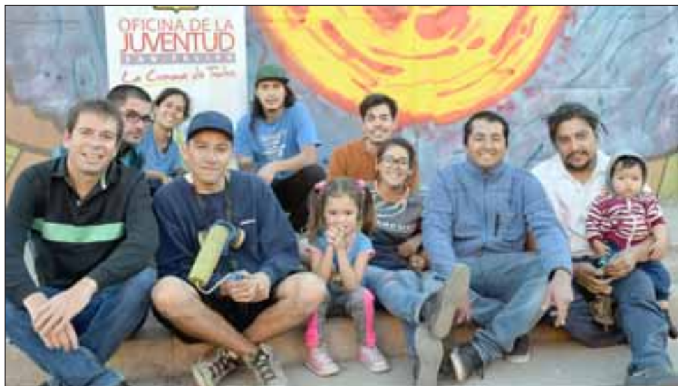
SOL PODEROSO.- Los vecinos y muralistas posaron orgullosos con este mural tan especial, el sol en todo su esplendor en Villa Sol del Inca.