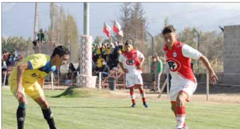
Solo una victoria pudieron cosechar las fuerzas básicas del Uní ante San Luis; las otras fueron puras derrotas.

U15: Trasandino 2 - La Calera 2 U16: Trasandino 1 - La Calera 4 U17: La Calera 4 - Trasandino 0 U19: La Calera 3 - Trasandino 2