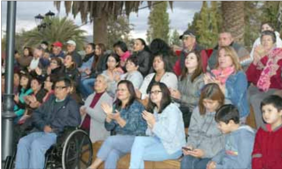
Gran cantidad de vecinos llegaron a la celebración y disfrutaron con los diversos espectáculos y actividades realizadas.

ron usar los telescopios del Observatorio Pucuro, ver muestras del taller de robótica y ver las presentaciones de los integrantes del club de adulto mayor Sagrada Familia, los alumnos de la escuela María Isabel de Brown y la banda Gato Swing. El baile y la música se tomaron el nuevo escenario, esto comenzó con el grupo de zumba de la comuna y terminó con la presentación de Dulce Locura y la Sonora Paraíso Santa María.