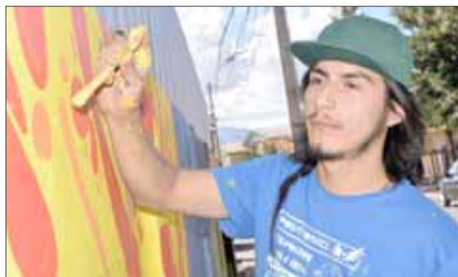
MUCHOS DETALLES.- Cada artista local se pulió bastante para desarrollar su mural para estos vecinos.