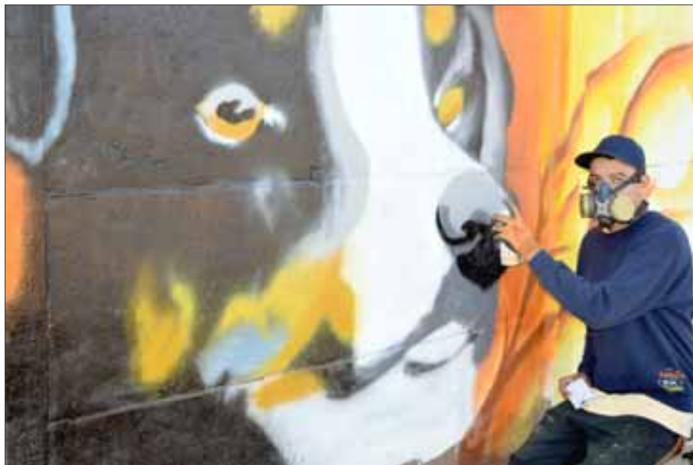
MASCOTA GIGANTE.- Este joven desarrolló este enorme mural de un amigable perro, el que ya adorna las paredes de Villa Sol del Inca.