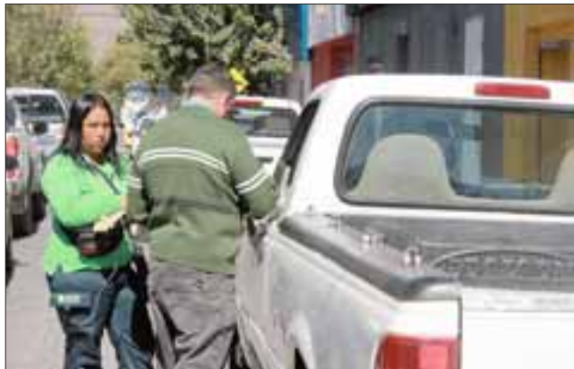
Un total de 400 calzos serán cambiados, ya que si bien se eliminan de algunas calles como Prat, Merced, Salinas, Coimas, Santo Domingo, Freire, Traslaviña y Portus, se incorporarán otros tanto donde hoy no se cobra.

Con la modificación a las bases, la nueva propuesta permite que cualquier empresa pueda postular. El concejal fue enfático en señalar que él no era partidario de tener parquímetros hasta fin de año, por la intervención de calles que se ha hecho en San Felipe, lo que ha generado que la gente esté muy tensa con toda esta situación; “esa es mi posición, y segundo en ese periodo implementar un sistema de cobro directo por parte de la municipalidad, porque se puede hacer, no hay que formar corporaciones; la municipalidad aquí ofrece un servicio, la municipalidad contrata cuando no puede hacer esa función, por ejemplo transporte de agua, luz eléctrica, pero esto está dentro del municipio, es colocar la gente adecuada y hacer un sistema de cobro adecuado para la comunidad”, sostuvo Beals.