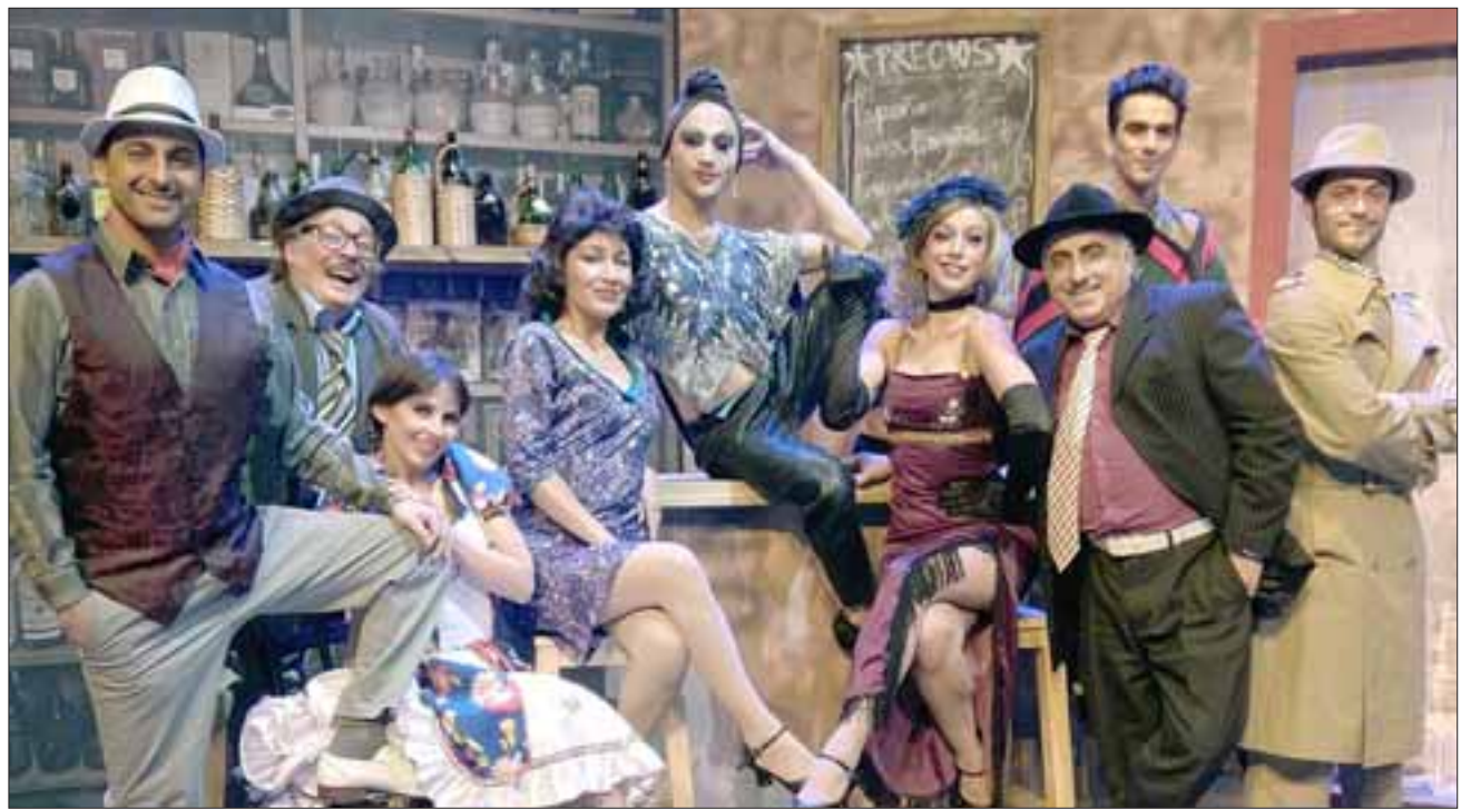
SÓLO CON ENTRADA.- Aquí tenemos a este elenco de talentosos del teatro nacional. Para asistir nuestros lectores deben llamar al 34 2334002 para solicitar un cupo.