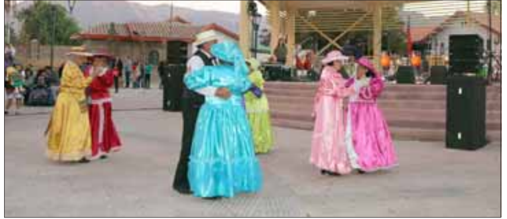
Nada menos que dos jornadas de celebración tuvo la inauguración de la remozada plaza de Calle Larga.