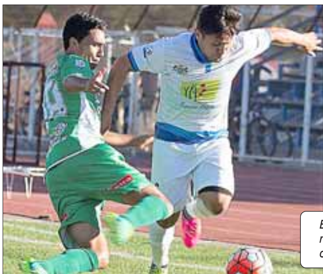
El equipo de Los Andes fue derrotado 2 a 1 por Deportes Colchagua.