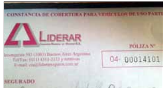
La empresa 'Liderar' no tiene oficinas ni representantes en Chile, pues el talonario de pólizas que se vendieron en nuestro país había sido robado en Argentina.