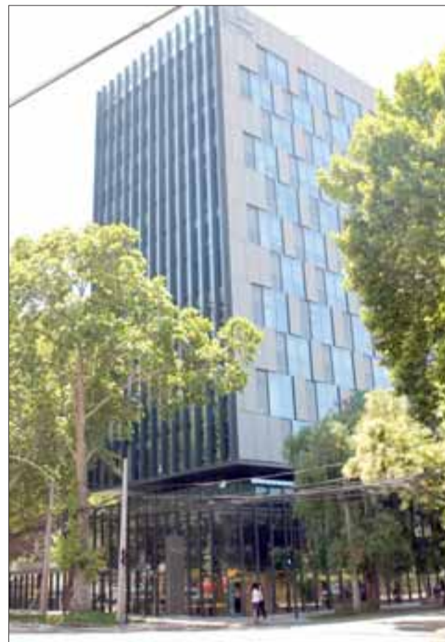
El nuevo edificio corporativo de Caja Los Andes fue recientemente inaugurado el pasado 29 de marzo y está ubicado en Santiago.