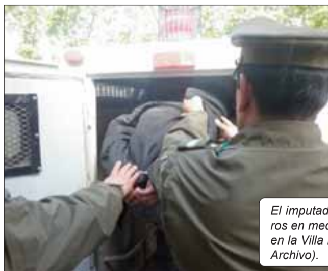
El imputado fue detenido por Carabineros en medio de un patrullaje preventivo en la Villa Renacer de San Felipe.

Tras un patrullaje preventivo efectuado por Carabineros en la Villa Renacer de San Felipe, un sujeto de 31 años de edad fue detenido por el delito de porte de un cuchillo que mantenía oculto entre sus vestimentas en horas de la madrugada.