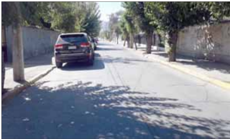
Este es una de las calles donde se comenzará a cobrar, Traslaviña entre Avenida Chacabuco y Carlos Condell.

Con esta aprobación la Municipalidad de San Felipe está en condiciones de licitar, quedando al arbitrio de las empresas el llegar a un valor razonable por cada minuto usado, ya que si prospera la tarifa de $20, el valor hora subirá a $1.200, muy por sobre los setecientos y fracción que se cancela hoy.