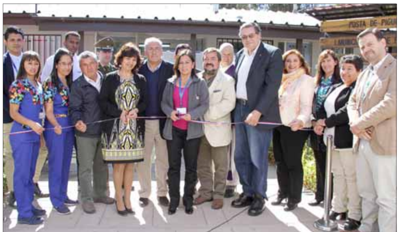
Autoridades presentes en el tradicional corte de cinta que dio por inaugurada la remozada posta rural de Piguchén.

En el detalle, la posta de Piguchén tuvo cambio de cubierta, pisos, pintura exterior e interior, instalación de veredas perimetrales, normalización del sistema de alcantarillado, y mejoramiento del sistema eléctri-