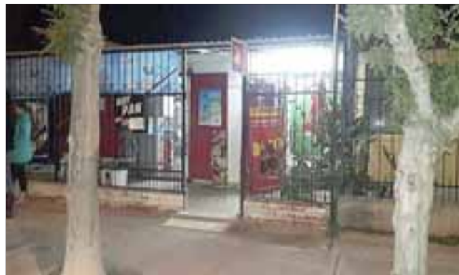
El almacén Maranatha se ubica en la avenida Uno de la Villa Cordillera de San Felipe, lugar donde ocurrió el asalto a mano armada.