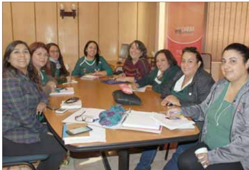
Las Directoras de los ocho jardines se reúnen periódicamente para unificar criterios e implementar las nuevas metodologías de aprendizaje.

“Es importante el trabajo que estamos haciendo, los jardines funcionan desde las 07.30 y hasta las 19.00 horas, como ocurre en Curimón; con personal especializado, con currículum integral, por lo que trabajamos con las familias a las que dic-