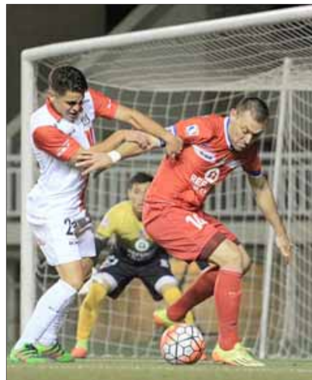
Ante Unión La Calera, los sanfelipeños desaprovecharon una ventaja de dos goles.