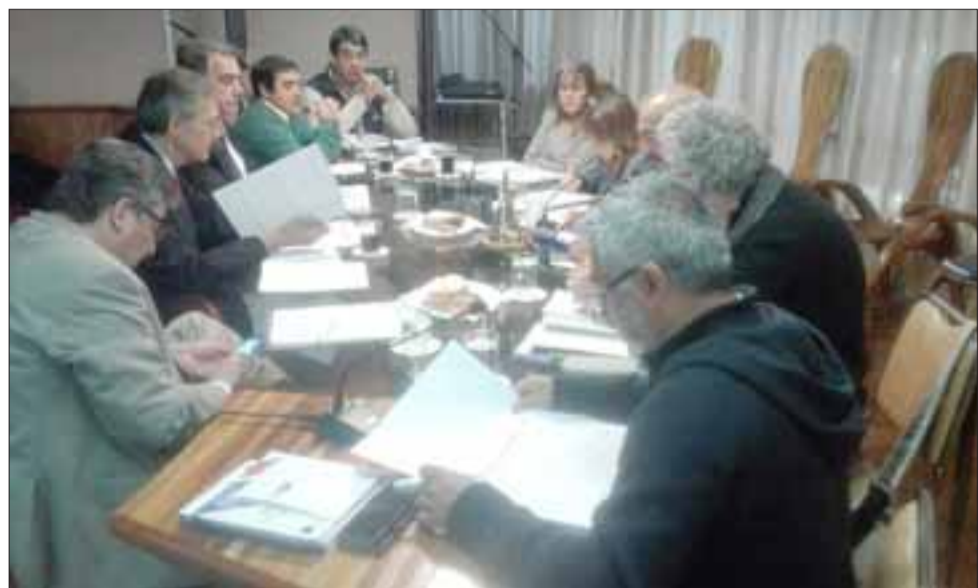
Los concejales durante la discusión de las bases desecharon la primera media hora gratis, estableciendo el cobro por minuto usado, algo que se ha visto en todo el país, solo perjudica a los usuarios, elevando considerablemente los cobros por estacionamiento.

Señaló que esas calles están señalizadas, eso las empresas que van a postular van a saber que esos calzos se van a perder: "Como no tenemos la claridad de los tiempos en que se van a perder, como esa licitación corresponde al Serviu, lo que nosotros señalamos en la licitación es que al momento de entregar, el número de calzos va a ser uno sobre 600 calzos, posteriormente se van a perder