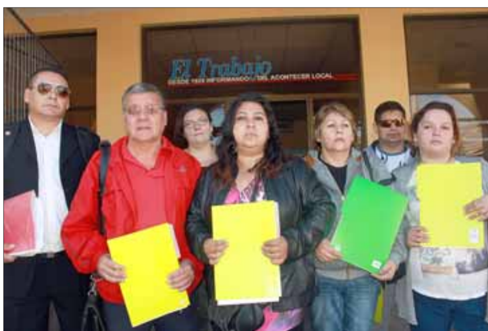
ESTAFADOS.- Más de 300 personas habrían sido engañadas por un presunto estafador, quien les ofreció jugosos salarios en una empresa fantasma de seguridad en el norte.