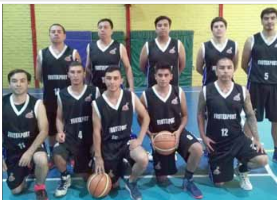
Frutexport fue el gran ganador de la jornada inaugural al imponerse contra todos los pronósticos a San Felipe Basket.