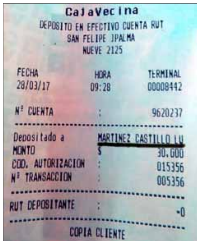
LOS DEPÓSITOS.- Fueron como $4 millones lo defraudado a estas personas, aseguran los afectados que depositaban a la cuenta Rut de Luis Martínez, sumas de 30.000 y hasta 40.000 pesos.