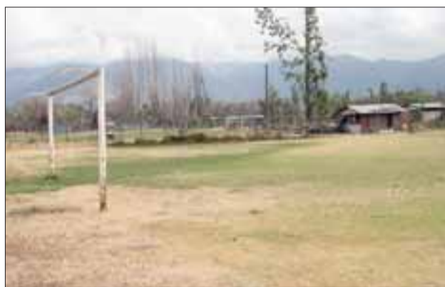
El proceso electoral de la Asociación de Fútbol Amateur de San Felipe ha estado marcado por las desavenencias.

«Es inaceptable lo que sucedió, como Arfa no aceptaremos ni permitiremos que nadie externo al balompié amateur de recomendaciones para interpretar los estatutos. Quiero ser muy claro en cuanto a que, si vuelven a llegar antecedentes sobre la intromisión de algún funcionario municipal en la elección, de manera inmediata el Comodato del 'Las Tres Canchas' que estamos gestionando a la municipalidad