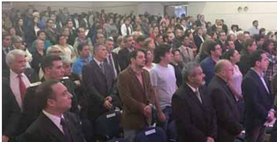
LLENO TOTAL.- La ceremonia contó con la presencia de parlamentarios, autoridades provinciales, dirigentes y vecinos de la comuna, quienes destacaron el trabajo realizado por el jefe comunal durante el año 2016.

nos de los proyectos que se ha planteado ejecutar para la comuna y señaló que continuará trabajando para que no se traslade material contaminado a la comuna, ya que el bienestar de los vecinos es su preocupación principal, lo que fue destacado por los dirigentes presentes en la ceremonia.