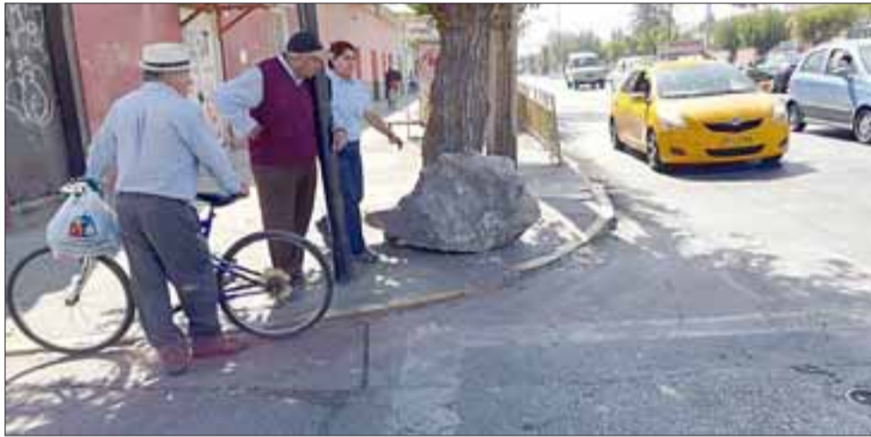
Bajo este árbol los vecinos dejaron la roca