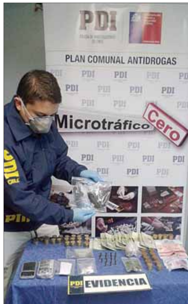
La PDI de San Felipe ejecutó el allanamiento al interior de la vivienda del imputado incautando drogas, municiones y dinero en efectivo como medios de pruebas.

El detenido fue individualizado con las iniciales G.E.V.A., quien mantiene antecedentes por delito de Tráfico y Microtráfico de drogas, además de Porte ilegal de arma de fuego, quedando a disposición de la Fiscalía tras ser formalizado por estos nuevos delitos. Pablo Salinas Saldías.