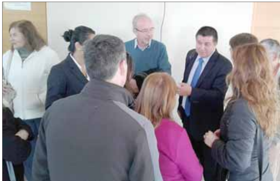
A la salida de la audiencia el abogado defensor de las familias entrega detalles del resultado de la misma a sus representados.