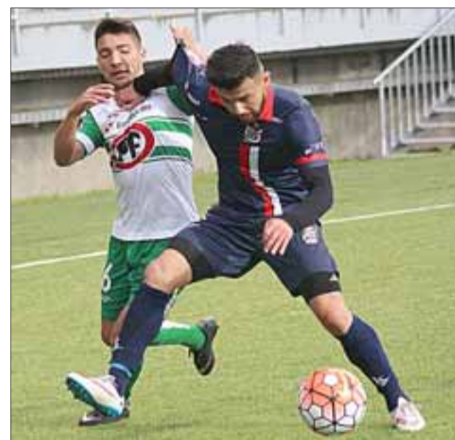
En un duelo donde confirmó que ya asume la nueva propuesta futbolística, el Uní empató a cero con Deporte Puerto Montt.