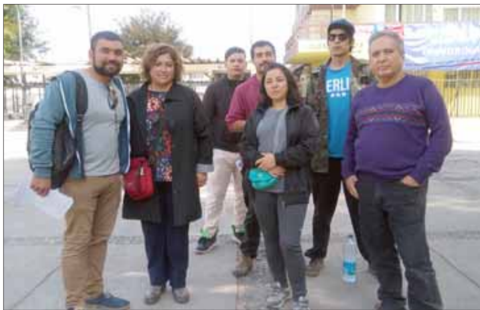
Coordinadora Putaendo Resiste, satisfecha y optimista con resolución de la SMA.