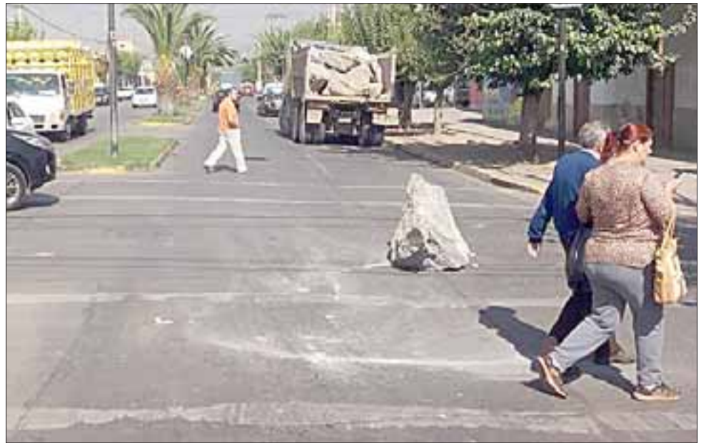
Esta fue la roca que quedó en el centro de la calzada en la intersección de Avenida Maipú con Benigno Caldera.

Testigos indicaron que el camión que transportaba este tipo de material venía por Avenida Maipú desde norte a sur, se detuvo al enfrentar una luz roja que hay llegando a Benigno Caldera y al momento de reiniciar la marcha fue cuando cayó la roca a la calzada, «la carga debe haber venido mal estibada, cortó la cadena y cayó la roca», aseguró otro