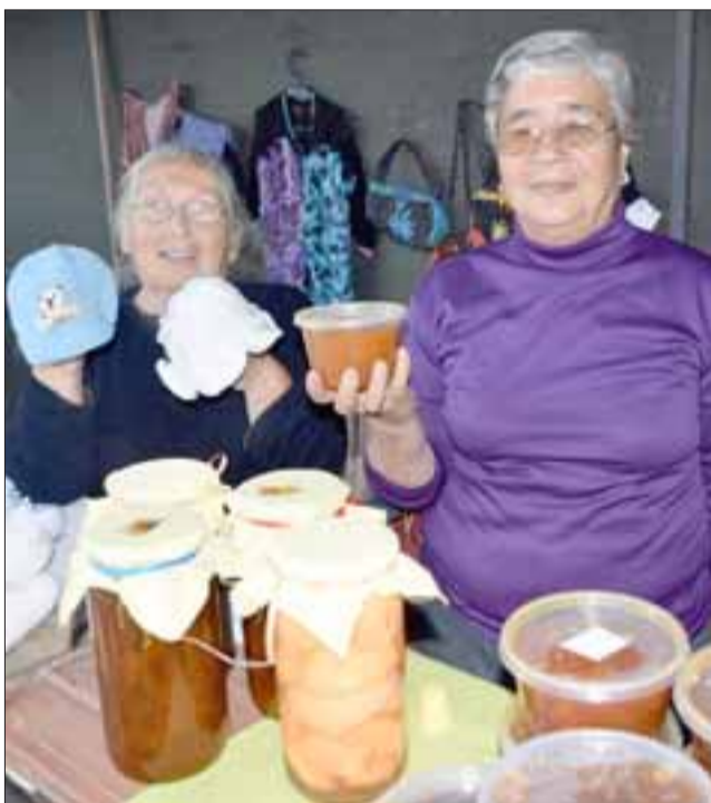
ARTESANAS DEL VALLE.- Estas dos vecinas mostraron a las cámaras de Diario El Trabajo sus mermeladas y tejidos en crochet.