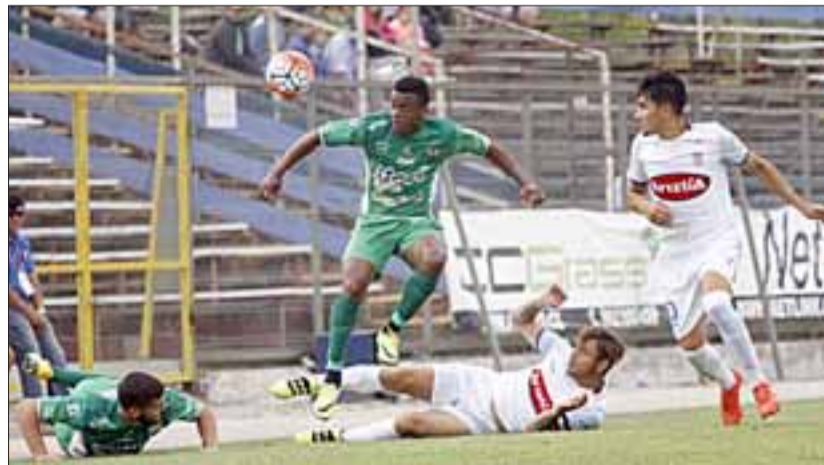
Una caída de 2 a 0 que lo compromete aún más con el descenso a Tercera A sufrió Trasandino ante Melipilla.

toda la lucha que pusieron no pudieron recuperarse, porque en el 86' Hugo Alarcón anotó el definitivo 2 a 0 con que finalizó el pleito que dejó a los andinos estancados en los 24 puntos, sintiendo cada vez más cerca la presencia y el asedio del temido 'fantasma del descenso'.