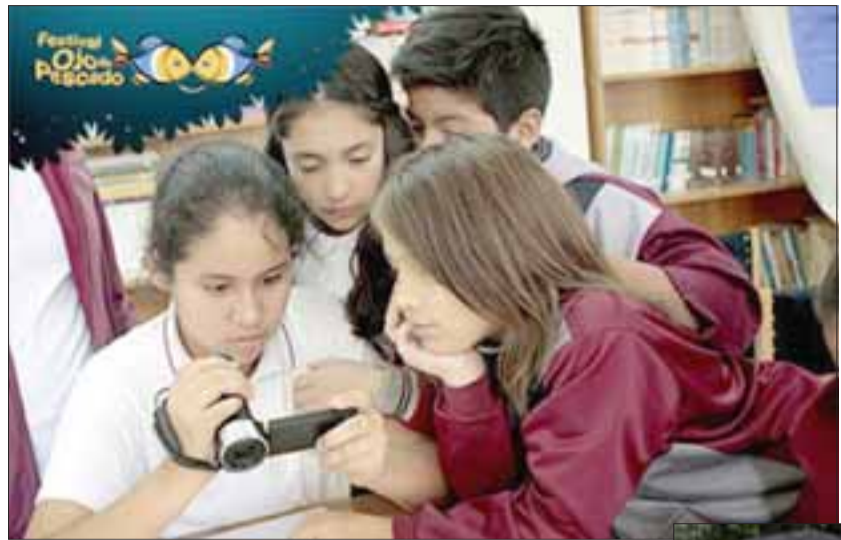
CINE PARA TODOS. - Por segundo año consecutivo se desarrollará en nuestra comuna entre el 26 de abril y el 4 de mayo, al Festival de Cine Ojo de Pescado 2017.

Además, entre el 9 y el 11 de mayo, se llevará a cabo en la Escuela John Kennedy el taller 'Creación Audiovisual en el Aula', que estará especialmente dirigido a docentes de la comuna. Este