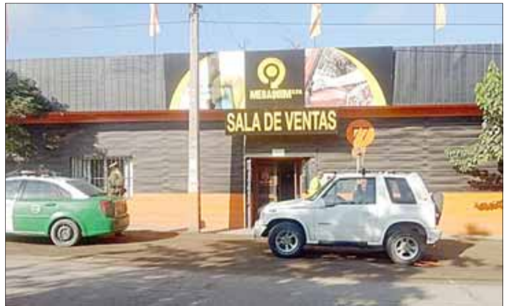
Este es el frontis de la empresa Megaquim ubicada en el sector de San Rafael.

«Ya hemos sido víctima de la delincuencia anteriormente, en 2013, ahí nos robaron más que ahora, nosotros teníamos registrados imágenes, dirección de los delincuentes que al otro