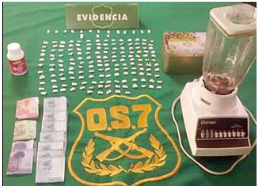
En el allanamiento a su casa la policía incautó papalinas con cocaína de alta pureza, marihuana y pasta base.

nido y puesto a disposición del Tribunal de Garantía de Los Andes, donde el fiscal lo formalizó por el delito de Tráfico de drogas en peque-