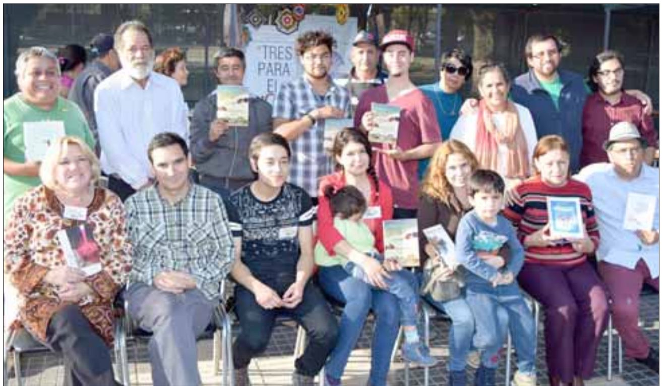
NUESTROS LITERATOS.- Aquí tenemos a la mayoría de escritores que dieron fuerza y vigor a esta cita literaria regional.