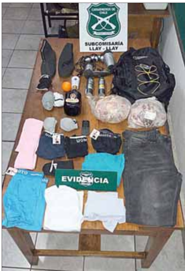
Las especies sustraídas desde el domicilio de la víctima en la comuna de Llay Llay.

Una pareja delictiva fue capturada por Carabineros de la subcomisaría de Llay Llay, luego de haber cometido un robo de diversas especies desde el interior de un domicilio que se encontraba sin sus moradores, siendo advertido por un vecino que alertó telefónicamente a la Policía del delito ocurrido alrededor de las 21:30 horas de este jueves.