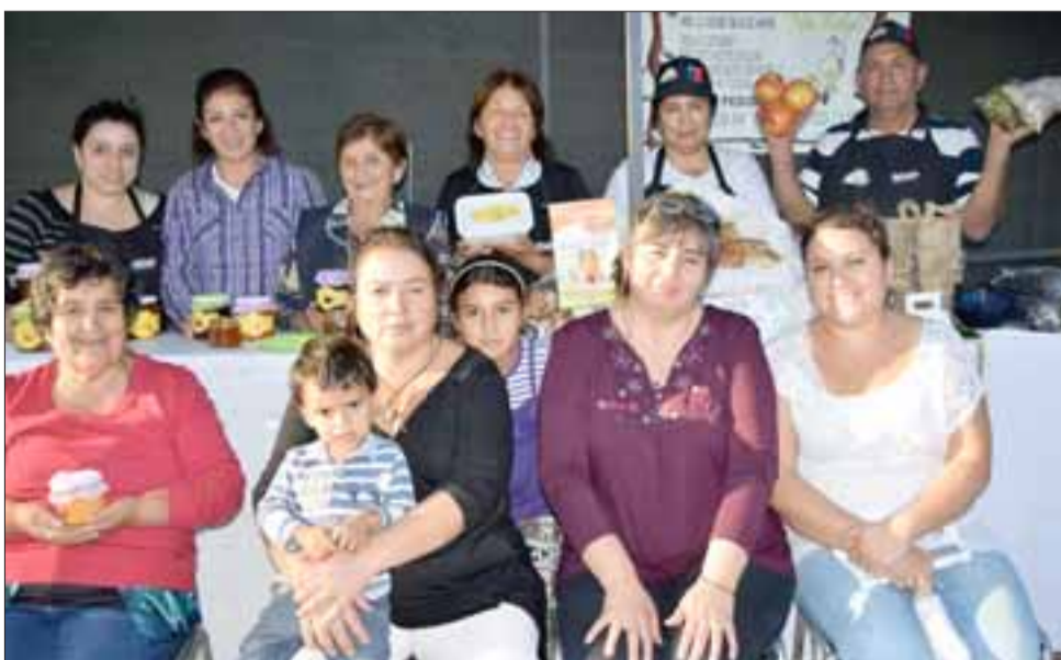
FERIANTES LOCALES.- Los feriantes artesanales de Santa María también expusieron sus productos, pan amasado, miel de abejas, conservas y hasta crochet.