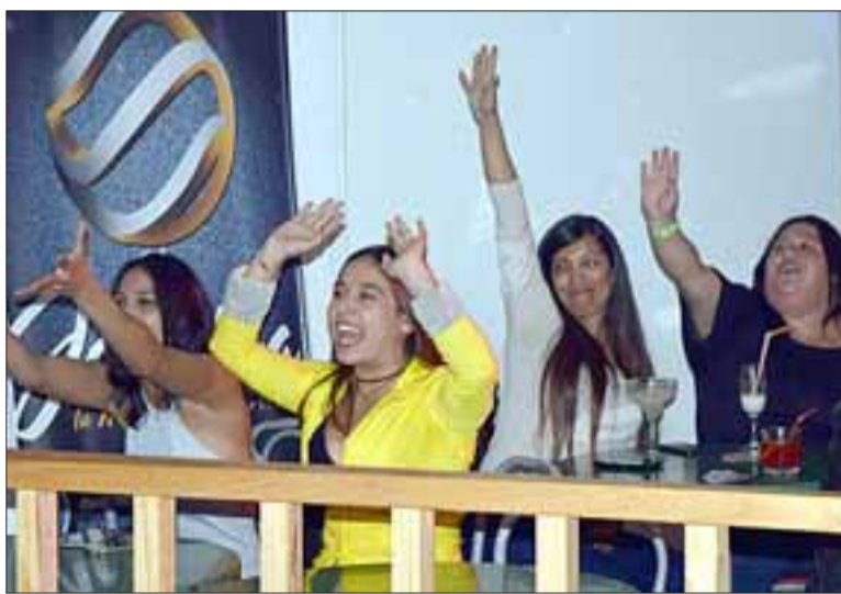
LOCURA TOTAL. - El público también enloquecía a cada momento porque querían ganar algunas de las regalías ofrecidas por estas empresas a los presentes.