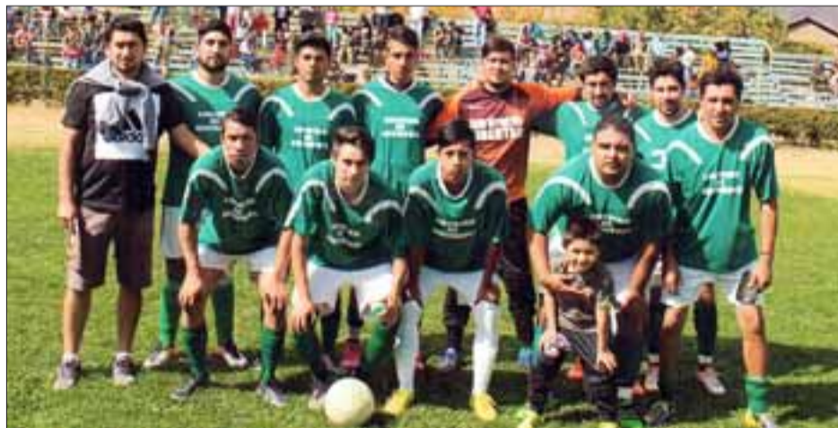
Estas son tres de las series del club Rinconada de Guzmanes que compiten en los respectivos torneos de la Asociación de Fútbol Amateur de Putaendo.