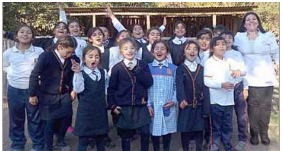
ESCOLARES FELICES. - Aquí tenemos a estos pequeñitos del Colegio Santa María de Aconcagua, de Santa María, durante una visita desarrollada este miércoles a la pequeña granja.