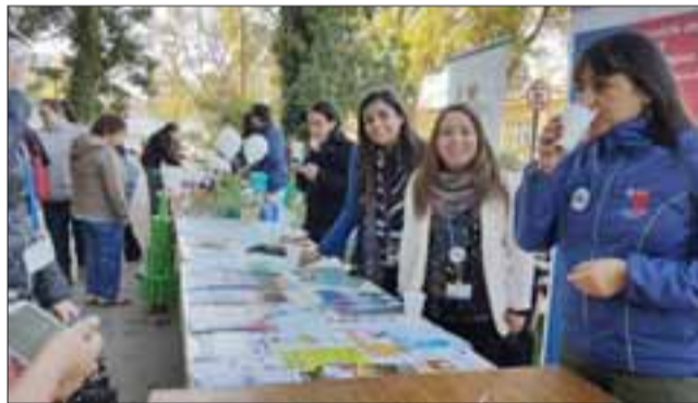
Parte de las funcionarias del Cesfam San Felipe El Real.