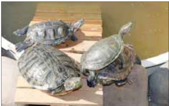
TORTUGAS AMIGABLES. - Ellas son algunas de las tortu- guitas que hay en esta Granja Santa Lía, en camino Tocor- nal 3300 (ex 618).