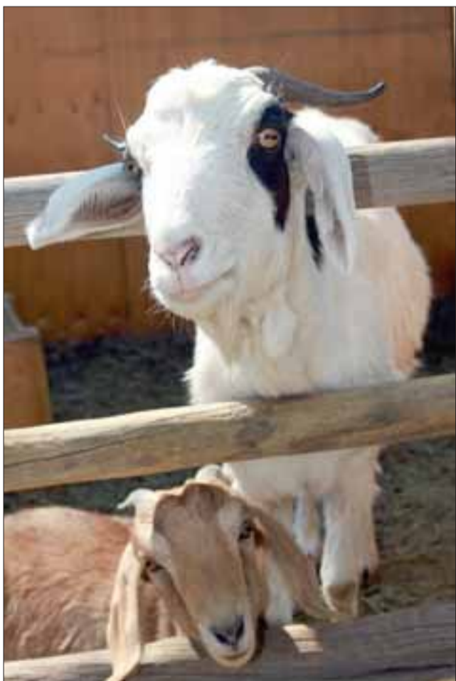
Estas cabritas con sus chivitos ahora tienen un hogar muy especial diseñado para ellos.