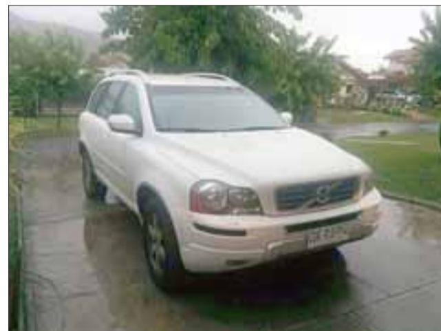
El vehículo marca Volvo fue sustraído por delincuentes desde las afueras del Colegio Curimón la tarde de este jueves.