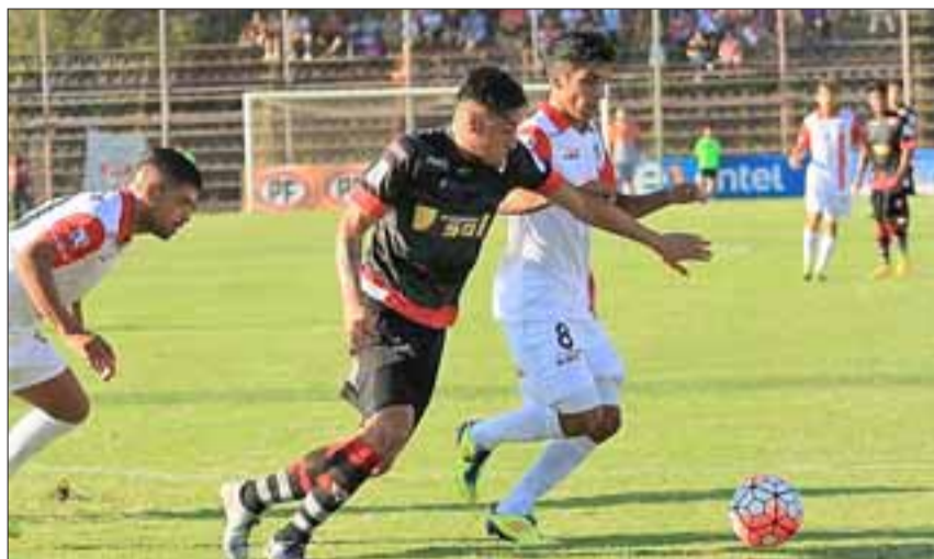
En el estadio Municipal el Uni espera terminar bien la temporada 2016 – 2017 de la Primera B.

Sábado 29 de abril 16:00 horas, Unión La Calera – Santiago Morning 16:00 horas, Unión San