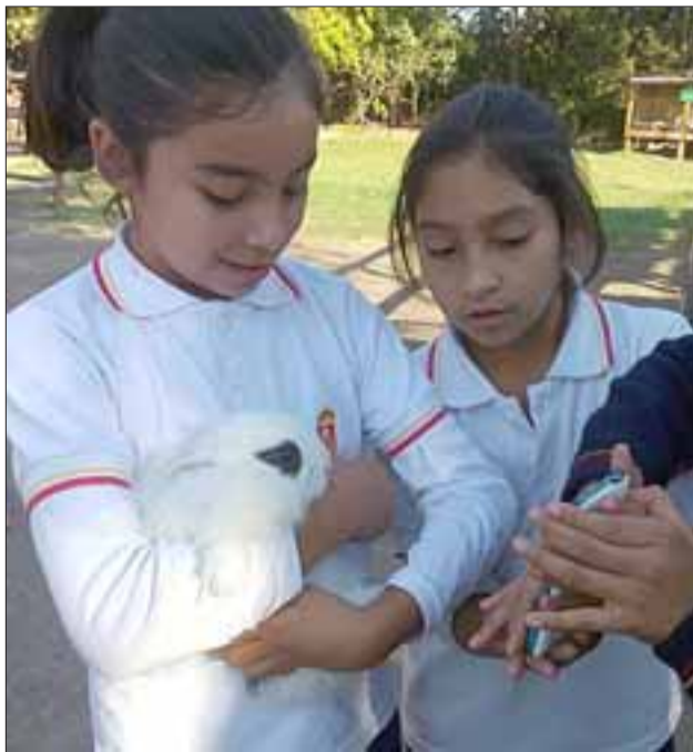
SU AMIGO EL CONEJO. - Estas niñas juegan con un blanco conejito, muy dócil y suave.