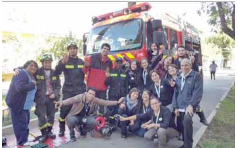
Bomberos también presentes en esta celebración.

ción como por ejemplo el Comité Paritario entregaba algunas recomendaciones