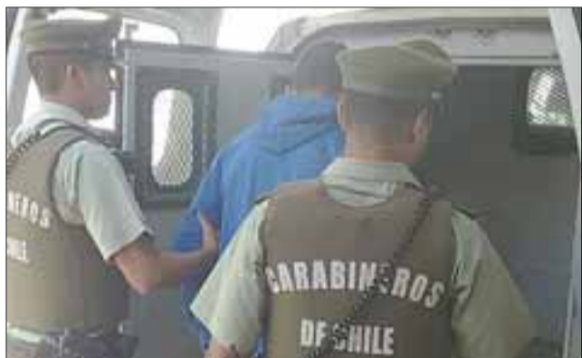
El imputado fue capturado la tarde este martes tras ser sorprendido destruyendo la señal de tránsito instalada en avenida Sargento Aldea de San Felipe. (Foto Archivo).

Por destruir una señalética de tránsito instalada en avenida Sargento Aldea de San Felipe, un antisocial proveniente de la ciudad de Temuco fue detenido por Carabineros tras ser sorprendido en flagrancia cometiendo esta falta por la cual terminó arrestado.