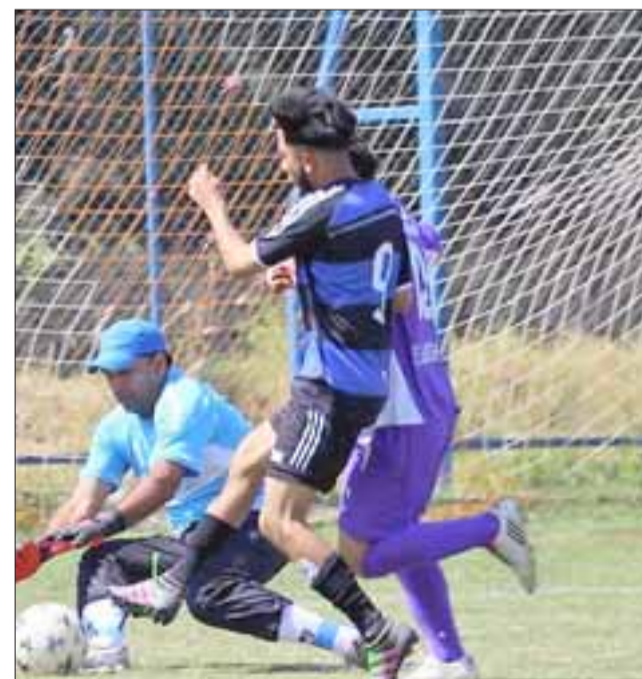
Este domingo comenzará a jugarse la fase decisiva en los grupos A y B del Amor a la Camiseta 2017.

Grupo A Unión Sargento Aldea – Libertad de Algarrobal San Pedro – Cóndor de Putaendo Grupo B