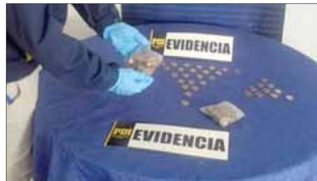
Personal de la Bicrim de la PDI de San Felipe recuperó la totalidad de las fichas sustraídas desde el Servicentro Copec de Avenida Manso de Velasco en San Felipe.