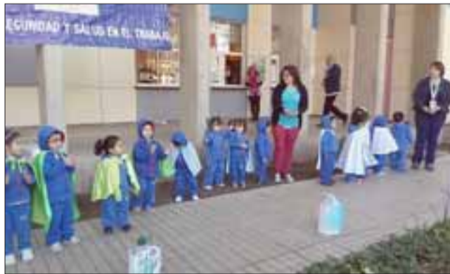
Los niños presentes en este tipo de actividades, con cuya presencia la realzan.