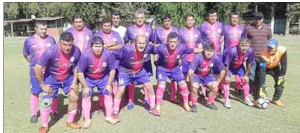
Ante un equipo con poder, Los Amigos deberán demostrar su poderío en la Liga Vecinal.

Fecha: 20:00 horas, Stadio Italiano – Puente Alto 20:00 horas, CD Alemán – Liceo Curicó 20:00 horas, Sportiva Italiana – CD Sergio Ceppi 20:00 horas, Brisas – Arturo Prat