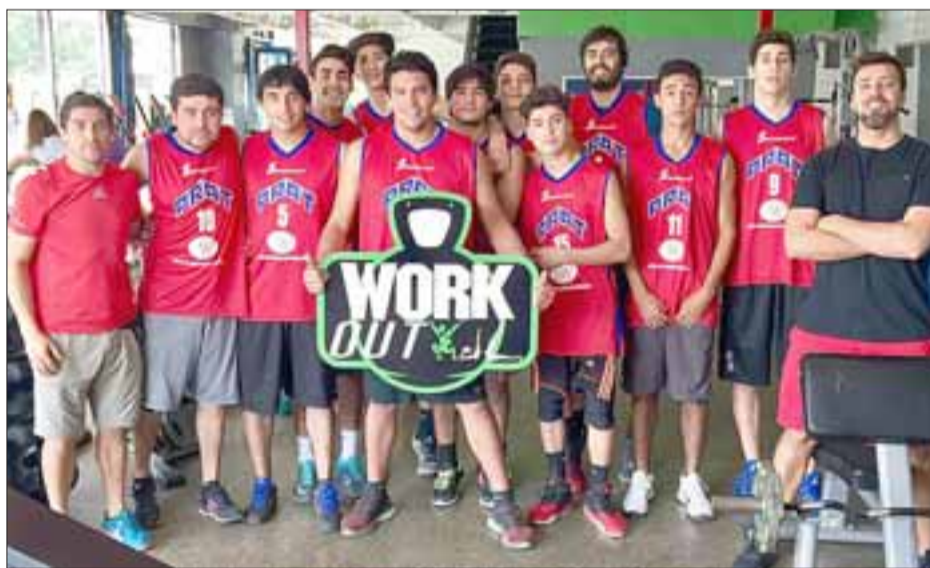
El club del marineró jugará en La Cisterna su primer partido en la Libcentro A

9:30 Estrella Verde – Deportivo GL; 11:00 Magisterio – Los del Valle; 12:30 Fénix – 3º de Línea; 14:00 Casanet – Derby 2000; 15:30 Grupo Futbolistas – 20 de Octubre