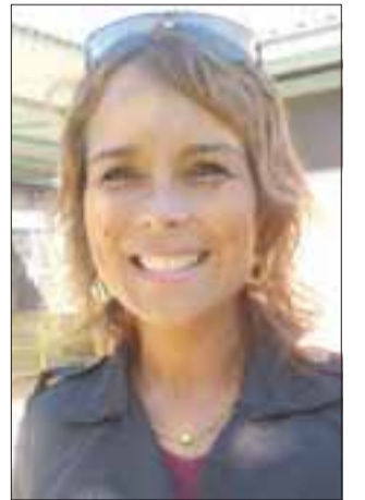
Tania Bertoglio, Secretaria Regional Ministerial de Medio Ambiente.

“Eso está ahora en manos de Conaf (Corporación Nacional Forestal), aun así, a través de la Superintendencia de Medio Ambiente, que es el organismo fiscalizador del Ministerio de Medio Ambiente, ellos ya estuvieron en el lugar y lo que están viendo e investigando es si esta extracción de roca es producto de una