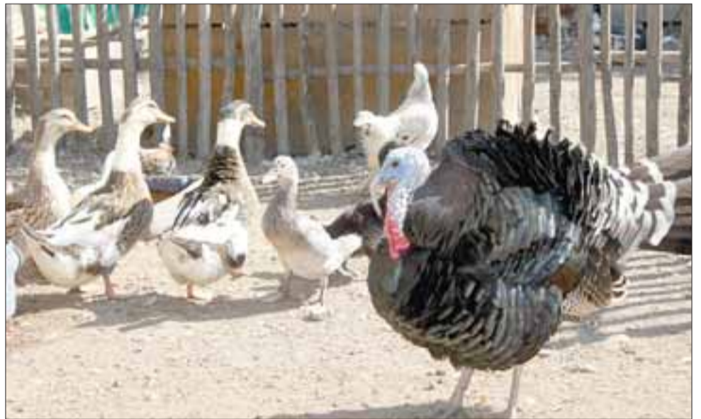
EL PAVO REGALÓN. - Aquí tenemos a este hermoso pavo, le acompañan muchos patos y gallinas.

escolares, deben coordinarlo con ella al 958974588 , la entrada es liberada pero se aceptan donaciones voluntarias, también aceptan donativos de alimentos para estos animales y de material de construcción usado, o nuevo.