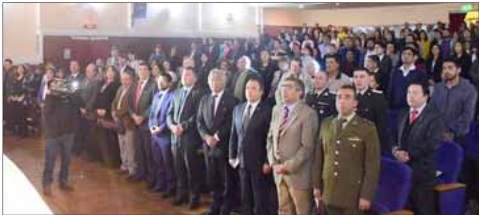
Importantes autoridades y un inmenso marco de público durante la cuenta pública realizada este miércoles por el alcalde de Llay Llay.

Al respecto, la máxima autoridad local dijo que con esto se busca beneficiar a toda la comunidad: “Tomamos la decisión de no renovar la licitación de los parquímetros y de esta forma recuperar las calles de Llay Llay para todos los vecinos y vecinas, esto lo hacemos porque entendemos que no hay razón para pagar a un privado por estacionarse en un Bien Nacional de uso público, para lo cual este privado no hace ninguna inversión, además el aporte que hace al municipio es mínimo, por lo tanto no es significativo en el presupuesto municipal. Adicio-