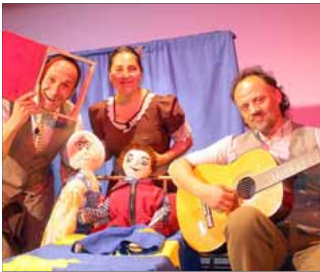
JUANITO Y EL LIBRO.- Esta obra de teatro se presentará al mediodía en el teatro municipal.

FERIA DE LIBROS USADOS.- Desde las 11:00 horas en la terraza de nuestra Plaza de Armas, usted podrá llegar con su libro y hacer cualquier trueque con otros lectores, también habrá libros a la venta.