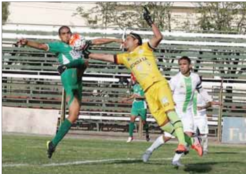
Trasandino en la actualidad está en posición de irse a la Tercera División.

zona de descenso directo a la Tercera División, y no tener que esperar el 'favor' que Lota Schwager sea desafiliado y con ello los andinos por secretaría salven la categoría. Una gentileza que en Los Andes no quieren que se produzca, ya que asumen que pueden zafar de irse a Tercera por méritos propios. En la cancha, y es por eso que durante la tarde del sábado harán de todo por vencer a Independiente.