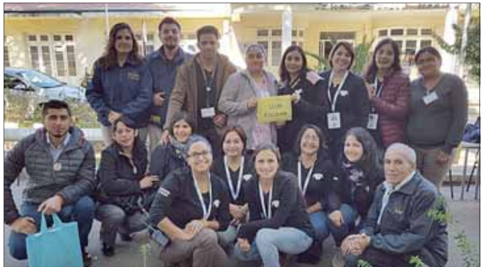
El equipo del Cesfam San Felipe El Real junto a funcionarios de la PDI presentes en la celebración.

Durante la actividad se pudo ver a los distintos stand de las entidades participantes, donde cada una de ellas entregaba informa-