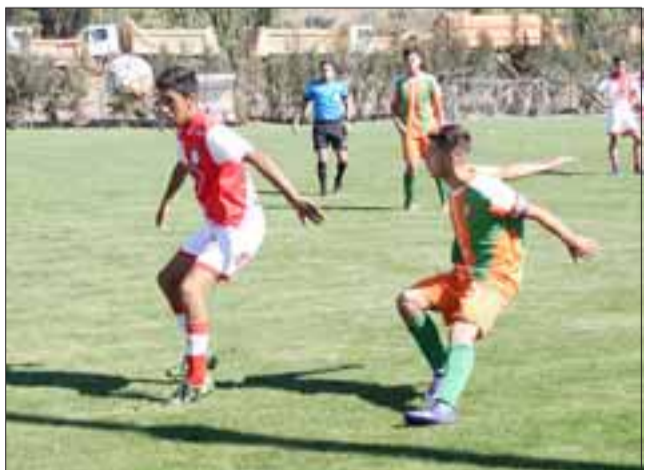
No fue productivo el fin de semana para las canteras del Uní y Trasandino. La imagen corresponde al duelo de los U17 de San Felipe contra Cobresal.