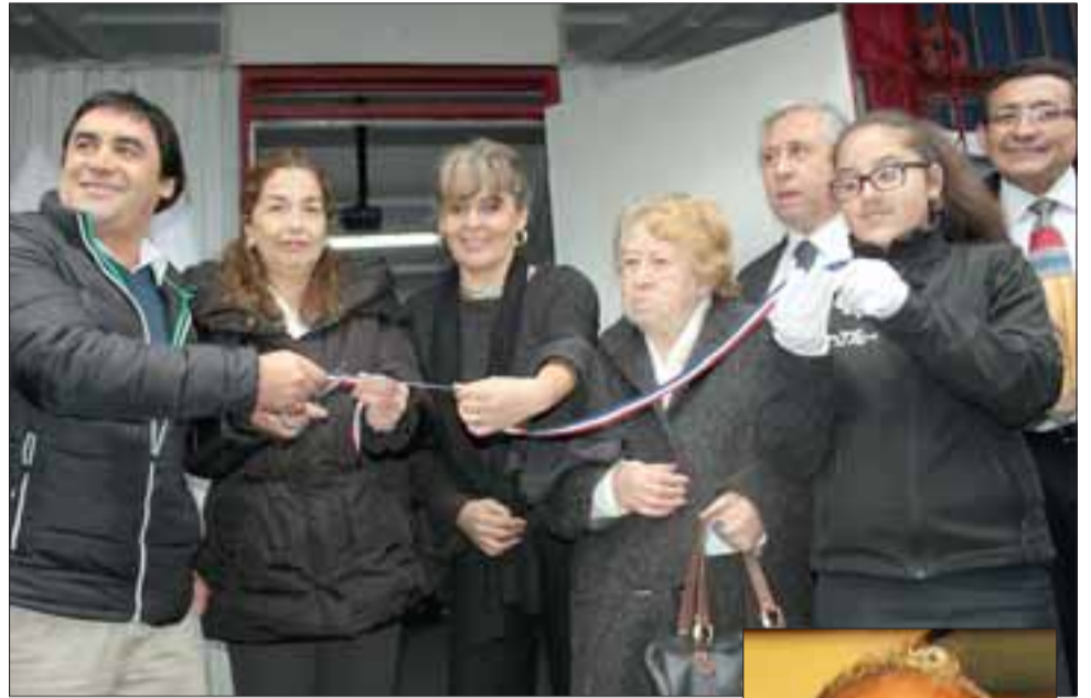
AUDITORIO NUEVO. - Autoridades de la comuna realizaron el corte de cinta oficial para inaugurar así el nuevo Auditorio Mario Sepúlveda, dentro de la Escuela John Fitzgerald Kennedy.