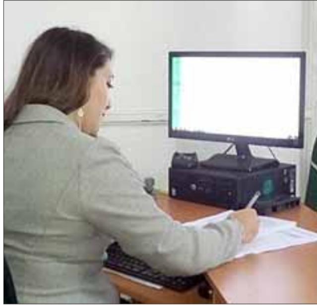
Las personas interesadas en incorporarse al escalafón de Apoyo Logístico de Carabineros, como administrativos, por ejemplo, o bien como ranchero o garzón, tienen plazo hasta el lunes 8 de mayo para postular.

En tanto, la policía uniformada recordó que las personas que resulten seleccionadas -al término del