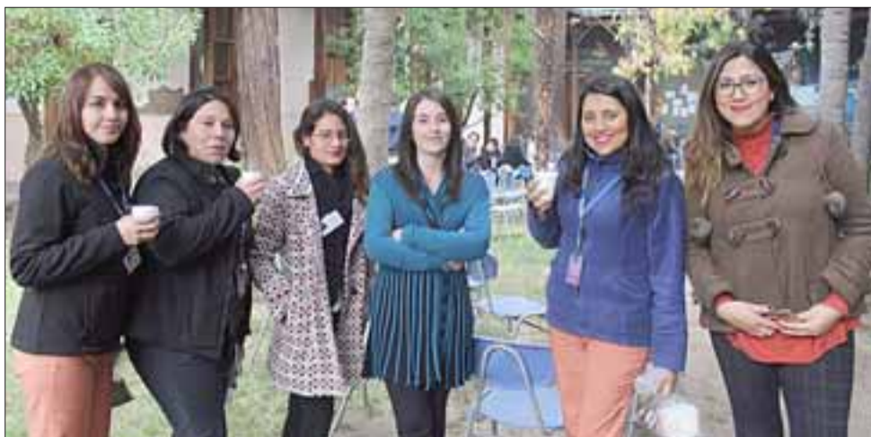
Gráficas de la comunidad hospitalaria del San Juan de Dios que pudo disfrutar del tradicional Chocolate que cada año se prepara para esta fecha.