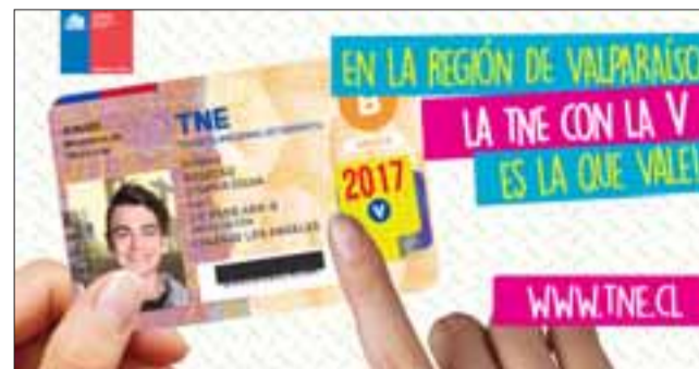
El trámite puede realizarse en todas las regiones del país y consiste en renovar el sello pegado en la tarjeta.

Si no se realiza este procedimiento, la TNE dejará de funcionar el 31 de mayo.