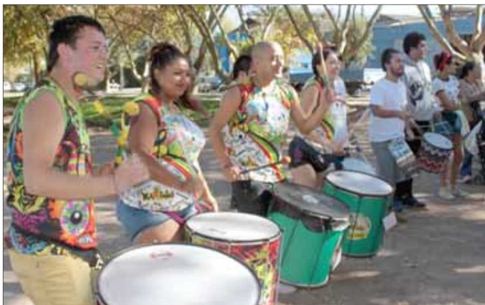
INCASABLES.- Por horas estos batuqueros sorprendieron a los sanfelipeños, pues los ritmos y baterías se escucharon en todo el damero de nuestra ciudad.