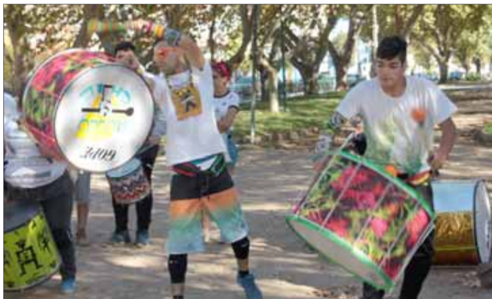
VIBRANTE PRESENTACIÓN.- Estos jóvenes mostraron su mejor experticia artística durante el pasado 11º Carnaval Batuquero de Aconcagua 2017, desarrollado en nuestra comuna.