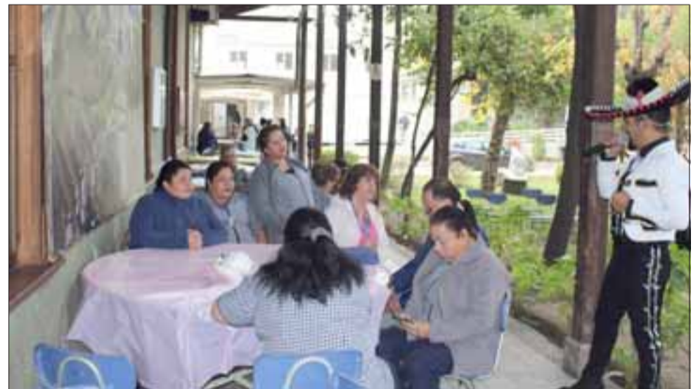
El cantante aconcgüino Wilfredo González acompañó a los funcionarios con sus temas románticos.