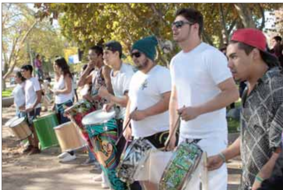
ÉXITO TOTAL.- Juventud y alegría se fundieron con los ritmos de este 11º Carnaval Batuquero de Aconcagua 2017.