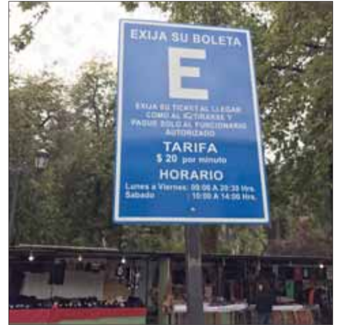
El nuevo sistema de cobro por minuto usado promueve el estacionamiento por periodos cortos de tiempo.

Tarifa queda en 1.200 pesos por una hora de estacionamiento debido al cambio del pago por fracción de 20 minutos como se hacía anteriormente.