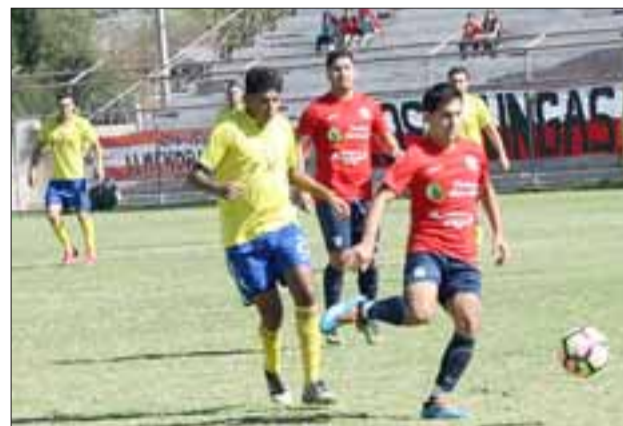
Los sanfelipeños de Almendral Alto se hicieron muy fuertes en el Municipal para imponerse al Monjas por 3 a 0.

Con este triunfo el equipo sanfelipeño está a las puertas de repetir lo hecho el año pasado por Juventud San María, lo que habla a las claras del buen nivel del balompié amateur santamariano (juega en esa asociación) y el valle de Aconcagua en general.