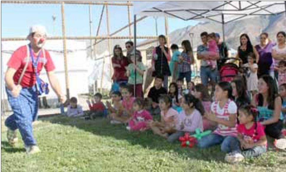
TRABAJO INFANTIL.- Aquí tenemos a uno de los profesionales haciéndola de payaso, los pequeñitos de El Totoral estaban locos de alegría con sus ocurrencias.