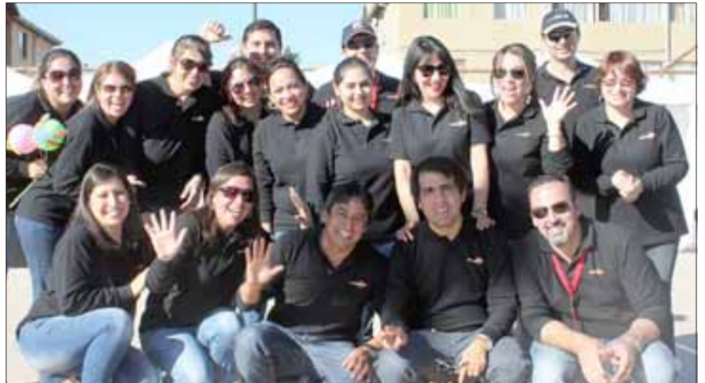
SOMOS UNO ACONCAGUA.- Ellos son parte del equipo de profesionales de Fundación 'Somos Uno', quienes desarrollan operativos de trabajo social varias veces al año.

«Somos como 50 profesionales los que participamos este fin de semana, nuestra fundación ofreció ayuda socio-cultural con mucho gusto, técnicos en enfermería, salud mental, asesorías en leyes, medicina general, odontología y pediatría es lo que desarrollamos, este es el primer