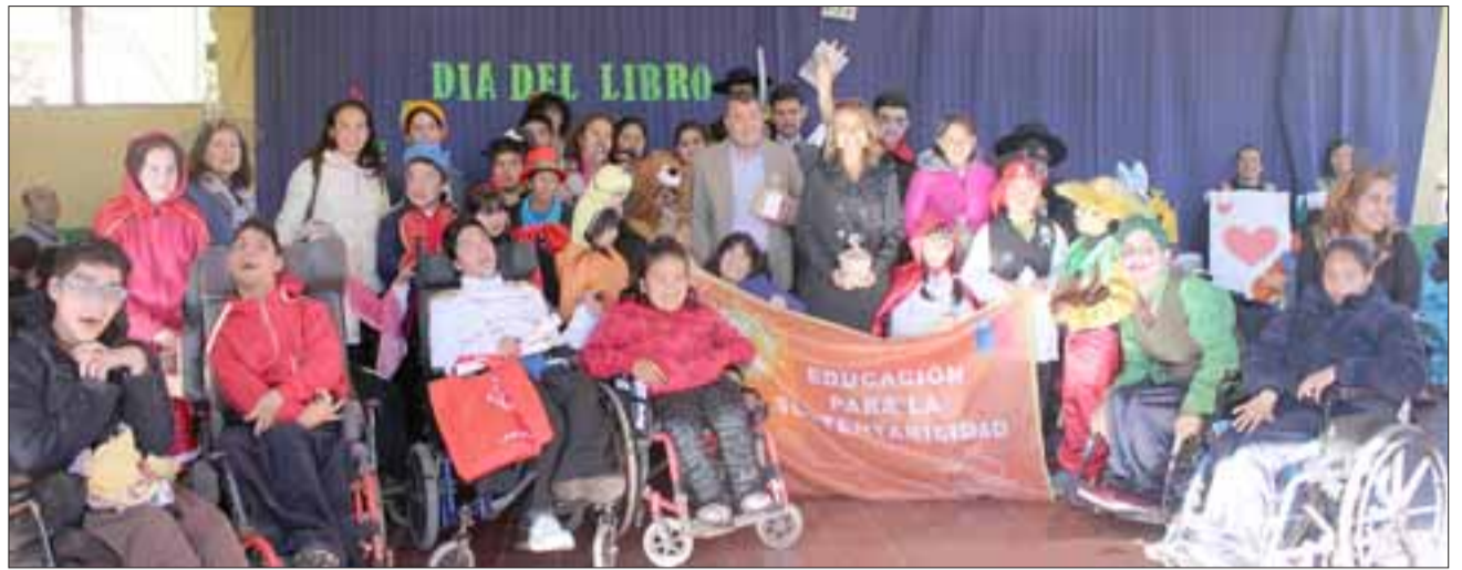
Alumnos y autoridades durante la visita de la Seremi de Medio Ambiente, Tania Bertoglio, a la Escuela Especial Sagrado Corazón.

En la ocasión, las autoridades conocieron la huer-ta escolar, el taller de com-