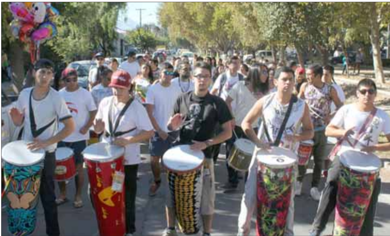
SABOR Y RITMO.- Las calles de San Felipe fueron sacudidas durante el pasado fin de semana por estos batuqueros, quienes llegaron de varias partes del país.