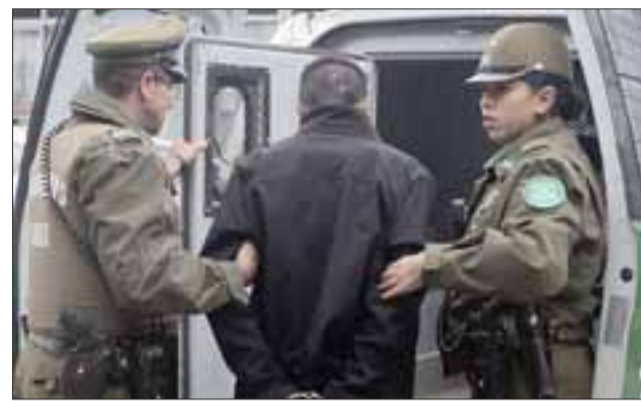
El imputado fue detenido por Carabineros, siendo derivado hasta tribunales para ser requerido por la Fiscalía que investigará el caso.

Pena por parricidio parte desde los 15 años de cárcel: