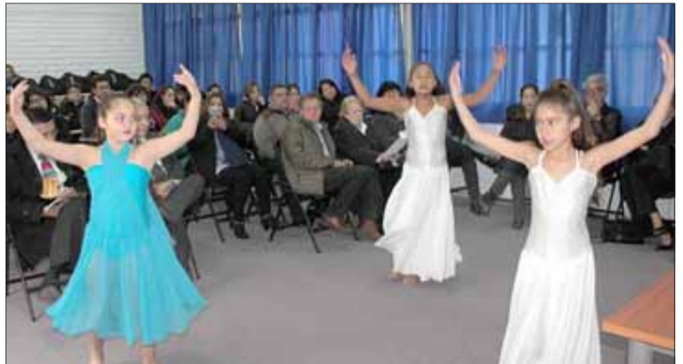
AMPLIO Y ELEGANTE. - Estas niñas fueron las primeras alumnas en darle uso oficial a este auditorio, ofreciendo varios bailes típicos.