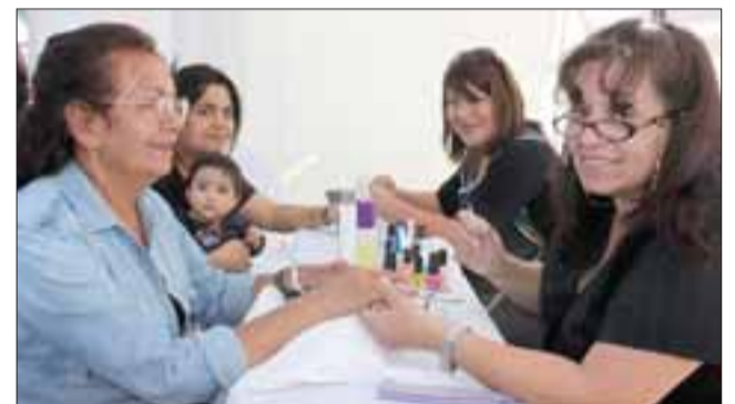
REGALONEADAS.- Las vecinas de esta población sanfelipeña también fueron regaloneadas con varios tratamientos de belleza y salud.

Fue una jornada de payasos, enfermeras, dentistas y trabajadores sociales en escena, a nadie se le cobró por lo brindado y la respuesta fue bastante positiva. Roberto González Short