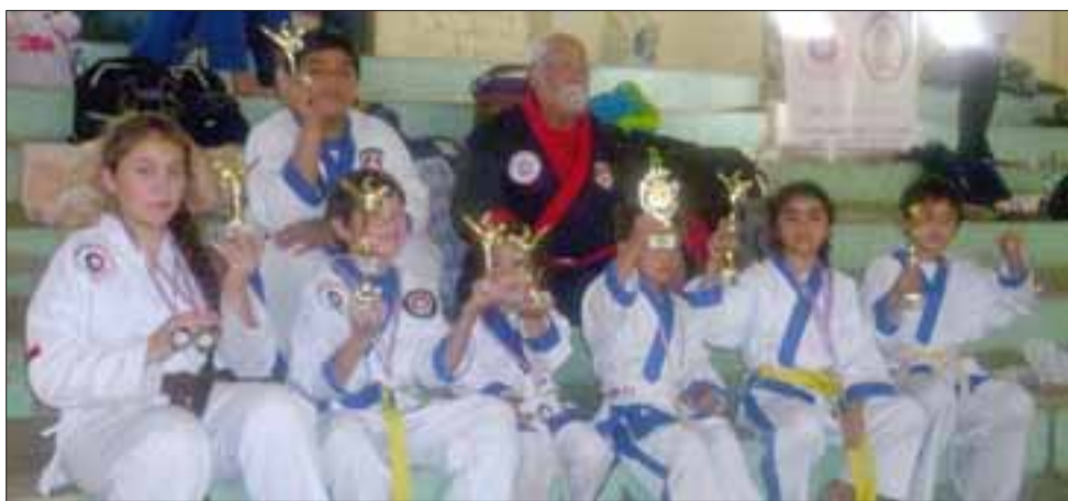
GUERREROS DE ACONCAGUA.- Aquí tenemos a nuestros campeones, mostrando con alegría sus copas y trofeos ganados.