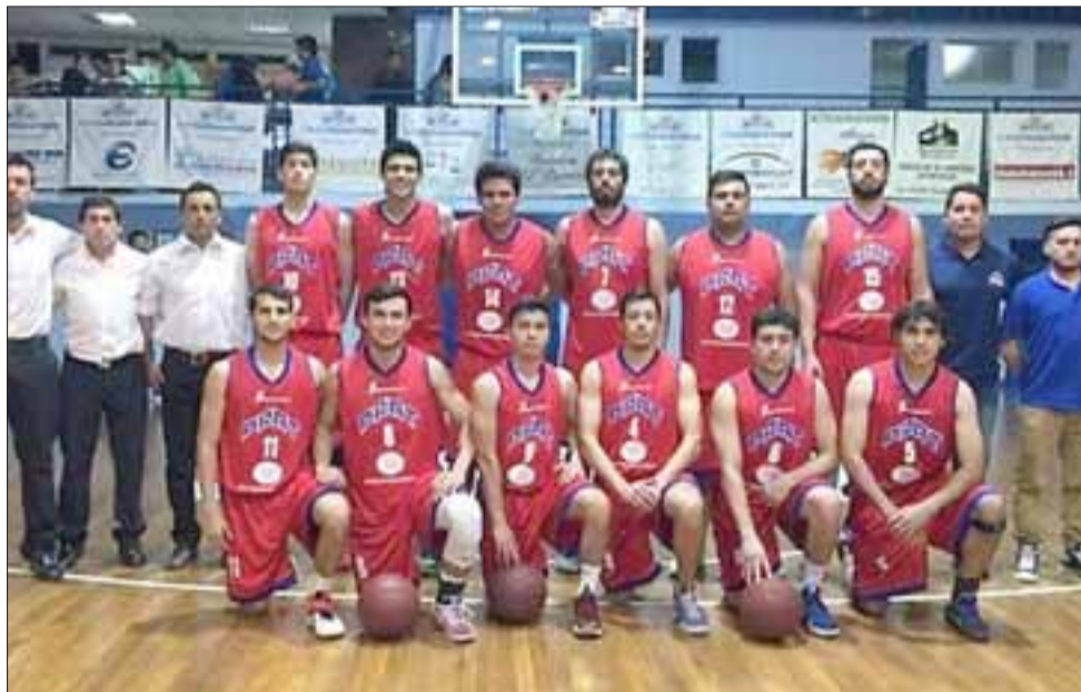
Una categórica derrota sufrió el quinteto de honor del Prat en su debut en la Libcentro A.

U13: Brisas 70 – Prat 54 U15: Brisas 69 – Prat 62 U17: Brisas 61 – Prat 68