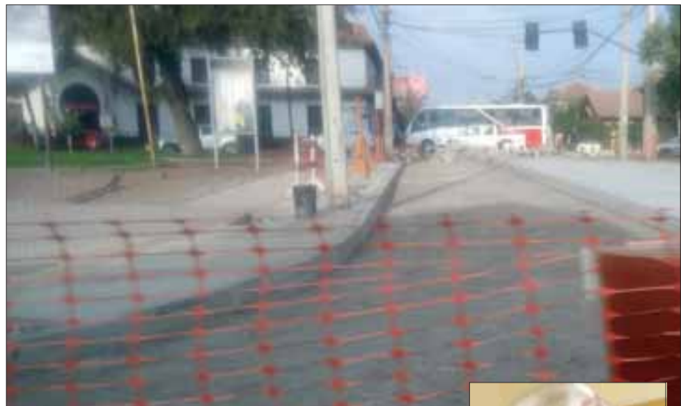
La pavimentación con hormigón estampado habría desencadenado finalmente la postergación de la habilitación de esta intersección.

“Este proyecto originalmente no consideraba