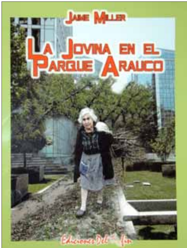
¿PERSONAJE REAL?- La Jovina en el Parque Arauco, que trata de una señora que vive en el campo, una familia llega de la ciudad a vivir cerca de ella.