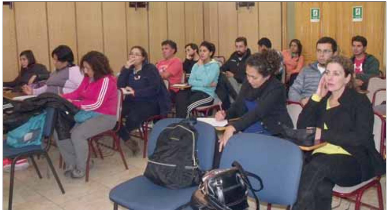
Profesores de Educación Física y asistentes de la educación de San Felipe se capacitaron en radiación solar.

“Hace un año instauramos un programa de prevención de riesgos en la Daem de San Felipe, y uno de los temas que teníamos que desarrollar era el protocolo de radiación UV que exige el Ministerio de Salud