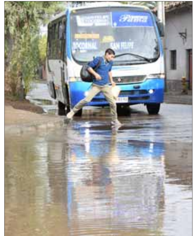
A PREVENIR HOY.- Los chubascos de ayer miércoles pusieron en apuros a más de uno, hoy y mañana se esperan intensas lluvias en el Valle Aconcagua.

Las cámaras de Diario El Trabajo tomaron registro del comportamiento del clima ayer miércoles, en la