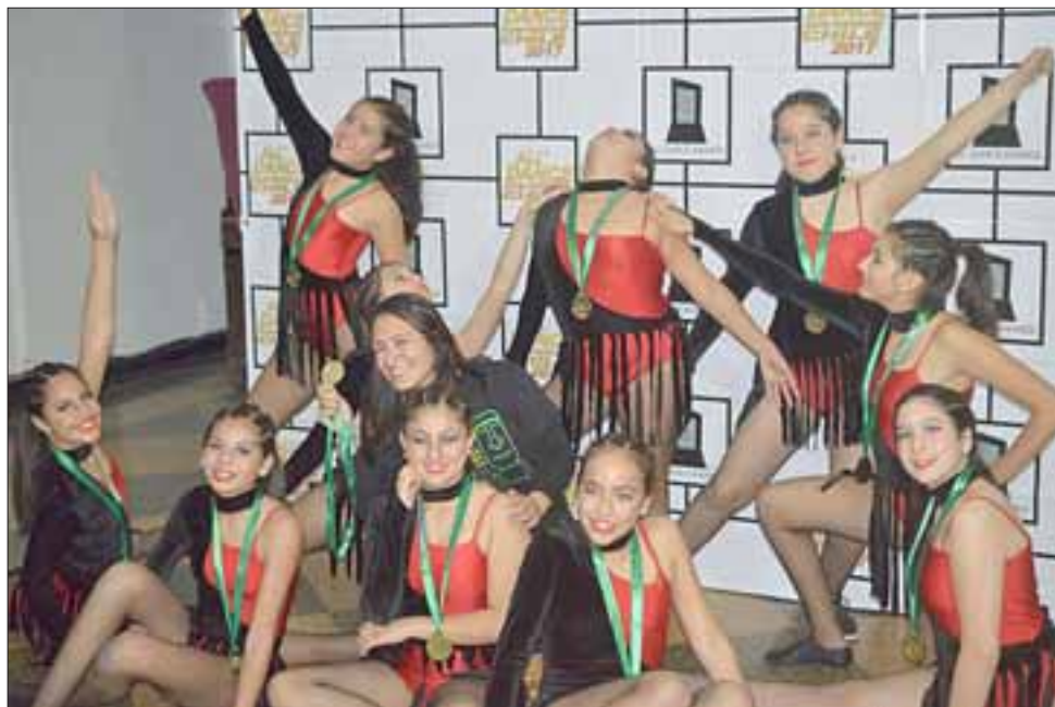
La academia funciona desde 2013, recibe a niñas y niños desde los 3 años de edad y actualmente implementa sus clases en el Club de Tenis de La Troya.

Lamentablemente, el haberse ganado un cupo para viajar a Estados Unidos como representante de Chile, no le entrega ningún tipo de beneficio económico a la Academia sanfelipeña, y por tratarse de una