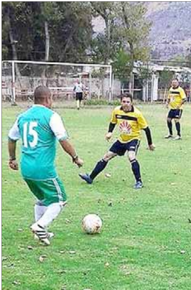
La séptima fecha del actual torneo en Parrasía fue completamente favorable para Los Amigos, que nuevamente están solos en la cima de la tabla.

Los Amigos 2 – Pedro Aguirre Cerda 1; Santos 0 – Unión Esfuerzo 0; Carlos Barrera 1 – Hernán Pérez Quijanes 2; Andacollo 0 – Aconcagua 6; Villa Argelia 2 – Unión Esperanza 3; Villa Los Álamos 3 – Tsunami 2; Resto del Mundo 0 – Barcelona 5