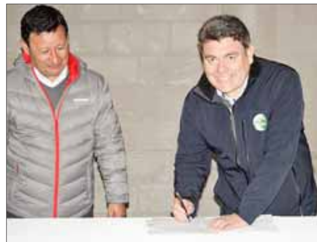
Ayer en la mañana se firmó la extensión del convenio de cooperación entre Unión San Felipe y la Municipalidad de calle Larga.