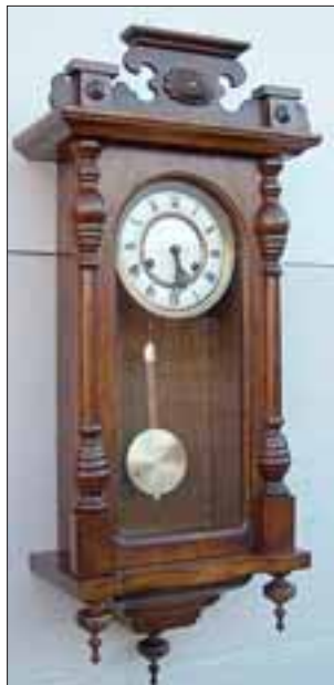
Una réplica de este reloj es la que robaron desde las oficinas de la Sociedad de Artesanos La Unión.

«Quiero hoy hacer público mi agradecimiento en nombre de toda la Sociedad de Artesanos con Carabineros de Chile, creo que no es