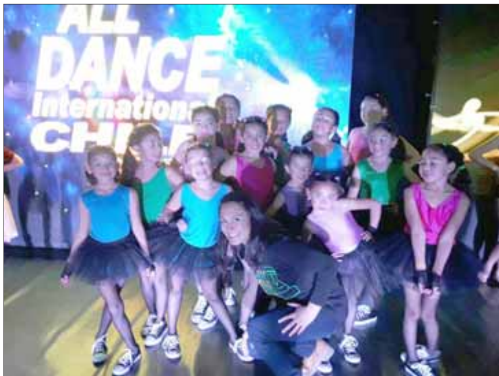
Academia de danza sanfelipeña 'Media Punta', se ganó el derecho de representar a Chile en el mundial de la disciplina que se desarrollará en Estados Unidos.

entidad particular, serán las propias familias de las 30 bailarinas clasificadas, las que tengan que cubrir los gastos de pasajes y estadía por 5 días en el país norteamericano.