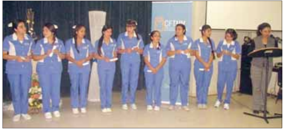
Las alumnas que finalizaron la enseñanza media técnico profesional de la carrera de Asistente de Enfermería, decidieron aprovechar la alianza que suscribió el liceo con el CFT de la U. de Valparaíso, para continuar su proceso de formación, ahora como técnicas de nivel superior.

La docente precisó que esta investidura da el vamos a las pasantías y prácticas en campos clínicos, lo que representa una etapa importante en su proceso formativo.