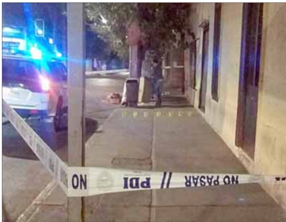
Por orden del Ministerio Público, personal de la Brigada de Homicidios de la PDI concurrió hasta el sitio del suceso a realizar las primeras pericias frente a este impactante delito.

«El delito está caratulado como homicidio frustrado, tenemos plenamente identificada a esta persona, estamos en su búsqueda.