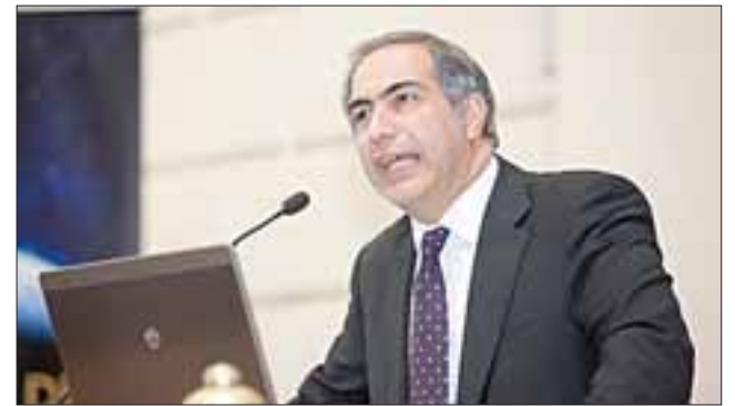
A juicio del parlamentario, el proyecto que fortalece la composición del Poder Judicial dejó de lado necesidades urgentes, como la de descentralizar el acceso a la Justicia.

Chahuán adelantó que ya estableció conexiones con el ministerio de Justicia para que esto sea considerado en el más breve plazo, porque se trata de "una necesidad ineludible".