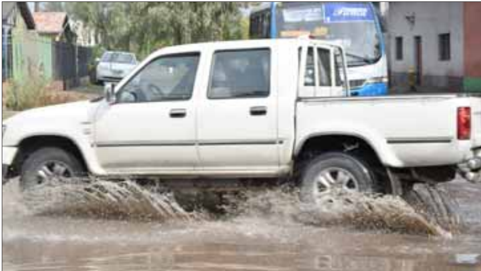
FRENTE LLUVIOSO.- Si este era el panorama ayer miércoles con un par de chubascos, ¿qué nos espera para hoy y mañana?

zona urbana de San Felipe inundados, pero sin colapsar alguna vía. Roberto González Short