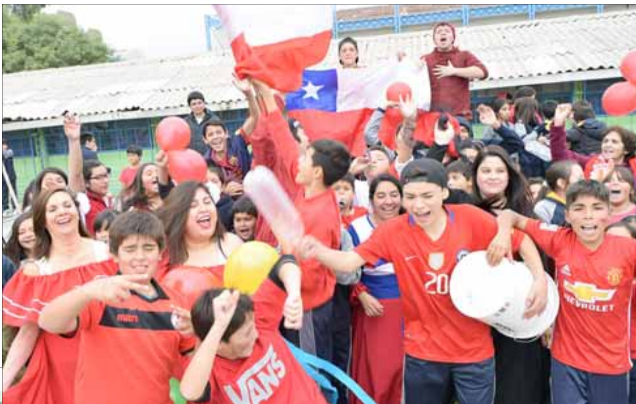
CHILE.- Aquí tenemos la alianza anfitriona, una jornada en que no se buscaba ganar, sino más bien, vivir el momento.