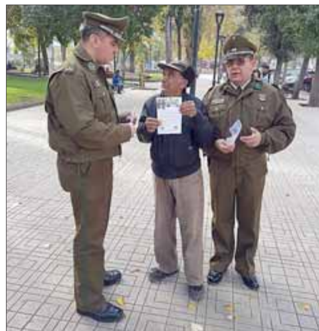
La iniciativa pretende reducir el número de delito de robo en viviendas de San Felipe.