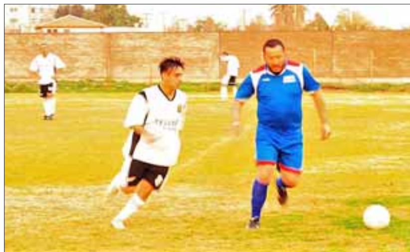
Para el primer fin de semana de junio quedó agendado el inicio de la temporada 2017 del fútbol aficionado sanfelipeño.

Dentro de las características más importantes que tendrá el próximo certamen, es que este constará de dos ruedas; a la Copa de Campeones clasificarán de manera directa los dos primeros (campeón y subcampeón), mientras que el tercero deberá jugar el repechaje para poder participar en el torneo de clubes regional.