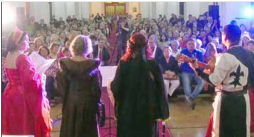
LA CREMA. - El público de Camerata Aconcagua es uno selecto, religioso y muy culto.

han presentado en varias ferias medievales en nuestro país, mostrando cómo era realmente la música en esa época, sin contaminaciones modernas de estilos contemporáneos.