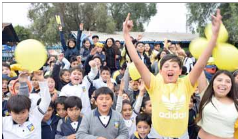
COLOMBIA.- Aquí tenemos a los niños de la Alianza colombiana, celebrando en grande su día sin clases.