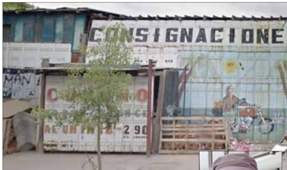
El taller mecánico ubicado en Chacay 290 volvió a recibir la visita de los indeseables.

El mecánico hizo un llamado a sus colegas, especialmente del barrio Centenario, a que no compren estas herramientas y si ven gente vendiéndolas, que de-