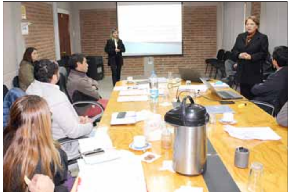
El Concejo Municipal resolvió aceptar el reglamento para el pago de un bono de incentivo a las funcionarias de los Jardines-Sala Cuna de Panquehue.