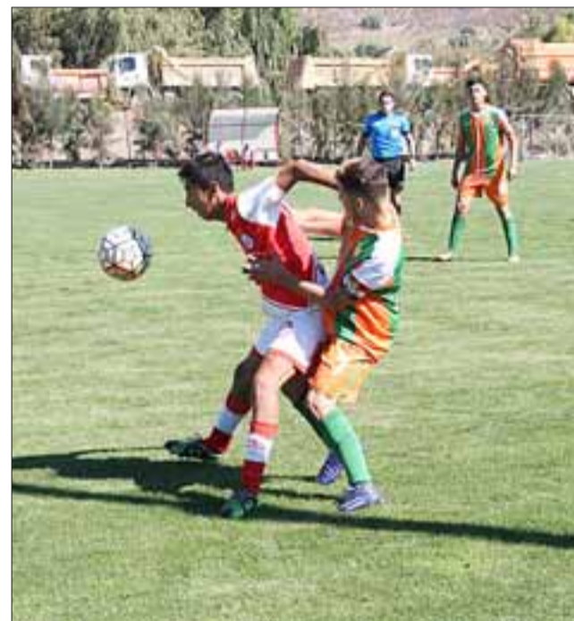
Desde las 13 horas de hoy en el Complejo Deportivo de Parrasía Bajo, las series U17 y U19 del Uní Uní enfrentarán a Santiago Morning.

15:15 horas; U17: Unión San Felipe - Santiago Morning