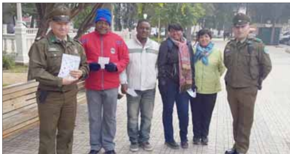
Carabineros y el personal de la Oficina de Integración Comunitaria en la Plaza de Armas de San Felipe.

ta el centro de la comuna a realizar trámites y compras: cerrar bien carteras o bolsos usándolo cruzado hacia adelante. Vigilar sus pertenencias y no perderlas de vista en lugares concurridos. No ostentar dinero y