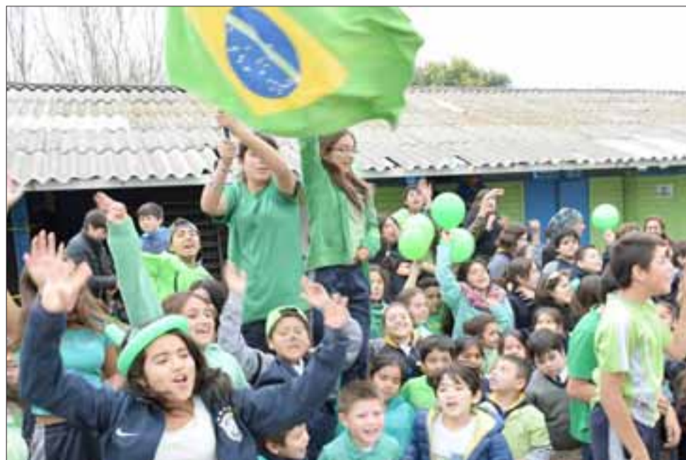
BRASIL.- La Alianza Carioca no pudo faltar, pues en esta casa estudiantil son varios los estudiantes brasileiros estudiando.