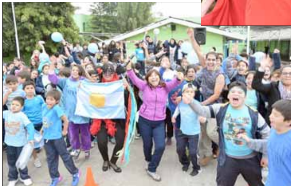
ARGENTINA.- Los estudiantes argentinos de esta escuela municipalizada también tuvieron su Alianza.