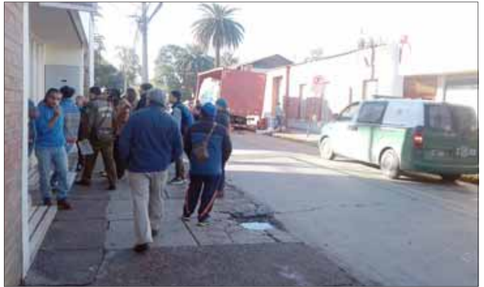
Acá se puede ver a las personas afuera de la oficina, cuando personal de Carabineros adoptaba el procedimiento policial.

La oficial fue clara en señalar que en ningún momento el imputado quiso