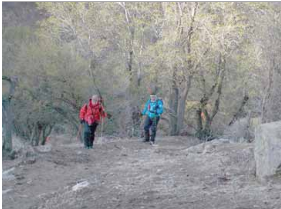
Los organizadores recomiendan llevar ropa de secado rápido, polar o chaqueta cortaviento, gorro, guantes para el frío, zapatillas de planta dura.