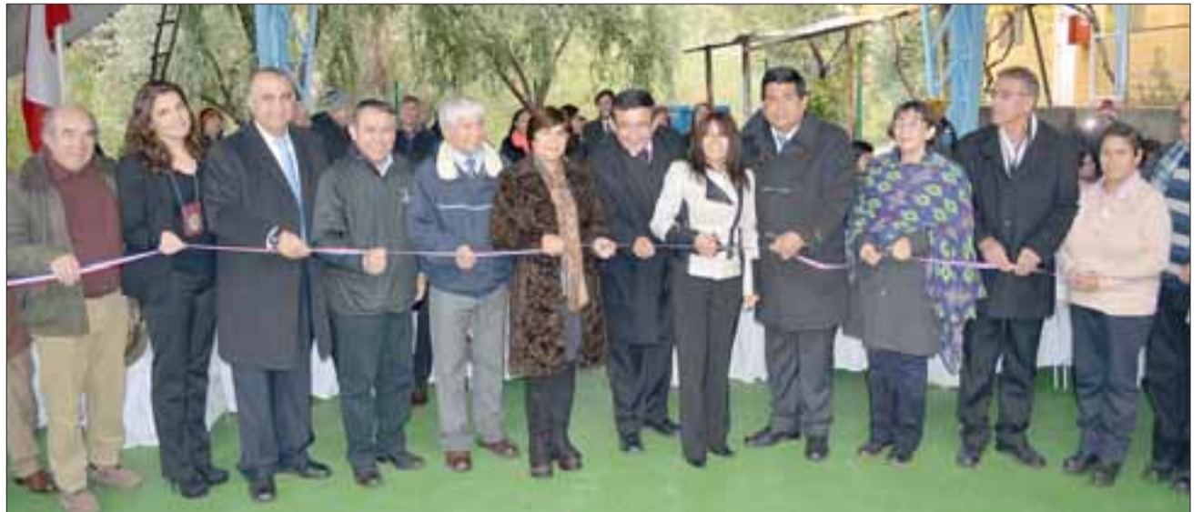
El tradicional corte de cinta dio por inaugurado el proyecto de Conservación infraestructura y sistema eléctrico en escuela Julio Tejedor de la localidad de Jahuelito.

El año 2007 la escuela se adjudica un proyecto para construir una biblioteca, la cual se construye durante el mismo año. En la actualidad la comunidad educativa, en conjunto con la Municipalidad de Santa María, se encuentran trabajando para poder implementarla con libros y mobiliario.