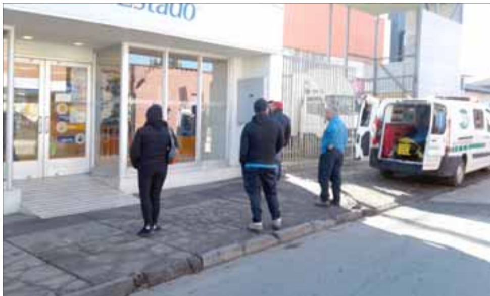
Otras personas que no pudieron realizar trámites bancarios este lunes en la mañana.

quitarle el arma al vigilante, ni provocar lesiones a las personas; “ni tampoco asaltar el banco sino que simplemente fue a hacerle entrega de una carta donde también tenía contenido respecto al juicio final y otro tipo de palabras al guardia, pero no fue más que eso”, indicó.