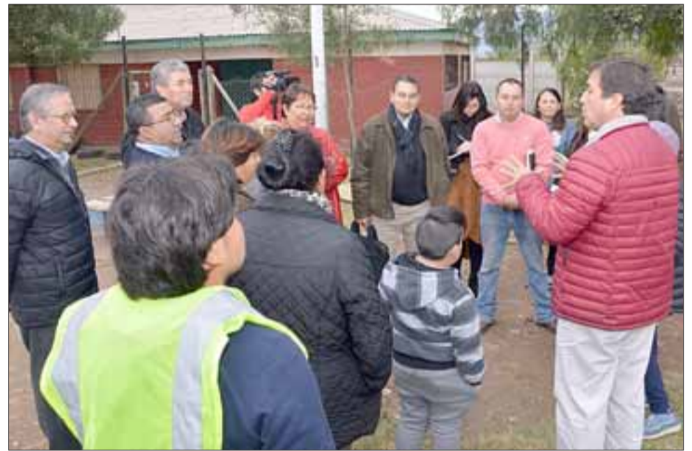
El Concejo Municipal constató en terreno las principales problemáticas en el sector 'Los Portales'.