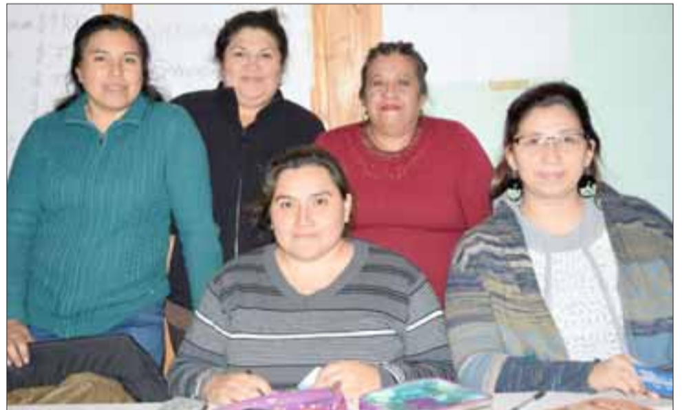
DIRECTIVA MUY ACTIVA.- Aquí tenemos a la directiva del Comité Habitacional Altos del Pino.