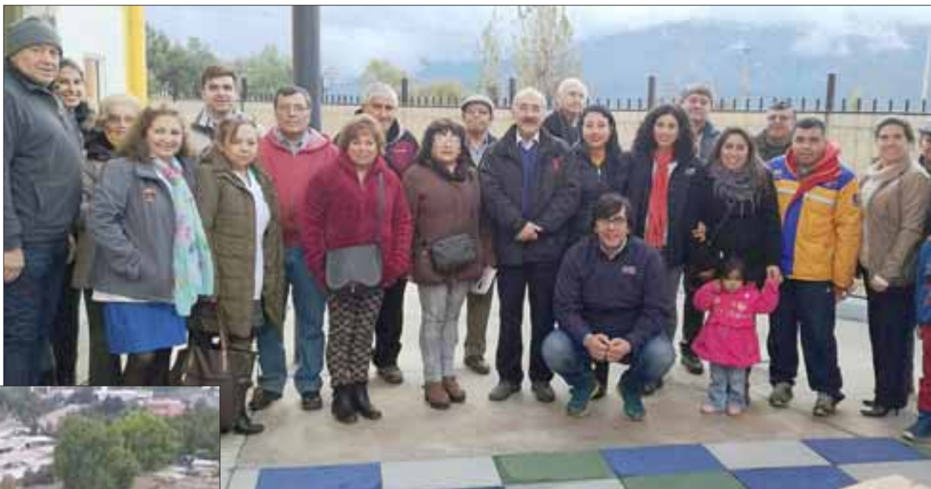
JARDÍN NUEVO.- Vecinos y vecinas del sector de Las Acacias en un acto participativo y democrático bautizaron el nuevo establecimiento que pronto iniciará actividades.