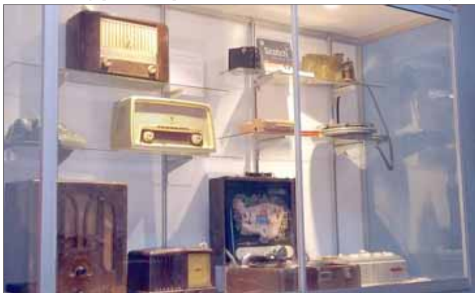
Desde esa fecha estará abierto a la comunidad de lunes a sábado entre las 9:00 y las 13:00 horas y desde las 15:00 a las 18:00 horas.

que pertenecían al doctor Segismundo Iturra. Finalmente, la penúltima sala es de Artes y Letras, con escritores y pintores Aconcagüinos», detalló la profesional, agregando que la última lista para el mismo 28 de mayo, debido que aún faltan objetos por ordenar.