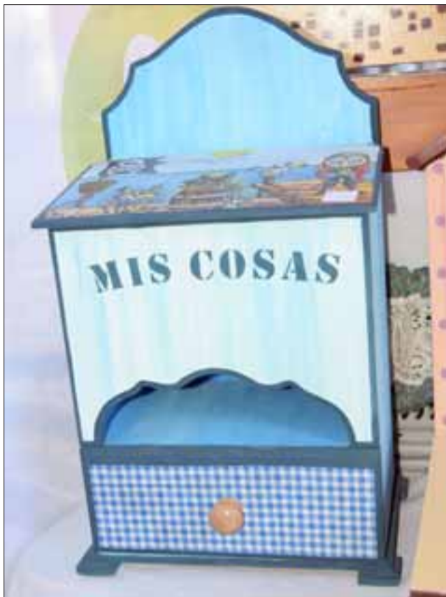
MI CAJITA.- Esta cajita será muy útil en casa, pueden guardarse en ella muchas cosas pequeñas.