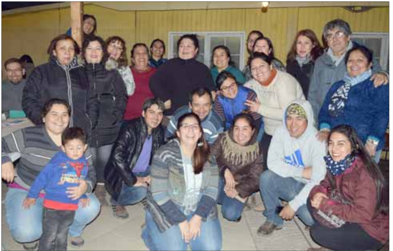
SUEÑAN CON CASA PROPIA.- Ellos son parte de los socios de este comité de vivienda, quienes desde hace cinco años buscan llegar a la meta final.

«Nosotros conformamos un grupo de familias que estamos entre el 0% y 40% de familias más vulnerables del país. También buscamos que nuestra población llegue a tener su placita, zona de juegos y