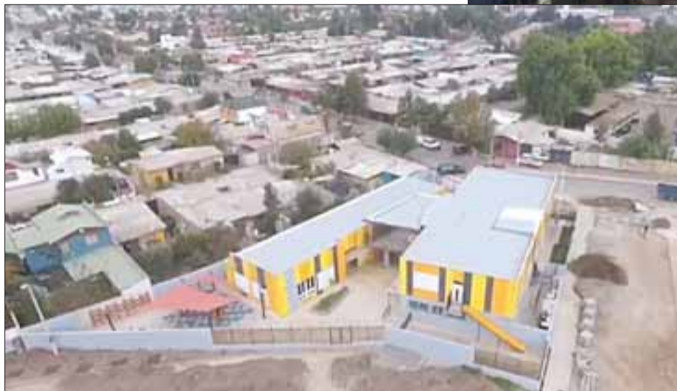
VISTA AÉREA.- Así se ve este edificio desde el cielo, este jardín infantil cuenta con dos salas cuna y dos niveles medios. Cada sala de actividades posee una sala de servicios higiénicos para acoger a los 40 lactantes y 56 párvulos.