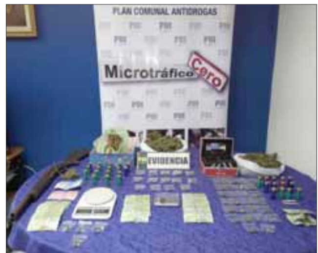
Un total de 565 gramos de cannabis sativa, una escopeta y 30 municiones además de dinero en efectivo fue el resultado de un allanamiento efectuado por la PDI este jueves en un domicilio de Hacienda de Quilpué en San Felipe.