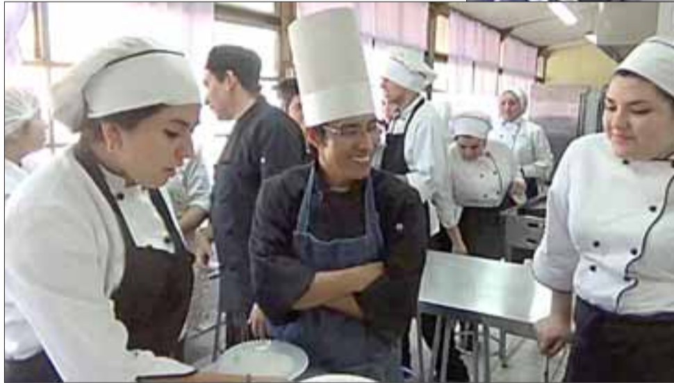
Los alumnos tuvieron la posibilidad de observar la preparación paso a paso de cada plato, tomando nota y evidenciando el directo el proceso de tan exquisita gastronomía.

Con esta clase magistral de cocina, y fiel a sus principios, el Liceo Técnico Amancay trabaja en pos de mejorar la calidad técnica gastronómica de sus alumnos y enriquecer en conocimientos a toda su comunidad educativa.