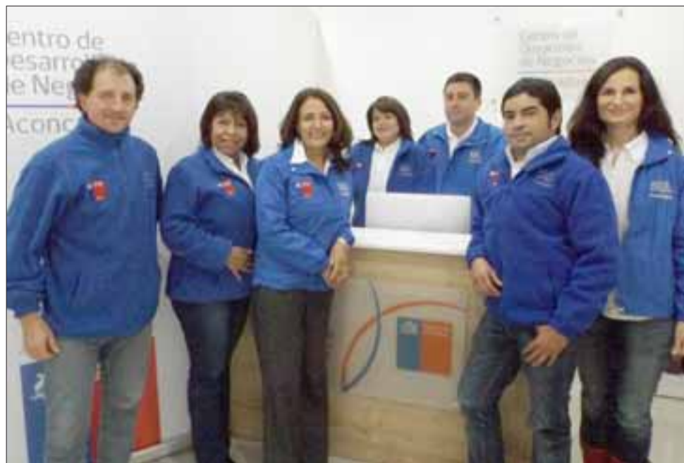
Este nuevo Centro de Desarrollo de Negocios Aconcagua abrió sus puertas de la mano de asesoría experta y gratuita para todos los empresarios y emprendedores, hombres y mujeres, de la zona.

En la misma línea se manifestó la directora del nuevo Centro de Desarrollo de