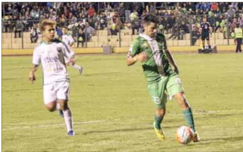
Con dos ausencias sensibles y al mismo tiempo muy extrañas, Trasandino debió enfrentar a Deportes Vallenar. Al final los andinos perdieron 3 a 2 y lo que es peor bajaron a Tercera.

Una pérdida de categoría es un hecho doloroso, que muchas veces marca a