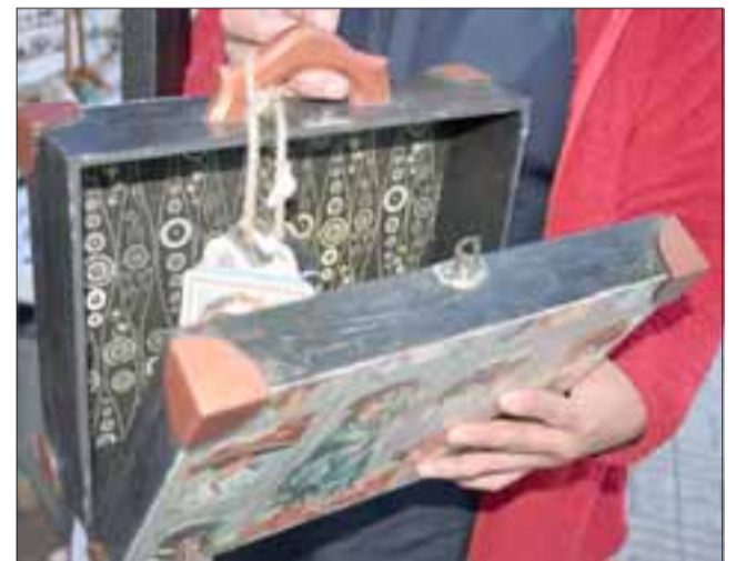
MALETA DE RECUERDOS.- Aquí tenemos una pequeña maletita de madera, la que podría servir para guardar recuerdos, fotos y documentos en el hogar.