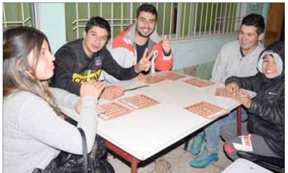
LA JUVENTUD IMPONE.- Los jóvenes son también parte importante en este proyecto, pues también llegaron a participar de este Bingo.