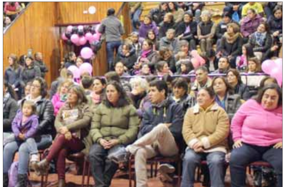
Cientos de mamitas panquehuinas recibieron un homenaje especial en su día. Si bien esta actividad estaba programada para el día viernes 12 de mayo, fue pospuesta por situación climatológica.