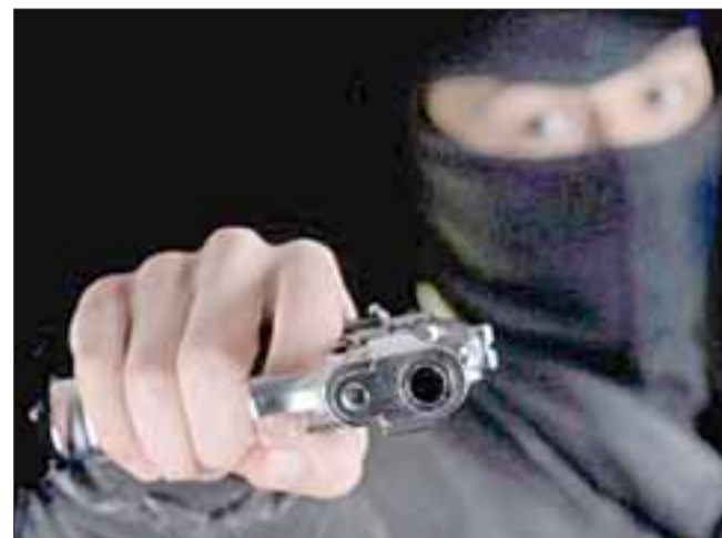
Los asaltantes encapuchados y a mano armada concretaron el robo de $100.000 en la estación de combustibles Shell en Llay Llay. (Foto Referencial).

Preveían drogas desde Hacienda de Quilpué: