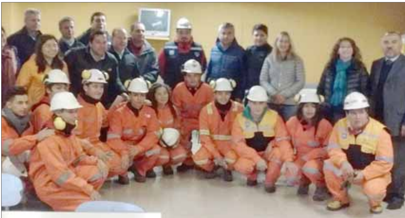
Los alumnos del Liceo Darío Salas de la comuna de Santa María, de la especialidad de Explotación Minería, recibieron la visita de un grupo de 25 representantes de Minera Teck de Antofagasta Minerals.