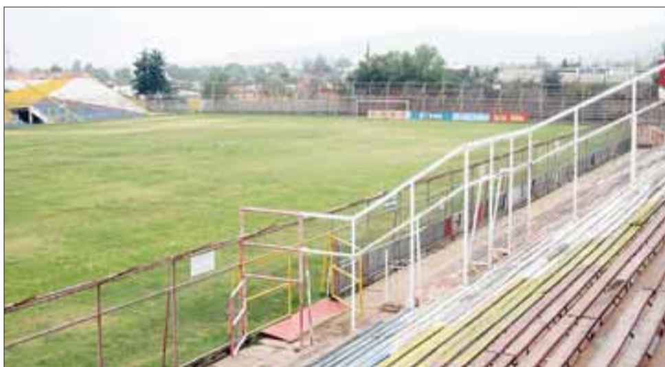
Unión San Felipe ya oficializó que no volverá a jugar en el Estadio Municipal hasta que el coliseo no sea intervenido a fondo.

Fuentes confiables consultadas por El Trabajo Deportivo , indicaron que la idea central del Uní es hacer de local en el nuevo Estadio Municipal de Santa María, y mientras ese recinto se encuentre en su remodelación, se barajan como alternativas los estadios de Maipú y La Pintana y otro de una localidad de la Quinta Región.