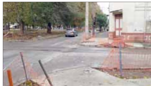
Desde otra perspectiva, la vista panorámica del badén que deberá reconstruirse.