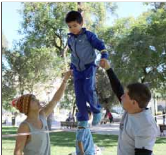
El slackline junto al tenis de mesa y ajedrez también estuvieron presentes en la oportunidad.