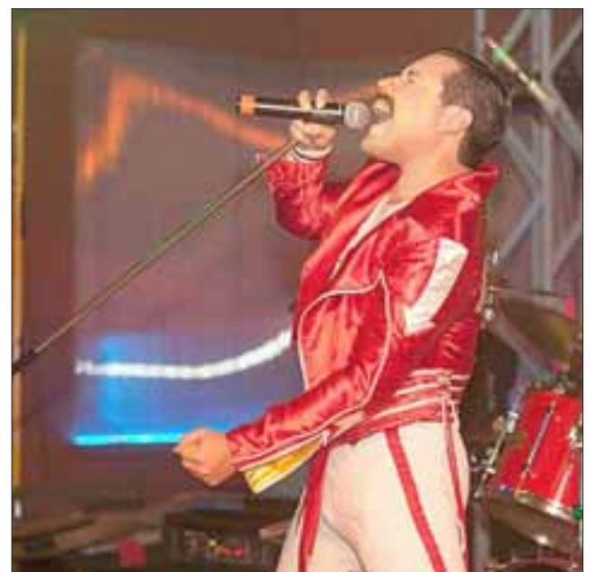
ENTRADA LIBERADA.- Este doble del artista estará en el Teatro Municipal de San Felipe el viernes a las 19:30 horas.