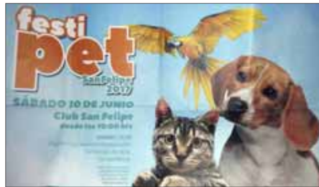
I FestiPet tendrá como invitado estelar al Kennel Club Chile

“Hacemos un llamado a todos los vecinos no sólo de San Felipe, de Aconcagua en general, para que participen de este festival, que va a ser uno de los hitos que tendremos este año en nuestra comuna”, aseveró el edil.