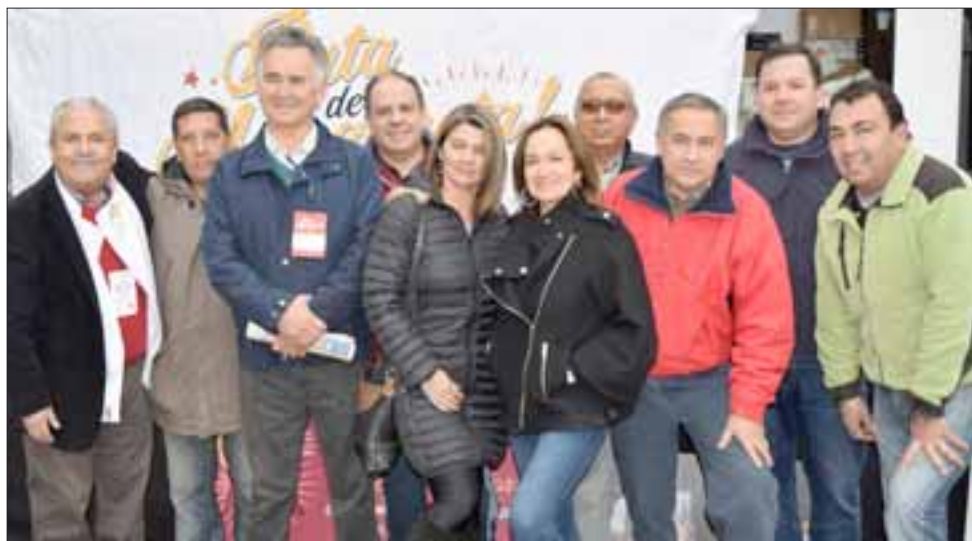
NUESTROS PANADEROS.- Ellos son panaderos de panaderías como La Italiana, Moderna, Del Valle, Panimás, Andacollo y Maipú y Las Delicias, entre otras.

Es por ello que el Ministerio de Salud (Minsal) creó la Estrategia para la Reducción del Consumo de Sal/Sodio. Su principal medida se enfoca en el pan, uno de los productos más consumidos en el país, y con una alta cantidad de sal. La principal causa de hipertensión arterial o presión alta es el consumo excesivo de sal. El Ministerio espera reducir su consumo en al menos la mitad, lo que evitará que 430.000 chilenos lleguen a tener enfermedades cardio-