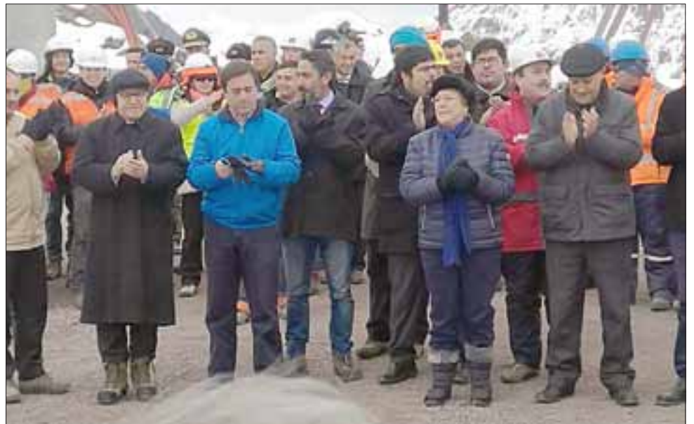
La Presidenta Michelle Bachelet encabezó la ceremonia de colocación simbólica de la primera piedra del nuevo complejo fronterizo Los Libertadores.

Dijo que con ello se está respondiendo a las demandas actuales del tráfico internacional y sobre todo a mejorar la calidad del ser-