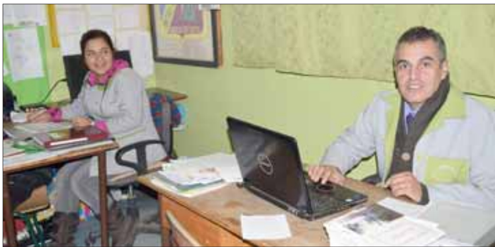
OCUPAN MÁS ESPACIO.- Esta oficina también está siendo usada como Sala PIE.

La situación que profesores y los 58 estudiantes de esa casa de estudios están viviendo, dice referencia a que la sala de profesores está siendo usada