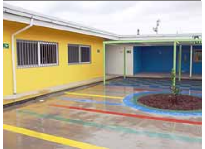
A partir del mes de junio abrirá sus puertas a 60 lactantes y 112 párvulos el nuevo jardín infantil y sala cuna 'Nicanor Parra', uno de los proyectos más grandes de la región de Valparaíso.

Entre las 10:30 y las 13:00 horas y desde las 14:30 a las 17:00 horas, se realizará el proceso de inscripción en el nuevo jardín infantil Nicanor Parra.