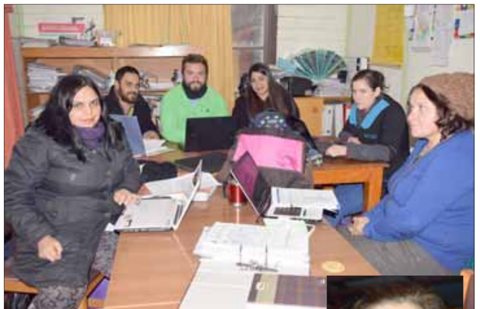
UN POCO APRETADOS.- Así están trabajando estos profesores de la Escuela Carolina Ocampo, de Bellavista.

como inspectoría y también para atender a los niños que están remitidos al PIE, situación que no deja espacio para una convivencia saludable, así, y aunque hasta el momento no haya un monto ahorrado, toda la comunidad educativa está moviéndose