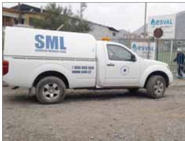
Personal de la PDI llegó hasta el sitio del suceso para investigar lo que podría ser un aborto provocado.