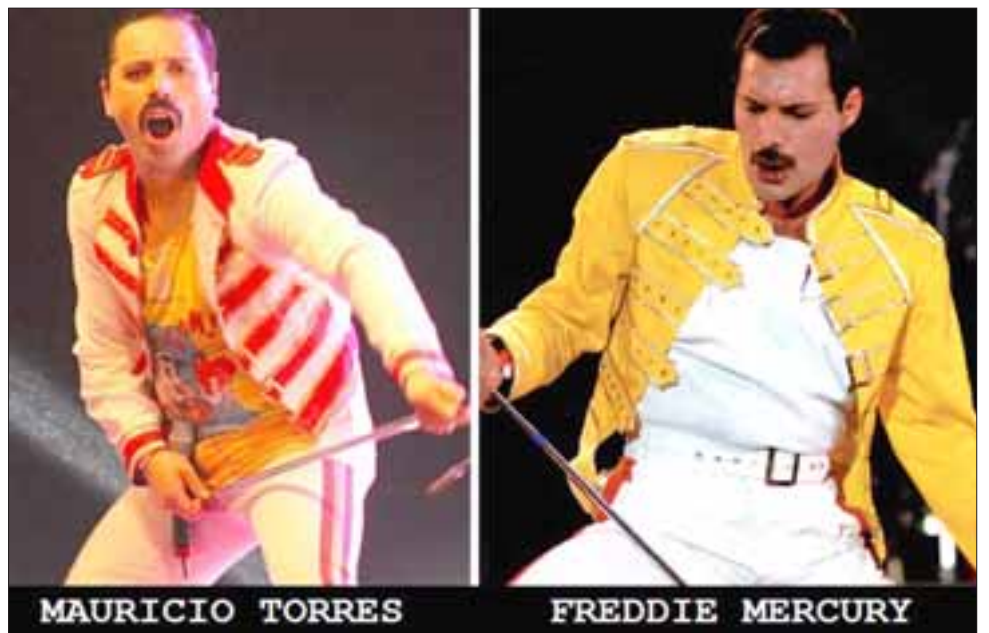
IDÉNTICOS.- Aquí vemos la intensidad que este artista chileno impregna a su personaje musical. A la derecha vemos al verdadero Freddie Mercury.

«Fue hasta 2011 cuando Mega , CHV y Canal 13 lanzaron programas televisados en búsqueda de dobles de grandes cantantes y nuevos talentos. Es esa la oportunidad en que yo, quien me desempeñaba como cantante en el bohe-