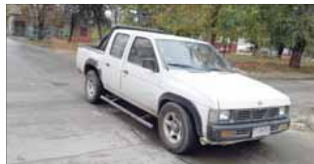
Este es el badén que deberá construirse de nuevo en Chacabuco con Salinas, por no cumplir con los estándares adecuados.

El problema tiene que ver con los asfaltos de color; "si la comunidad se ha percatado, los asfaltos de la ciclo vías son de un color terracota que está incorporado, es decir no es pintura, está incorporado dentro de la mezcla, es decir eso nunca más se va a pintar, ese pigmento no se fabrica en Chile, son proveedores extranjeros y la planta que provee este asfalto de color es una en Chile y esa planta tuvo una demora por parte de los proveedores americanos, de tal modo que llegó la semana pasada a puerto el asfalto, de tal modo que eso nos atrasó la manera que estaba pronosticado. Nosotros pensamos que las obras debieran estar concluidas entre el 15 y el 25 de junio aproximada-