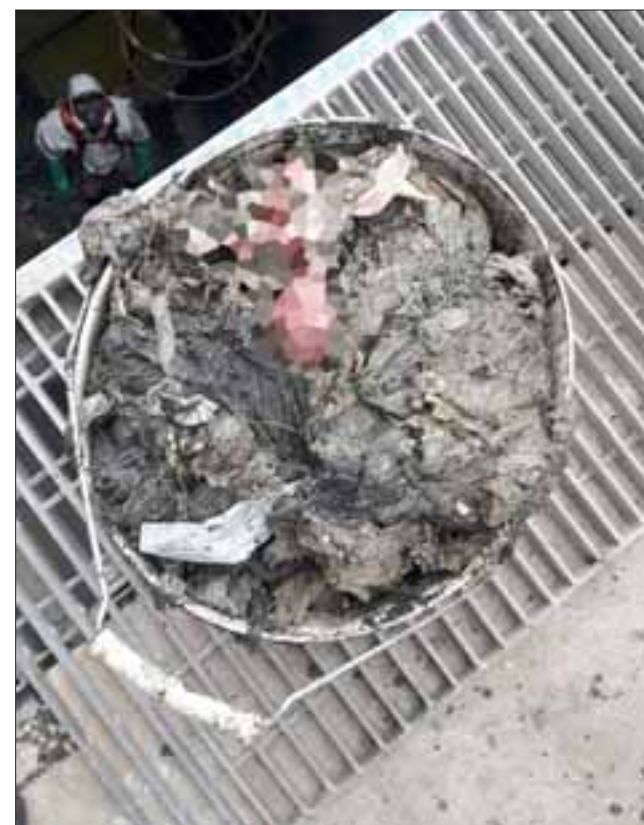
El macabro hallazgo de un feto de seis meses en el interior de la planta de aguas servidas de Esval en el sector Parrasía de San Felipe.