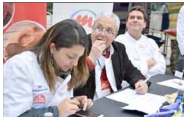
JURADO DEGUSTANDO.- El Jurado tuvo que aplicarse a fondo para poder llegar a determinar cuál marraqueta era la mejor.

personas, trabajamos todo el proyecto con otras catorce personas a cargo del transporte y montaje del escenario».