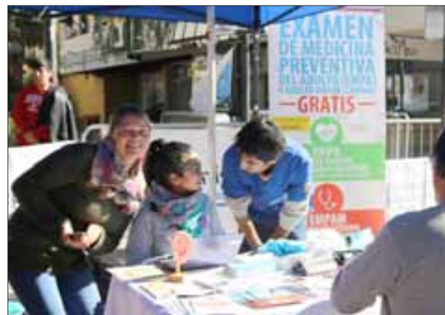
También acompañó la actividad la Mesa de Promoción de la Salud, con exámenes gratuitos para adultos y adultos mayores.

miso que el Alcalde Patricio Freire nos ha pedido de tener deporte para todos».