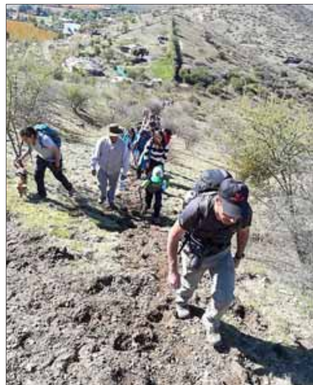
Pasado el mediodía los participantes comenzaron la subida al cerro, que presentaba una baja dificultad, y precisamente por ello estaba pensado para la familia.

El objetivo del municipio es precisamente potenciar el turismo de todo el valle de Aconcagua y convertirlo en un destino para los visitantes de todo el país, ya que este valle tiene muchos lugares para disfrutar.