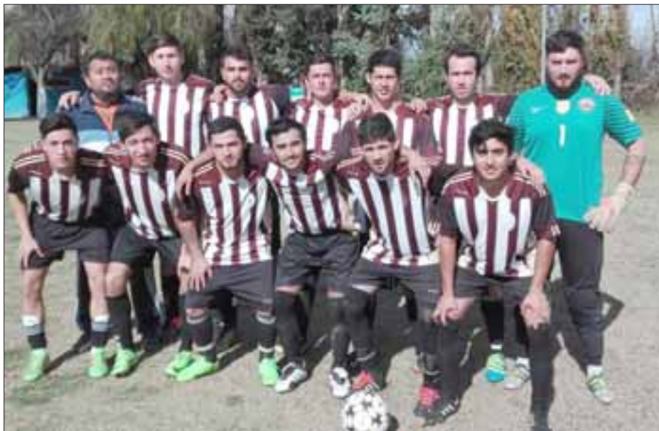
El club El Asiento se consagró como el mejor del grupo 2 del torneo Selim Amar Pozo.