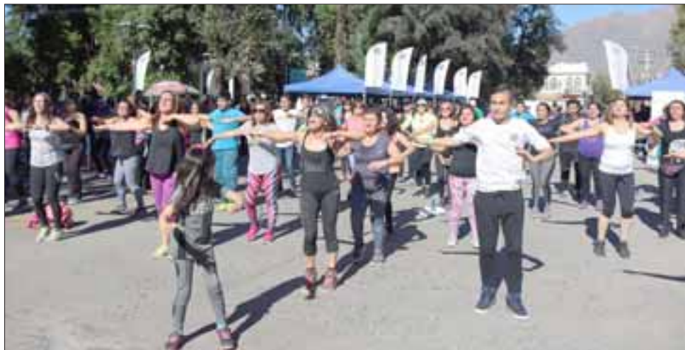
Alrededor de 300 personas participaron en la primera jornada de 'Calles Abiertas' de San Felipe.

Además Jiménez indicó la importancia de que las personas que estén en la actividad, ya sea participando activamente u observando, se inscriban para que de esta forma el ministerio del Deporte siga enviando programas a la comuna: «La idea es tener los datos de la mayor cantidad de personas (...) para poder demostrar a los demás, sobre todo al ministerio del Deporte, que la gente de San Felipe es motivada y que realmente viene a participar de la actividad. Así que la invitación es para que toda la gente, independiente de que