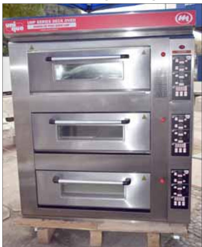
GRAN PREMIO.- Este es el modernísimo horno eléctrico que ganó Panadería Maipú, está valorado en unos $3 millones.

INTERÉS GENERAL.- Muchos sanfelipeños y autoridades de nuestra comuna asistieron a esta actividad, también comieron anticuchos y completos.