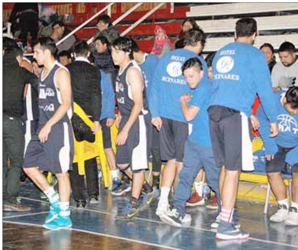
El equipo pratino sufrió otra derrota en la Libcentro A.

Puente Alto 72 - Sportiva Italiana 51; Brisas 63 - Sergio Ceppi 40; Stadio Italiano 60 - Liceo Curicó 65; Alemán 79 - Arturo Prat 74.