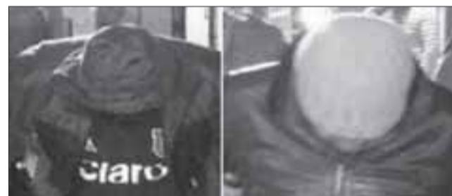
Los sujetos fueron detenidos por Carabineros de Llay Llay tras ser sindicados por la víctima como autores del delito de robo con violencia.