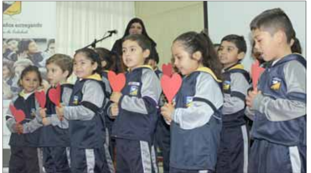
NUEVAS GENERACIONES. - En un plazo de 10 años más, los alumnos que egresen de la Escuela José de San Martín deberían dominar el idioma Inglés.

La Escuela José de San Martín ya había iniciado un trabajo importante el año 2016, al incorporar la plataforma Imagine Learning, que ha sido de gran utilidad para el aprendizaje del idioma inglés. Este año, este sistema continuará operando, pero se suma el aumento de las horas de clases de Inglés