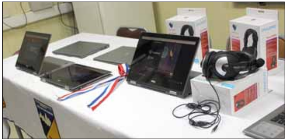
LABORATORIO TEMÁTICO. - Cuarenta laptops de última generación, marca Dell, por un monto cercano a los 30 millones de pesos, fueron inaugurados junto al lanzamiento del Sello Inglés.

ca Dell, por un monto cercano a los 30 millones de pesos, correspondientes a recursos de la Ley SEP y FAEP.