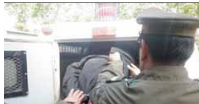
Los imputados fueron sometidos formalizados por el delito de robo con violencia cometido en el centro de la comuna de San Felipe.

La Fiscalía requirió ante este tribunal la cautelar de prisión preventiva para el