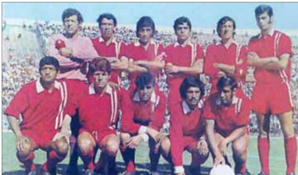
El glorioso Unión San Felipe que se coronó campeón los años 1970 y 1971.

los juegos tradicionales como depositarios de las memorias de nuestras comunidades.