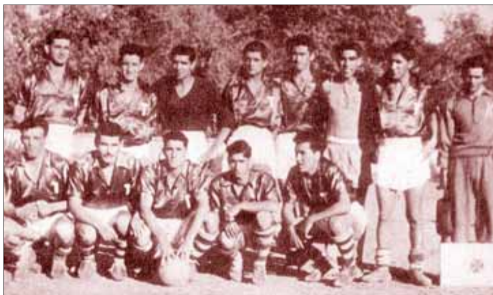
LOS PRIMEROS.- Unión San Felipe hizo historia desde que se creó con la fusión del Tarcisio y el Internacional, aquí con la primera formación en 1956.

El Consejo de Monumentos Nacionales ha enmarcado esta versión del DPC, como oportunidad para reconocer al deporte y