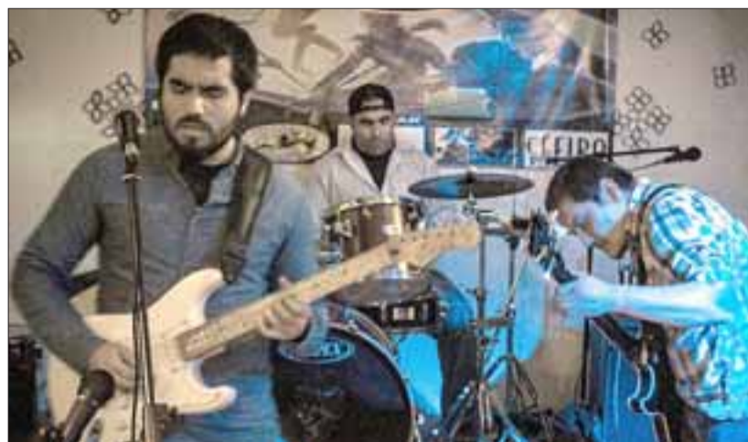
COCODRILO. - Ellos son los intrépidos músicos de Cocodrilo, quienes estarán haciendo de las suyas este viernes en San Felipe.

El blues rock que toca Cocodrilo es un género musical que combina elementos del blues y del rock, enfatizando en la utilización de la guitarra eléctrica. Este género se desarrolló en Inglaterra y en Estados Unidos a mediados de la década del 60 por grupos musicales como The Rolling Stones; Cream; Blue Cheer; The Beatles; The Yardbirds; The Jimi Hendrix Experience y The Doors , los cuales