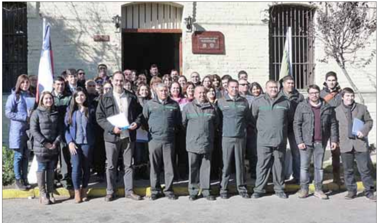
Integrantes de las áreas técnicas de los distintos establecimientos penitenciarios de Gendarmería en la región de Valparaíso, se reunieron en Putaendo para ver en terreno el funcionamiento de los Centros de Educación y Trabajo (CET).

«En la primera parte fue el encargado laboral quien dio a conocer todos los talleres que hay en la unidad y las prestaciones de servicios fuera de ella, que son en las empresas privadas. Des-