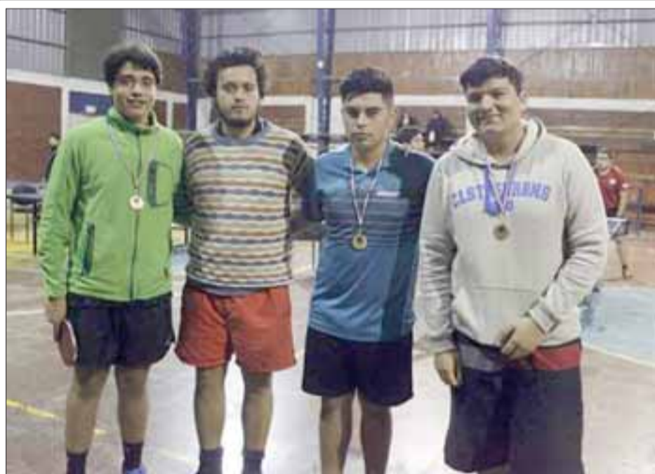
Aconcagua Tenis de Mesa cumplió una más que meritoria presentación en un abierto en Cabildo.