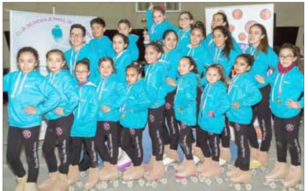
Y SIGUEN BRILLANDO.- Ellos son quienes brillan cual estrellas sobre sus patines en cada campeonato que participan.