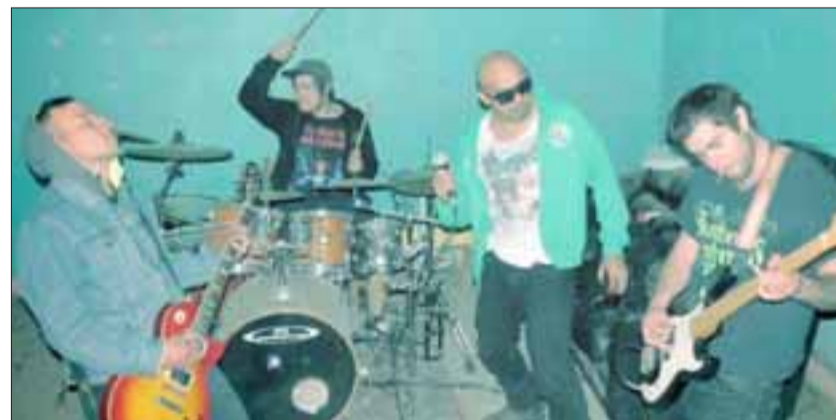
AGRESIÓN SÓNICA. - No se crea que son violentos, sólo que el nombre de esta banda es Agresión Sónica .