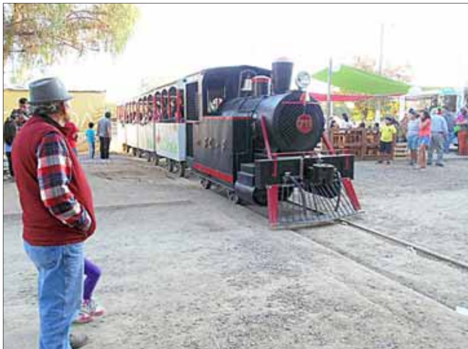
La Filan es una institución de Los Andes y el Concejo Municipal espera potenciarla.