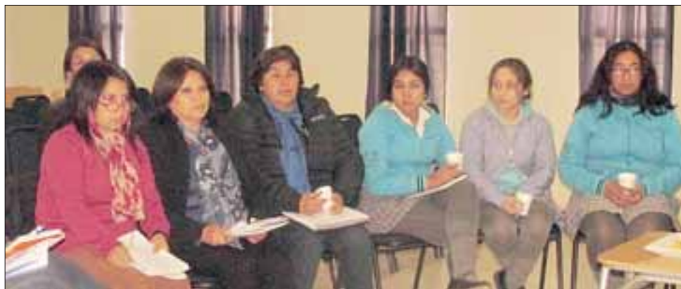
El Consejo Escolar permite trabajar y definir de manera conjunta el destino de recursos o priorizar iniciativas que son necesarias para el Liceo Corina Urbina.

Según dijo, el Consejo Escolar permite trabajar y definir de manera conjunta el destino de recursos o priorizar iniciativas que son necesarias para el liceo, tal como ocurrió en el último ampliado realizado el martes, cuando se discutió so-