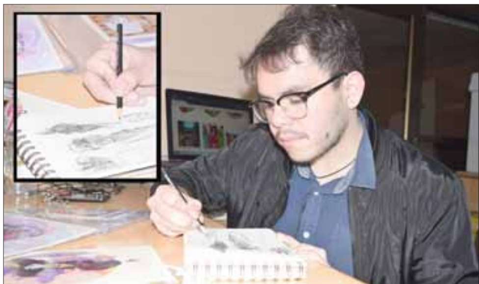
ACUARELA Y GRAFITO.- Este joven artista putaendino desarrolla sus creaciones a base de acuarela y grafito, tal como lo muestran estas gráficas.

- Específicamente lo que yo he creado con el pasar del tiempo, son Cartas Clown; ilustraciones tamaño póster; ilustraciones de modas; postales y stickers, así como otros trabajos gráficos. Estos trabajos de momento ya circulan en Internet y me compran muchas en las ferias donde participo regularmente.