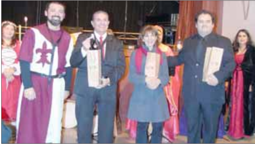
DETALLAZO.- Los directores de cada coro recibieron una botella del mejor vino del Valle de Aconcagua.