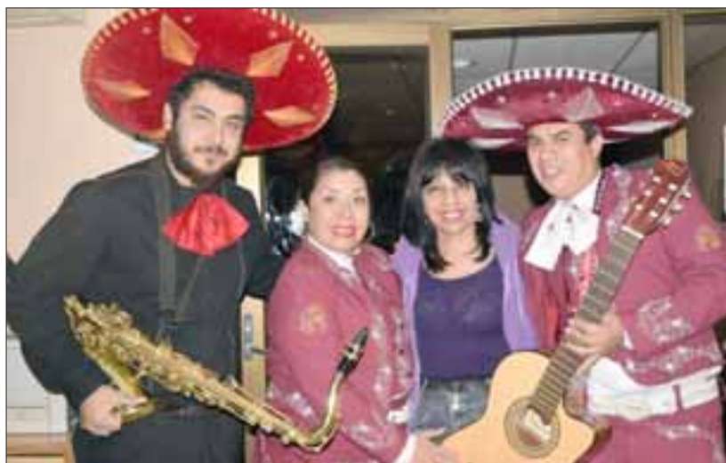
PARA EL DÍA DEL PADRE.- Los interesados en contratar a este grupo de músicos aconcagüinos pueden llamar al 986790031.