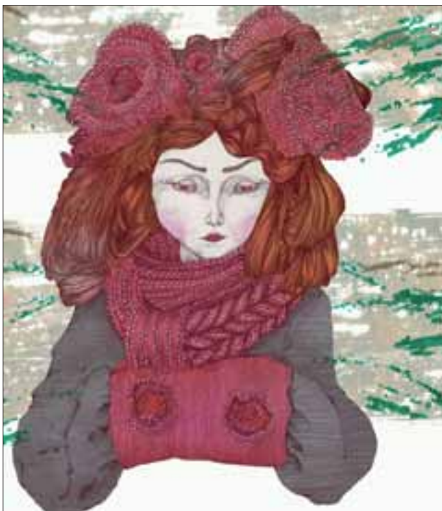
NUNCA SONRÍEN.- Estas modelos de 'Vlad Spium' jamás ofrecerán una sonrisa, pareciera ser el Sello de este artista.