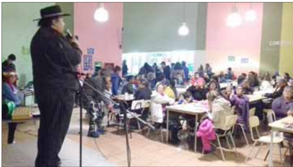
TALENTO NACIONAL. - Así lució este artista nacional en la Escuela Bernardo O'Higgins, iniciativa que busca conectar al Centro de Padres con la comunidad educativa.