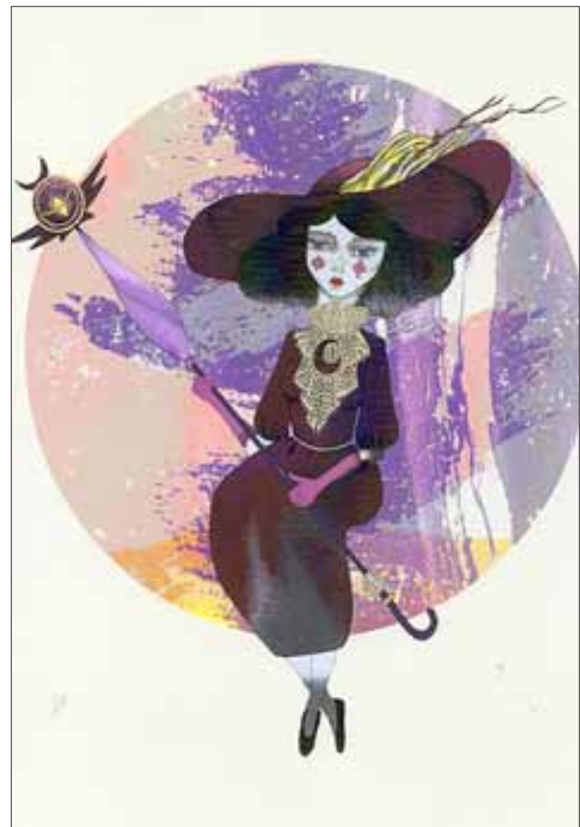
MÁS ILUSTRACIONES.- Seria y solitaria, esta brujita espera el Aquelarre nocturno para volar en su escoba.