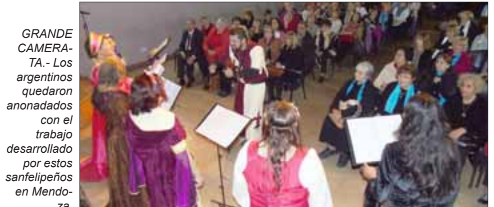
GRANDE CAMERATA.- Los argentinos quedaron anonadados con el trabajo desarrollado por estos sanfelipeños en Mendoza.