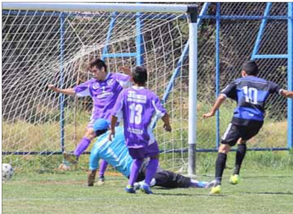
El 11 de junio arrancará la competencia de la Asociación de Fútbol Amateur de San Felipe.

Dentro de las bases de la competencia que ya fueron aprobadas por el consejo de presidentes, destacan las relativas a los clasificados a la Copa de Campeones, torneo al cual accederán el primero y segundo de la serie de Honor, mientras que el tercero de la tabla deberá jugar una fase previa de clasificación.