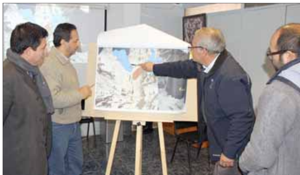
La empresa canadiense de Recursos Diversificados TECK, empezará sondajes durante el último trimestre de 2017, en una zona con importante concentración de glaciares de roca.

Cabe recordar que existe el antecedente de la infracción que la Superintendencia de Medio Ambiente cursó, este mismo 2017, a la Compañía Minera Vizcachitas Holding. Dicha entidad privada incumplió la normativa legal mientras realizaba sondajes en la Cordillera de Putaendo, con evidentes daños a la flora, fauna y a los cursos de agua. Por lo tanto, el municipio buscará todas las formas posibles para que situaciones de este tipo no sigan ocurriendo.