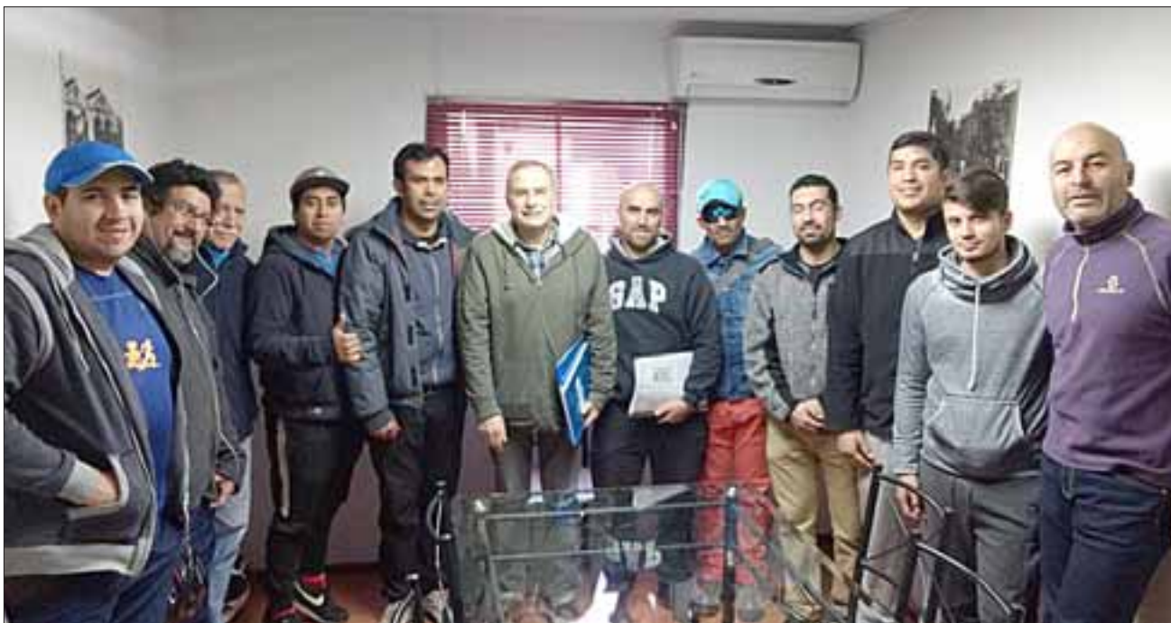
Alrededor de 35 personas, entre socios y competidores, constituyeron promisorio Club de Ciclismo San Felipe.

do durante los próximos días y que por diversos motivos no pudieron asistir a la constitución oficial.