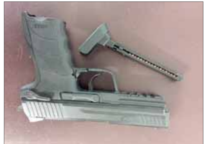
El armamento fue incautado por Carabineros de la Tenencia de Santa María, siendo detenido un hombre de 30 años de edad por el delito de amenazas.

Banda delictual irrumpió con armas golpeando a víctima