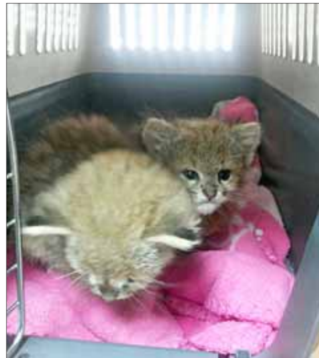
El Gato Colo Colo ( Leopardus colocolo ) se encuentra en peligro de extinción y está protegido por la Convención sobre el Comercio Internacional de Especies Amenazadas de Fauna y Flora Silvestre (CITES).

Servicio Agrícola y Ganadero puso a salvo a los pequeños felinos que perdieron contacto con su madre y se encontraban deambulando a metros del Camino Internacional.