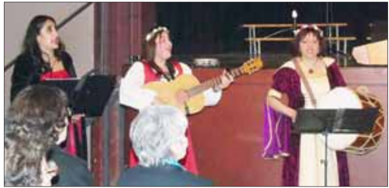
GRANDEZA CULTURAL.- Aquí tenemos a los artistas sanfelipeños poniendo bien en alto el nombre de nuestra comuna y de nuestro país.