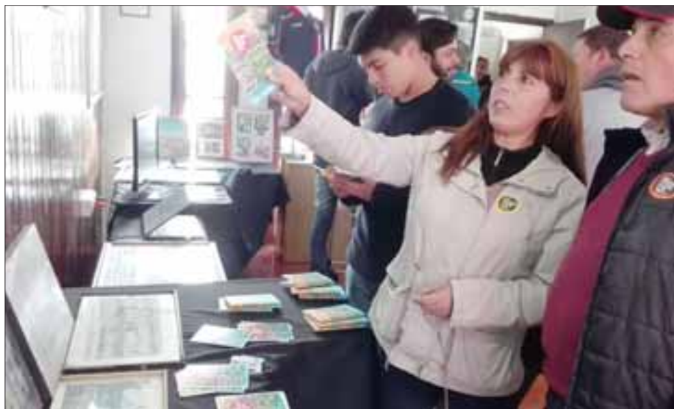
Un centenar de personas llegó hasta las dependencias del Club Unión San Felipe a revivir el pasado de la emblemática institución.

La exposición "Uní Uní: Patrimonio Vivo de Aconcagua" terminó cerca de las 19 hrs., con la satisfacción de haber permitido que las emociones brotaran y se fortaleciera la identificación del valle con su añorado Club.