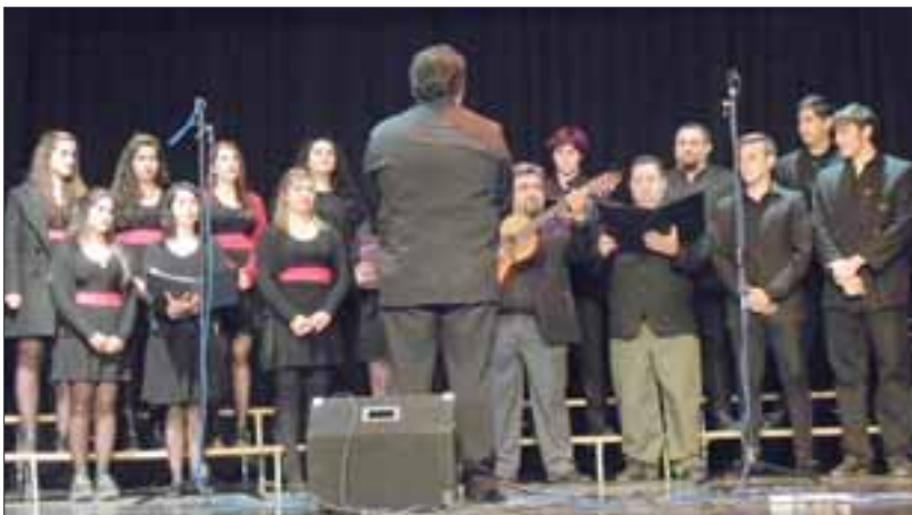
TALENTO ARGENTINO.- El Coro Instituto Chopin, de Argentina, fue otro que también brilló con luz propia.