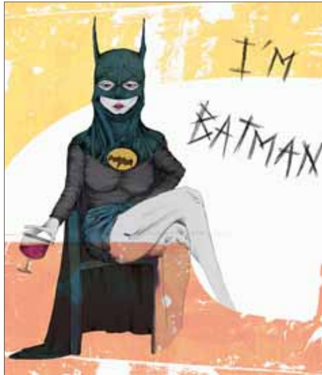
IDEAS ORIGINALES.- Ella, la chica del dibujo, con una copa en su mano intenta convencernos de que ella es Batman.