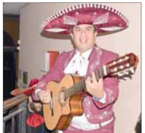
VISITA ESPECIAL.- Este es el momento en que los músicos irrumpieron en nuestra Sala de Redacción, el personal de Diario El Trabajo estaba muy contento por la agradable visita.