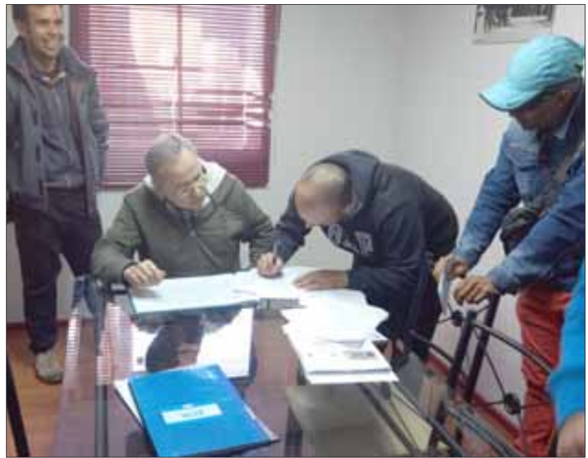
Este sábado se constituyó formalmente el Club de Ciclismo San Felipe en notaría de la comuna.