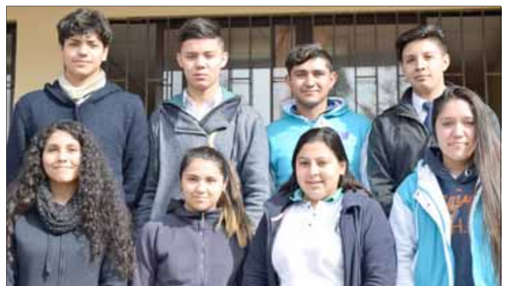
CENTRO DE ALUMNOS.- Aquí tenemos al Centro de Alumnos del Fritis, jóvenes ejemplares que lideran esta iniciativa en Putaendo.