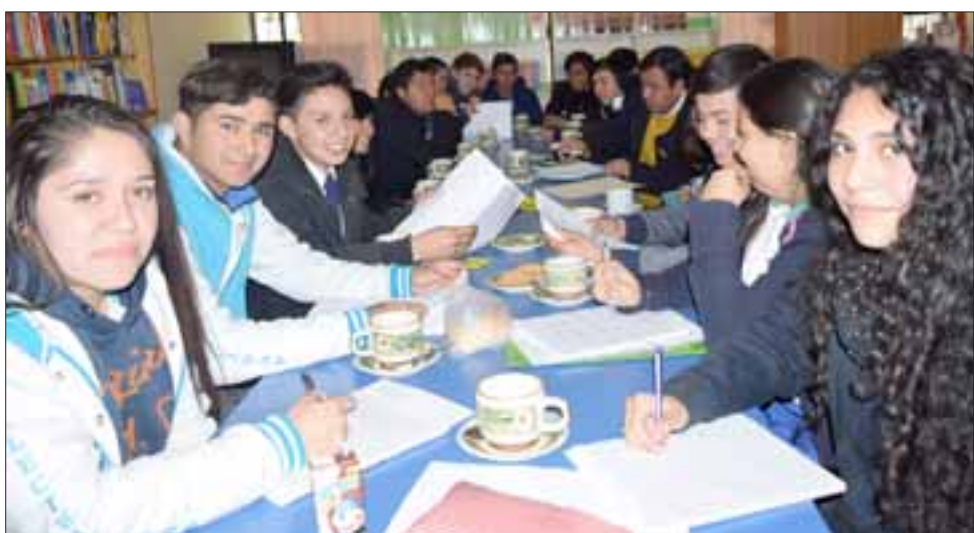
LIMPIEZA PARA LA NUEVA CHACABUCO.- Las cámaras de Diario El Trabajo tomaron registro de la reunión desarrollada ayer jueves en torno al operativo a desarrollarse el próximo viernes en horas de la mañana.