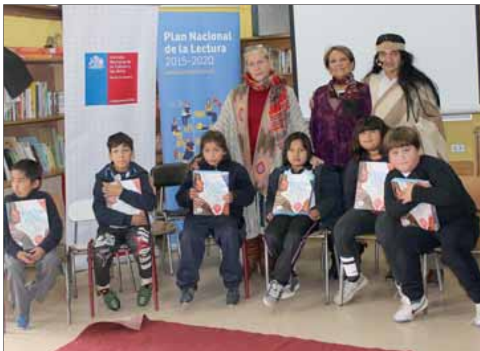
El Plan Lector considera un acercamiento de un escritor con alumnos que con un mes de anticipación, leyeron su obra.

brando en San Felipe con diversas actividades. Recordemos que en la jornada del martes se realizó una inter-