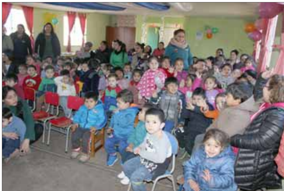
La actividad tenía por objetivo ser un espacio de encuentro entre las educadoras, los pequeños y sus padres y apoderados.