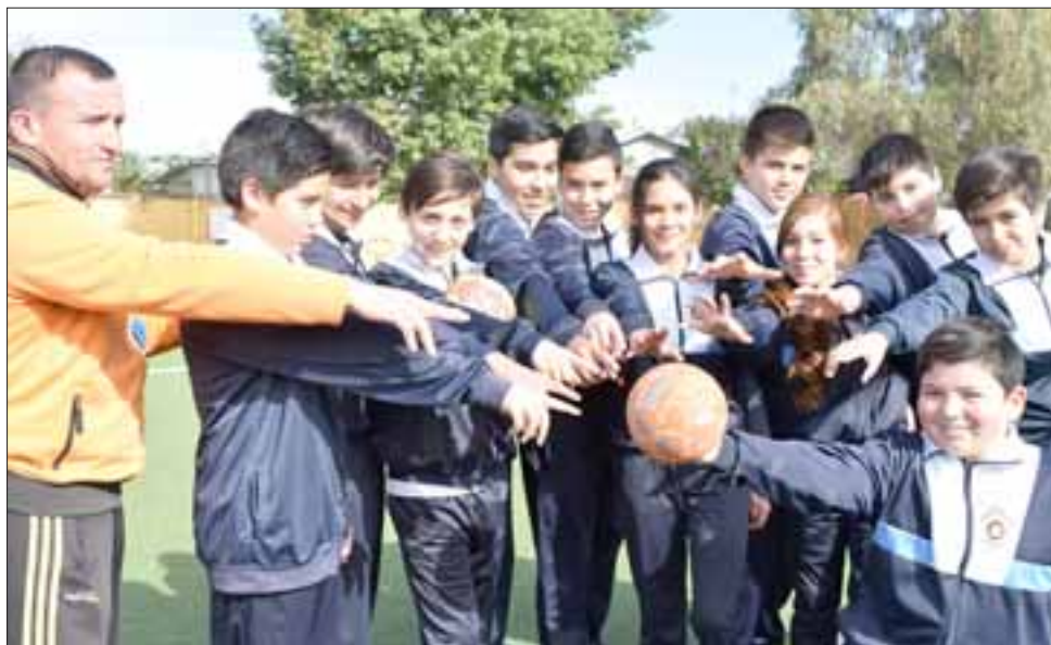
TIGRES DEL HÁNBOL.- Ellos son la Selección de Hándbol combinada del Colegio Marie Poussepin, de Putaendo.