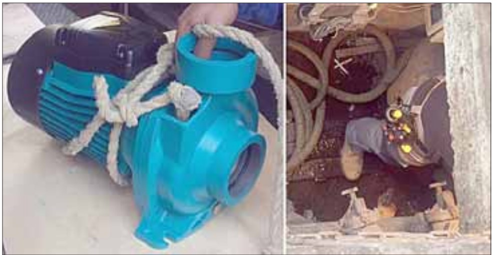
TRAS SIETE MESES.- Ayer fue instalada la nueva bomba de agua en la pileta de nuestra Plaza de Armas, pero hasta hoy viernes al mediodía la misma estará en perfecto funcionamiento.