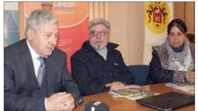
El convenio firmado permitirá la ejecución del Proyecto Internacional NEO, iniciativa que espera favorecer la inserción laboral de 12 mil jóvenes en tres años en la región.

portante disponer de nuevos elementos de empleabilidad para los jóvenes. Creemos que nos servirá mucho y esperamos incorporar al Liceo Roberto Hummeres y al Liceo San Felipe. Nos llama la atención el aporte que hace NEO y agradezco esta iniciativa, donde sabemos que tiene un positivo impacto”, señaló el director de Educación Municipal.