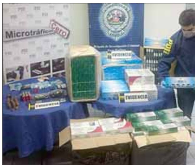
En total fueron 2.693 cajetillas de cigarrillos de contrabando de diferentes marcas internacionales las incautadas.