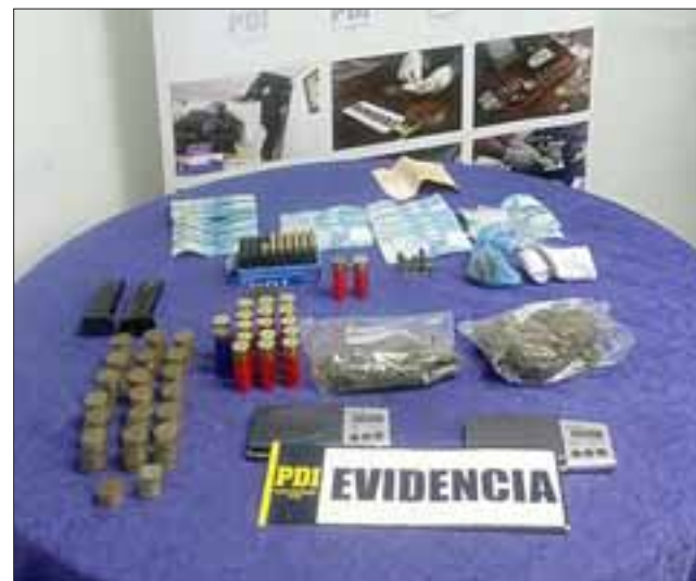
Un total de 129 gramos de cannabis sativa, dos pesas digitales y $389.650 fue parte de la incautación en el domicilio de la imputada.