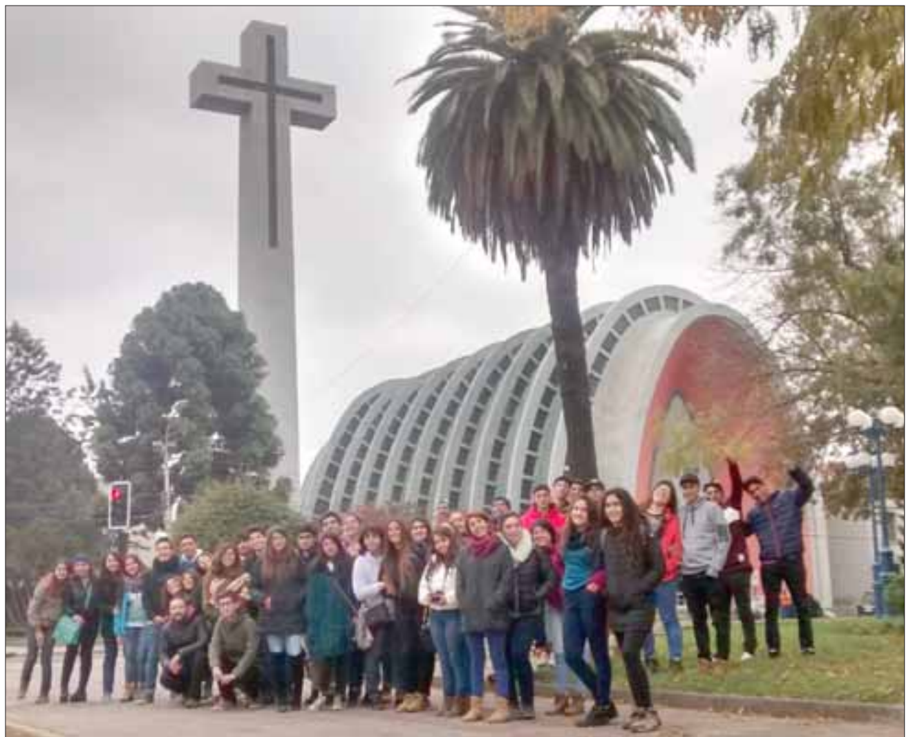
La Catedral de Chillán fue una de las tantas postales que los alumnos compartieron con sus padres a través de un grupo de Whats App.

“Se da una buena dinámica, de conducta, de amistad, que ellos atesoran como uno de los grandes fuertes del viaje. Estos viajes favorecen un aprendizaje in situ, de sitios con gran connotación histórica, pa-