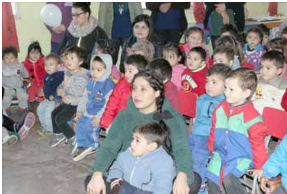
Los integrantes de la compañía 'Puro Cuento' lograron concitar el interés de los pequeños.

En la ocasión, fueron muchos los papás y mamás que llegaron a la actividad, donde al cabo de este encuentro la directora les formuló una invitación para continuar participando en este maravilloso proceso de aprendizaje y desarrollo de sus hijos.