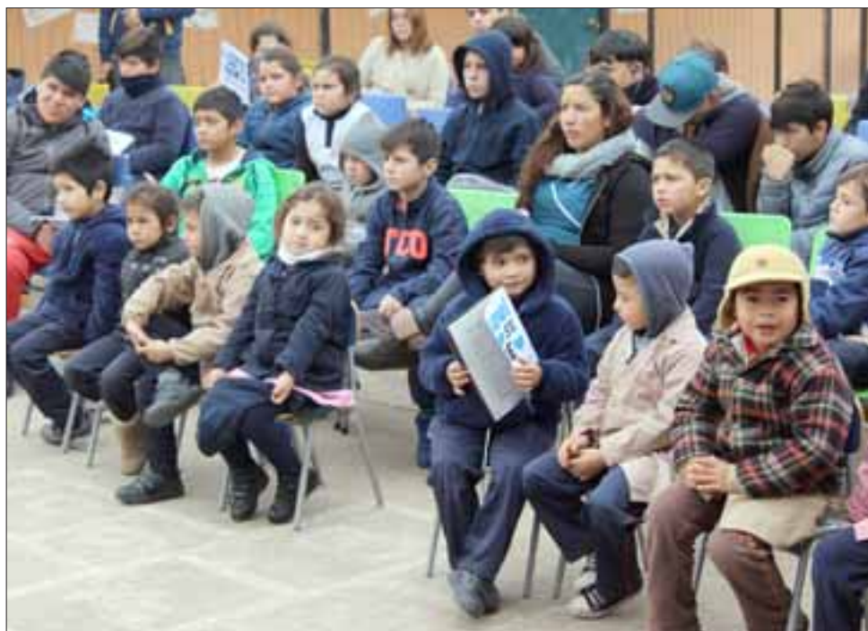
La Escuela Manuel Rodríguez fue el escenario escogido por el Consejo de la Cultura y las Artes para desarrollar este hito regional.

La Semana de la Educación Artística se está cele-