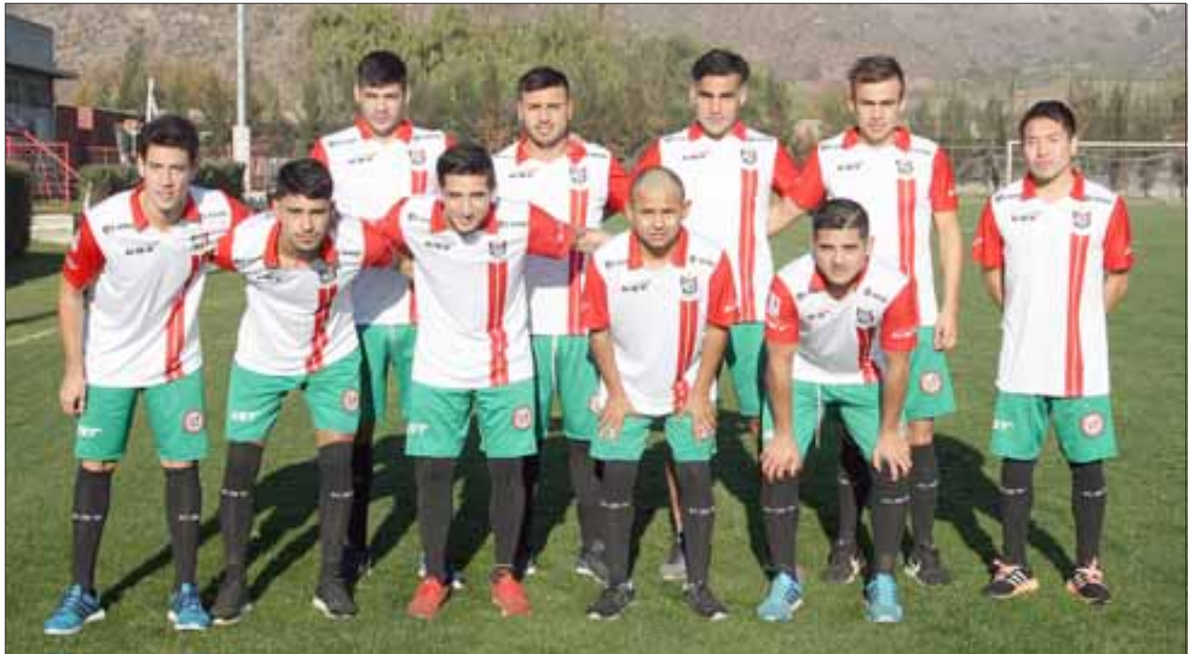
La escuadra albirroja sumó 10 refuerzos para la próxima temporada.

Respecto a los objetivos para el Transición y la Copa Chile, el entrenador dijo: “Hay que convencer a los jugadores que esto es trabajo más trabajo, para así poder alcanzar una línea