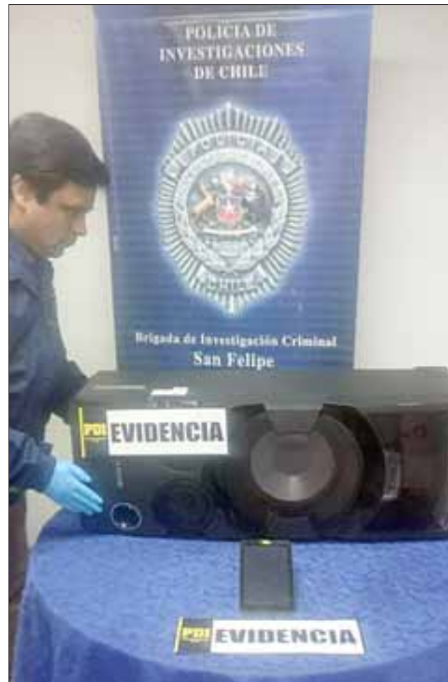
La Bricrim de la PDI de San Felipe recuperó una Tablet de 7" marca Kioto y una radio musical marca Sony que fueron robadas en el sector Hacienda de Quilpué de esta comuna.