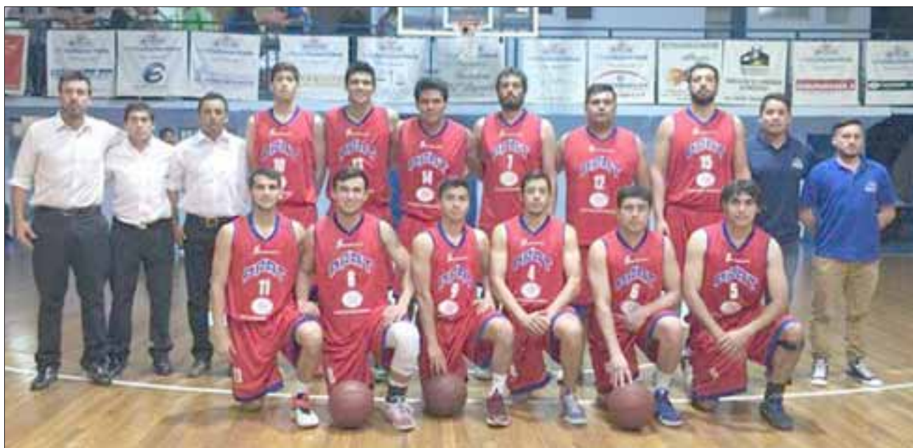
El conjunto sanfelipeño tendrá el sábado una buena ocasión para ratificar su alza y despegar de manera definitiva en la Libcentro A.