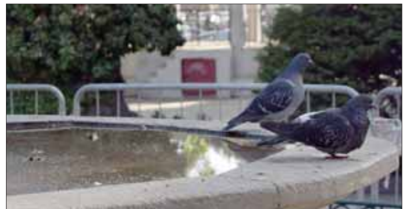
PALOMAS ESPERAN.- Estas palomas serán las más felices, pues llevan siete meses bebiendo agua sucia de la periferia de la ciudad.

NUEVO CHEVROLET SAIL: DETALLES QUE TE VAN A ENCANTAR, UNA CUOTA QUE TE VA A SORPRENDER.