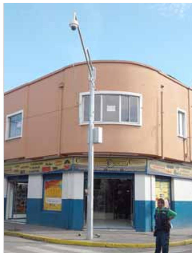
Esta es la cámara de tele vigilancia ubicada en la intersección de las calles Santo Domingo con Coimas, que no estaba funcionando el día del asalto al Servi Estado.

- "Sí, acabamos de poner en funcionamiento a través de un sistema de modernización, la red de cámaras que está en el perímetro del damero central. Hay que recordar que cuando ocurrió el homicidio de la niña en el archivo municipal, en la esquina de Prat con Traslaviña tenemos una cámara, pero estaba sin funciona-