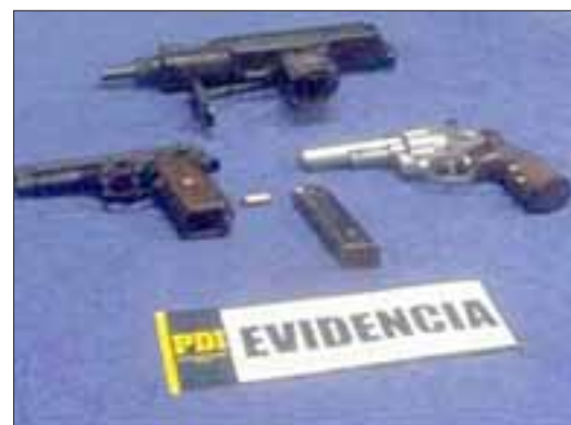
Las armas de fuego incautadas por la PDI la tarde de este miércoles en la Villa San Camilo de San Felipe.