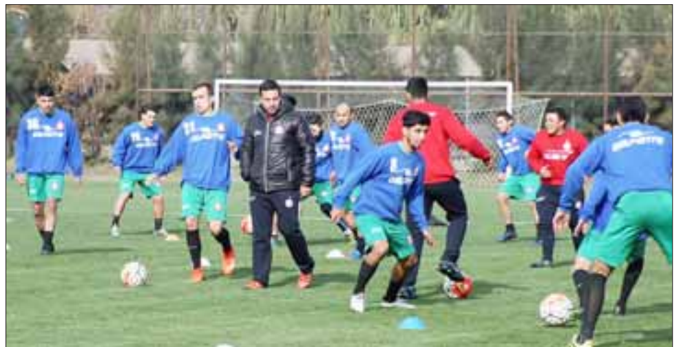
En horas de la mañana de ayer Unión San Felipe partió con el trabajo de Pretemporada.

cada deporte. Por ejemplo, en Fútbol el entrenamiento funcional entrena la resistencia corriendo con cambios de dirección a distintas velocidades, saltar más, correr de espaldas, etc. Cuando esta preparación es así de específica al deporte, ocurre que luego en un partido, el cuerpo se familiariza con los movimientos y se hacen más automáticos y controlables. Otro efecto de este método es el bajar el riesgo de lesiones musculares y por consecuencia permite mejorar los peaks de rendimiento del deportista.