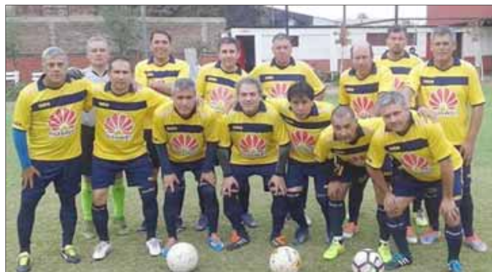
El torneo estelar de la Liga Vecinal ya está en su décima jornada. En la imagen aparece la escuadra de Tsunami.

La finalísima comenzará a jugarse a partir de las tres de la tarde y Arfa Quinta, que es la que organiza el evento, ha velado para que el espectáculo pueda desarrollarse sin contratiempos y a gran nivel, para que a eso de las cinco de la tarde el mejor de la región -que esperamos sea Almendral Alto- esté celebrando y levante la ansiada Orejona.