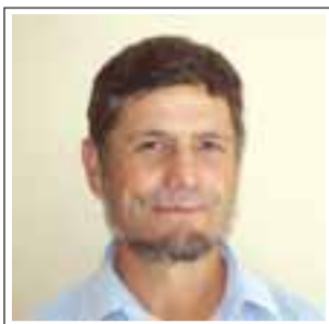
esperan el alimento.

Con mi carita pintada debo aguantarme el aliento porque en mi casa mis hijos