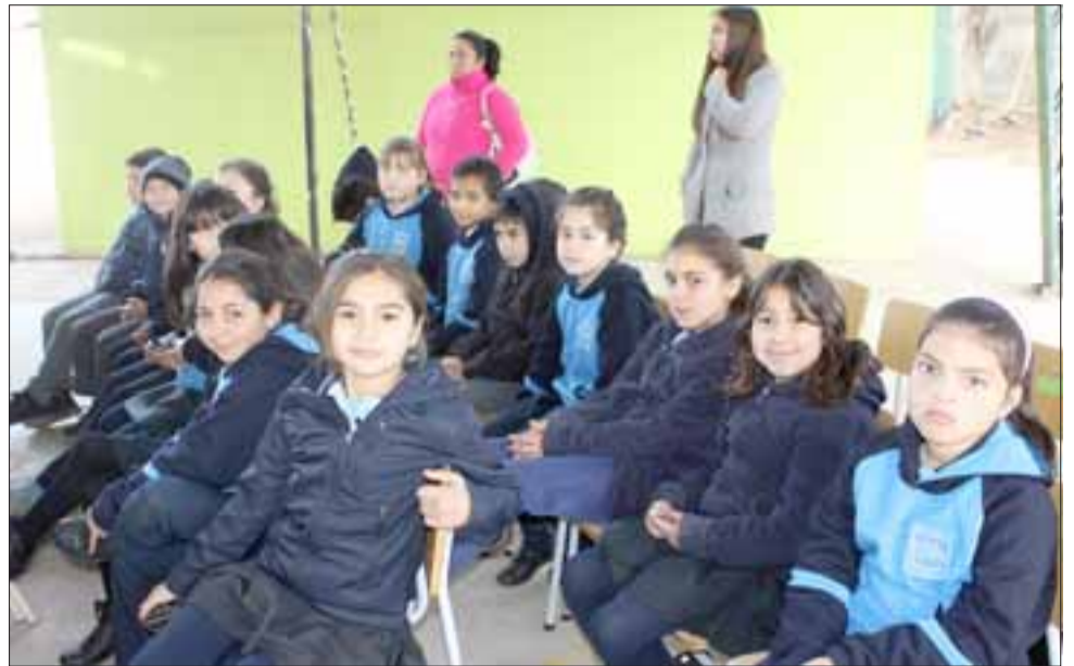
Con la entusiasta participación de los alumnos se realizó la ceremonia de celebración del aniversario número 67 de la Escuela 21 de Mayo.

Por cierto, aseveró que está convencido de la misión de hacer que los niños y niñas sean más felices, pues eso es al final lo que cuenta y lo que verdaderamente importa.