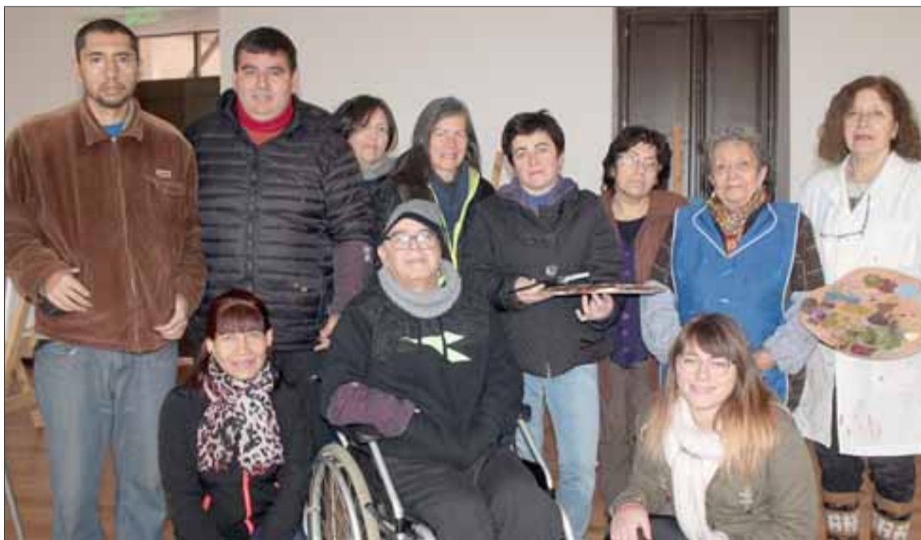
PINTORES LOCALES. - Ellos son sólo una parte de los sanfelipeños que desde hace muchos años vienen desarrollando sus talentos en estos talleres que se imparten en los talleres de Cultura.

diz sobre la exposición Travesía Surreal y también sobre sus talleres de pintura.