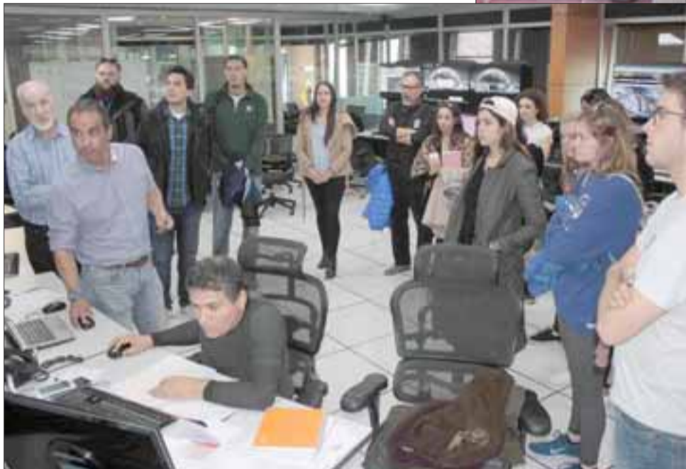
En el Centro Integrado de Operaciones (CIO), la delegación conoció la operación remota de los procesos mineros.