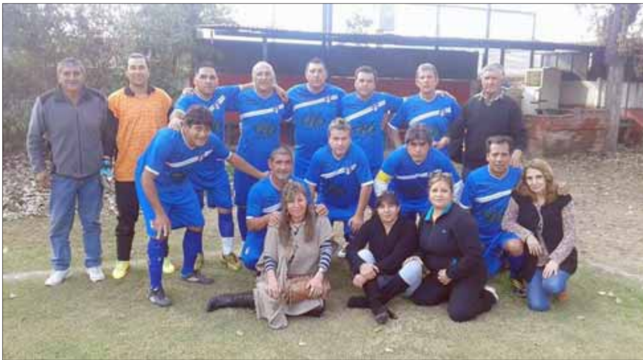
Unión Esperanza abrirá la próxima fecha del torneo de la Liga Vecinal.

dro Aguirre Cerda; Andacollo – Villa Los Álamos; Barcelona – Villa Argelia; Los Amigos – Carlos Barrera; Santos – Tsunami; Hernán Pérez – Resto del Mundo.