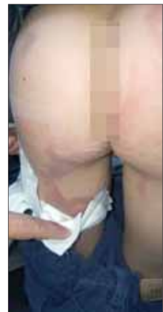
Las quemaduras si bien no fueron profundas, resultaron bastante dolorosas, alcanzando parte de las piernas.

Intentamos comunicarnos con la tienda al fono que aparece en su publicidad, pero dice que el teléfono no está disponible.