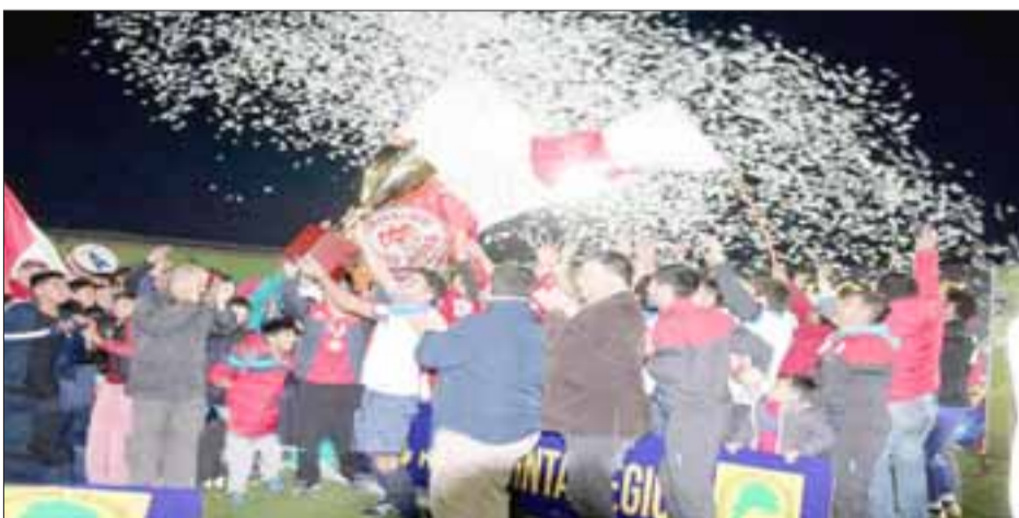
Almondral Alto se convirtió en el quinto club aconcagüino en consagrarse como el mejor de los mejores de la Quinta Región.

Ser campeón de la región es algo mayor y excluyente, tanto que en el valle de Aconcagua se cuentan con dedo de una mano los elegidos que han podido dar una vuelta olímpica como el mejor de los mejores; así que desde el domingo pasado: Ambrosio O'Higgins, San Carlos, Las Bandurrias y Viña Errázuriz, estarán acompañados hasta la eternidad en el olimpo de los campeones por Almondral Alto. Felicitaciones, celebren y disfruten este momento por siempre.