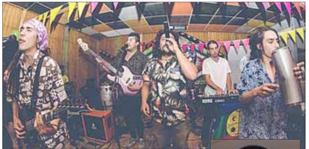
ESPECTACULAR. - Esta banda sanfelipeña ofrecerá una presentación gratuita a partir de las 20:00 horas en el teatro municipal de San Felipe.

Esta es una de las agrupaciones musicales locales más populares del Valle, misma que pretende atesorar en su nombre y esencia el legado histórico de la época cañera, que dio vida y trabajo a los pobladores de nuestro Valle.