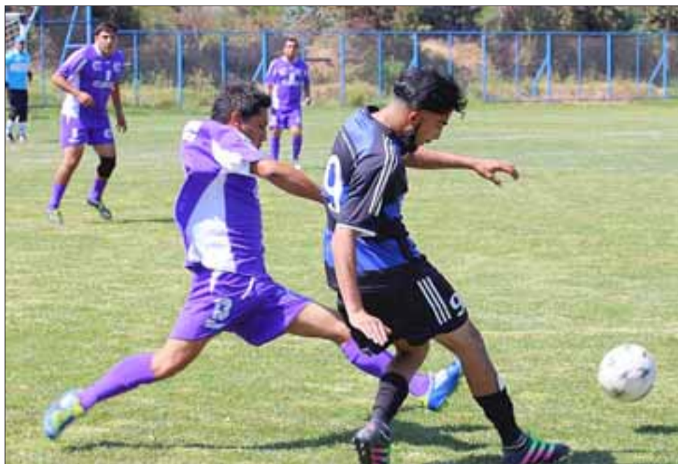
Este domingo se jugará la primera fecha del torneo oficial de la Asociación de Fútbol sanfelipeña y culminará el Amor a la Camiseta.

Desde las 11 horas de este domingo en el estadio Regional de Los Andes, el torneo Amor a la Camiseta 2017 llegará a su fin, después de meses de ardua competencia y una final