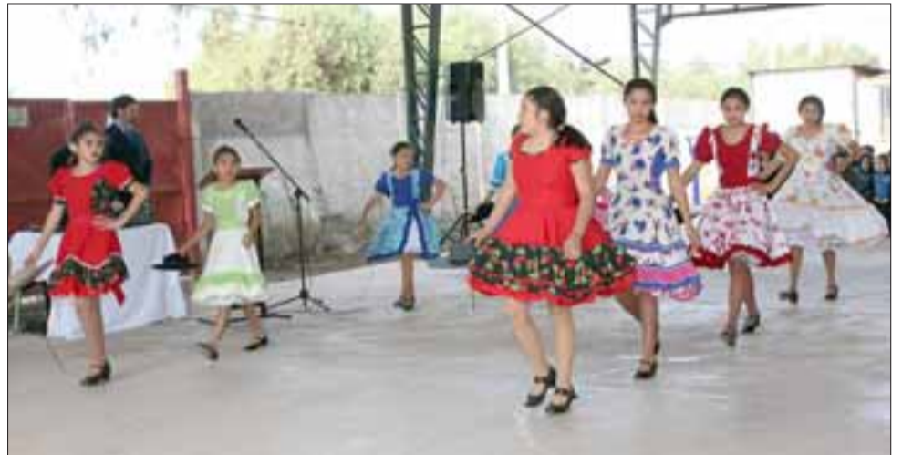
Alumnos de la escuela 21 de Mayo y Heriberto Bermúdez de Algarrobal, presentaron atractivos números artísticos.