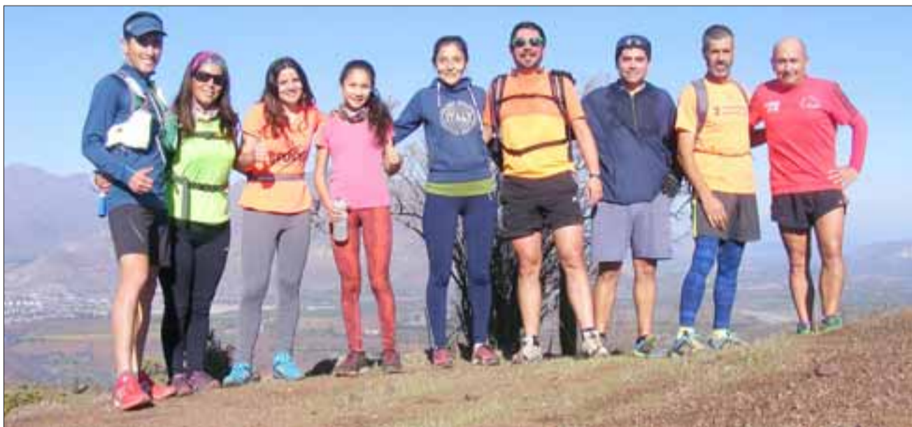
Los integrantes de Aconcagua Trail Running buscarán estar dentro de los mejores del Trail que este sábado tendrá lugar en Putaendo.

La carrera pasará por los distintos senderos de la histórica comuna aconcagüina, la que vivirá un sábado febril y muy intenso por la gran llegada de atletas y público en general que querrán ser parte del evento, en el cual el grupo Aconcagua Trail Running intentará meter a algunos de sus integrantes dentro de los respectivos podios, debido a que en Putaendo serán puestas a prueba las intensas jornadas de entrenamientos y preparación.