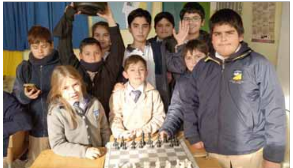
AMANTES DEL AJEDREZ.- Este es un grupo de escolares de la Escuela José de San Martín, quienes juegan ajedrez durante todo el año lectivo.