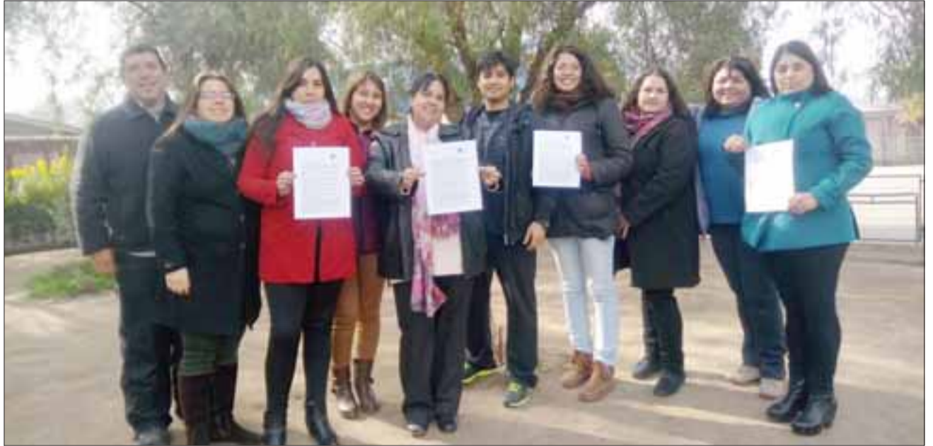
El equipo del Programa de Integración Escolar ideó un sencillo pero útil sistema de conceptos y términos necesarios para que docentes y comunidad escolar puedan relacionarse con alumnas PIE.

cen al Programa de Integración Escolar (PIE). La iniciativa, que justamente surge desde el equipo PIE del establecimiento, ha generado aceptación al interior del cuerpo directivo y docente, quienes ven en este proyecto, una forma sencilla y útil para ir en apoyo.