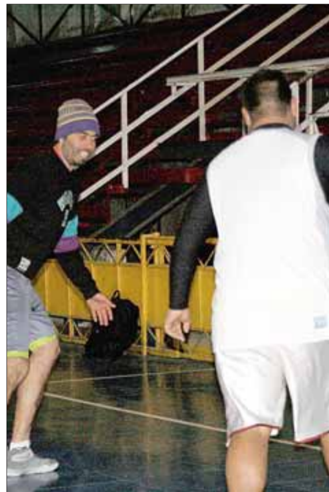
El Prat entrenó fuerte para poder quedarse con el juego de mañana frente a Liceo Curicó.

20:00 horas: Arturo Prat - Liceo Curicó; Sportiva Italiana - Stadio Italiano; Alemán - Sergio Ceppi; Brisas - Puente Alto.