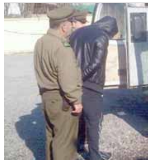
El condenado fue detenido por Carabineros de la Tenencia de Santa María, quedando a disposición de Gendarmería.

Tribunal lo sentenció a 818 días de cárcel: