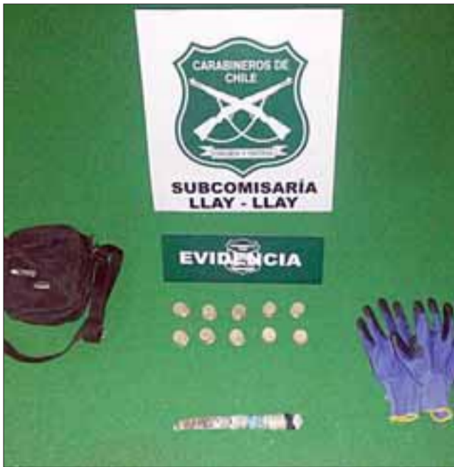
Un total de $10.200 en monedas y un cuchillo artesanal incautó Carabineros tras la detención del delincuente durante la madrugada de ayer miércoles en la población Padre Hurtado de Llay Llay.