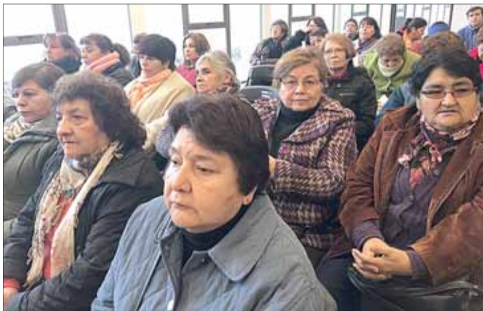
En el Centro Cultural Buen Pastor se desarrolló la primera de varias capacitaciones que se realizarán en lo que queda del año.

Michelle Bachelet tienen que ver con un requerimiento de la ciudadanía y ellos son los principales actores», dijo al dar por iniciada la actividad.