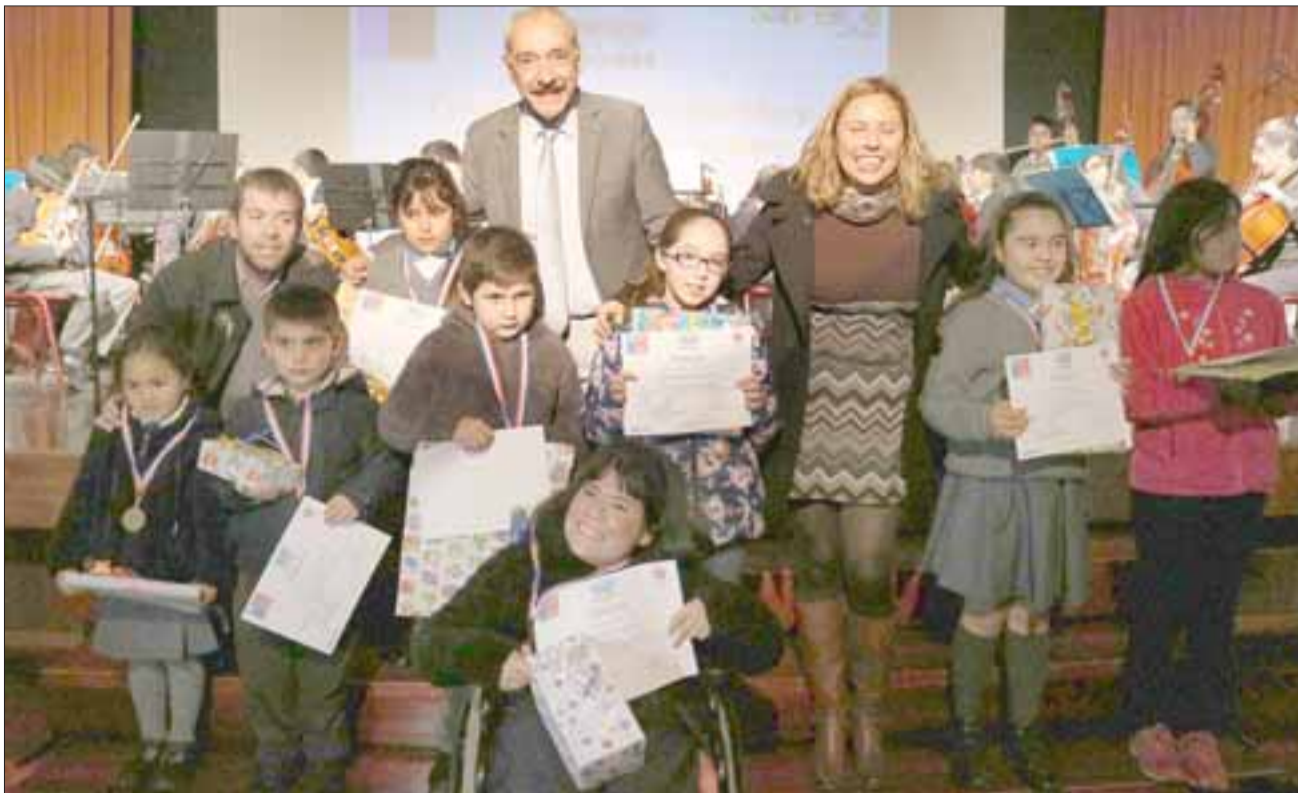
Más de 400 estudiantes de diversos establecimientos educacionales de la comuna participaron en el concurso de dibujo, pintura y video 'Yo me sumo a la prevención'.

«Destacar el apoyo que el Alcalde ha tenido en relación al programa Senda Previene en San Felipe y que nos ha permitido tener buenos resultados a lo largo del tiempo y hoy ser uno de los programas que está más fortalecido a nivel regional».