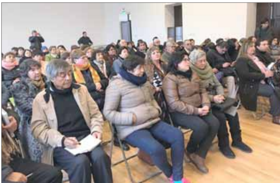
Alrededor de 70 dirigentes de las provincias de San Felipe y Los Andes concurren a la cita organizada por la Seremía de Gobierno de Valparaíso.