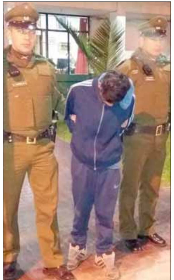
El antisocial apodado 'El Pirigua' fue capturado por Carabineros de la comuna de Llay Llay cometiendo el robo de dinero al interior de un local comercial.