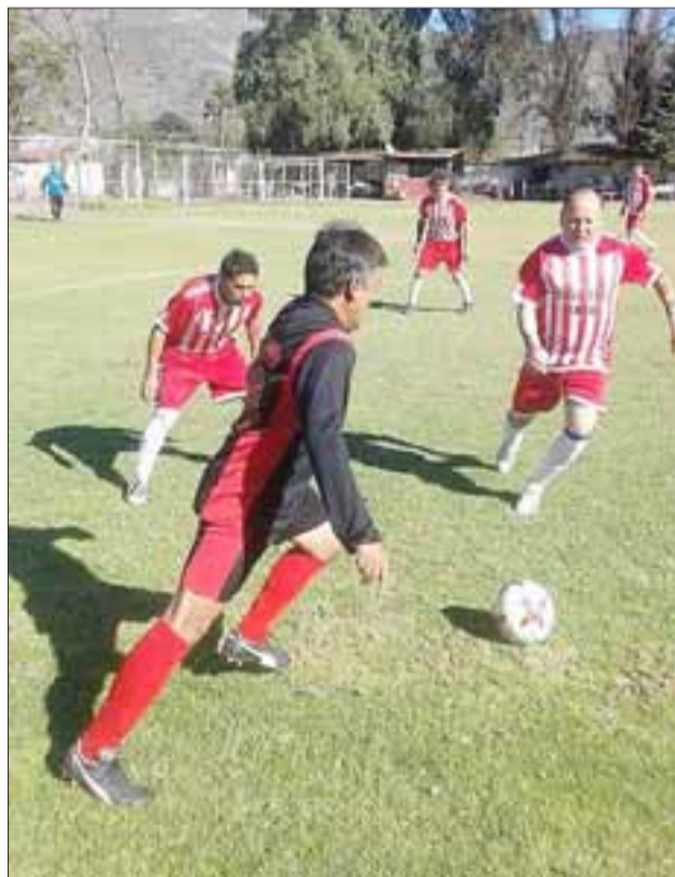
Una fecha que dejó de manifiesto que las fuerzas se comienzan a equiparar, fue la que se vivió el domingo último en Parrasía.

Unión Esperanza 0 - Aconcagua 3; Pedro Aguirre Cerda 0 - Unión Esfuerzo 2; Andacollo 3 - Villa Los Álamos 2; Barcelona 4 - Villa