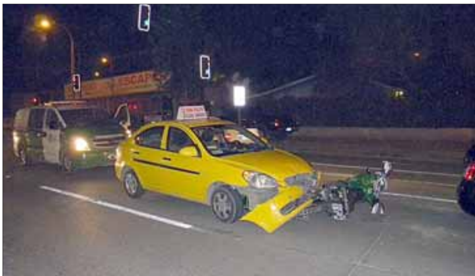
El funcionario policial colisionó con un taxi colectivo que lo lanzó contra otro vehículo de alquiler, resultando ileso.

Personal de la SIAT adoptó el procedimiento correspondiente al estar involucrado un vehículo institucional. No obstante ello la circulación por esa arteria no se vio interrumpida.