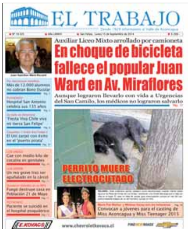
En nuestra portada del lunes 15 de septiembre de 2014 consignamos la trágica noticia.

Recordó que al momento del accidente, su suegro venía con todos sus elementos de seguridad, porque era muy precavido en ese aspecto.