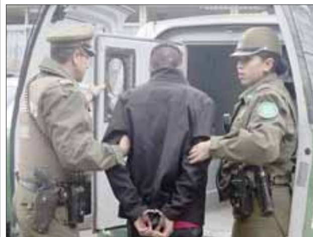
El sujeto fue detenido por Carabineros, acusado de usurpar la identidad de otra persona. (Foto Archivo).