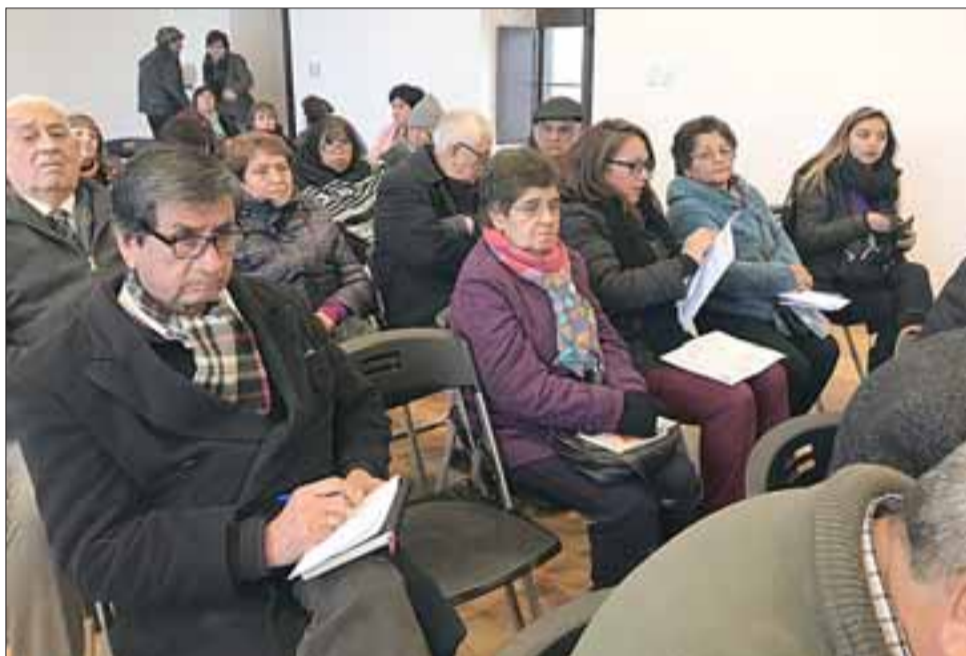
Numerosos dirigentes sociales participaron en la jornada de capacitación.