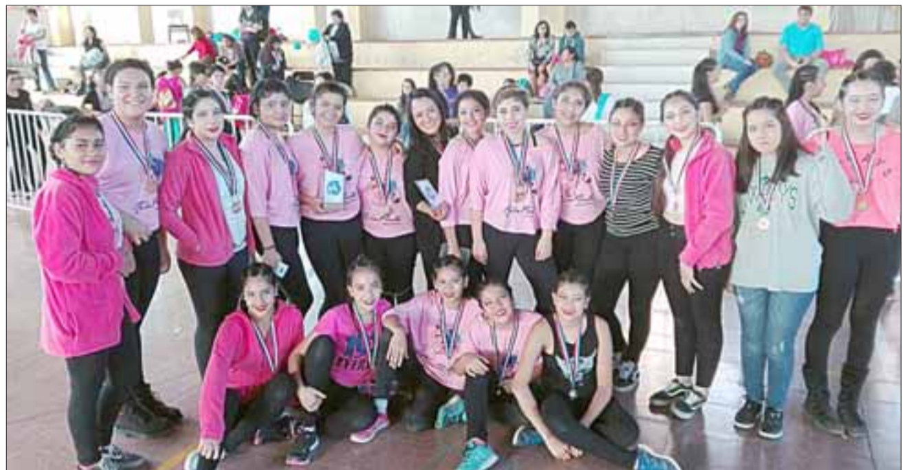
IMPERDIBLE.- El próximo jueves 6 de julio estos chicos realizarán una gala especial en el teatro del Liceo Politécnico Roberto Humeres, a las 18:30 horas, oportunidad en la que ofrecerán sus mejores galas a los presentes.