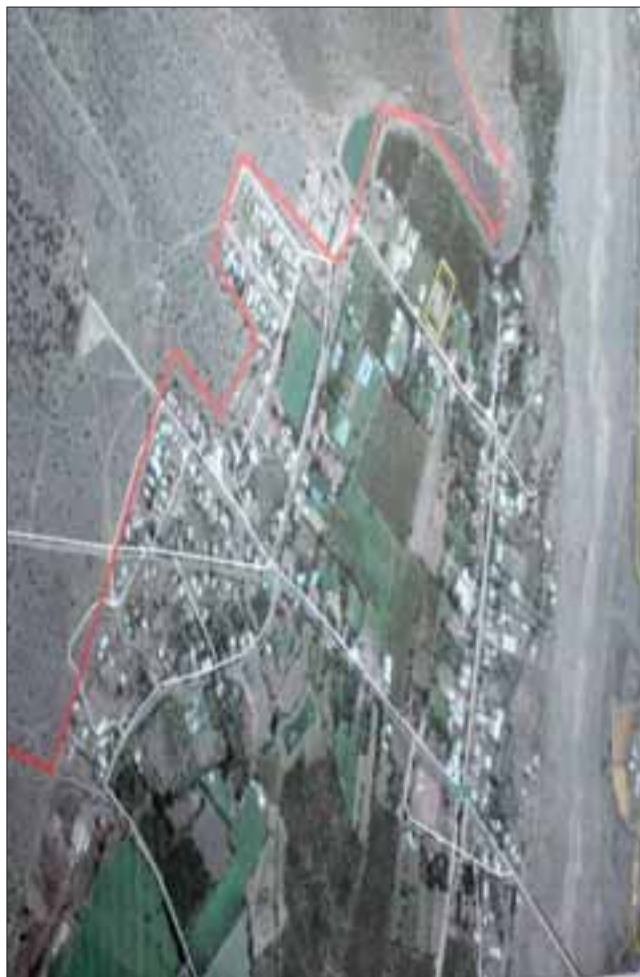
DESDE ARRIBA.- Esta es una vista aérea de El Asiento. La línea roja señala el fin del pueblo y el límite de los comuneros.