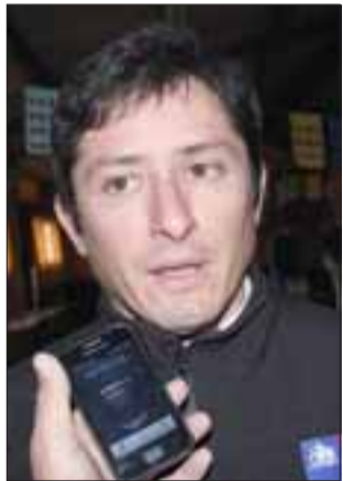
Rodrigo Vergara, Seremi de Bienes Nacionales, de Valparaíso.

Una luz de esperanza es la que brilla ahora y con muchísima más fuerza en el corazón de 30 familias de El Asiento, luego que en horas de la mañana de ayer lunes,