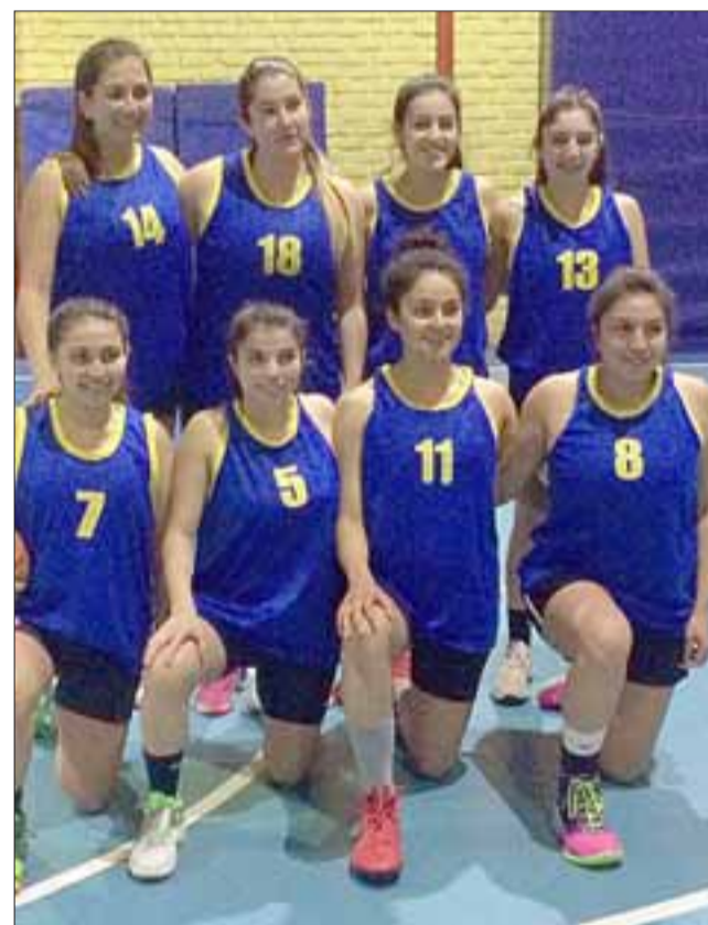
El equipo de Calle Larga fue el mejor de la serie femenina en el encuentro ‘Don Vite’

destreza, que fueron las más entretenidas para el público que asistió al evento con que se recordó a Samuel Tapia Guerrero, se impusieron: