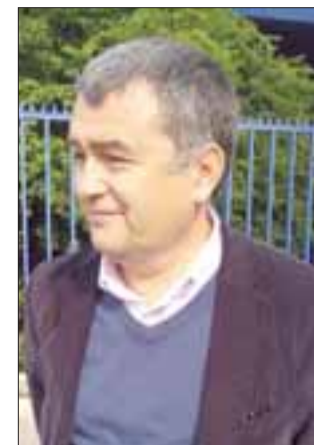
Eduardo León Lazzano, Gobernador de la Provincia de San Felipe.

participación ciudadana, donde se ponen en conocimiento de la comunidad los detalles del proyecto. «Se han hecho dos procesos masivos en los cuales yo he participado, se ha informado la idea... luego viene otra etapa, habrán varios procesos, la información también está disponible en el municipio, a nivel de concejales y estamos llanos como Gobierno a reunirnos con quien quiera recibir mayor información», decretó la máxima autoridad provincial.