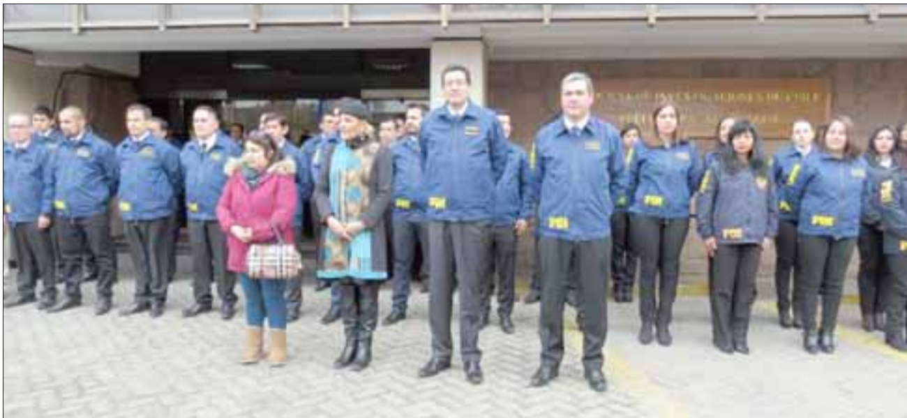
Personal de la Prefectura Provincial Los Andes de la PDI, recibe el saludo musical de los pequeños alumnos al cumplir 84 años de vida institucional.

El Prefecto destacó el lanzamiento del plan estratégico 2017-2022, que entre sus ejes fundamentales busca mejorar y reforzar el capital humano de la institución para seguir en esta senda de trabajo investigativo por los próximos 50 años,