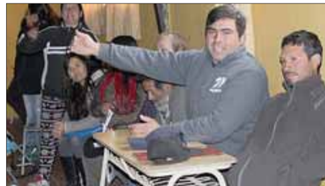
VECINOS INVOLUCRADOS.- Cada uno de los vecinos explicaron sus dudas y formularon sus preguntas al seremi de Bienes Nacionales, Rodrigo Vergara.