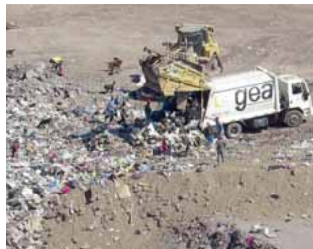
Uno de los camiones de GEA descarga basura en el Vertedero La Hormiga.

- La verdad que nosotros tenemos por marco general digamos, la fiscalización de dos veces al año de los vertederos, y nosotros al vertedero La Hormiga estamos asistiendo una vez al mes, tenemos un monitoreo permanente... regular y también por muchas denuncias que se han formulado por pocos sectores, son pocos, son los mismos siempre y que obviamente nosotros concurrimos a las fiscalizaciones también por estas denuncias de gente que está muy preocupada del medio am-