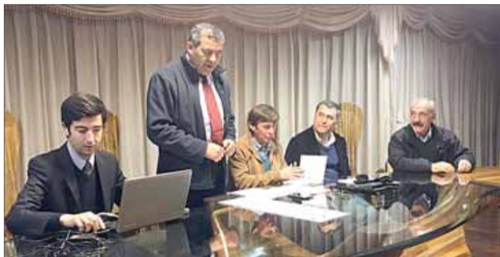
El Gobernador Eduardo León y el Alcalde Patricio Freire fueron parte de la conformación de esta institución que comenzará operar bajo la Ley de Servicios Sanitarios Rurales.

Por su parte, el Alcalde Patricio Freire , quien trabajó en sus inicios en la Cooperativa de Agua Potable Rural de La Troya, valoró la labor de los dirigentes por este nuevo logro y precisó que «se les van a abrir más puertas al estar juntas todas las APR en una sola agrupación provincial. Felicitar a los dirigentes por esta gran iniciativa y ojalá seguir sumando logros dentro del sector rural, que es donde se da trabajo a gente de esfuerzo y sacrificio».