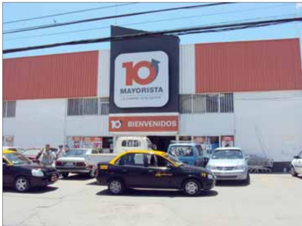
El delito se habría originado la tarde de este domingo en el Supermercado Mayorista 10 ubicado en calle Santo Domingo en la comuna de San Felipe.