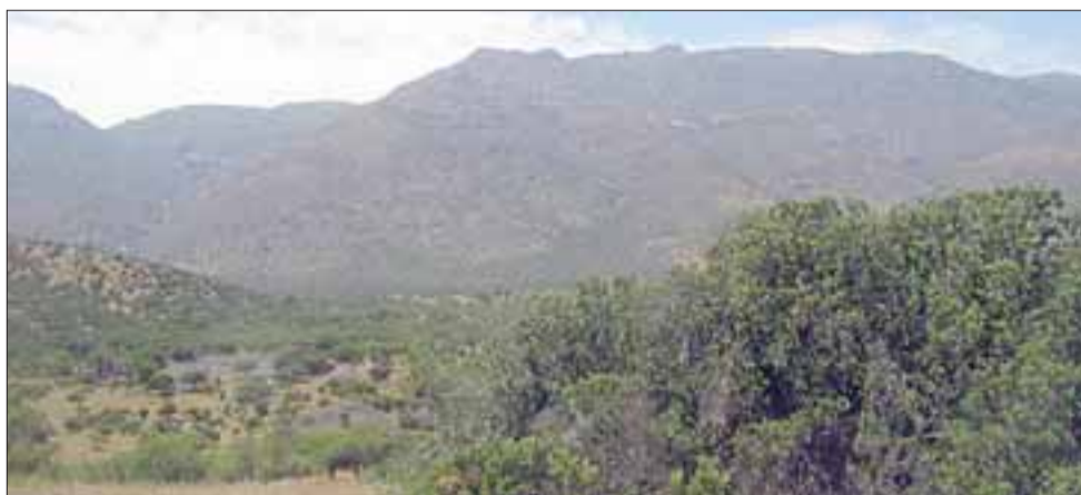
Todo este sector será inundado con la construcción del embalse Cerrillos.

El Gobernador de la Provincia de San Felipe, Eduardo León, se refirió al eventual rechazo que ha manifestado parte de la comunidad aconceguina ante la próxima construcción del embalse Cerrillos en la comuna de Catemu, y aseguró que esta obra cumple con todos los protocolos necesarios, entre ellos, los relacionados con la obtención de su Resolución de Calificación Ambiental (RCA).