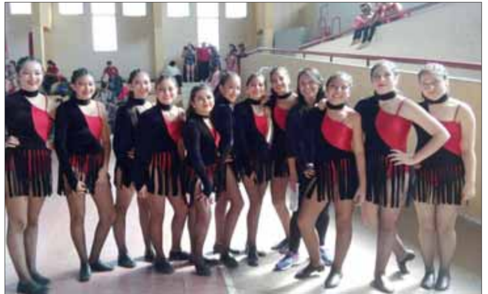
¿LO LOGRARÁN?.- Aquí tenemos a estas jovencitas llenas de entusiasmo y con ganas de volar muy alto, pues todas esperan estar en el 'World All Dance 2017'.