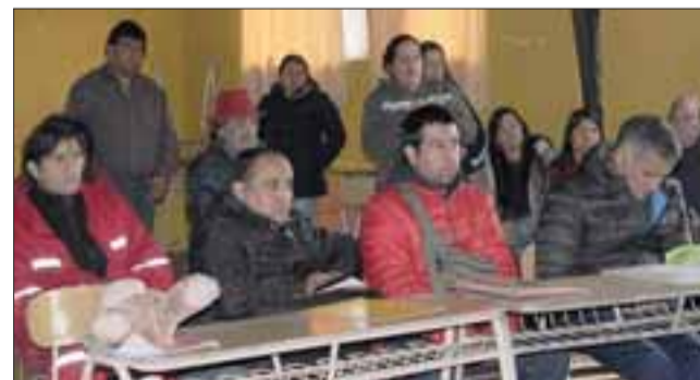
LARGO PROCESO.- Al menos unas 30 familias de El Asiento finalmente podrán sanear sus propiedades, de salir todo bien, para 2018 ellos serán legalmente propietarios.