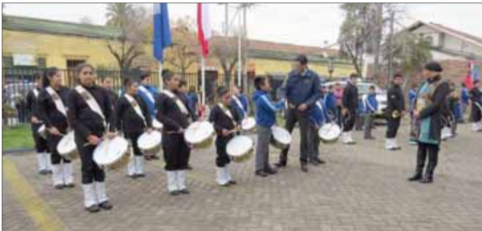
Como cada año la banda de la Escuela Ignacio Carrera Pinto saludó con una retreta al personal de la PDI, institución que apadrina al colegio desde el año 2008.

Agregó que gracias a este trabajo se ha podido fomentar el autocuidado, sobre todo en materia de prevención de drogas, algo que también es reconocido por la comunidad que rodea a la escuela.