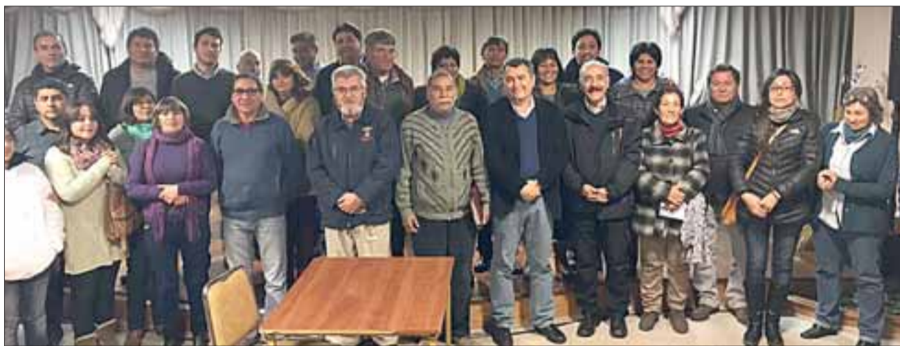
Representantes de gran parte de las 23 cooperativas de APR de la Provincia de San Felipe celebraron la constitución de la Asociación Gremial de Servicios Sanitarios Rurales de Aconcagua.