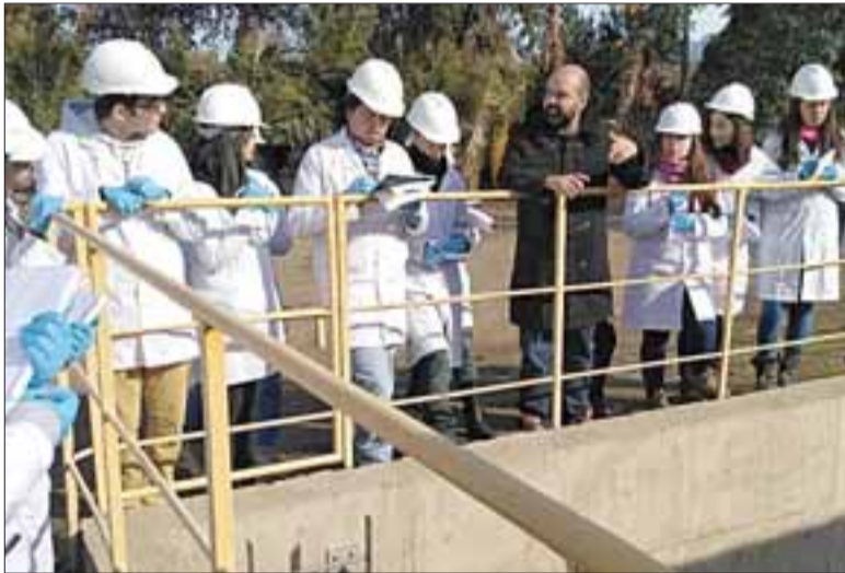
Se trata de visitas de estudiantes de primer año, que manifiestan su interés por conocer el funcionamiento de estas plantas de tratamiento de aguas servidas.

Lo que más les llamó la atención a los estudiantes y fue lo que más consultaron una vez visto el funcionamiento de la misma, era cómo opera el proceso de mantención, pues el sistema que opera bajo el alerta de servicios sanitarios están al debe en algunas cosas, sin embargo nosotros como municipio, mantenemos la normativa y todo en orden con recursos, municipales.