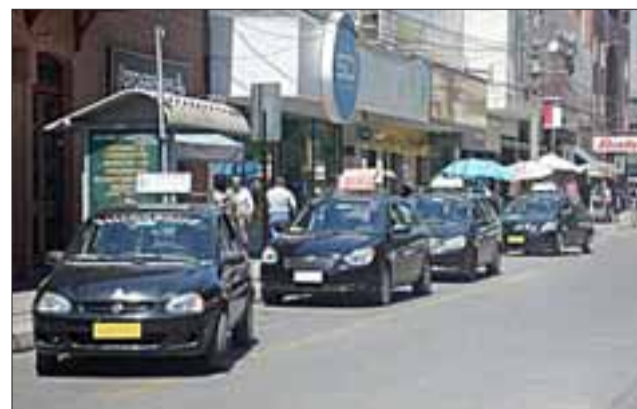
Para fines de mes se contempla realizar un taller de capacitación para conductores.

Consultado sobre el servicio que se está entregando hoy en día, dice que a fines de este mes tiene un taller para capacitar a sus conductores, «más que capacitarlos es mantener un sistema de conductores permanentes, a nosotros no nos sirven los conductores que están de paso, porque va a esperar un trabajo alternativo y no va a prestar un buen servicio y la comunidad tiene que entender