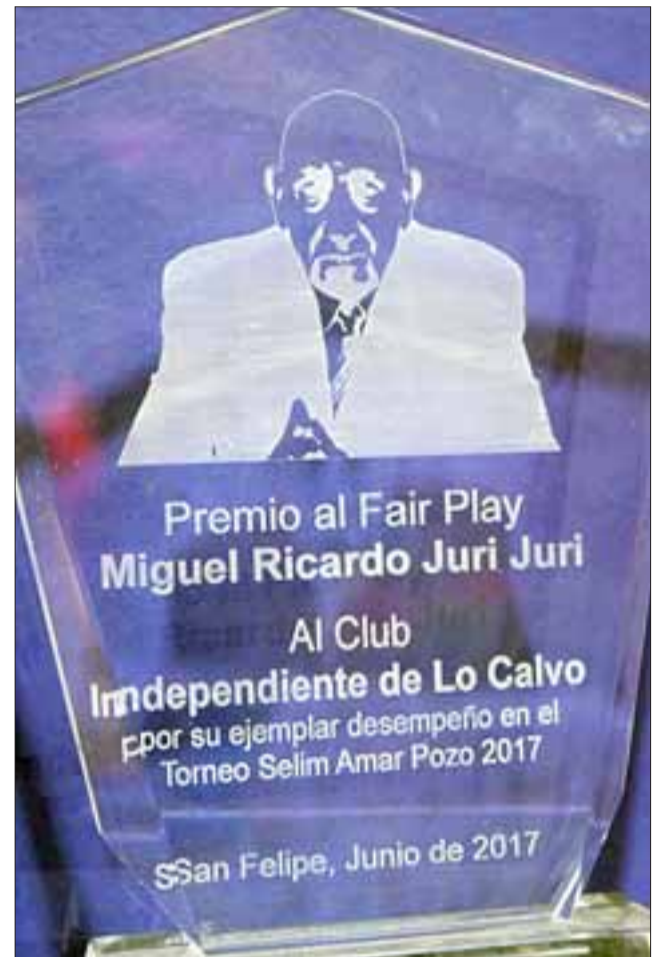
AL MEJOR JUEGO LIMPIO.- Este es el Premio Fair Play Miguel Ricardo Juri 2017.