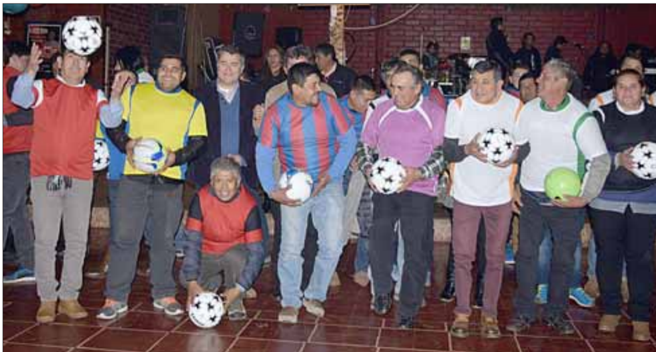
FAMILIA DEPORTIVA.- Aquí tenemos a gran parte de los directivos que dieron vida al Torneo Selim Amar Pozo por amor a la camiseta 2017.