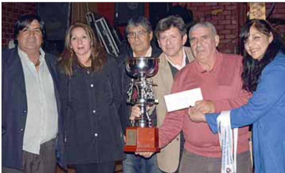
CAMPEONES DEL GRUPO B.- Los campeones del Grupo B, Club Deportivo El Asiento, recibiendo su merecida copa.

que todos merecemos una segunda oportunidad. Me parece realmente extraordinario. Además este premio al Fair Play representa en gran medida lo que fue nuestro padre, lo que nos enseñó con su ejemplo, de hacer siempre lo correcto, no importa si eso te per-