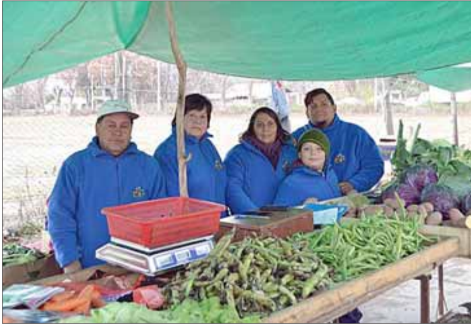
FERIANTES ALEGRES. - El proyecto superó los $7.000.000 y se compraron pesas digitales, repisas de metal-madera, cajas organizadoras y ropa corporativa.

ductos principales, pescados, carnes, ropa, plantas, huevos, artículos de aseo, de bazar, útiles escolares y juguetes. Además informar que funciona los días jueves y sábados en la calle Los Aromos, frente al Parque La Ermita.