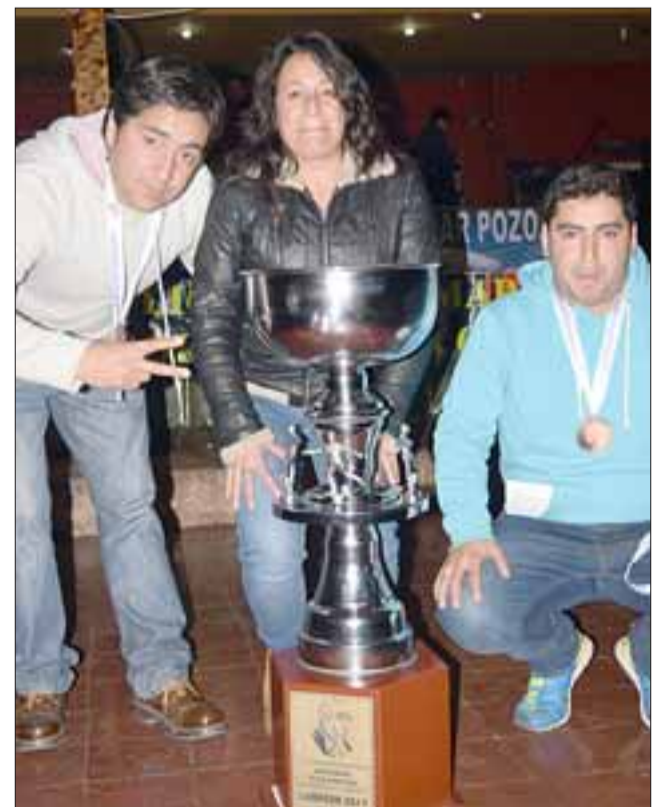
TREMENDA COPA.- Orgullosos con esta copa, los directivos del equipo campeón Club Sargento Aldea, posan para las cámaras de Diario El Trabajo.