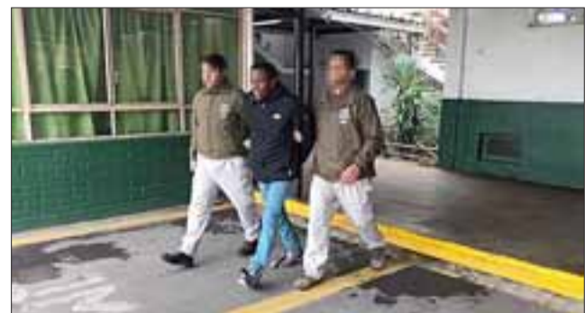
Los imputados fueron formalizados por Tráfico en pequeñas cantidades, quedando tres de ellos en libertad con Arraigo Nacional y Firma Mensual, en tanto "El América" quedó en Prisión Preventiva.

Arraigo Nacional y Firma Mensual en fiscalía por el tiempo que dure la investigación.