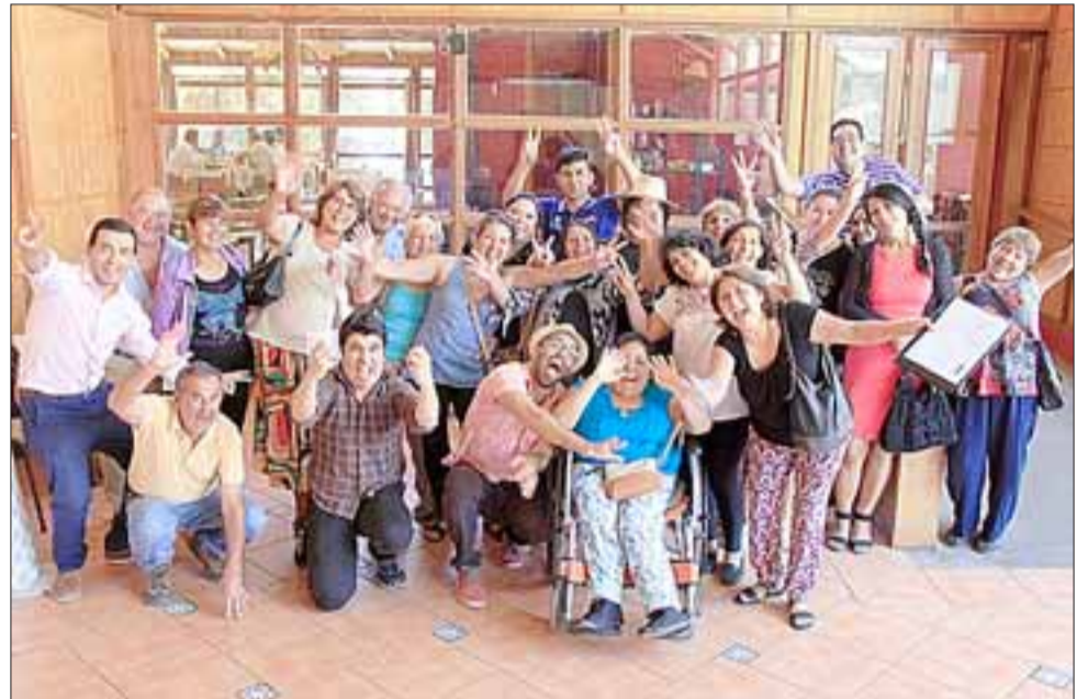
Cabe destacar que esta feria libre, crece semana a semana y en ella puede encontrar aparte de frutas y verduras que son los productos principales, pescados, carnes, ropa, plantas, huevos, artículos de aseo, de bazar, útiles escolares y juguetes.