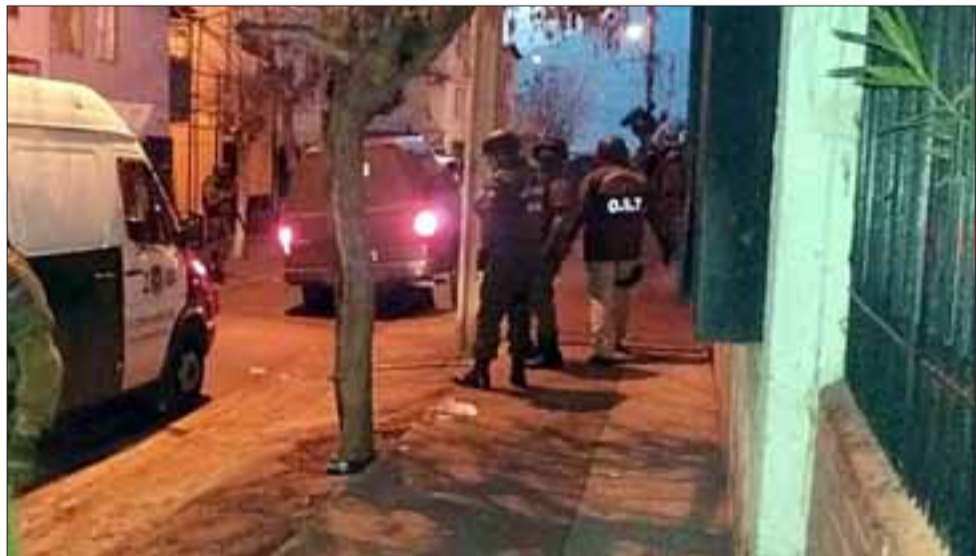
La madrugada del viernes un equipo del OS7 Aconcagua con apoyo del OS7 de Santiago, Gope y Fuerzas Especiales, efectuó un allanamiento masivo y simultáneo que terminó con cuatro colombianos detenidos.

El oficial agregó que gracias a este operativo se pudo sacar de circulación cerca de