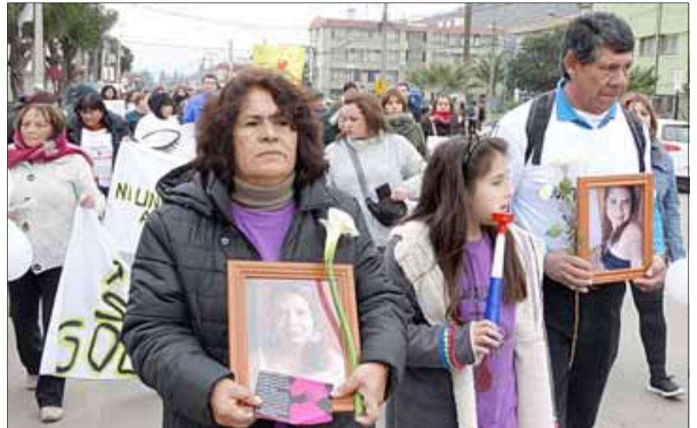
NI UNA MENOS. - Cientos de llayllaínos marcharon por las calles de su comuna, exigiendo el final contra la violencia de género.