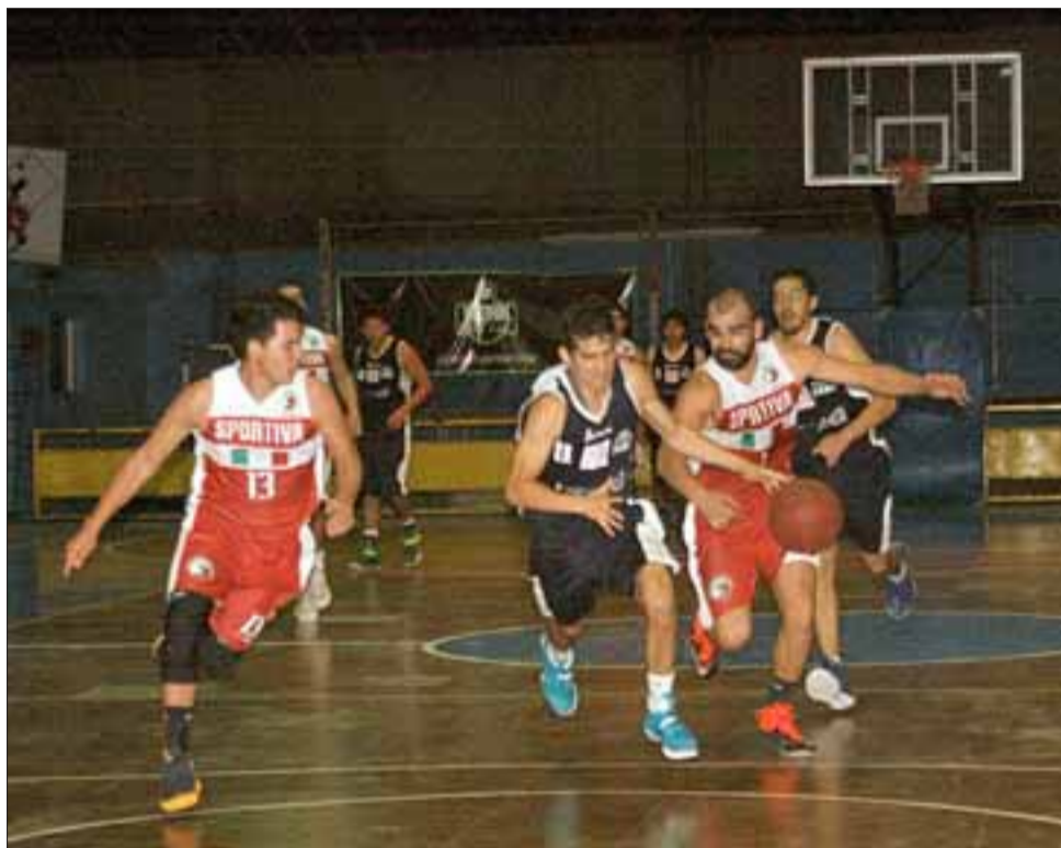
El equipo sanfelipeño fue un duro escollo para el actual líder de la Libcentro A.