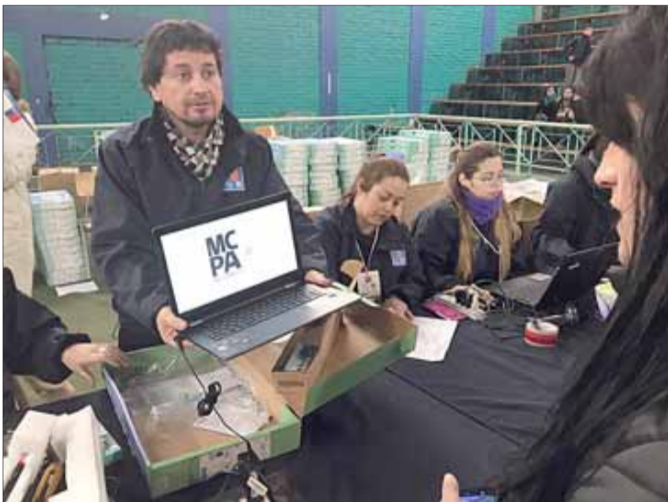
La inversión regional del programa 'Me Conecto para aprender' es de $2.653.231.733, de los cuales $168.178.158 están destinados para la comuna de San Felipe.

las familias. Va a ser un instrumento de aprendizaje para los alumnos y les permitirá por medio de internet fortalecer la conectividad».