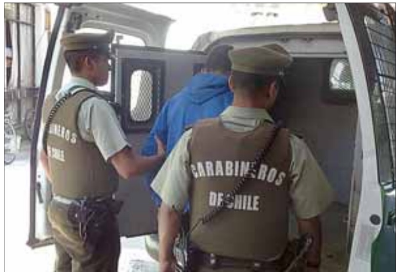
Los detenidos por Carabineros fueron derivados hasta tribunales para ser formalizados por la Fiscalía.

Asimismo, la policía uniformada derivó al denunciante hasta el Cefam Segismundo Iturra de San Felipe, siendo diagnosticado por el médico de turno con lesiones de carácter