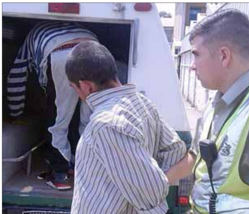
El imputado fue detenido por Carabineros de la comuna de Llay Llay, quedando a disposición de la Fiscalía. (Foto Archivo).

La policía uniformada confirmó que tras la detención del acusado, no se logró recuperar el teléfono móvil de propiedad de la víctima avaluado en $200.000. No obstante el detenido de iniciales M.A.T.O. , de 38 años de edad, quien cuenta con tres