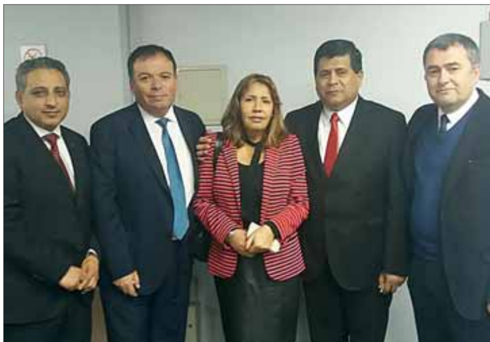
Los 24 años de existencia del Consejo Regional fueron celebrados con una gala en la que se entregaron distinciones a personas e instituciones que se han destacado por su contribución al desarrollo de cada una de las provincias y de toda la Región de Valparaíso en su conjunto.

«El Consejo Regional, dentro de sus posibilidades de administración de sólo un 6% del presupuesto público que se ejecuta en la región, ha impulsado obras de mejoramiento de alcantarillado y agua potable, ha promovido el conocimiento de la región a través de los viajes culturales, ha apoyado a los vecinos en la segu-