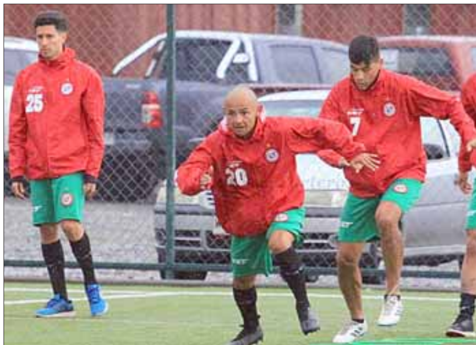
El domingo 30 de julio será el debut del Uní en el torneo de Transición de la Primera B.