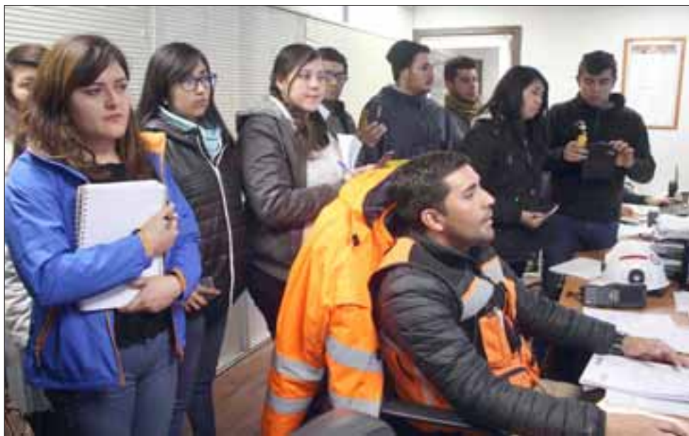
Los trabajadores le enseñaron a los jóvenes la tecnología utilizada para el almacenaje en una de las bodegas más grandes y completas de la División.