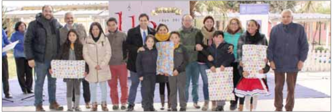
Los menores de distintos cursos recibieron reconocimientos por su participación en la actividades recreativas efectuadas durante la semana aniversario.