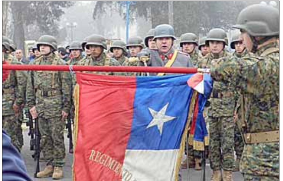
Este domingo se realizará el Juramento a la Bandera en la Plaza de Armas de San Felipe, ceremonia a la que está invitada toda la comunidad aconcaquina.

Así lo informaron desde la Oficina de Relaciones Públicas del Destacamento de Montaña N° 3 'Yungay', quienes extendieron una invitación abierta a toda la ciudadanía, a ser partícipes de esta solemne ceremonia.