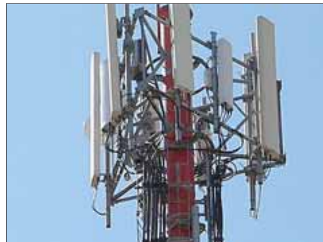
ANTENA DE LA DISCORDIA.- Esta es la antena que está generando gran polémica en San Rafael, luego que la misma fuera instalada sin los permisos correspondientes.