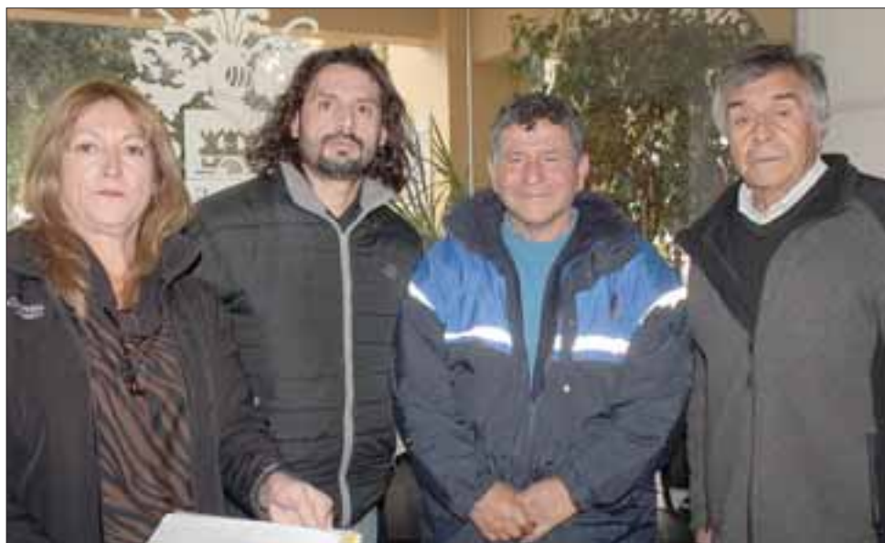
VECINOS SATISFECHOS.- Ellos son parte de los vecinos de San Rafael que ayer fueron atendidos en el Municipio para pedir la intervención en este caso de la antena recientemente instalada en su barrio.

- El Municipio ahora procederá a realizar una inspección en esa propiedad, al parecer este vecino no cuenta con los permisos necesarios (...) lo que corresponde derechamente es cursar una infracción como corresponde ante el Juzgado de Policía Local, y que este Juzgado revise la sanción que deba aplicar al propietario, nosotros como Municipio procederíamos a no aprobar el funcionamiento de esta antena (...) Si luego de estos trámites ocurriera que la antena sigue instalada, tendríamos que proceder con medidas más concretas, como buscar la forma de desmantelarla por completo (...) De momento no es la empresa Entel la que se está cuestionando aquí, es al propietario del terreno, porque a veces son terceras empresas las que instalan las antenas, luego salen a promo-