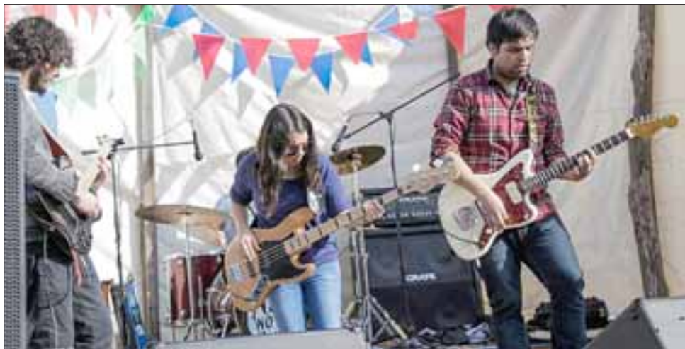
VIENEN SORPRESAS. - Esta banda sanfelipeña tiene un CD grabado, en el que expone estilos como el stoner ; el post rock ; el shoegaze y el rock progresivo .

EL VIERNES REGRESAN. - Aquí tenemos a estos jóvenes músicos sanfelipeños haciendo de las suyas con su rock instrumental.