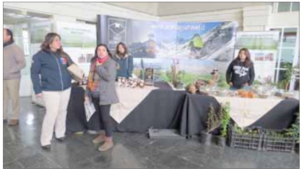
Tal como estaba anunciado, este martes fue inaugurado el Primer Mercado Campesino de la Provincia de Los Andes, una muestra de productos campesinos de la zona, artesanía, cactáceas además de una exposición de vestigios de antiguas culturas que habitaron el sector.

Este evento ferial contó con la participación de 16 usuarios Prodesal y SAT de