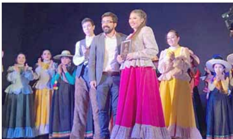
El Alcalde Edgardo González entregó un reconocimiento al Ballet, felicitándolos por el nivel demostrado en la gala.

La actividad comenzó con el cuadro 'Arauco, Gente de Nuestra Tierra' , para continuar con el estreno de sus dos obras nuevas, 'Patagonia Tie-