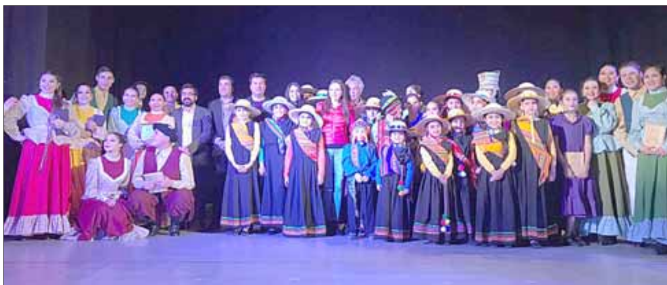
Los integrantes del Ballet Folclórico Municipal de Llay Llay junto a las autoridades posan felices para Diario El Trabajo.

mente los dos cuadros nuevos que presentaron, los que deslumbraron a los espectadores. Esto reafirma nuestro compromiso de seguir apoyando al Ballet y muestra de ello es que este año retomamos la subvención que se les entregaba y así ellos pudieron desarrollar su Gala que se había perdido los últimos años, porque este es un espacio que debía ser recuperado y que ellos se habían ganado en el ámbito cultural de la comuna", concluyó el edil.