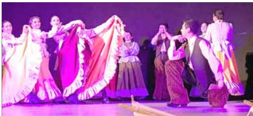
A 17 años de su génesis, el Ballet ha alcanzado un alto nivel, tal como se aprecia en la imagen, con preciosos vestuarios realzados por los estilizados movimientos de sus integrantes.