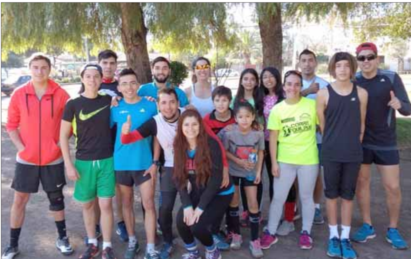
JUVENTUD DEPORTISTA.- Este es el grupo de Aconcagua Runners, niños y jóvenes del valle que recorren nuestra región compitiendo todo el año.