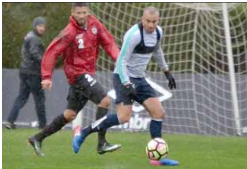
El equipo sanfelipeño se impuso por 2 goles a 1 a la Universidad Católica.