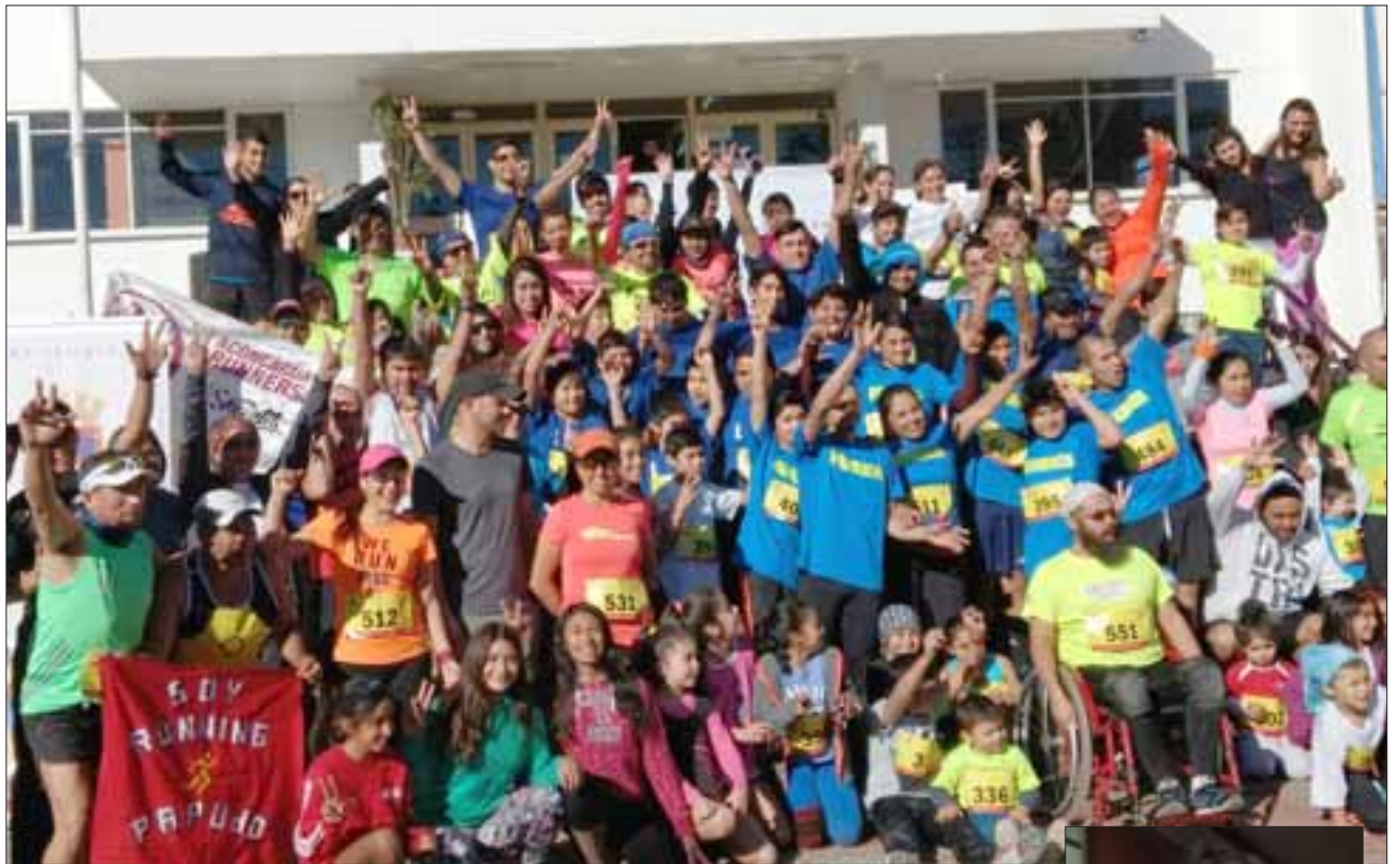
FUERZA DEPORTIVA.- Aquí vemos a los mejores Runners de toda la V Región, durante la más reciente jornada en La Liga.

Aconcagua Runners es una agrupación con perso-