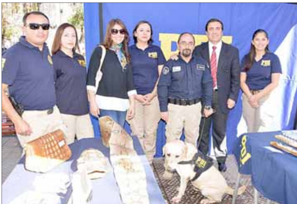
Diversas agrupaciones animalistas e instituciones como 'Amarasi', la PDI, SAG, el municipio de Los Andes y autoridades, participaron de la cita que contó con amplio marco de público.

Remarcó que en base a ello se les entrega un incentivo para poder mantener la producción y a la vez mediante estas ferias puedan comercializarlos de manera directa y generar mejores ingresos.