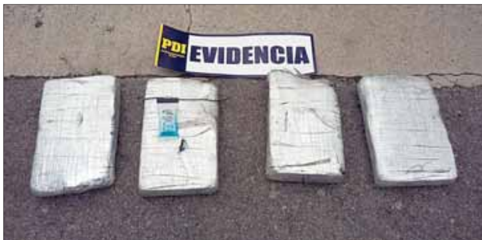
La Brigada Antinarcóticos de la PDI de Los Andes incautó más de cuatro kilos y medio de cocaína de alta pureza oculta en contenedores dentro de un vehículo abandonado en el sector Tocornal de San Felipe.

Según los antecedentes del caso, el vehículo hallado se encuentra registrado a nombre de un ciudadano con domicilio en la ciudad de Arica, sin encargo por robo. La Policía inició la investigación respecto de la procedencia de esta droga y