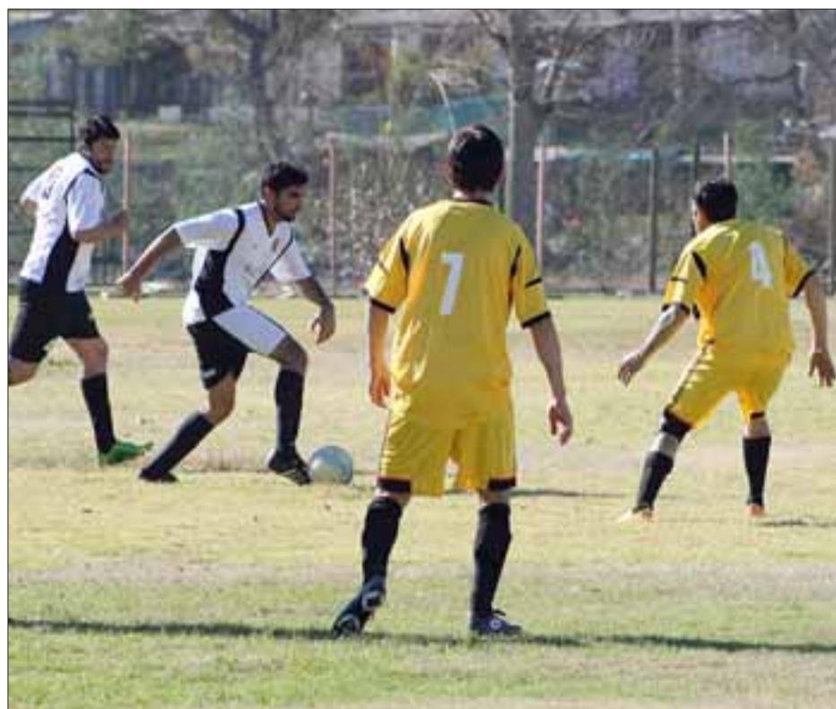
El Complejo Anfa o ‘Tres Canchas’, como se le conoce popularmente, es uno de los escenarios del torneo de fútbol local.

Unión Delicias – Unión Sargento Aldea; Alianza – Ulises Vera; Mario Inostroza – Libertad; Arturo Prat – Juventud La Troya; Alberto Pentzke – Juventud Antoniana.