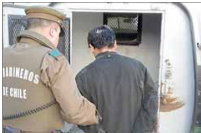
El imputado fue detenido por Carabineros de Santa María el día de ayer por el delito de robo en lugar habitado.

Pasadas las 13:00 horas de ayer jueves, efectivos de Carabineros de la Tenencia de Santa María detuvieron a un sujeto acusado de haber robado 35 kilos de paltas sustraídas desde una casa quinta ubicada en calle Jahuel de esa comuna, siendo capturado por la policía minutos más tarde en los momentos que comercializaba los preciados frutos.