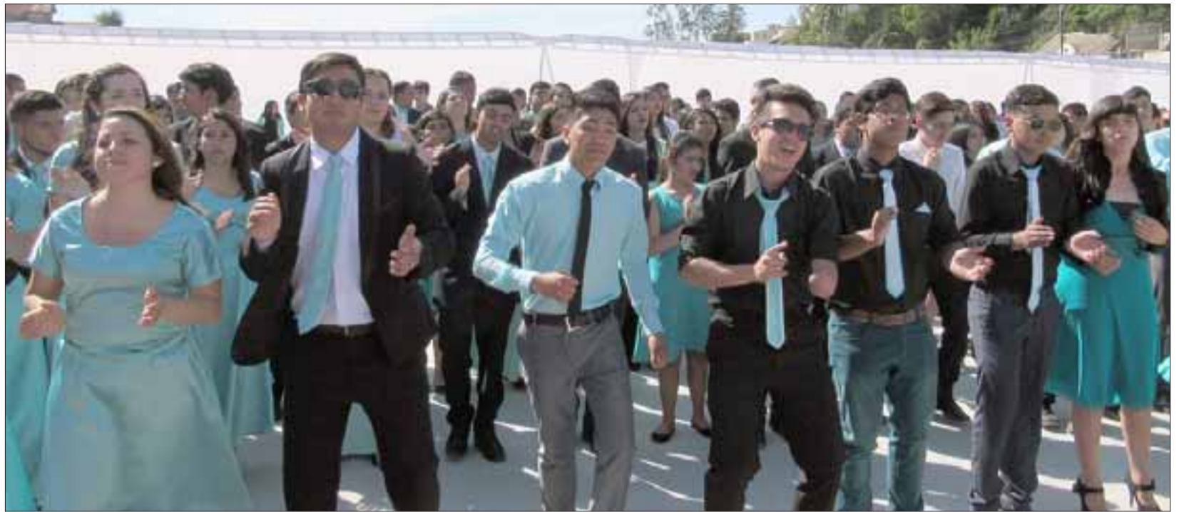
LA JUVENTUD IMPONE.- Cientos de jóvenes de todo Chile llegarán la próxima semana a San Felipe para vivir el Encuentro Regional de la Juventud 2017.

«Son jóvenes de San Felipe, Los Andes, Copiapó, Valparaíso, Arica, Santiago, La Calera y de otras partes de Chile, los que se estarán hospedando en la Casa de Retiro y también los que presentarán música urbana, teatro infantil, talleres sobre educación sexual y de rescate de va-