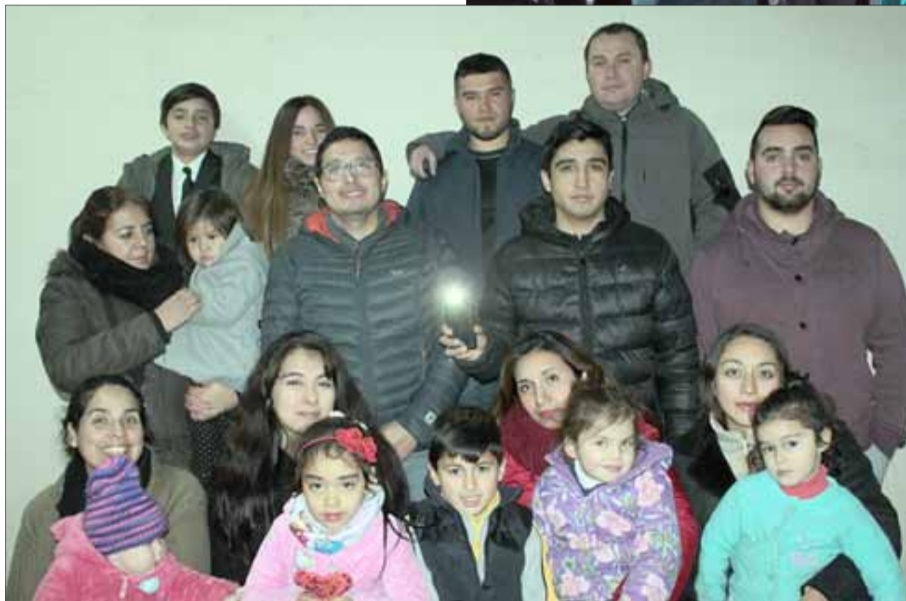
LOS ORGANIZADORES.- Ellos son parte del equipo organizador del Centro Cultural Josafat, de San Felipe.