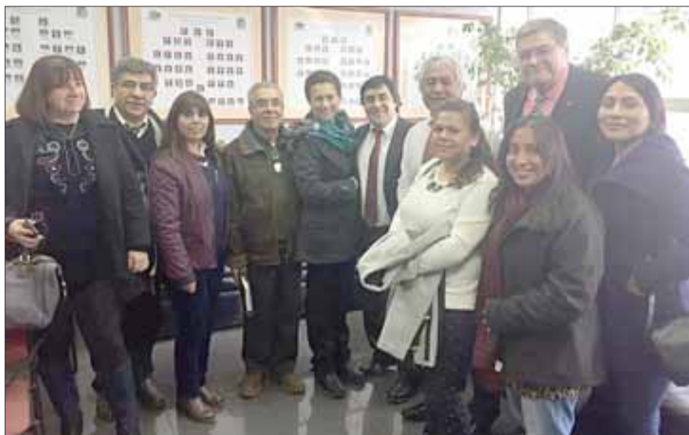
Los Consejeros Regionales aprobaron más de seis mil millones de pesos para los provincias San Felipe y Los Andes.

“Es una obra muy importante porque viene a dar un espacio para el de-