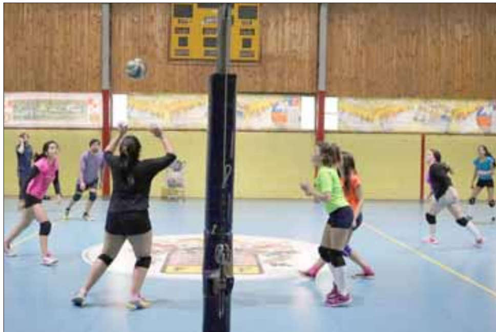
Diferentes talleres, como el de Voleibol Mixto (en la imagen) se estarán desarrollando durante las semanas de vacaciones de invierno.

Cancha de La Parrasía, sábado 15 y 22 de julio de