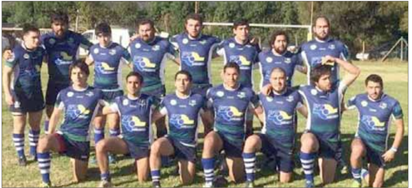
El quince de los Halcones estará libre esta semana en la Liga Arusa.