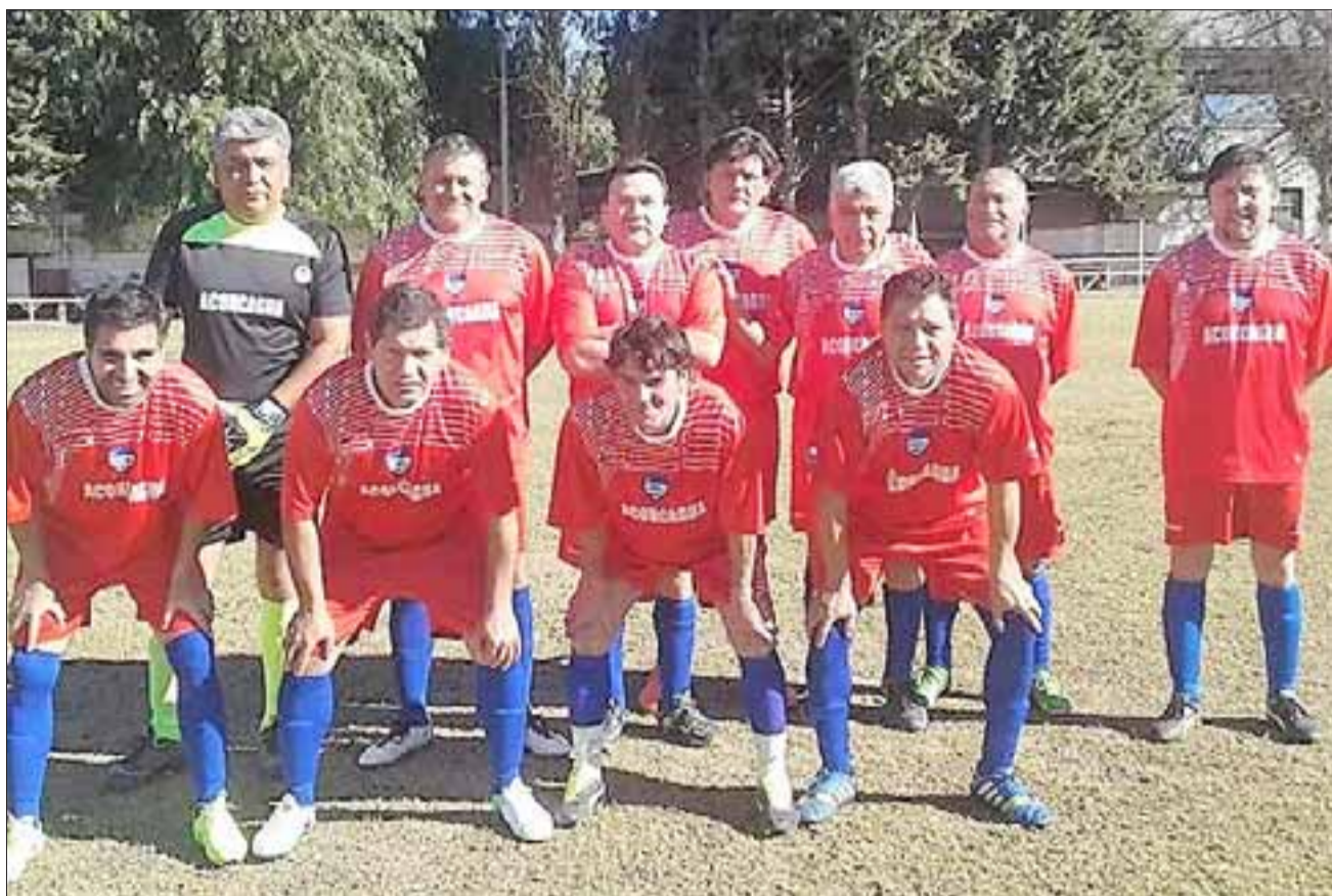
El equipo de Aconcagua se ubica en la medianía de la tabla en el torneo de la Liga Vecinal.