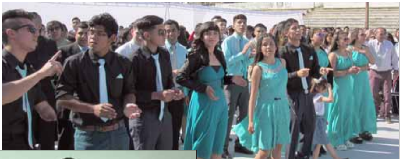
SAN FELIPE TEMBLARÁ.- Esta actividad se desarrollará durante el viernes 14 y sábado 15 de julio en San Felipe.