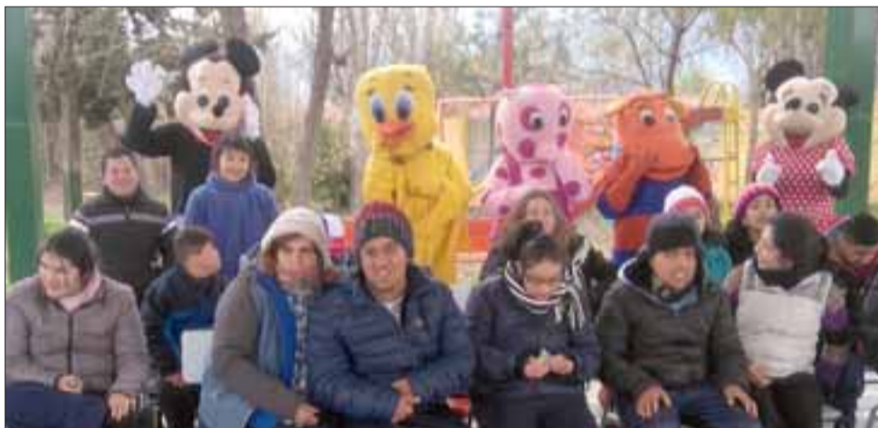
BIEN MERECIDAS.- Aquí tenemos a estudiantes e invitados en esta despedida a las Vacaciones de Invierno, en la Escuela de Educación Especial, de Santa María.