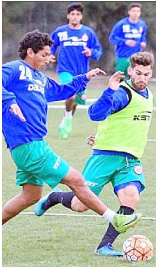
Unión San Felipe rendirá ante Santiago Morning su sexto test de Pretemporada.

Para el entrenador, la importancia del duelo de mañana frente a los ‘microbuseros’ radica en el hecho que, al ser un equipo de la Primera B, les permitirá apuntar hacia Cobreloa, el primer escollo de los aconcagiños en el torneo nacional. “Hemos tratado de manejar todos los detalles; en un inicio partimos con Recoleta, después Santiago Wanderers con mucha posesión, luego un San Luis muy fuerte y después la UC que sabíamos sería el ensayo más fuerte ante de la Unión (Española). Ahora Santiago Morning es pensando en Cobreloa” , aseveró el estratega.