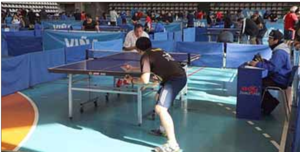
El club Aconcagua Tenis de Mesa participó por primera vez en un Nacional Master.