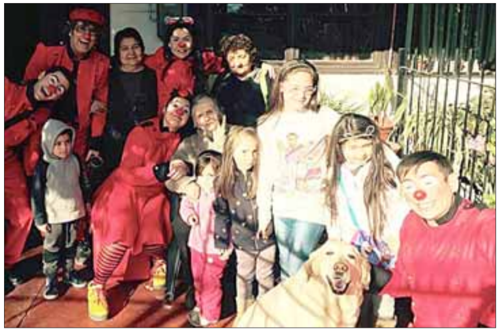
Adultos mayores también disfrutaron junto a los más pequeños.

Feliz Día a todos los Periodistas de Aconcagua y de Todo Chile.