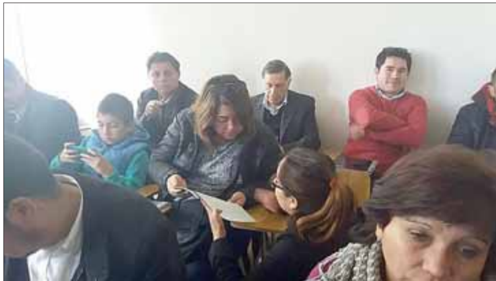
Unos 30 vecinos participaron de la charla informativa para las postulaciones al FAE 2017, fondo que financia proyectos comunitarios que permitan acceso a fuentes de energía renovable.

Y es que uno de los principales beneficios de la utilización de las fuentes de energía renovables radica en el mejoramiento de la calidad de vida de los vecinos, «porque ya tener un panel solar es una economía. Según estudios, ya se están ahorrando un tubo de gas, es decir, unos quince mil pesos al mes, y que con el tiempo se nota. Nosotros apuntamos también