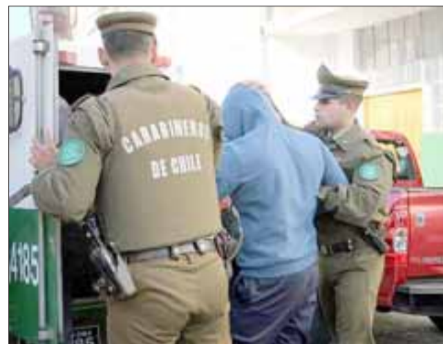
El imputado fue derivado por Carabineros hasta tribunales para ser formalizado por la Fiscalía que investigará el caso. (Foto Archivo).

No obstante el acusado fue derivado hasta el Juzgado de Garantía de San Felipe para ser formalizado por la Fiscalía, quedando citado