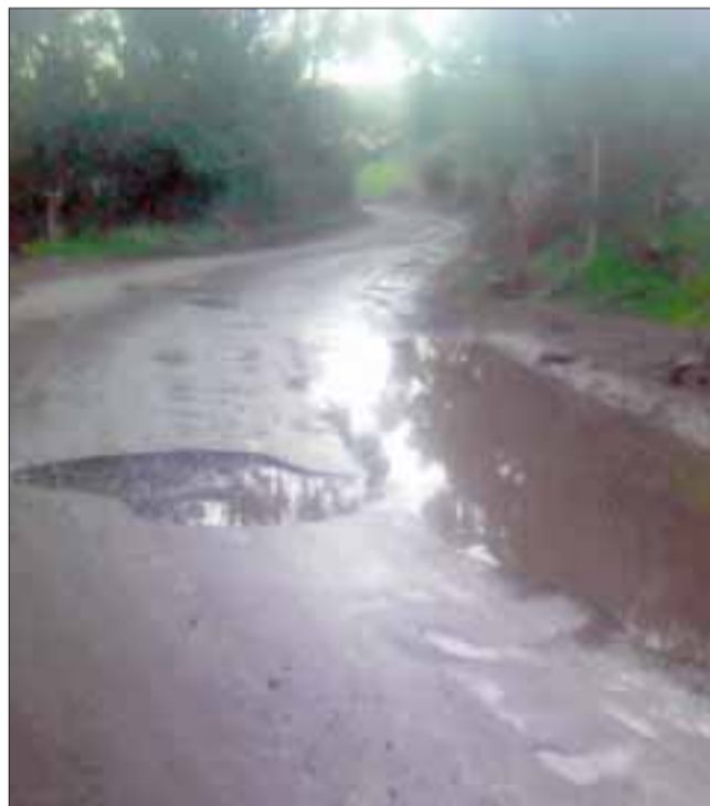
Hoyos de enormes de dimensiones en camino que une Algarrobal con el sector urbano, éste puntualmente ubicado en la conocida 'curva de los chanchos'.

hace nada" y que "uno viene a hacer un reclamo al municipio y tiene que esperar 20 días y después de eso recién puede tener una conversación con el alcalde o con quien esté a cargo, aunque para mí es el alcalde quien debe ver todo esto de las calles, para eso está a cargo de la comunidad", concluyó.