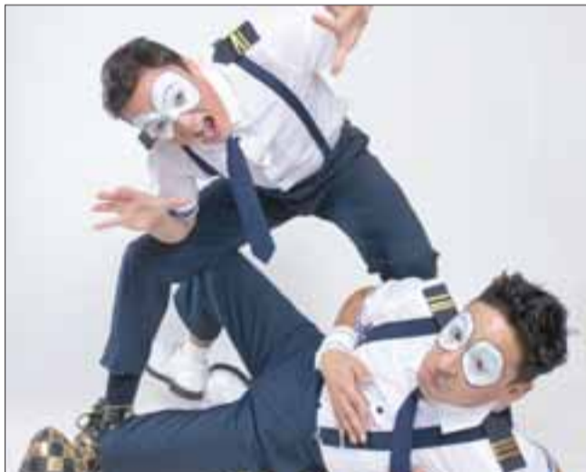
La cita es el viernes 14, a partir de las 18:00 horas en la Sala Cultural Raúl Tagle Bennet, con entrada liberada y abierta a toda la comunidad.

Un excelente panorama para las Vacaciones de Invierno tendrán los niños y niñas de Panquehue con la presentación de la compañía porteña Malabacirco, que realizará una Clínica de Circo y un espectáculo masivo y abierto a la comunidad el viernes 14 de julio.