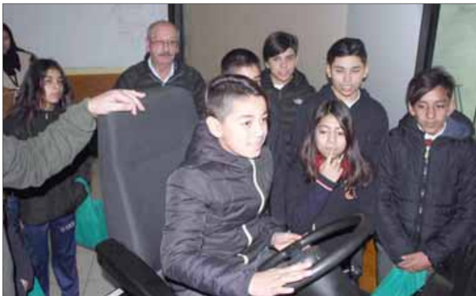
Como actividad de cierre, los alumnos de séptimo básico pudieron vivir una experiencia operando el simulador de un equipo minero junto a sus compañeros y profesionales de la División.