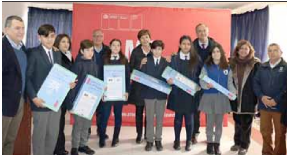
En total fueron 108 alumnos del Liceo Manuel Marín Fritis los beneficiados, además de 31 alumnos de colegios subvencionados.

Por su parte, el Gobernador Eduardo León destacó que, con esta medida, los jóvenes están recibiendo una ayuda que beneficia no solamente a ellos, sino que a todas sus familias. «Este computador con un año de conexión a internet les permite entrar al mundo digi-