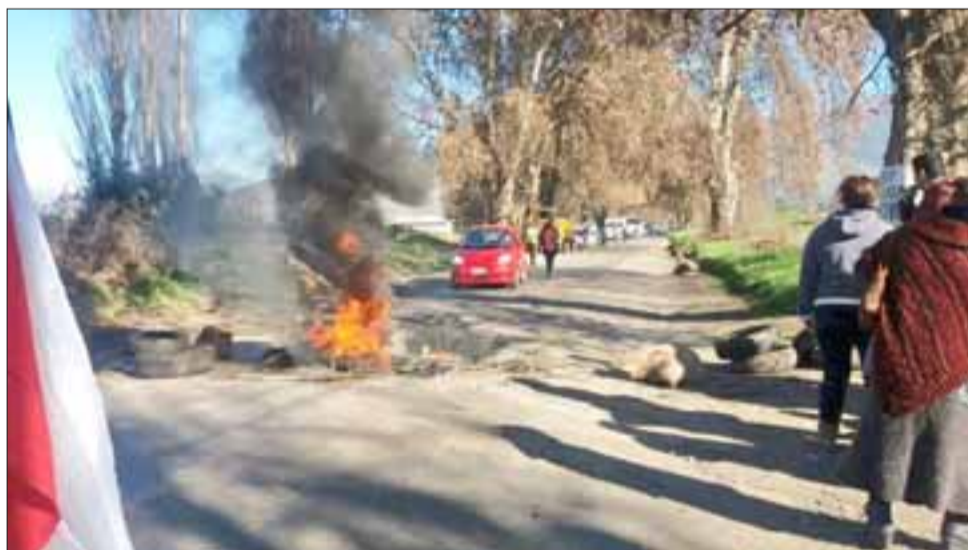
Vecinos comenzaron temprano protestando por el mal estado del camino.