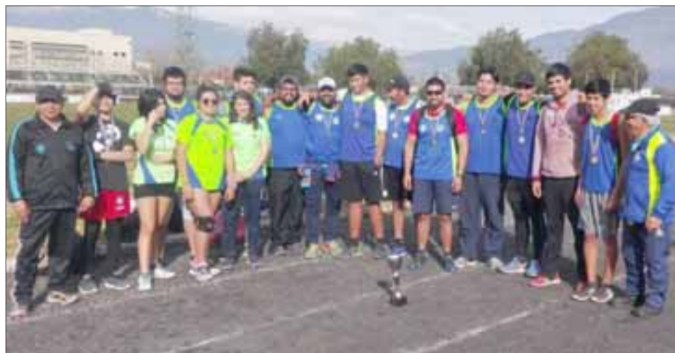
Actuaciones sobresalientes tuvieron los integrantes de la Escuela Infantil de Atletismo de Llay Llay en un torneo Máster y Todo Competidor en Los Andes.

Los atletas de la Escuela Infantil de Deportes de Llay Llay, que entre otros sobresalieron en el estadio Regional, fueron: