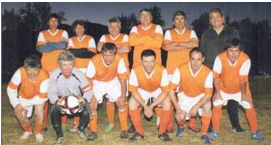
Los años no son un impedimento para que estos avezados deportistas defiendan la camiseta del Copacabana.

En esta oportunidad nuestros lectores conocerán las alineaciones de dos series de los clubes de Putaendo, Copacabana y Central, instituciones con historia y mucho arraigo en esa localidad aconcagüina.