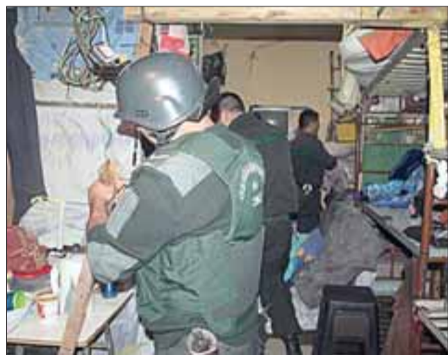
VIOLENCIA CARCELARIA. - Los funcionarios de Gendarmería se hicieron cargo de controlar el dormitorio 11, trasladando a cuatro de los presos involucrados a Valparaíso, queda uno en el Hospital San Camilo. (Referencial)

dependencias. Esto con el fin de identificar a los protagonistas de este hecho. Cuatro reclusos fueron derivados al Hospital San Camilo, permaneciendo sólo uno de ellos en el recinto de salud. Con el fin de