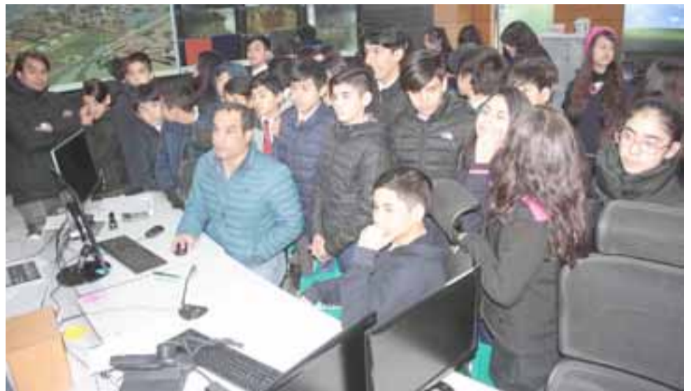
Los estudiantes conocieron el Centro Integrado de Operaciones de Andina (CIO), una sala con alta tecnología que controla de manera remota y en tiempo real las operaciones en la cordillera de Los Andes.

Andina Más Cerca ha abierto nuevas visiones y