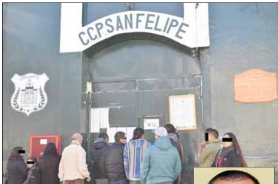
FAMILIARES PREOCUPADOS. - Así lucía el portón principal del CCP San Felipe la mañana de ayer martes, luego que en esa cárcel corriera la sangre tras una violenta riña entre varios internos.