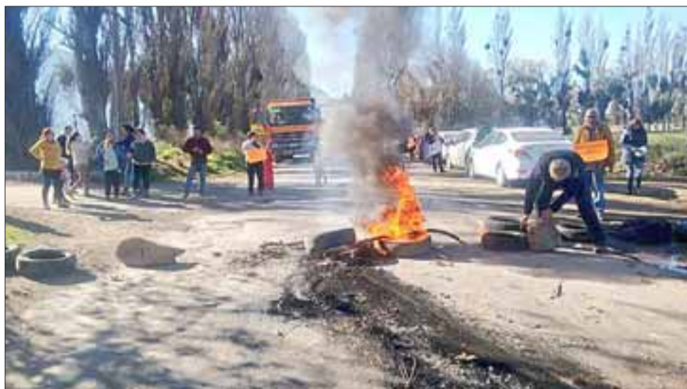
Vecinos incendiaron neumáticos para poder llamar la atención y presionar a la empresa OHL para que cumpla su compromiso de arreglar camino.

Esta protesta se viene a unir a otra realizada este lunes en la mañana por vecinos del sector del Cobre y Seco Alto contra el impacto de faenas mineras en el sector.