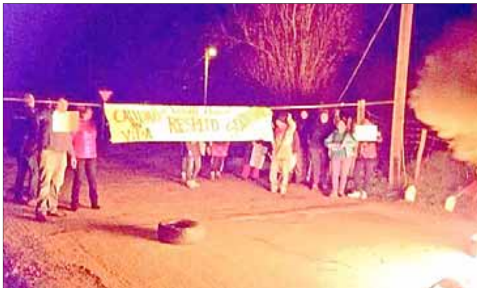
En esta imagen vecinos de los sectores El Cobre y Seco Alto protestando en esta ocasión contra la presencia de las mineras.