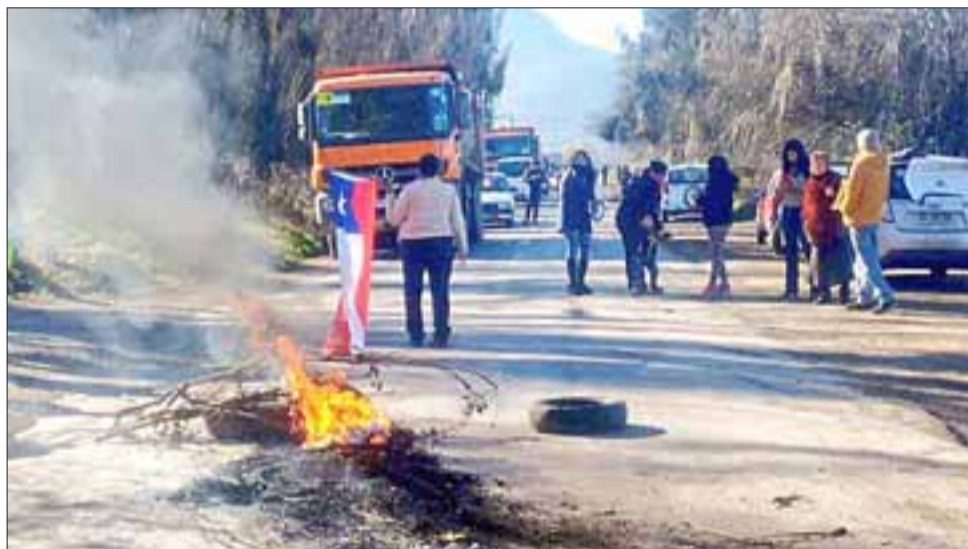
La movilización de los vecinos mantuvo interrumpido el tránsito largo rato.