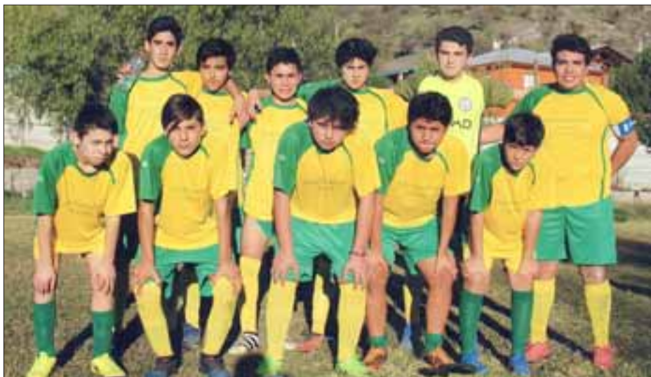
Estos jóvenes aseguran un futuro esplendoroso para el Central de Putaendo.