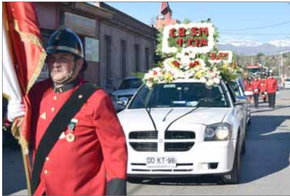
DESFILE DE HONOR.- Un solemne y respetuoso desfile por el centro de la comuna fue el que se realizó ayer con los restos del Insigne Bombero aconcaguino.