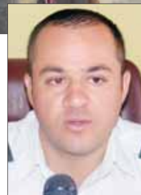
Alcaide del CCP San Felipe, Mayor Felipe Cornejo.