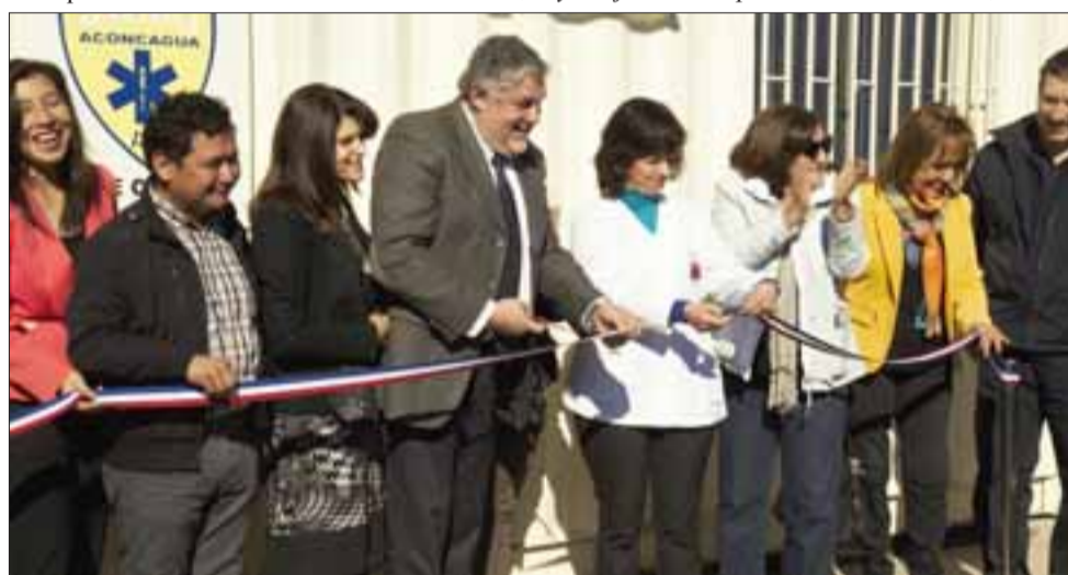
Autoridades presentes en el tradicional corte de cinta que dio por inaugurada la nueva base Samu, un importantísimo adelanto en materia de oportunidad de atención para la comunidad de Catemu.

La base Samu cuenta con un conductor y un técnico paramédico que funcionarán las 24 horas, lo que se traduce en 8 personas que funcionan las 24 horas todos los días del año.