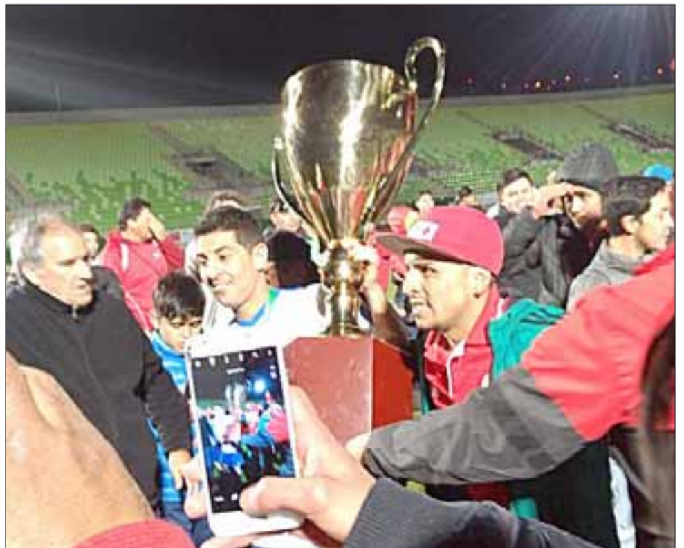
CAMPEONES PREMIADOS.- Así recibieron la Copa de Campeones estos guerreros del fútbol amateur de Almendral Alto, cuando la ganaron en Valparaíso hace pocas semanas.