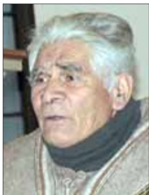
Pedro 'Choro' Estay, uno de los referentes nacionales más importante del Folklore chileno.

Tal como lo habíamos anunciado en Diario El Trabajo , el sábado Fundación Buen Pastor logró organizar la jornada de Cantos a lo Divino , en conjunto con la Escuela Manuel Rodríguez, de forma de colaborar al rescate de la tradición oral musical, articulando el espacio religioso con una manifestación artística y folclórica propia de nuestra población rural. Los poetas populares y su expresión de arte religioso tienen una data de más de 500