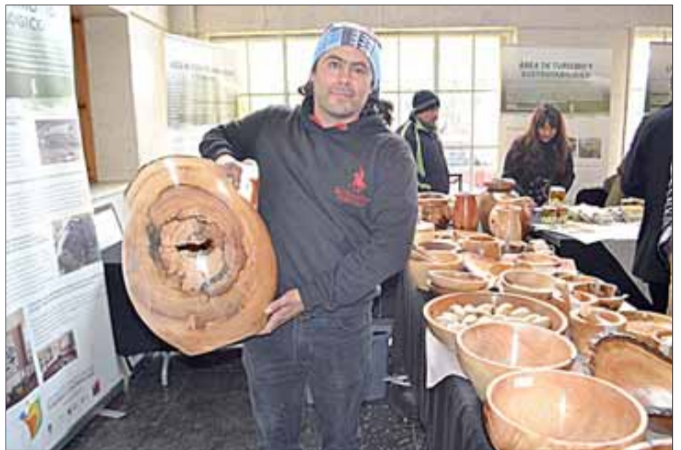
Entre las piezas que talla este joven andino se encuentran fruterías, ensaladeras, morteros, jarrones, copas, vasos y platos.

En cuanto a la comercialización, este emprendedor asegura que tiene una gama de productos y precios para todos los bolsillos, con su emprendimiento que ha denominado Pamusa, «los precios van de los mil pesos hacia arriba y para difundir mi trabajo participo en todas las ferias a las que me invitan. Hace algunos meses soy usuario de Indap. Participé del Primer Mercado Campesino de Los Andes y la idea es poder participar en ferias nacionales que organiza Indap para poder comercializar mis productos. Quiero abrir nuevos horizontes y puntos de venta para que mis productos se hagan conocidos», confiesa este artesano.