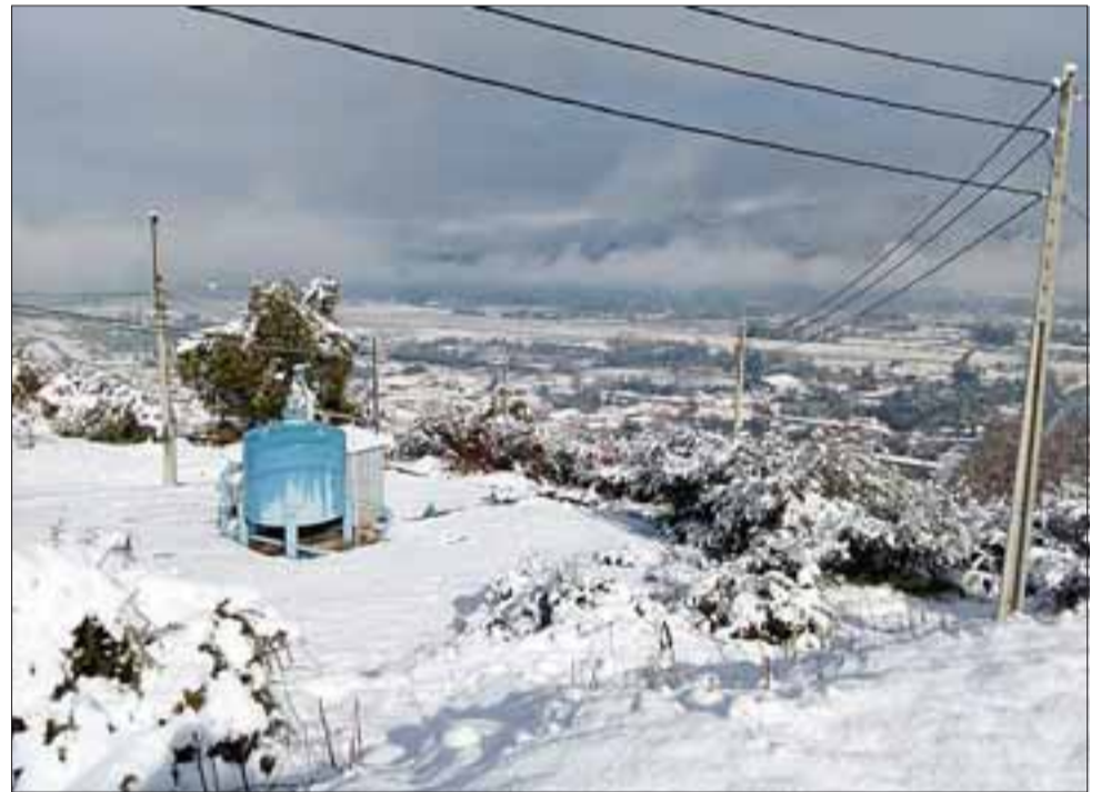
EN PUTAENDO. - La planta de Esva, en El Llano de Putaendo, lucía así tras el fin de semana blanco que nos golpeó de frente.