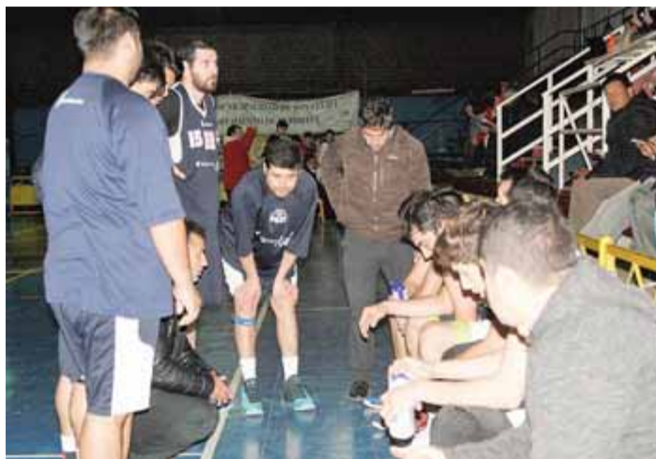
Los pratinos se inclinaron claramente ante Puente Alto en la 12ª fecha de la Libcentro A.