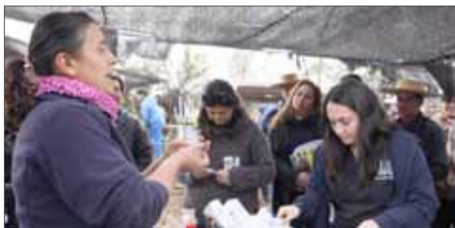
La actividad se realizó en el marco del Programa de Desarro- llo Local (Prodesal), convenio Indap con la Municipalidad.

En la comuna el pro- grama, enmarcado en un convenio entre Indap y la municipalidad, tiene 146 usuarios y aproximada- mente un 50% es del área de ganadería, donde se consideran avicultores, ganadería mayor y menor.