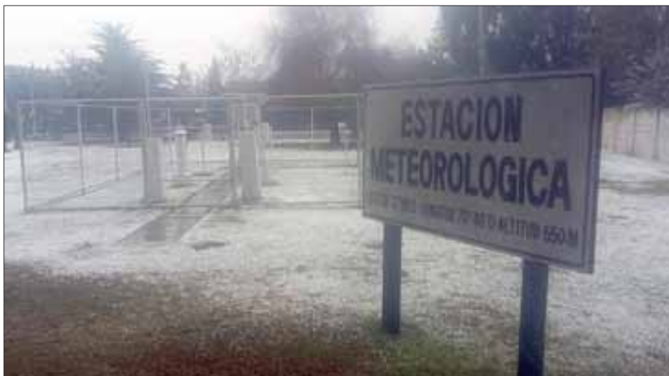
EN SAN FELIPE. - La estación meteorológica de la Escuela Agrícola quedó con una tenue capa blanca de nieve, no así el resto del Valle.

Postales que quedarán grabadas en la retina de las nuevas generaciones y que maravillaron a los vecinos de casi todas las comunas del Valle de Aconcagua, fueron las dejadas por las precipitaciones de agua nieve, que cayeron la ma-