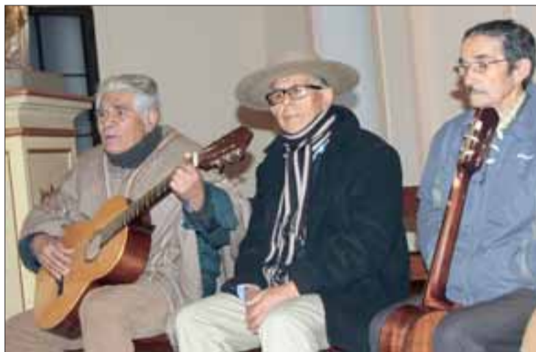
FIELES A ELLA.- Aquí vemos a parte de los cantores a lo divino que rindieron tributo a la Virgen de Nuestra Señora del Carmen durante todo el día sábado.

En la poesía popular tradicional que estos cantores interpretan se encuentran dos grandes áreas temáticas, las que corresponden también a contextos diferentes en la recitación y canto de los versos. El canto a lo humano, propio de celebraciones más bien profanas o de desafíos entre poetas, y el canto a lo divino, que en general se realiza con motivo de fiestas religiosas o velorios de angelitos, niños muertos a corta edad.