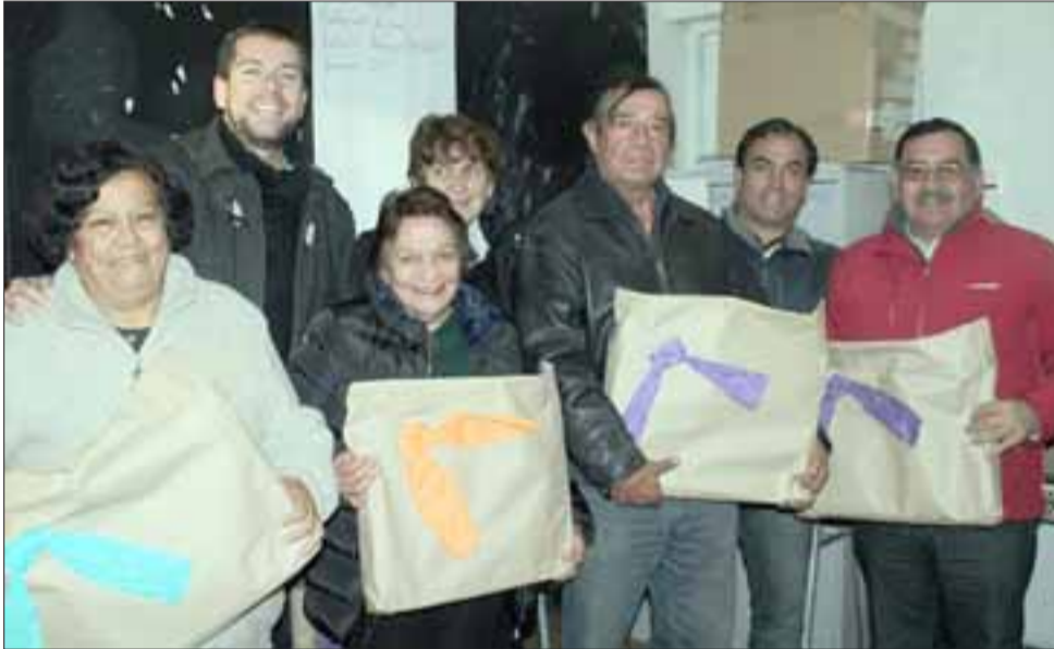
TARDE PERO SEGURO. - Este sábado ellos recibieron un regalo o premio que tenían que haber recibido en 2016, pero que por las Elecciones no se entregaron.