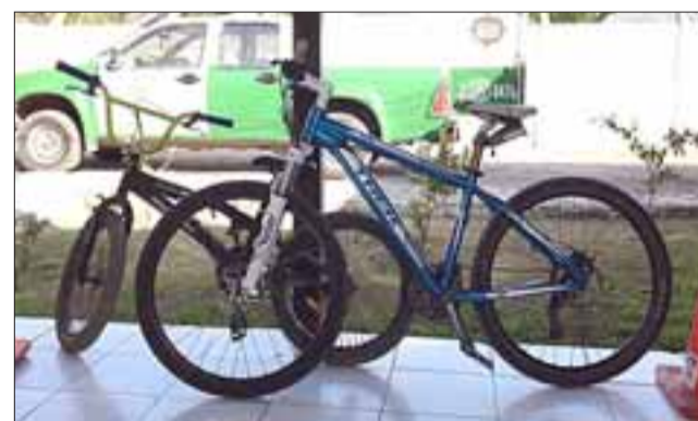
Carabineros de la Tenencia de Santa María logró la recuperación de estas bicicletas que fueron denunciadas por robo la semana pasada.

Con estos antecedentes audiovisuales Carabineros de la Tenencia de Santa María logró dar con el paradero del acusado, quien se encontraba en su domicilio