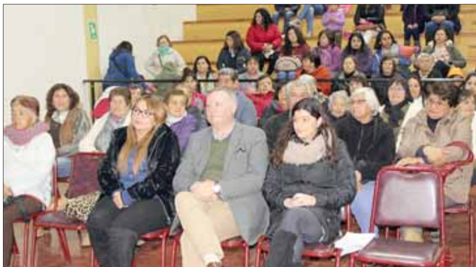
La actividad, que tuvo lugar en la sala cultural de la comuna de Panquehue, contó con la presencia de aquellas familias, cuyo registro social de hogares se encuentra entre los tramos más bajos.

«Cuidar y ahorrar, en pro de mejorar la matriz energética nacional y crear condiciones para promover el desarrollo de Chile, es un compromiso que en cada una de las localidades de la región se ha estado dando». Agregó, que es muy importante que cada uno de las familias que asisten a