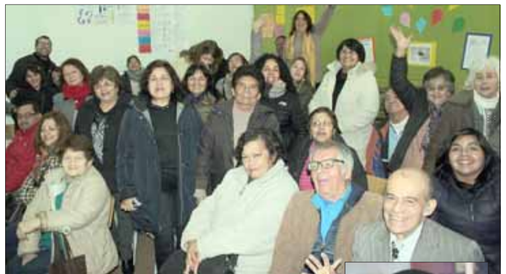
DIRIGENTES COMUNITARIOS. - Ellos son parte de los dirigentes que en agosto estarán terminando su año lectivo 2017, y algunos de ellos estarán más cerca de terminar el curso de tres años completo.