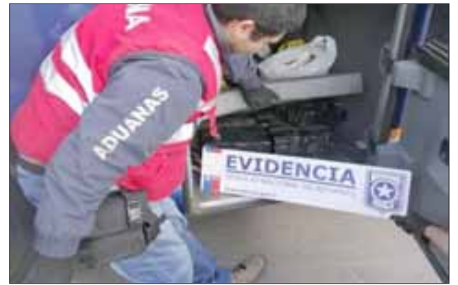
Aduanas descubrió que los pernos de las cañerías de agua del baño había sido removidos, al revisar el interior de encontraron con 163 paquetes de juegos pirotécnicos, además volantes, amortiguadores, mangueras hidráulicas y otros repuestos automotrices.

La acción llevada a cabo por la PDI y Aduanas permitió sacar de circulación mercancía que en el mercado informal hubiese alcanzado los $4 millones, mientras que los responsables de este hecho fueron puestos a disposición del Tribunal de Garantía de Los Andes por infringir la ordenanza aduanera. Los