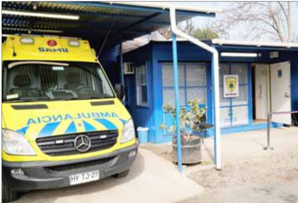
Esta es la nueva base Samu en Rinconada, la que fue recientemente inaugurada.