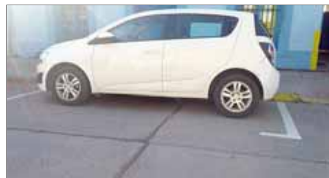
Acá se aprecia un calzo chico, ubicado en Calle Carlos Condell.

- Hay un rango estamos entre 4,9 metros a 5,2 metros, pero el rango se toma en el tramos que ellos están licitando, no es genérico, porque en esos tramos hay servicios, estacionamientos reservados por lo tanto ellos tienen que acotar y hacer un tramo homogéneo dentro de lo que está establecido, generalmente son cinco, cinco uno pero ahí estamos en el rango, pero acá habían calzos de tres metros de seis metros, había un desorden.