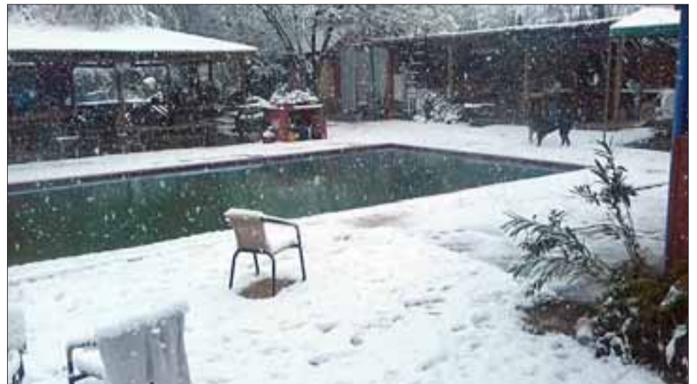
FRÍO TOTAL. - En Granallas de Putaendo por ejemplo, la nieve silenció cualquier idea de disfrutar esta piscina en familia.