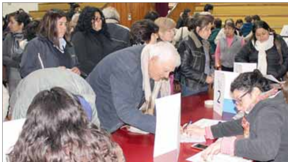
Cada una de las familias participantes recibió de regalo un Kit con ampolletas de ahorro de energía, cintas de sellado y un aireador de agua.

este tipo de capacitaciones, pongan en práctica los consejos que aprendieron.