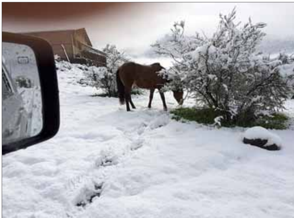
CERRO LAS CARRETAS.- Este caballo disfrutaba a la intemperie del amanecer en el cerro de las carretas, en Putaendo.

2.4°C y que esa medición será un parámetro de referencia para lo que viene durante la semana, cuando según las estimaciones, difícilmente las temperaturas máximas alcancen los 15°.