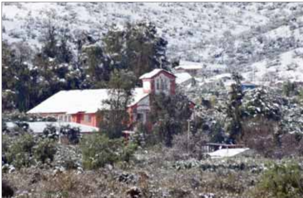
La iglesia de Santa Filomena también fue emblanquecida por la nieve el día sábado, así también los cerros del sector.