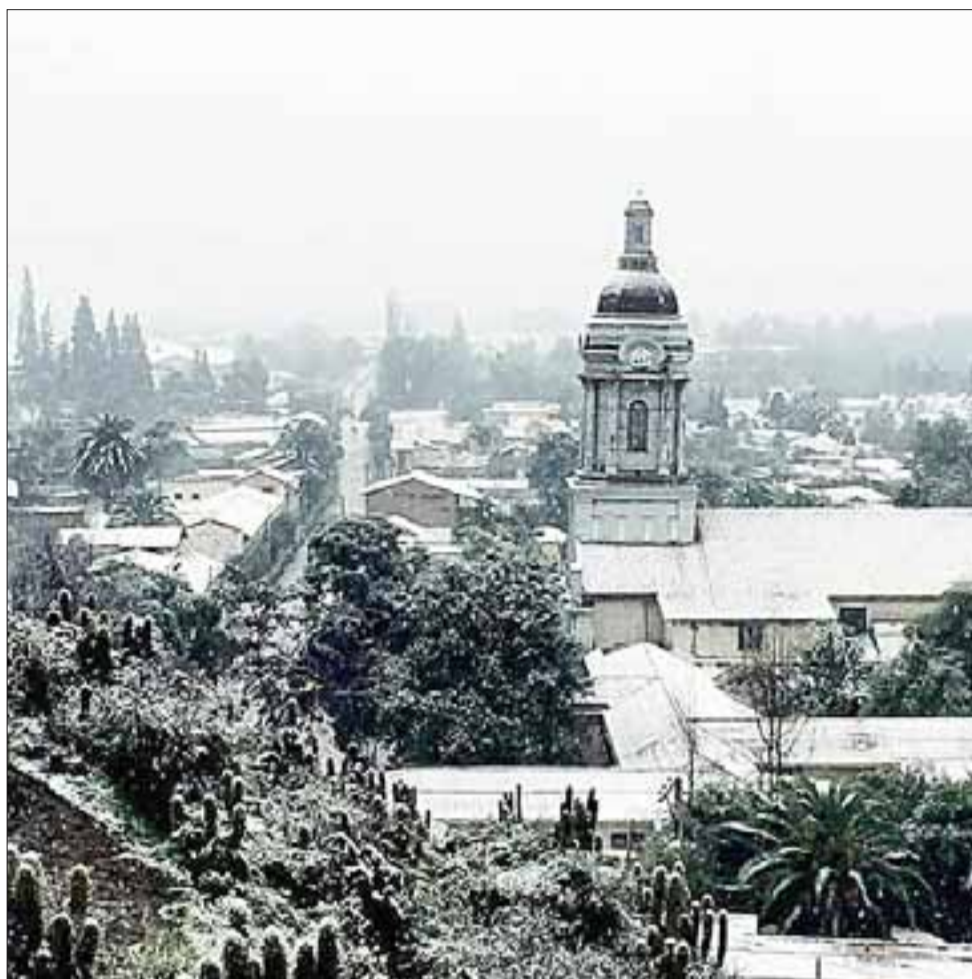
BLANCO ALMENDRAL.- Así lucía El Almendral bajo la nevada, gráfica tomada desde el cerro por nuestro colaborador Francisco Bazáez.