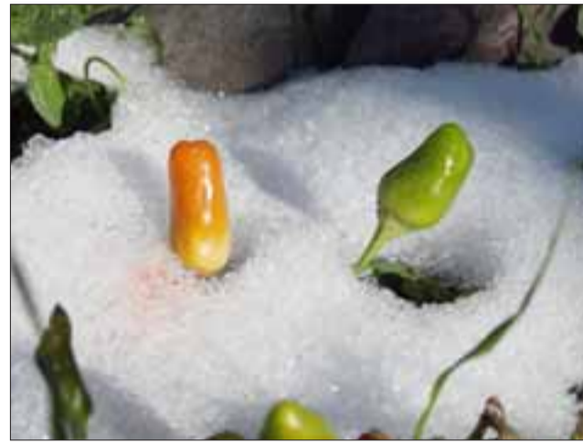
AJÍ DE JARDÍN. - Pese a las crudas y bajas temperaturas, en los jardines de nuestras casas sigue surgiendo más fuerte la vida.

«Mientras más alta la zona, más nieve cayó, se mantendrá despejado por