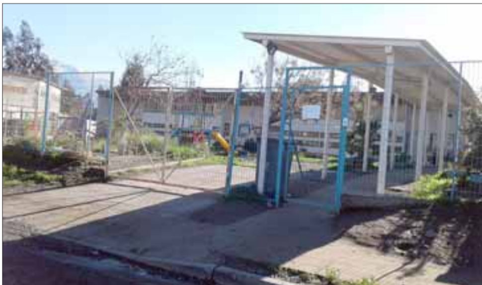
Este es el frontis del Jardín Infantil ‘El Rincón de los Angelitos’, ubicado al final de Villa Juan Pablo II en San Felipe.