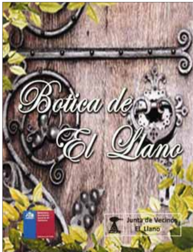
UN LOGRO PROPIO.- Esta es la portada del libro escrito por los vecinos de El Llano.