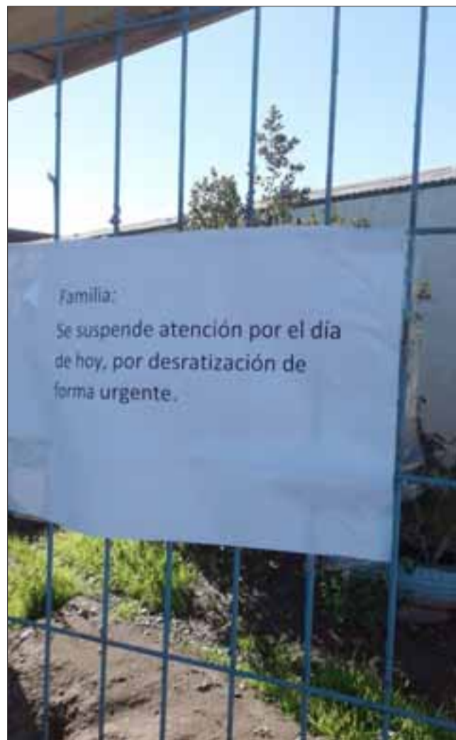
Este era el letrero que había en la puerta principal de acceso al jardín infantil.