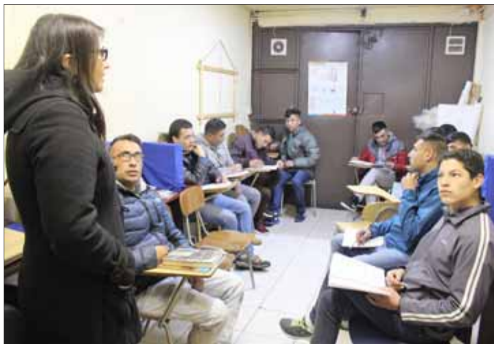
Bastante participación han demostrado los internos del Taller de Fomento Lector que la Dibam efectúa en los establecimientos penitenciarios de San Felipe y Los Andes (en la foto).

“Muy bonita experiencia. En realidad hemos aprendido bastante. Si