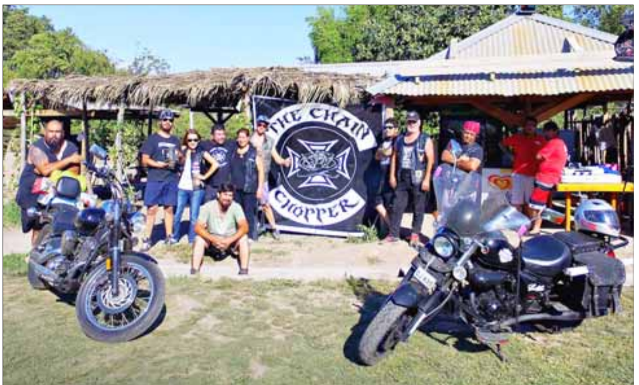
THE CHAIN CHOPPER.- Aquí tenemos a parte de los motoqueros que conforman The Chain Chopper de San Felipe, quienes próximamente serán distinguidos a nivel comunal.

Actualmente cuenta con 18 socios activos, provenientes de diferentes localidades del Valle de Aconcagua. Dentro de las actividades en que participan y en las cuales se destacan por su compromiso y espíritu de cooperación están la Teletón, visi-