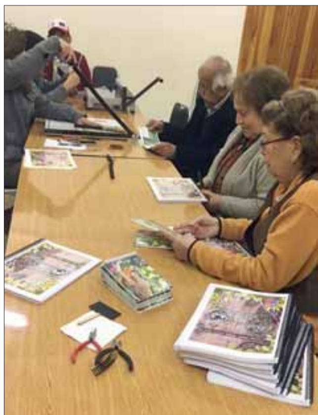
ELLOS MISMOS.- Cada etapa de la elaboración de este libro fue desarrollada por sus mismos autores.