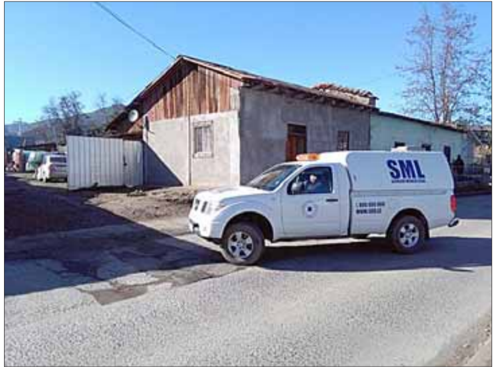
El joven de 23 años se encontraba residiendo en la casa 24 de la Avenida Pascual Baburizza, donde falleció la mañana de ayer por causas que no están determinadas.

La joven víctima registraba residencia en la zona sur del país y había llegado a Los Andes para desempe-