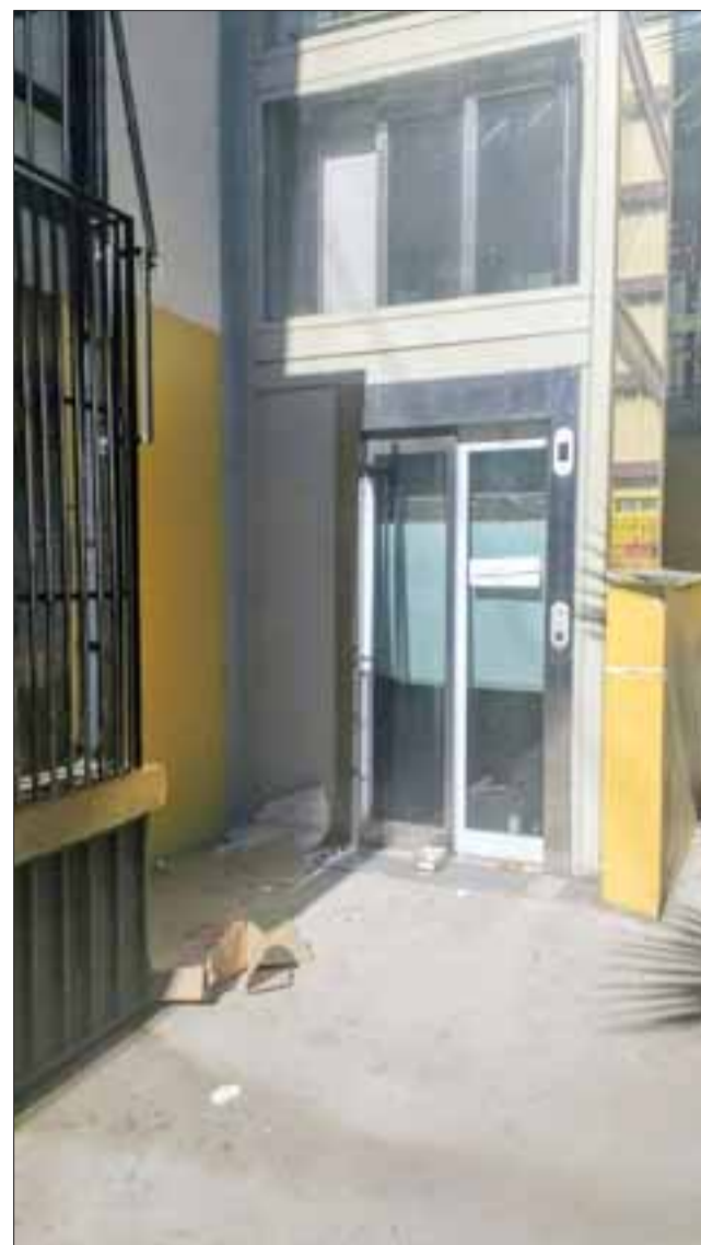
Más de un mes lleva inoperativo el nuevo ascensor de la Municipalidad de San Felipe.

Respecto de las medidas que puede tomar el municipio sanfelipeño, el administrador municipal no descartó la posibilidad de iniciar acciones legales contra la empresa y advirtió que “quizás en algún momento estudiaremos la posibilidad de ejercer nuestro derecho y entablar una demanda, pero ese es un tema que no hemos querido abordar porque esperábamos que la empresa respondiera de buena forma; hasta el momento no lo ha hecho, por lo que tu-