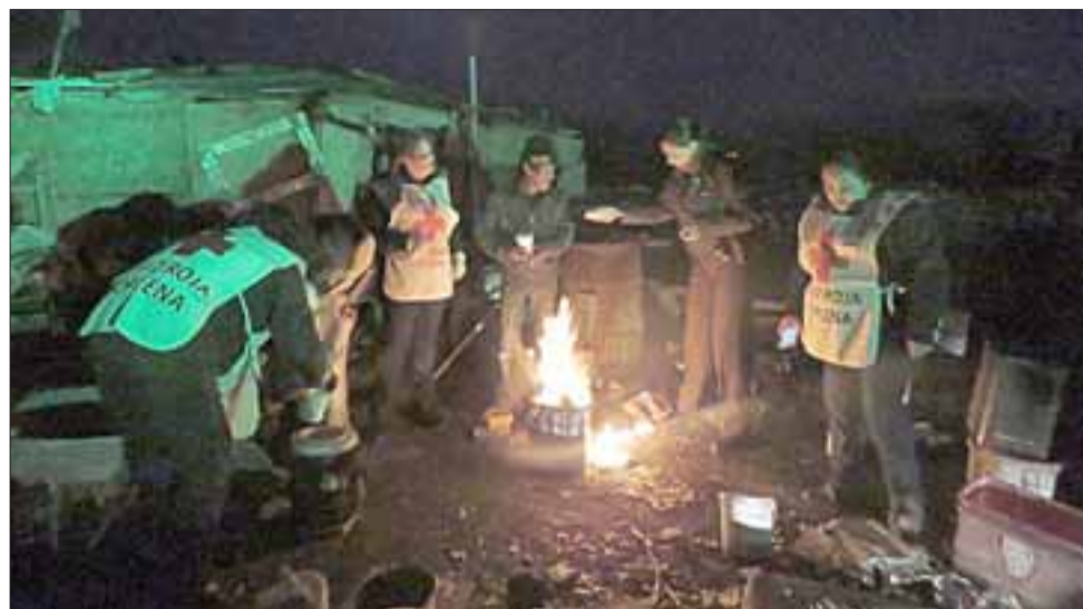
Municipio sanfelipeño tiene un registro de 71 personas en situación de calle, y en situaciones especiales, como las bajas temperaturas del viernes, con la ayuda de Carabineros, a través de la ruta social calle-noche, se traslada a aquellos que no están de acuerdo con ir voluntariamente.

De acuerdo a lo manifestado por el profesional, el municipio sanfelipeño tiene catastradas a 71 personas en situación de calle, cifra que se relativiza diariamente, puesto que "son nómades y se desplazan dentro de las distintas comunas" , hecho que obliga al equipo social de la Municipalidad, estar actualizando y reorganizando constantemente su logística de trabajo, ya que esta cifra indica que sólo el 50 por ciento de los indigentes