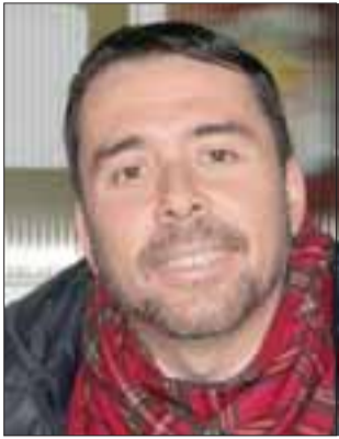
Andrés Contador Parera, será distinguido el 3 de agosto en la categoría Funcionario Público 2017.