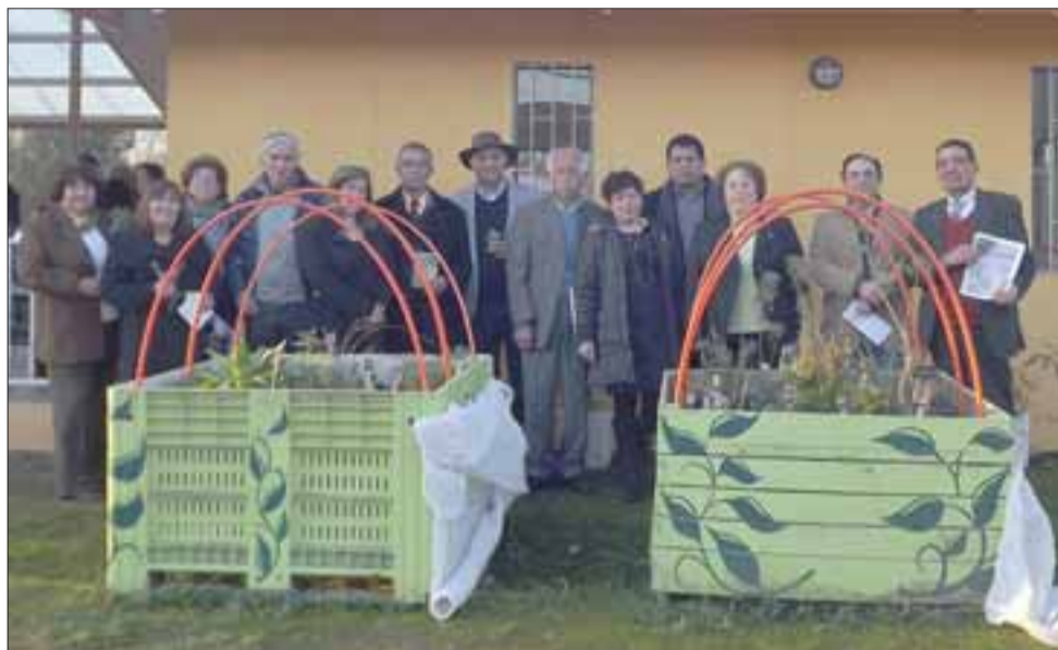
LOS AUTORES.- Ellos son los vecinos de El Llano, quienes este fin de semana presentaron su segundo libro: Botica El Llano.