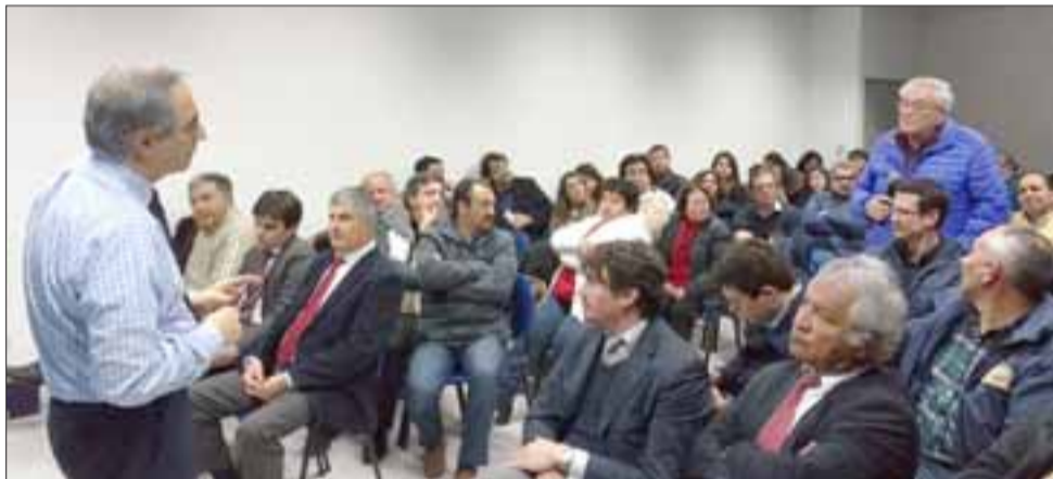
Bastante público asistió a la actividad realizada por la Carrera de Derecho de la Universidad de Aconcagua, en la que se recibió la presentación del libro del Senador Francisco Chahuán.

tarios en ejercicio y destacados expositores que han ayudado a que nuestros estudiantes enfrenten posturas y conozcan las diferentes visiones sobre los temas de contingencia en el país. Esto es parte de nuestro programa de vinculación con el medio y por lo mismo estamos muy contentos de que cada vez más personas de la comunidad lleguen a nuestras salas para participar de estas acciones”, sostuvo el Docente.