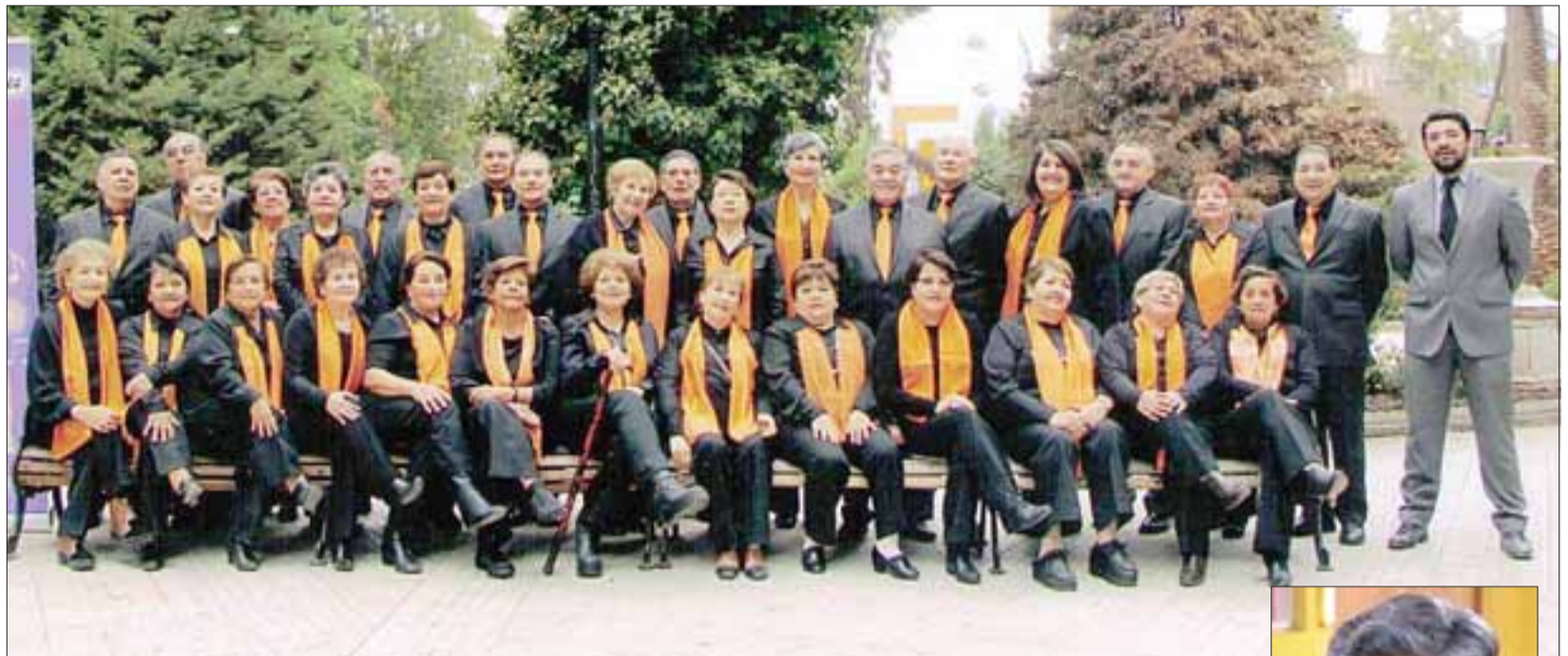
CORO DE PRIMERA. - Ellos son los integrantes del Coro Adulto Mayor de San Felipe, quienes desarrollarán un grandioso Bingo este viernes 21 de julio desde las 16:00 en Ayecán.