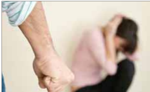
La víctima denunció el delito de violencia intrafamiliar ante Carabineros de la comuna de Santa María. (Foto Referencial).

Episodio fue denunciado por una víctima de la población Los Robles de Santa María.