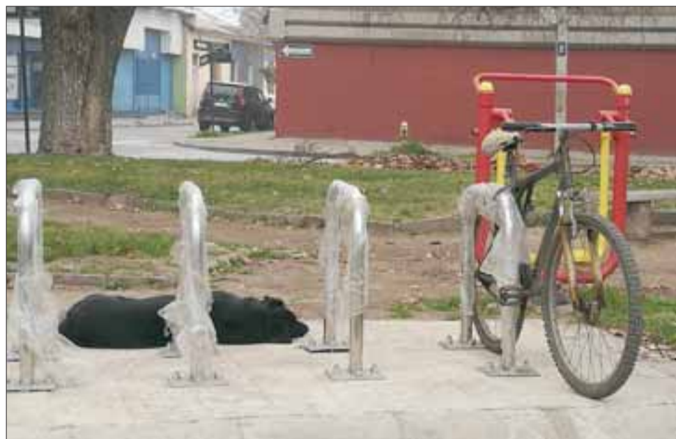
AÚN SIN INAUGURAR. - Aquí vemos estos cicleros, no los han inaugurado pero ya están siendo instalados.