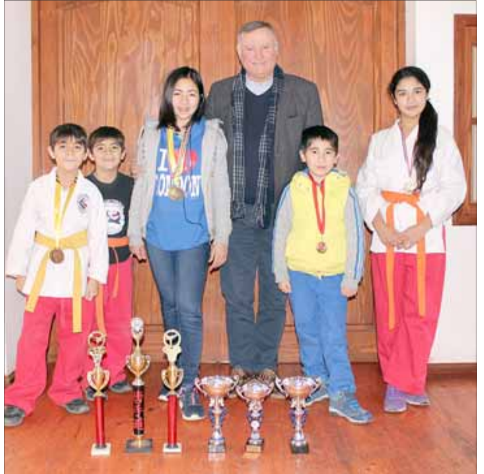
Los menores, con trofeos en mano, agradecieron a la autoridad comunal el constante apoyo brindado para el desarrollo de sus actividades deportivas.

Para el alcalde Luis Pradenas, se trata de una política destinada a apoyar todas las actividades deportivas por igual, «y ha quedado de manifiesto que cada una de las organizaciones deportivas de la comuna, logran obtener importantes resultados en sus competencias o participacio-