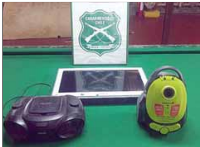
En aquel entonces Carabineros recuperó los electrodomésticos que fueron robados por el delincuente en una vivienda de la población Los Copihues de Llay Llay.

Cabe señalar que el antisocial cuenta con antecedentes delictuales por delitos de porte de arma blanca, robo en lugar no habitado y tenencia de drogas.