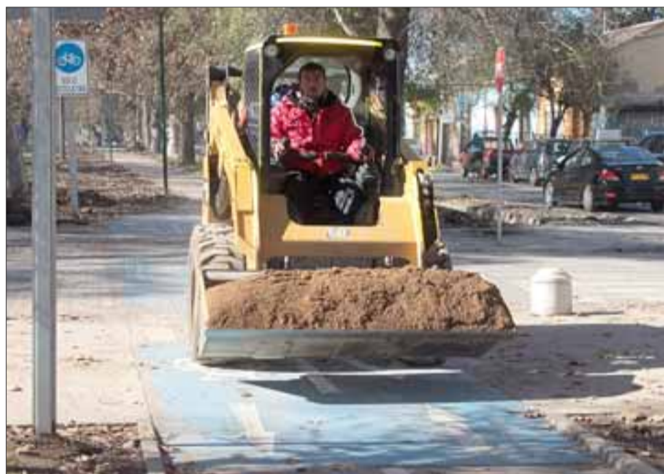
FALTA MUY POCO. - Como lo muestra esta gráfica, aún las ciclovías no son terminadas, pero ya los sanfelipeños las usan con entusiasmo.