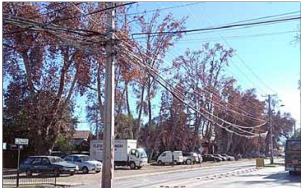
Al margen de la contaminación visual, los cables colgando pueden provocar accidentes con camiones y cortes de energía eléctrica o de otros servicios.

Remarcó que en esta mesa de trabajo están todas las empresas involucradas y