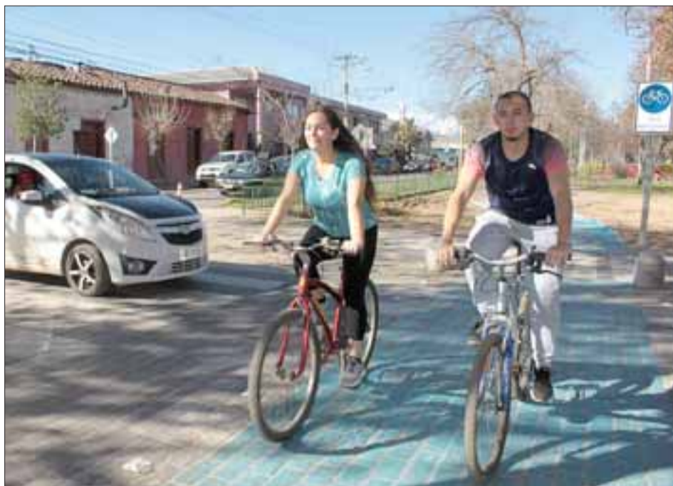
PRIORIDAD DE PASO. - Los sanfelipeños ya están usando las ciclovías, lo que demuestra la gran necesidad y aceptación de estas vías urbanas para este sector de vecinos. Ellos tienen prioridad de paso ante el automovilista, pero igualmente deben ceder el paso a los peatones.