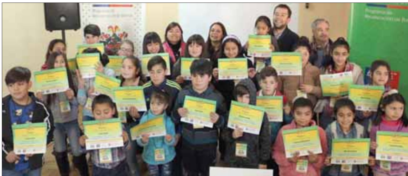
Una importante participación de menores tuvo el taller de mini reporteros del programa 'Quiero Mi Barrio' en Las Cuatro Villas.

Respecto al objetivo del taller, la periodista señaló: «La idea es que ellos puedan contar con las herramientas necesarias para poder cubrir noticias, eventos positivos que están sucediendo en el sector donde viven y puedan comunicarlas a través de diarios murales que se van a instalar prontamente y que