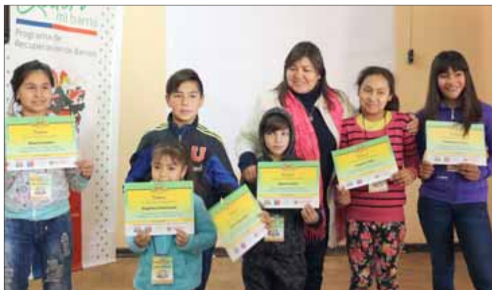
Los pequeños estaban felices al recibir sus certificados.

para nuestros vecinos. Estamos certificando a actores relevantes con el curso de mini reporteros, ¿qué significa esto? que nuestros niños pueden dar a conocer las noticias del barrio y eso tiene que ver con las buenas noticias, las noticias que generan instancias reales en torno a la cooperación, al trabajo en conjunto y al buen vivir».