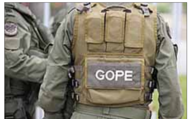
El Gope de Carabineros de Valparaíso concurrió hasta una vivienda de la Villa El Esplendor de San Felipe para el levantamiento de un proyectil tipo mortero.

Tras esta información Carabineros concurrió hasta el domicilio, confirmando la ubicación del proyectil, desconociéndose hasta ese momento si el mortero se encontraría activo o no, clausurando el sitio del suceso para dar cuenta al Fiscal de turno, quien instruyó la concurrencia del personal del