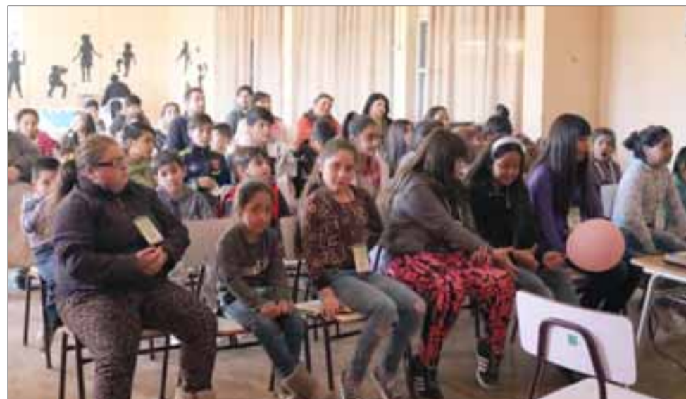
En la ex Escuela Hogar se realizó la ceremonia de certificación de niños y niñas que participaron del taller, en presencia de sus familiares.