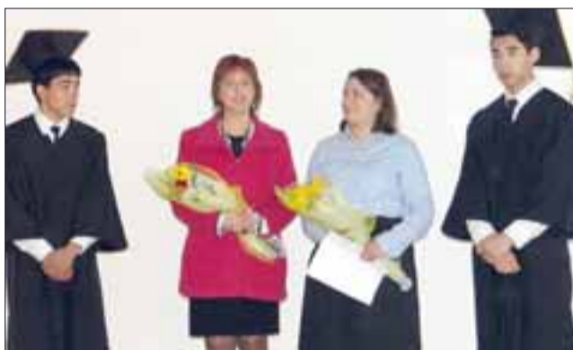
TITULACIÓN 2017. - Once alumnos de la Escuela Industrial y diez estudiantes de la Escuela Agrícola fueron seleccionados para conformar Access.