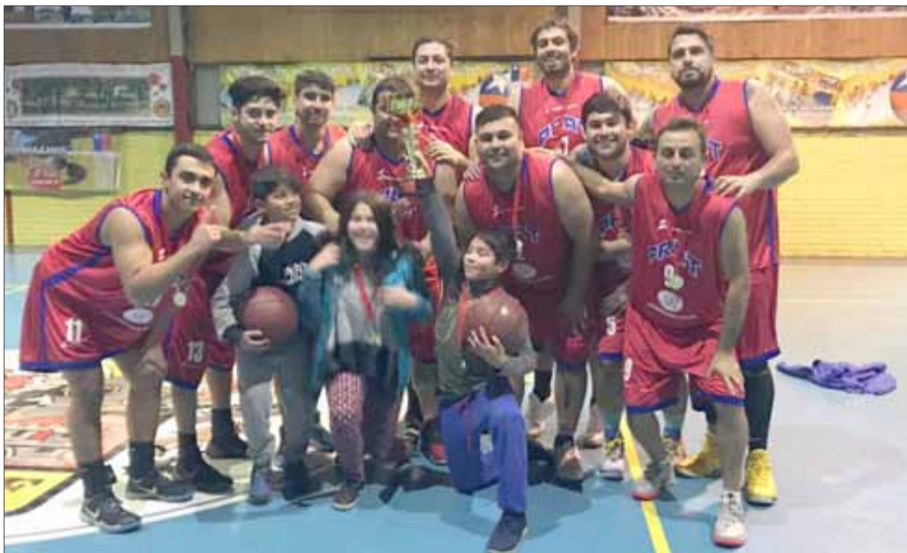
El experimentado cuadro del Arturo Prat se alzó como el mejor de todos en el campeonato de Apertura de la Asociación de Básquetbol de San Felipe.