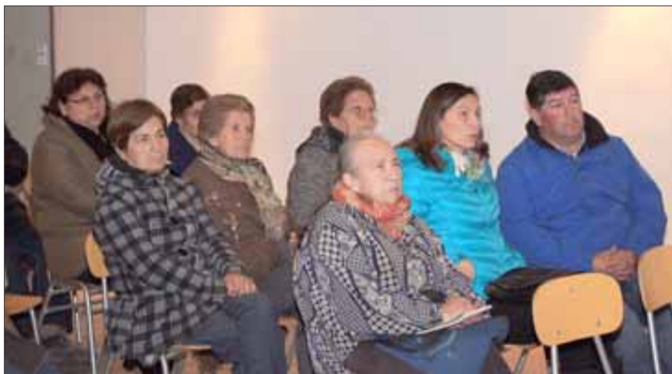
Vecinos de Putaendo centro escuchan atentos las buenas noticias relativas a la nueva iluminación led en el sector urbano.