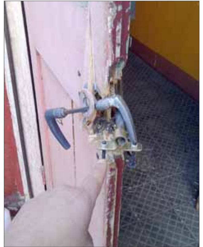
La imagen muestra el daño en una de las chapas.

Finalmente cabe señalar que se realizó la denuncia pertinente ante Carabineros de San Felipe.