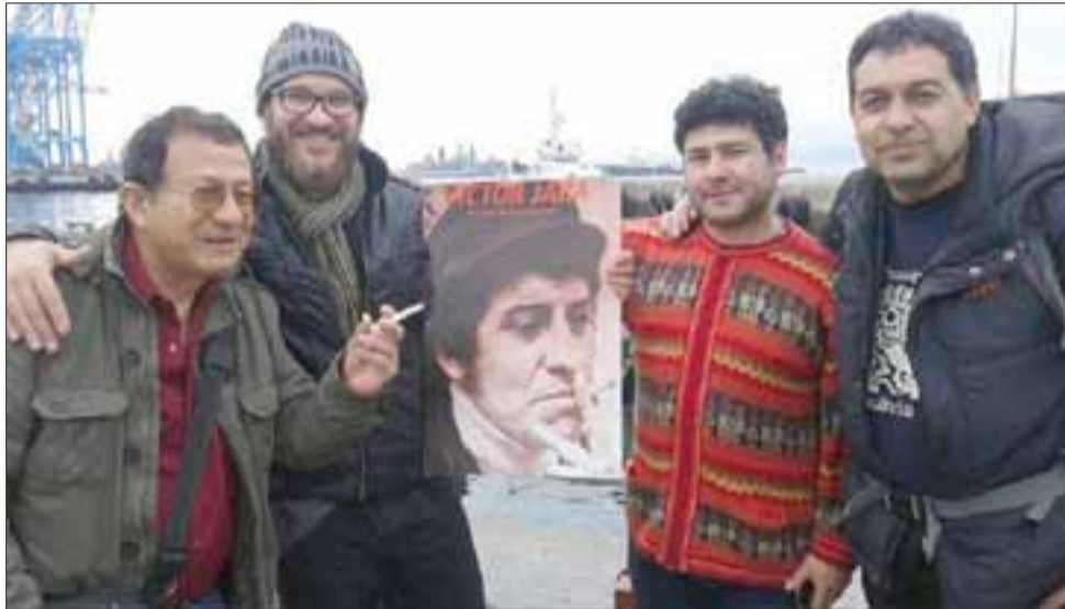
ENCUENTRO BINACIONAL.- Aquí tenemos a estos artistas y viajeros internacionales, posando para las cámaras de Diario El Trabajo, en Argentina.