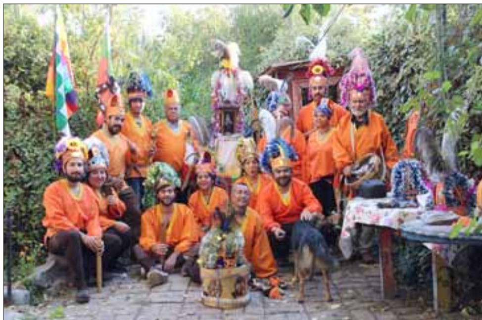
SIEMPRE SALMÓN. - Ellos son los integrantes del Baile Chino Aconcagua Salmón, fieles religiosos que realizarán todo el domingo 30 de julio en Putaendo la gran Fiesta de Nuestra Señora de la Madre Tierra.

Esta actividad cuenta con la colaboración activa de la comunidad parroquial y el Grupo Folclórico San Antonio, así como diversas instituciones: Municipio de Putaendo, escuelas San Alberto de Guzmanes, Paso Histórico de El Tártaro, Marie Poussepin de Putaen-