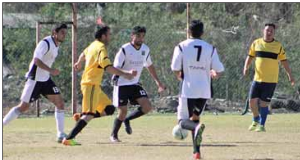
Nutrida es la agenda para este fin de semana en el balompié aficionado de San Felipe.

Asociación de Fútbol de San Felipe Domingo 30 de julio Unión Delicias – Alianza Curimón; Mario Inostroza – Unión Sargento Aldea; Arturo Prat – Ulises Vera; Alberto Pentzke – Libertad; Juventud Antoniana – Juventud La Troya.