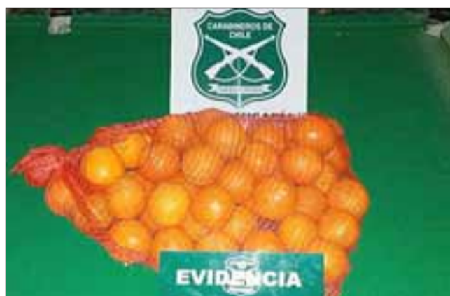
Carabineros recuperó esta malla de naranjas sustraídas por el antisocial.

El imputado fue detenido en flagrancia por Carabineros de la Subcomisaría de Llay Llay, siendo puesto a disposición del Tribunal de Garantía que lo dejó privado de libertad.