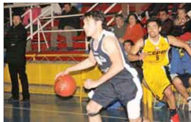
Mañana ante Liceo Curicó, el Prat jugará su último partido de la fase regular de la Libcentro A.

A la postemporada avanzaron: Liceo Curicó; Puente Alto; Sportiva Italiana y Arturo Prat.