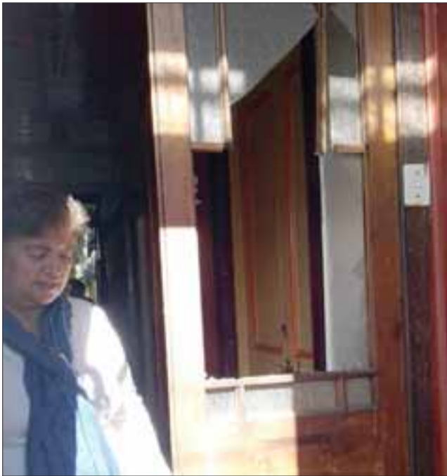
La dirigente junto a la puerta cuyo vidrio está quebrado.