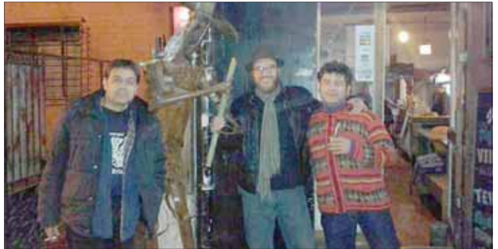
HERMANADOS POR EL ARTE.- Poetas y músicos de ambos países se unieron para desarrollar el evento 'Poésica Raíz Latinoamericana 2017'.