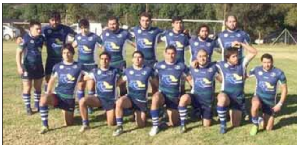
El quince de Los Halcones son dominadores del grupo A de la Liga Arusa.

Halcones 19 Toros de Quillota 16 San Bartolomé 11 Old Algonians 7 Carneros 2