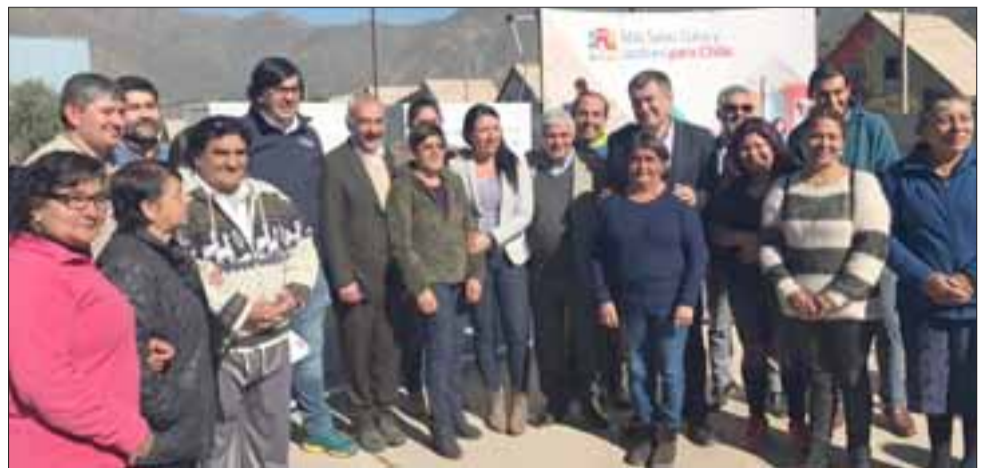
Vecinos de las villas Sol Naciente, Renacer, Industrial y 250 Años, felices junto a las autoridades durante la entrega del terreno donde se levantará el jardín más grande de la provincia.

En tanto, el Gobernador León, indicó que el gobierno de la presidenta Bachelet se comprometió en sacar adelante al sector de las Cuatro Villas, el que había sido poster-