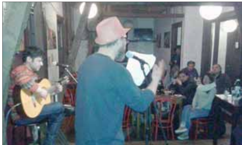
GIRA CULTURAL.- Aquí tenemos a nuestros embajadores culturales, recorriendo la ciudad de Mendoza.