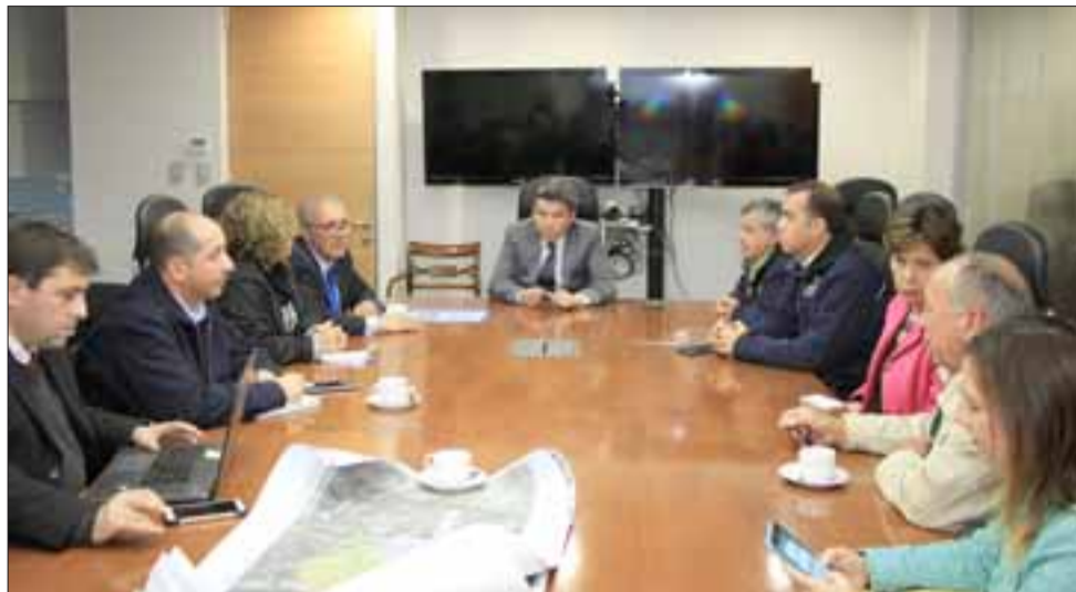
Autoridades y dirigentes putaendinos se reunieron con el Ministro de Medio Ambiente, Marcelo Mena , para darle a conocer el oscuro panorama que enfrenta la comuna.

Complementariamente, el jefe comunal anunció que «se realizarán todos los actos administrativos y judiciales tendientes a impedir el deterioro del medio ambiente que ha ocasionado y que podrían ocasionar faenas mineras en la cordillera y cuenca de nuestros ríos».