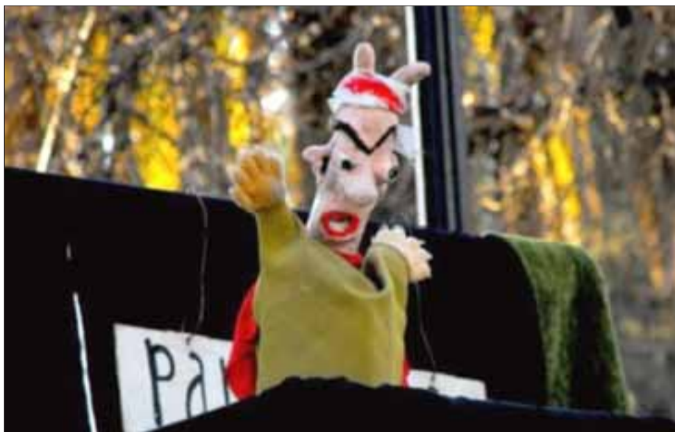
LLEGA EL PANADERO. - Esta obra tiene una duración de una hora y está destinada a niños de cinco años en adelante y a todo el grupo familiar en su conjunto.