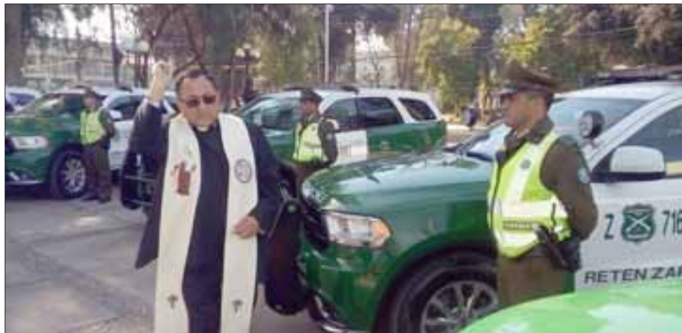
Los nuevos vehículos fueron bendecidos en ceremonia realizada en pleno centro de San Felipe.

Por otra parte, según informó la repartición policial aconcagüina, esta adquisición se enmarca en un plan desarrollado por la Dirección Nacional de Logística de la institución uniformada, que busca dotar a Carabineros de Chile, de un parque vehicular de vanguardia y moderna tecnología.