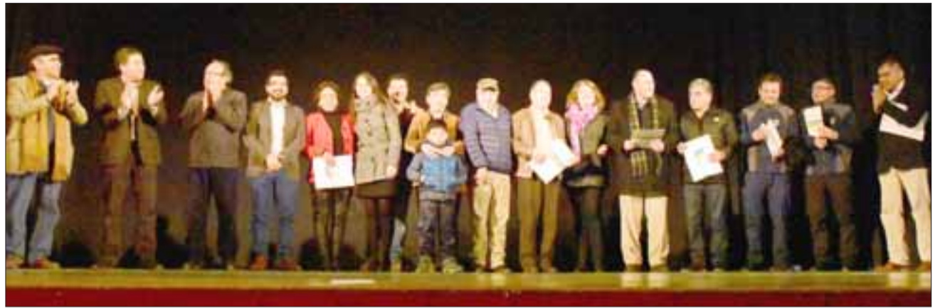
Diversas instituciones y organizaciones accedieron a este beneficio, que en esta ocasión superó los 110 millones de pesos.

Todas las demás organizaciones beneficiadas, que van desde clubes deportivos