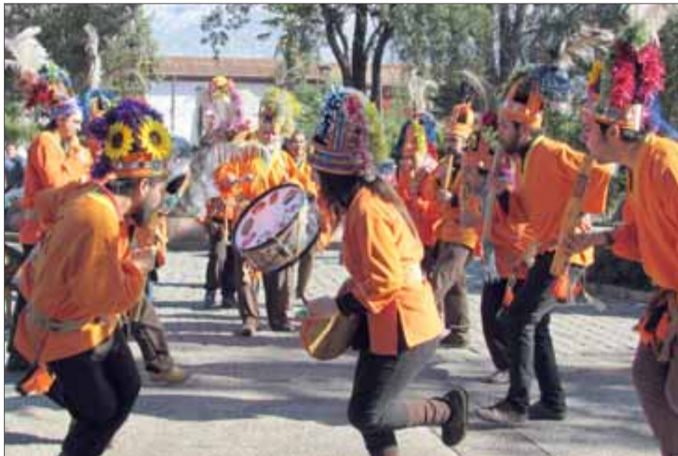
DOMINGO DE FIESTA. - Esta iniciativa organizada por Aconcagua Salmón, pretende fomentar y rescatar las tradiciones devocionales, especialmente los bailes 'chinos' del Chile central.

Esta iniciativa organizada por Aconcagua Salmón, pretende fomentar y rescatar las tradiciones devocionales, especialmente los bailes 'chinos' del Chile central, que en 2014 fueron declarados por la Unesco Patrimonio Intangible de la Humanidad.