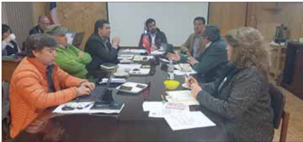
El Concejo Municipal aprobó el usufructo de la ex estación de trenes de Llay Llay para construir un Centro Cultural.