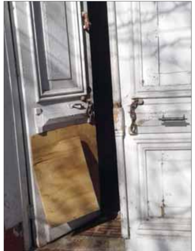
Acá se aprecian daños en la puerta de entrada.