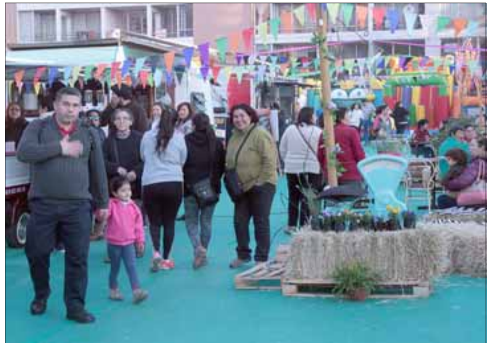
SABOR EN FAMILIA. - Familias enteras están disfrutando a lo grande de esta opción urbana para disfrutar con sus hijos comidas rápidas y sana diversión en el centro de San Felipe.