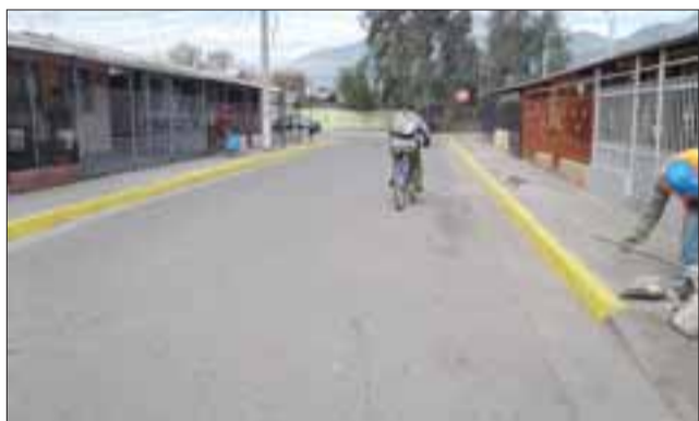
Acá se aprecia la solera pintada de amarillo, lo que impide estacionarse.

Hechas las averiguaciones en fuentes municipales, se aseguró que los recorridos aún se encuentran en marcha blanca, realizándose precisamente ayer una reunión entre el Alcalde Patricio Freire, autoridades municipales y empresarios de los microbuses para analizar las situaciones conflictivas que se puedan presentar, tal como la que ocurre en Santa Brígida, donde la cordura dice que deberían realizarse cambios para no complicar la existencia a los vecinos del sector.