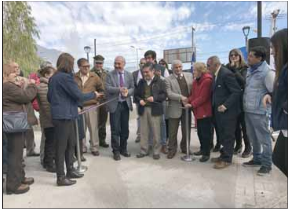
Autoridades presentes en la inauguración de la remodelación de la pérgola en Chacabuco con Maipú.