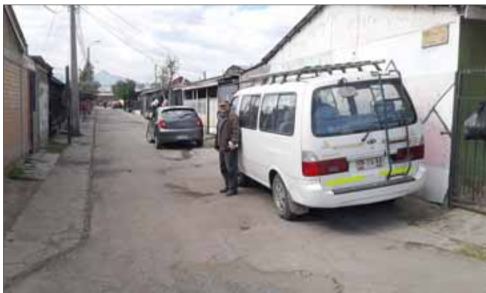
Uno de los vecinos nos muestra su furgón estacionado en un pasaje, lo que obstaculizaría el paso del camión recolector de basura o alguna emergencia.