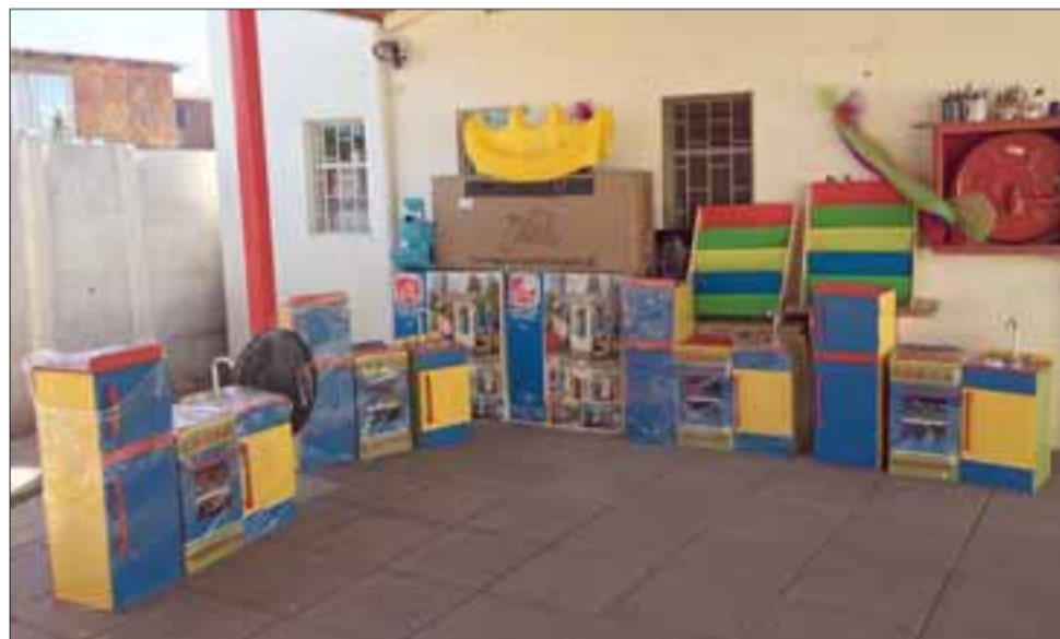
A JUGAR NIÑOS. - Este es el donativo que el empresario chileno Andrónico Luksic hizo llegar a los pequeñitos de este jardín infantil sanfelipeño.