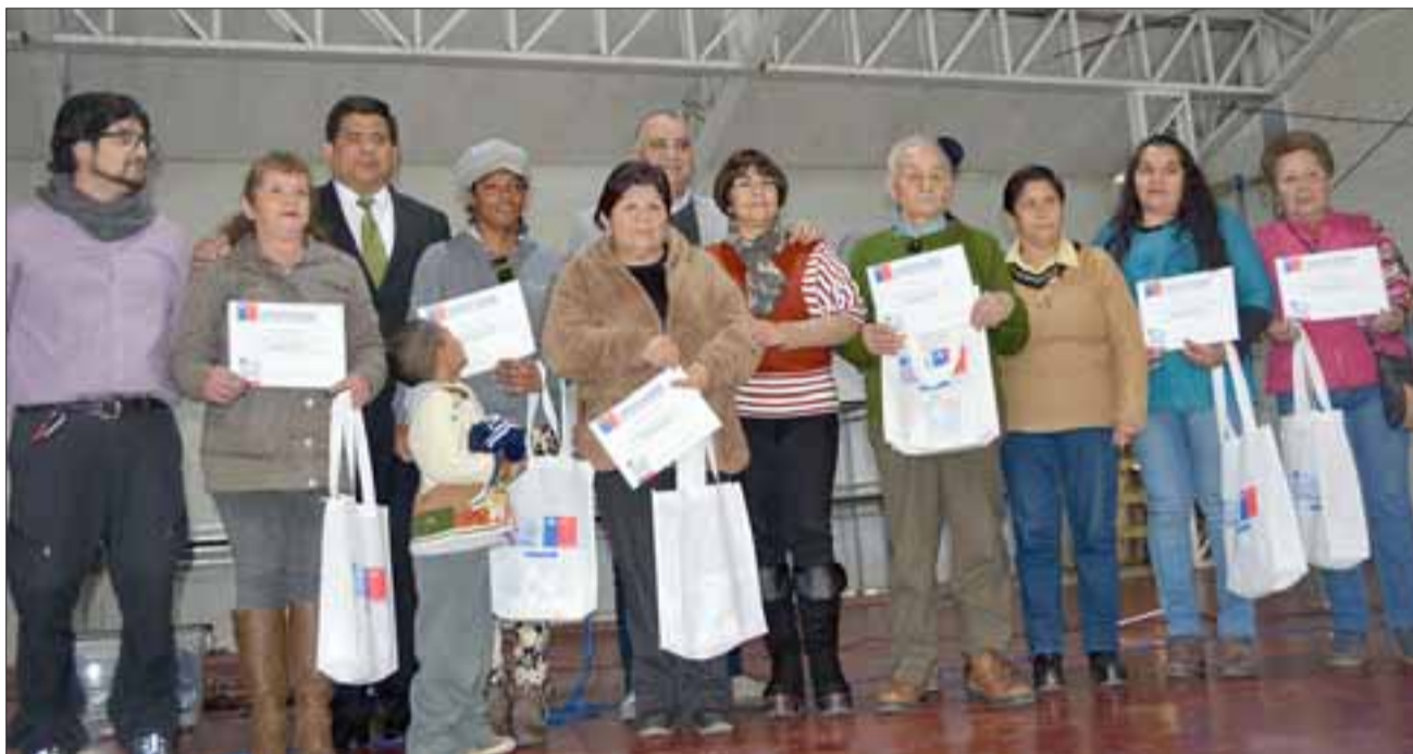
En total fueron 450 familias las que recibieron la charla y el kit de energía eficiente en Santa María.