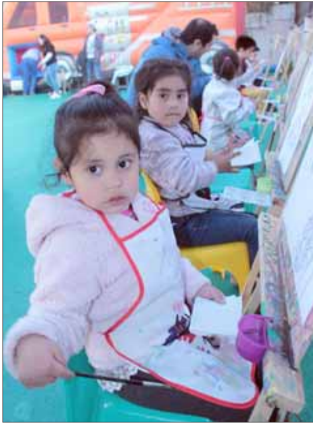
PEQUEÑAS ARTISTAS. - Estas pequeñitas también son parte de la nueva cosecha de pintores infantiles sanfelipeños.