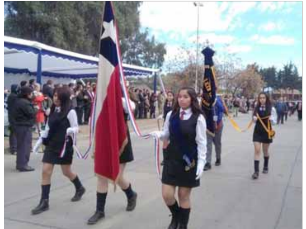
El tradicional desfile de los establecimientos educacionales y otras instituciones, se dio por cerrado el programa de celebración del aniversario de Los Andes.