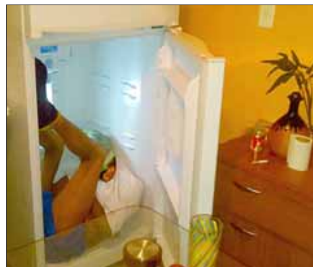
En una imagen similar a ésta, Carabineros de la Subcomisaría de Llay Llay detuvo al delincuente dentro del refrigerador, siendo puesto a disposición de la justicia que determinó su ingreso hasta la cárcel. (Foto Referencial).

El Juez de Garantía ordenó el ingreso del deteni-