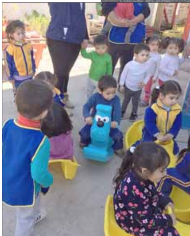
SU FELICIDAD NO TIENE PRECIO. - Es tanta la alegría de estos niños, que hasta hacen fila sin llorar, esperando su turno para poder jugar en estos juguetes ahora instalados.