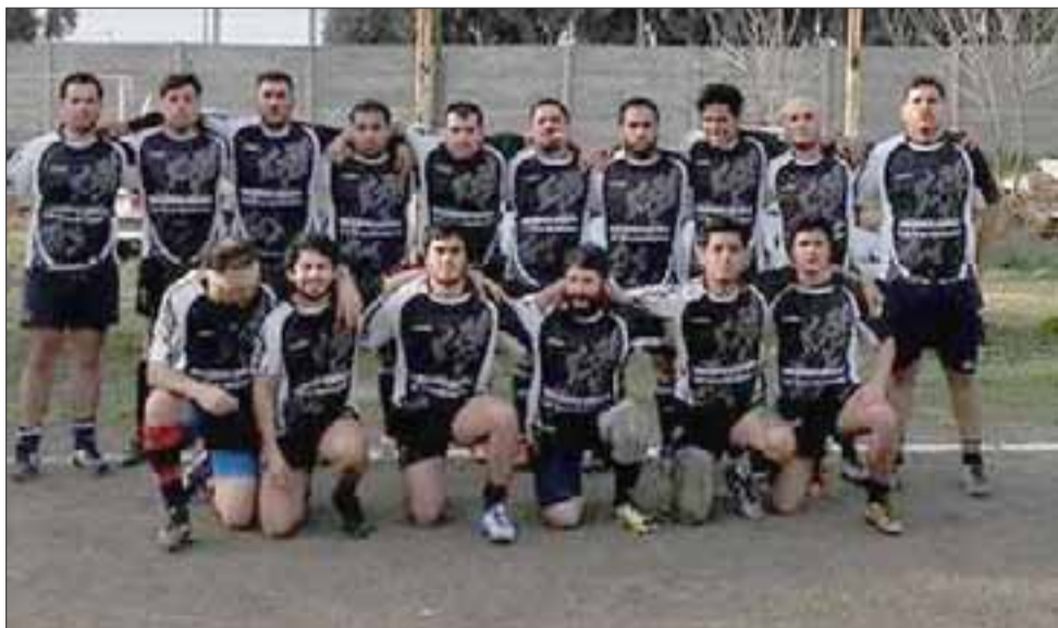
San Felipe Rugby se impuso sobre URSA en el comienzo del Clausura de la liga Metropolitana.