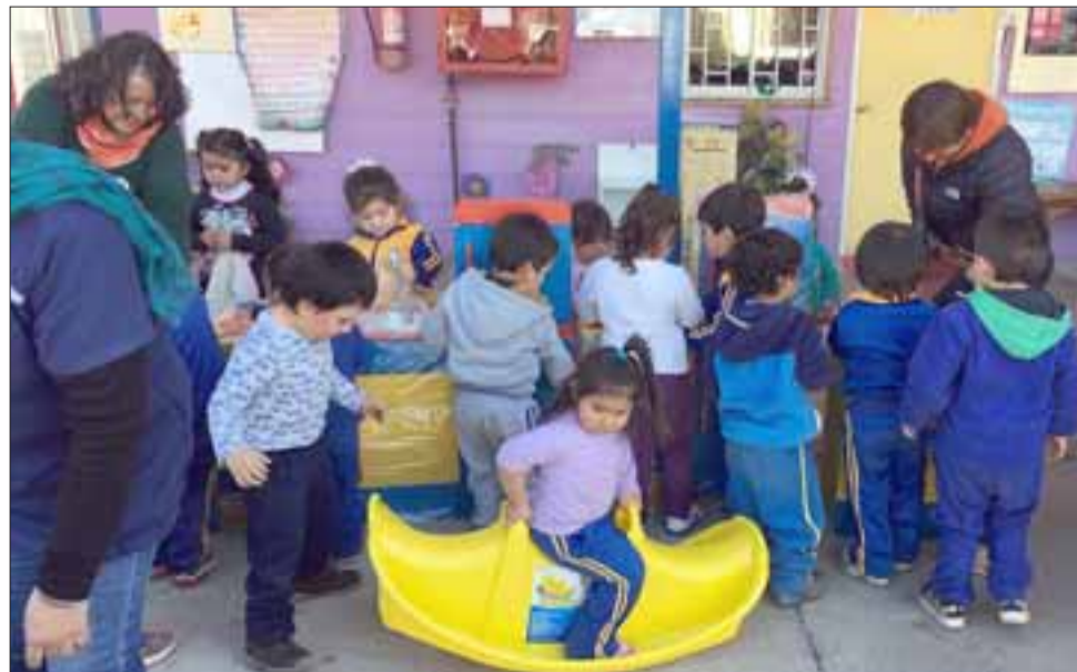
PEQUES COMO LOCOS. - Apenas los juguetes fueron sacados de sus cajas, los pequeñitos nada tímidos se dispusieron a disfrutarlos en el patio.