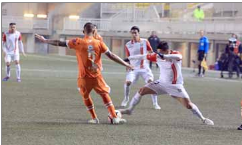
Con una derrota por la cuenta mínima, Unión San Felipe inició su participación en el torneo de Transición de la Primera B.