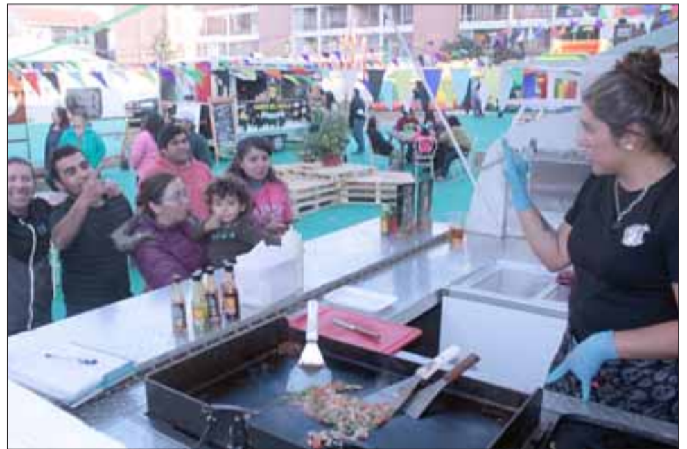
LOS FAVORITOS DE MUCHOS. - La demanda de tacos de carne es enorme, peques y grandes los piden en este lugar.