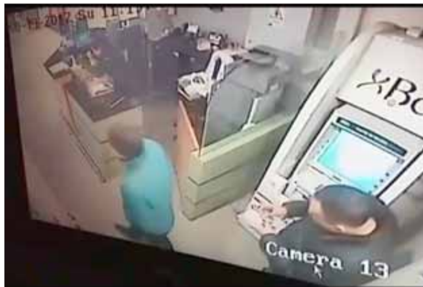
Luego de unos segundos los dos involucrados de nacionalidad colombiana abandonan el supermercado ubicado en Avenida Miraflores 2332 en San Felipe.