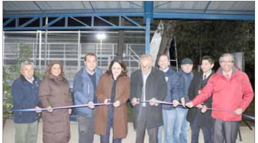
El alcalde Guillermo Reyes encabezó la ceremonia de inauguración destacando los logros académicos del establecimiento.

habrá nuevas obras de mejoramiento inauguradas en distintos establecimientos educacionales de la comuna. Por otro lado, el alcalde Reyes recalzó una serie de avances que ha tenido el sector de Piguchén, como la remodelación de la posta rural del sector, mejoras en el estadio con un nuevo tranque acumulador y la construcción de un jardín infantil.