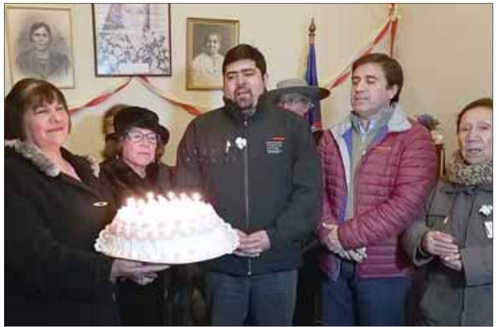
Con gran emotividad se celebró el 93° aniversario de la Sociedad Mutualista de Los Andes, integrada por 50 mujeres de la ciudad.

«El mutualismo jugó un papel importante en Chile que tal vez se ha olvidado. Se trata de llevar un sistema de economía diferente, entre ellas se ayudaban, formaban cooperativas que generaban recursos que iban en directo beneficio a las personas que pertenecían a la sociedad. Nosotros como Gobierno