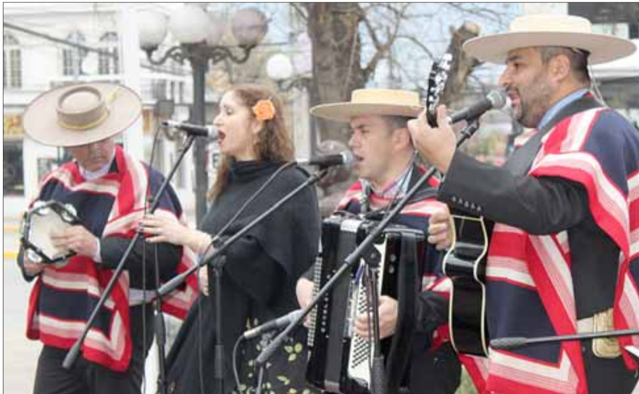
DESDE LINARES.- Ellos son el Grupo Los Roblerinos, de la comuna de Linares, quienes alegraron con gran ritmo este Cuecazo comunal.

«Esta propuesta fue animada por tres conjuntos, que son los tres mejores conjuntos folklóricos de Chile, Los Maihuen , que vienen de la comuna de Los Ángeles, Los Roblerinos , de la comuna de Linares y Las Colchaguinas , que vienen de Rancagua. La actividad inició a las 11:00 horas y se extendió hasta las 13:00 horas.