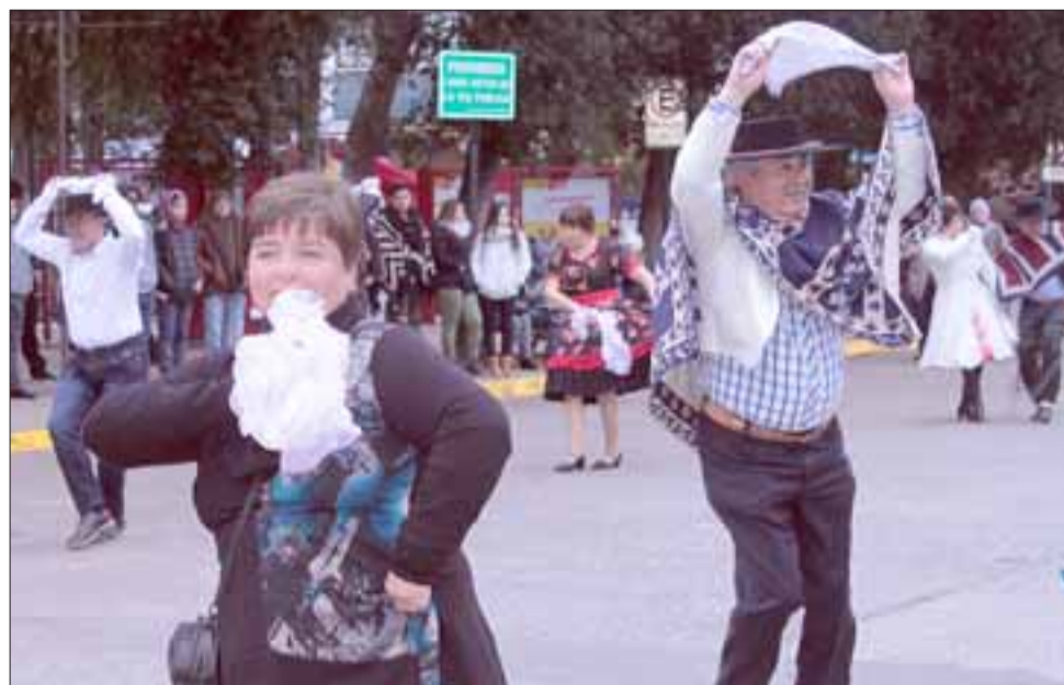
NADA TÍMIDOS.- Esta pareja supo en grande disfrutar del evento '277 Pañuelos al viento', que organizó la dirección de Administración y Finanzas, la Municipalidad de San Felipe.