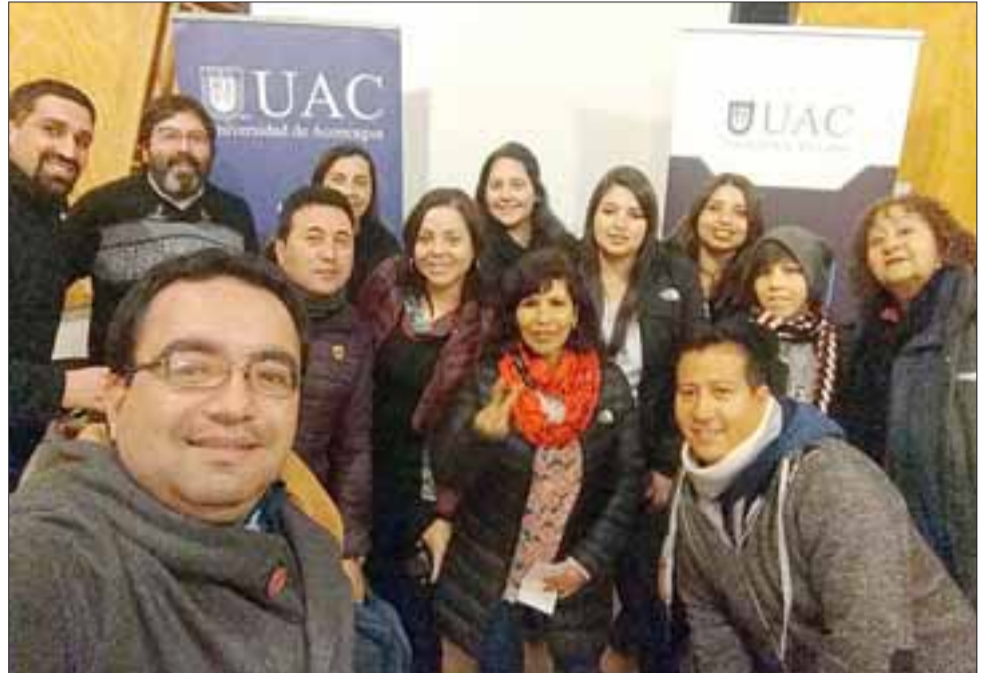
Gracias a una alianza con la carrera de Fonoaudiología de la Universidad de Aconcagua, tanto los docentes como los artistas recibieron nociones básicas sobre el cuidado del aparato fonador.

«Nuestra labor va más allá de la sala de clases. Como carrera queremos estar presente en cada lugar donde podamos participar y eso lo hacemos con mucho cariño y voluntad. Estamos muy agradecidos del Centro Cultural de Los Andes por invitarnos y