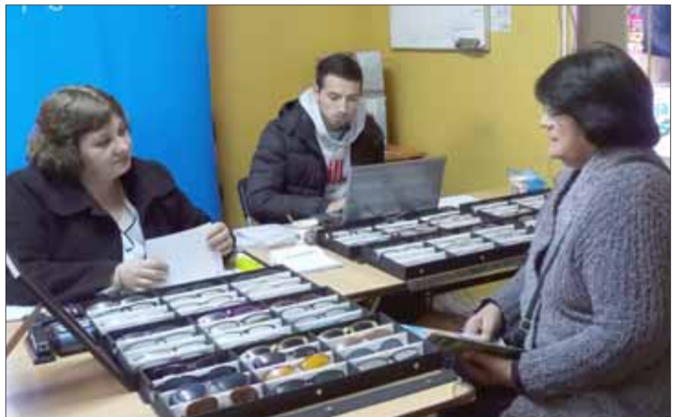
PARA VER MEJOR.- En el caso de los exámenes de la vista, una amplia variedad de servicios, lentes y marcos es la que habrá para quienes consulten.

Armadas y Carabineros, podían afiliarse individualmente a una Caja; a partir de 2008 los empleados públicos ya pueden afiliarse a las CCAF. Las Cajas pueden otorgar créditos sociales hasta siete años plazo, y con garantías hipotecarias de hasta 30 años gracias al DS N°54; en 2010 las Cajas de Compensación están autorizadas para otorgar créditos universitarios con garantía