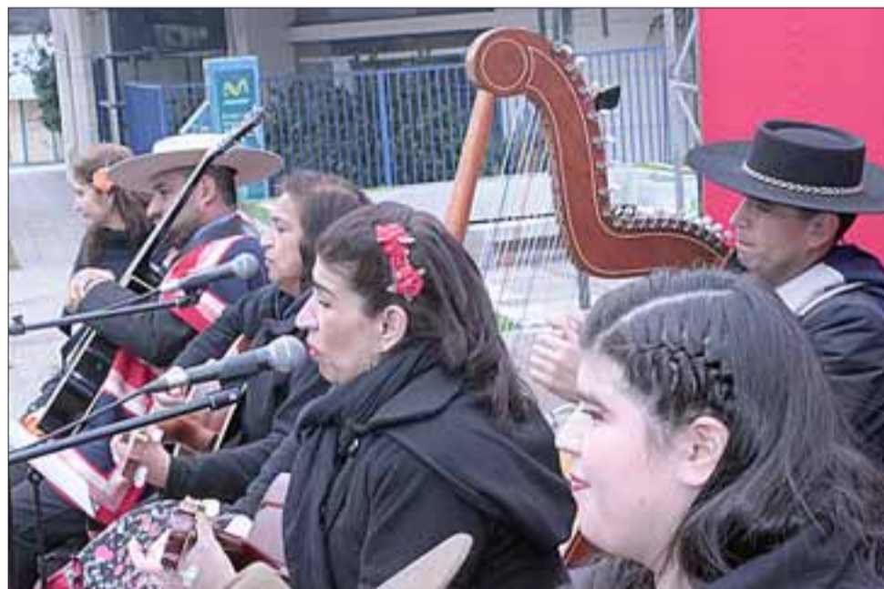
ELEGANTEMENTE IMPECABLES.- Aquí tenemos a Los Maihuen, que vienen de la comuna de Los Ángeles, ellos no dejaron a nadie descansar.