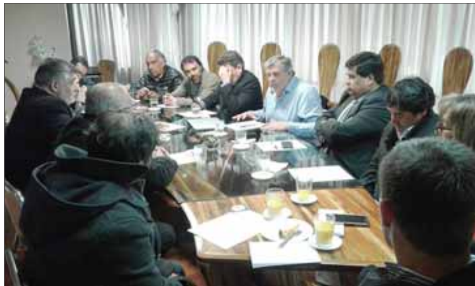
Los alcaldes de la Región Cordillera durante su última sesión llevada a cabo en San Felipe.

cisamente para poder liderar el proceso de crear la región de Aconcagua. Al respecto indicó que las acciones que han realizado fueron estar con el subsecretario de desarrollo regional, junto con ello saber que se le rescindió el contrato a la consultora, enterándose que ahora van a ser profesionales de la subdere y también externos a esta institución quienes van a seguir con los estudios de la nueva región de Aconcagua.