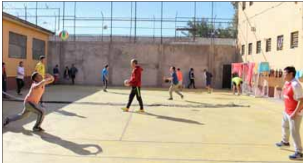
El concejal andino lleva poco más de un mes realizando un taller de vóleybol al interior del establecimiento penitenciario y ya son más de 20 los internos que decidieron cambiaron los goles y atajadas por las recepciones y remaches.

«Como Unidad siempre buscamos entregar la mayor cantidad de herramientas posibles para nuestros internos en materia de reinserción y el deporte es una de ellas. Por medio del deporte logramos mejorar la conducta de la población penal y disminuimos el stress tan propio de los establecimientos penitenciarios».