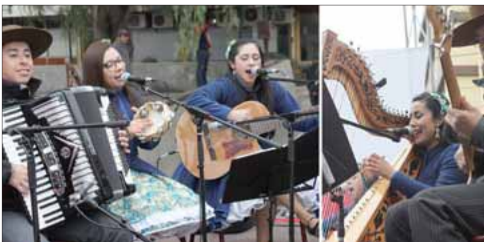
CALIDAD AL 100%. - Las Colchaguinas, de Rancagua, simplemente conquistaron al público con su arpa, belleza y folklore de gran calidad.