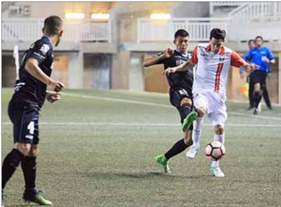
El equipo sanfelipeño no pudo sacar ventaja de su localía al jugar en un estadio prácticamente vacío.

pero una vez más y en lo que ha sido una constante durante este tiempo, todo resultó ser un ejercicio improductivo, porque no se aprovecharon las oportunidades de gol.