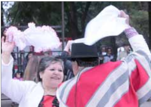
NUESTROS CUEQUEROS.- Ellos son muy conocidos en nuestra comuna, siempre alegres y siempre bailando.