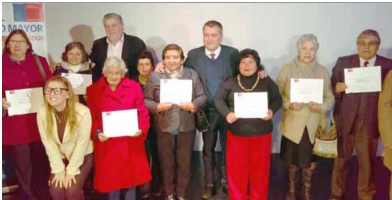
La ceremonia de certificación se desarrolló en el teatro municipal de San Felipe, al cual asistieron diversas agrupaciones de mayores de las comunas de la provincia, quienes este 2017 recibirán un monto superior a los 57 millones de pesos.

«Desde el año pasado estamos con un proyecto especial, con el cual descubrimos que en la comuna de Putaendo existen 83 adultos mayores postrados y que no cuentan con las condiciones adecuadas para que estén en sus camas, pues se les están produciendo escaras y otras