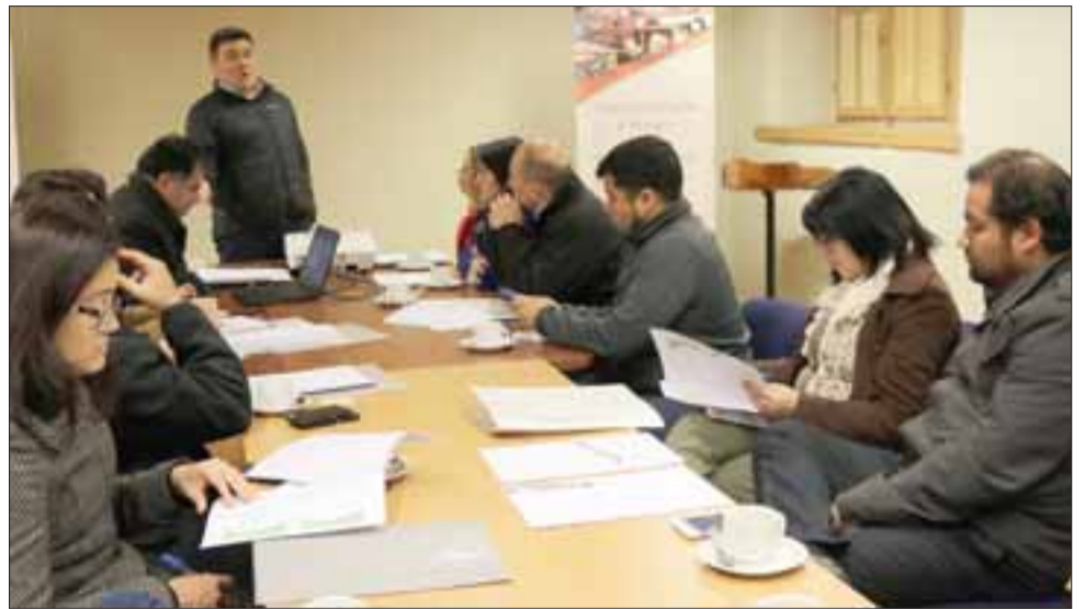
En dependencias del Centro Cultural Pedro Aguirre Cerda, se realizó la primera reunión de coordinación.

«Para nosotros es sumamente importante participar en esta iniciativa, ya que a propósito del contexto de descentralización hay buenas prácticas en los gobiernos locales que mu-