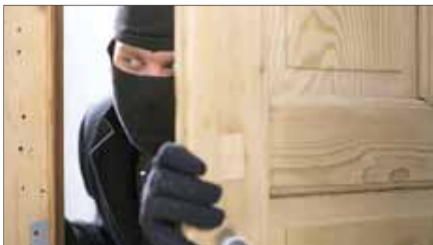
Seguidilla de robos a casas habitadas preocupa a vecinos.