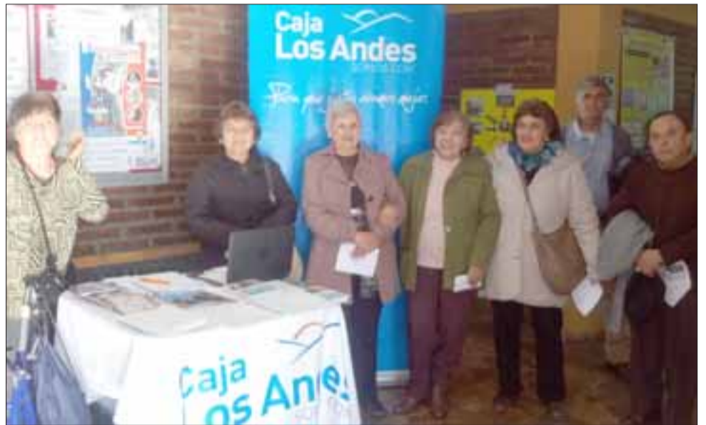
UNA SEMANA COMPLETA.- Los más de 7.000 afiliados a Caja Los Andes, de San Felipe, podrán durante una semana acceder a estos servicios de manera gratuita.

En 1953 se crea la Caja de Compensación de la Cámara Chilena de la Construcción; en 1972 durante el periodo de la Unidad Popular y Reforma Agraria, se inauguraron sus primeros centros turísticos, Lago Ranco-Futroneo y Palomar; para 1979 pasó a ser Caja de Compensación de Asignación Familiar de Los Andes; en 1989 se creó el Estatuto General de las Cajas de Compensación de Asignación Familiar en Chile, contenido en la Ley N°18.833, el cual rige las Cajas hasta la actualidad; ya en 1991 se crea la Asociación Gremial de Cajas de Compensación de Chile, con el fin de proteger, desarrollar y promover las actividades comunes de las Cajas; en 1997 se incorporaron los pensionados al sistema. Ello fue posible por la Ley N°19.539, que estableció que los pensionados de cualquier régimen previsional, salvo los de las Fuerzas