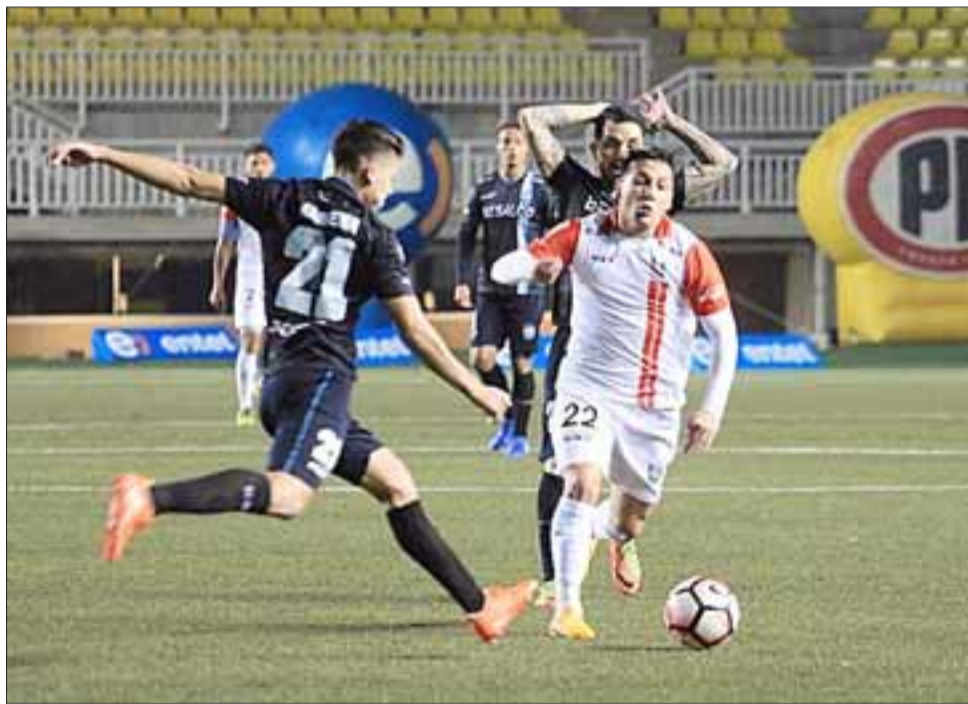
La noche del sábado Unión San Felipe prolongó su sequía de triunfos al igualar a 1 con el discreto equipo de Magallanes.

Desde ese momento el partido sufrió un vuelco porque el Uní se convirtió en un claro dominador, al posicionarse en terreno contrario; fue en esos instantes donde sobresalieron las figuras de Emmanuel Pio, Mathias Crocco y Daniel Silva, quienes permitían allegar balones con riesgo desde las bandas y el centro del campo de juego,