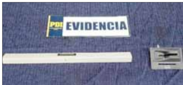
Funcionarios de la PDI de San Felipe incautaron este dispositivo conocido como 'Skimmer' instalado en el cajero bancario emplazado en el supermercado Jumbo de esta comuna.