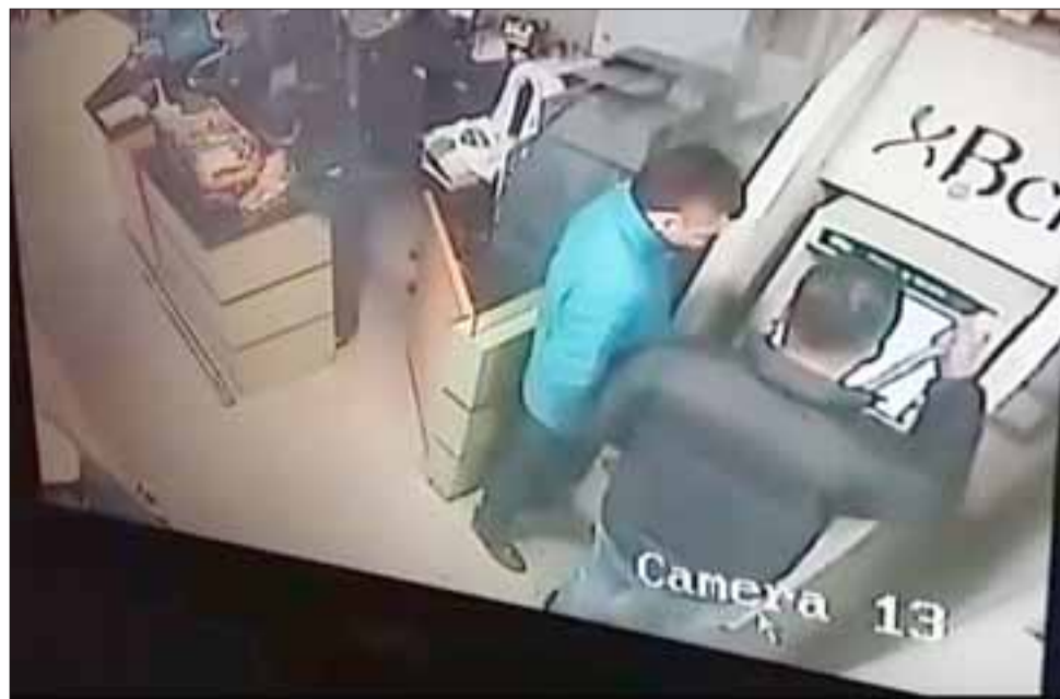
En la captura de la cámara de seguridad se registra el momento en que el sujeto de la derecha extrae el dispositivo fraudulento para ser instalado.

Fue así que la Policía de Investigaciones individualizó a los cuatro sujetos con las iniciales D.A.P.G. , B.J.D.B. , L.A.M.G. y J.A.M.R. todos de nacionalidad colombiana, registrando como domicilio el