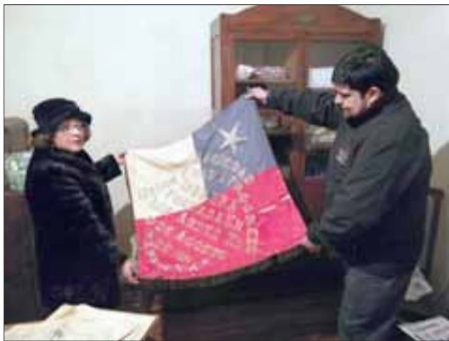
Viejos recuerdos afloraron para estas luchadoras mujeres durante la ceremonia. En su aniversario la directiva recordó sus históricos pasos en la ciudad.

como ésta. Pronto cumplirán cien años, lo que nos da un ejemplo de mutualismo, lo que significa la solidaridad y el compañerismo, y nutren a otras organizaciones como clubes de adulto mayor y juntas de vecinos».