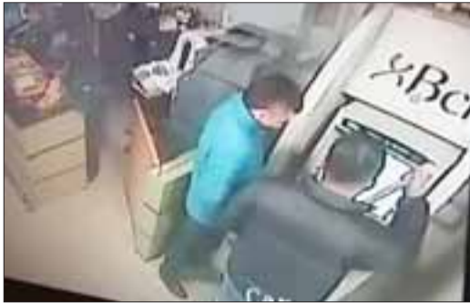
Cámaras lo descubren en plena instalación

Frustran estafa masiva en dispensador de dinero