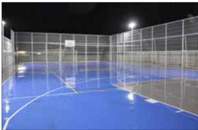
Esta multicancha tuvo una inversión que superó los 42 millones de pesos, a través del Fondo de Apoyo a la Educación Pública (Faep).

«Creemos que no se deben perder estos íconos de la época hacendal, parte fundamental de la Historia de Chile donde hubo un auge importante del comercio y la agricultura. Entonces postularemos a fondos regionales o nacionales para recuperar esa parte de nuestra historia», emplazó el alcalde.