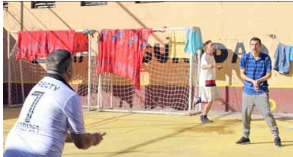
El taller se extenderá hasta noviembre, pero el éxito de la iniciativa y sobre todo el compromiso del profesor y de los internos han llevado a que ya se esté pensando en continuar el próximo año.