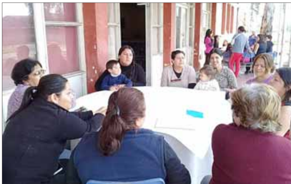
La comunidad de Las 4 Villas participó de la jornada de diálogo donde se detectó la necesidad de generar actividades de esparcimiento para la familia.

A partir de esta reflexión, en dependencias de la Ex Escuela Hogar se realizó la presentación de la obra teatral 'Los Optimistas', de la compañía 'Un Mar de Teatro', espectáculo correspondiente al género Clown, dirigida a toda la familia.