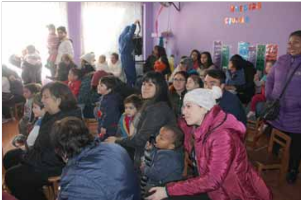
Junto a sus padres, los menores disfrutaron de una jornada donde bailaron y cantaron con sus personajes favoritos, así como de una once saludable.

ción a los establecimientos, ya sea administrados directamente por la Junta Nacional o bien, por los municipales a través de las Daem. Desde esa perspectiva, el único documento que deben presentar es la fotocopia del pasaporte.