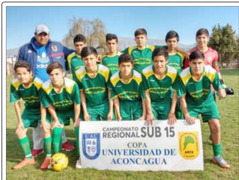
La selección U15 de Llay Llay Rural cayó en su visita a Los Andes.