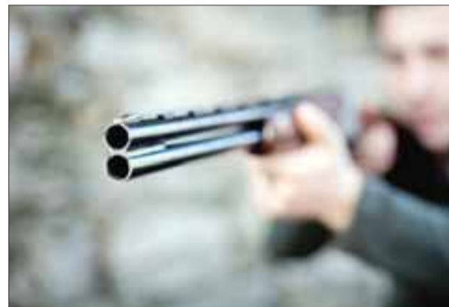
El adolescente fue reconocido por la víctima quien sufrió el robo de su vehículo en Santa María, tras haber sido intimidado con una escopeta. (Foto Referencial).

No obstante el adolescente de iniciales K.F.C.F.