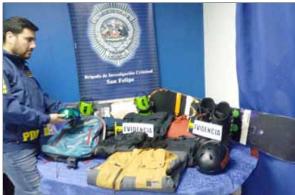
La Bicrim de la PDI de San Felipe logró recuperar las especies evaluadas en un millón de pesos. Un sujeto de 34 años de edad fue detenido por el delito de receptación.

No obstante el antisocial, identificado con las iniciales S.A.H.Z. de 34 años de edad, con antecedentes delictuales por delito de robo en lugar habitado, fue