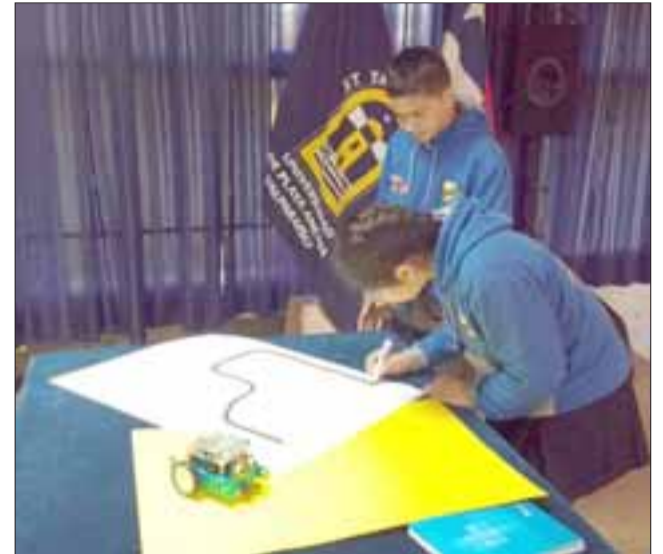
Alumnos y alumnas de la Escuela Almendral participan en una serie de diez sesiones donde adquieren nociones básicas de Robótica

que esta iniciativa ha sido muy bien acogida por los estudiantes, extendiéndose el trabajo a alumnos de otros establecimientos educacionales y permitiendo además imprimir el sello de formación en robótica en su escuela.