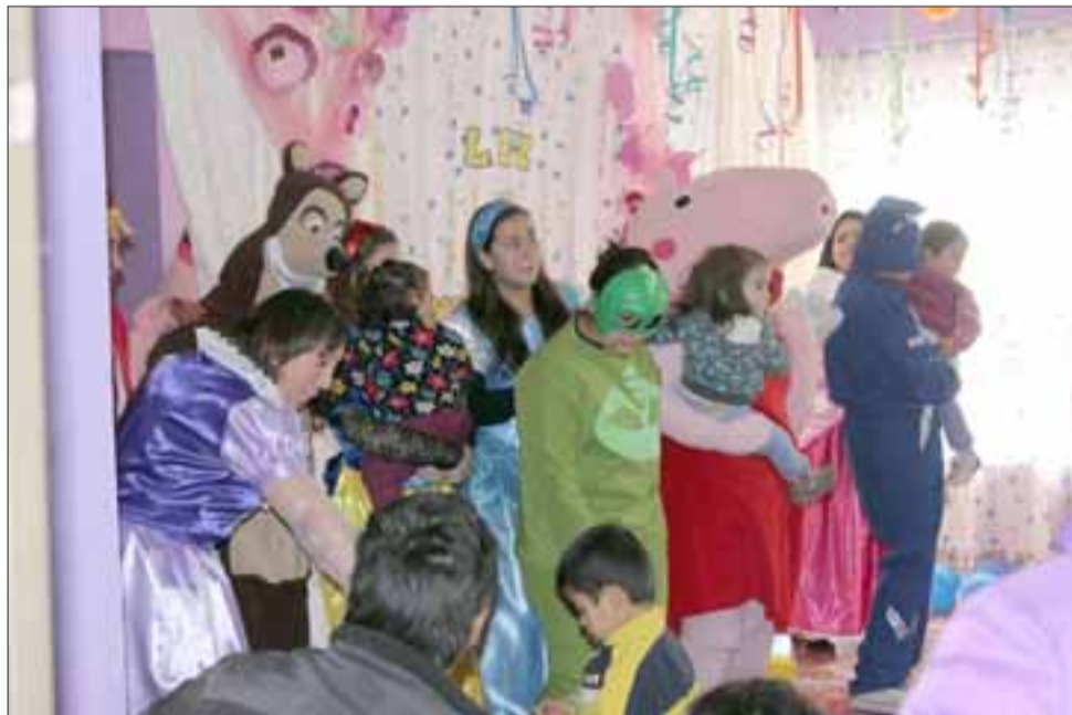
Los niños disfrutaron con los personajes de sus historietas favoritas, como Pepa Pig, Princesas y Blanca Nieves.