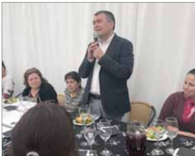
La iniciativa fue financiada como un proyecto de mitigación por la Gobernación de San Felipe y el Ministerio del Interior.

La Escuela de Cuidadores cuenta con un cupo máximo de 60 personas beneficiarias y fue financiado con aportes del Ministerio del Interior y de la Gobernación Provincial de San Felipe. Además contempla la entrega de ayuda económica para que las y los cuidadores comiencen un emprendimiento propio, y se encontrará abierta todos los sábados a contar del 19 de agosto, hasta el 30 de septiembre de este año en el Campus San Felipe de la Universidad de Valparaíso.