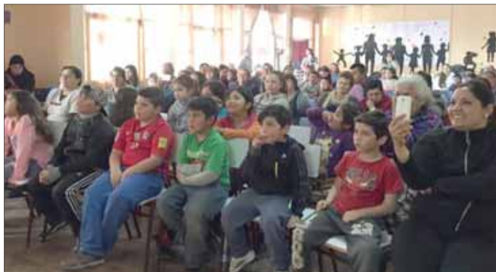
Una activa participación del público tuvo la presentación de la obra de teatro 'Los Optimistas'.