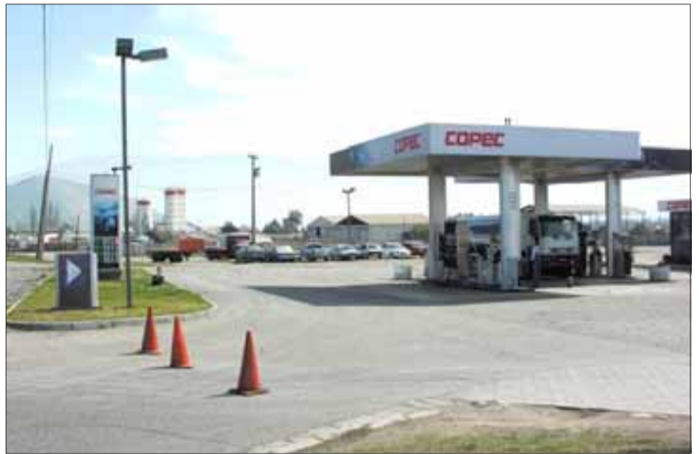
El Servicentro Copec de Llay Llay fue asaltado durante la madrugada de ayer.

Los sujetos actuaron a rostro descubierto.