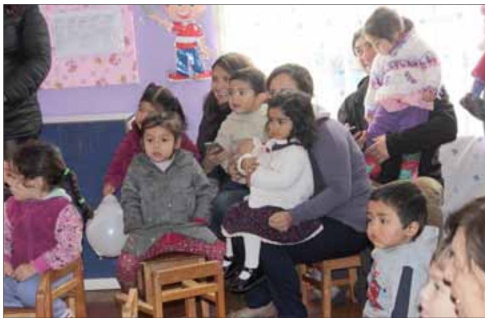
Los grandes disfrutaron tanto o más que los pequeños de la celebración del Día del Niño.

"Tengo tías muy cibernéticas y ellas se comunican por Whats App con los apoderados que no dominan el idioma español, pues hay una aplicación que permite al receptor de los mensajes que envían las educa-