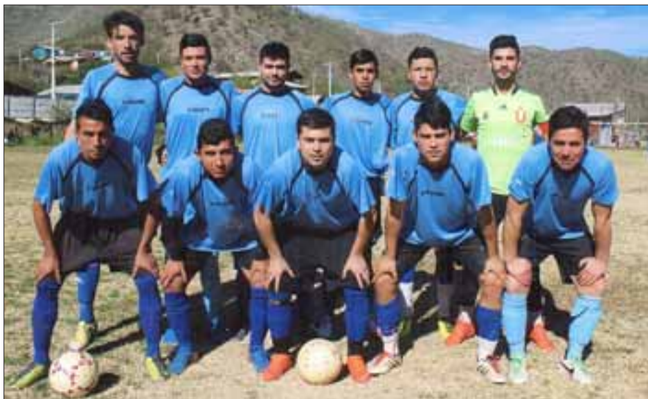
Tercera serie del club O'Higgins de Las Coimas.