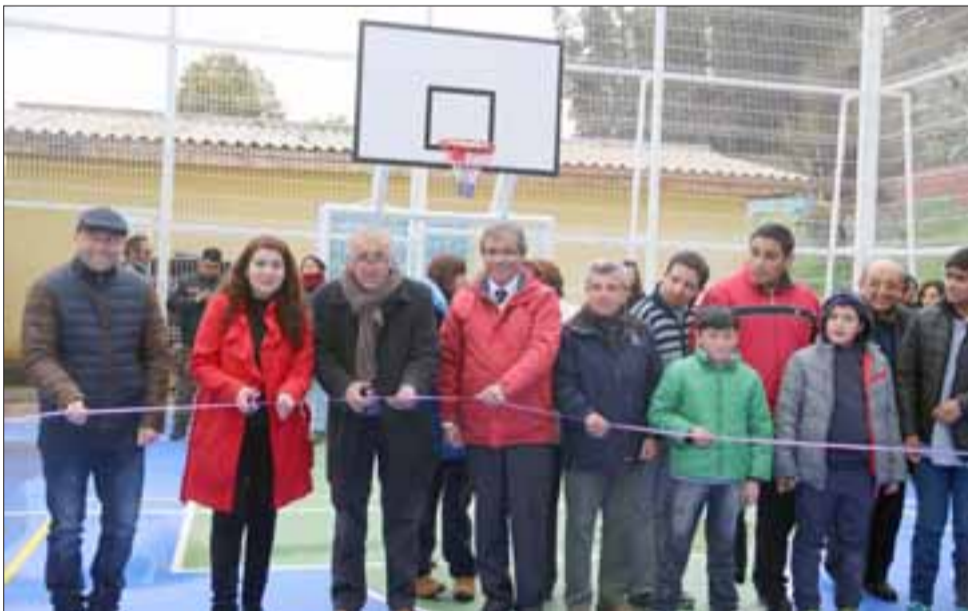
Autoridades y comunidad educativa en el tradicional corte de cinta que dio por inaugurada la multicancha.