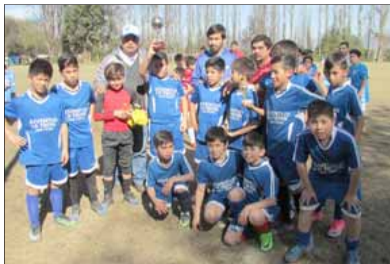
LOS CAMPEONES. - Ellos son los guerreros de la Escuela de Fútbol Fut-Gol Barrera de San Felipe. Se esforzaron y lograron la copa.