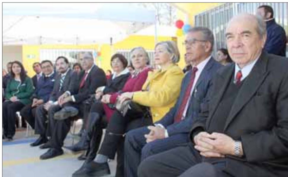
LAS AUTORIDADES.- Importantes autoridades del sector Educación se dieron cita para este acto de inauguración.