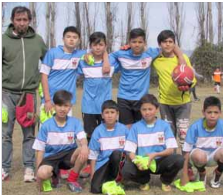
DUROS JUGADORES. - Vemos acá a la Escuela Santa Teresa, de Panquehue, un cuadro que puso en apuros a los demás clubes.