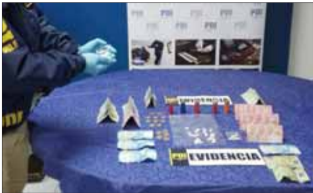
Grupo Microtráfico Cero de la PDI incautó pasta base, municiones y dinero en efectivo desde el domicilio de la imputada ubicada en la Villa Los Álamos de San Felipe.

Un total de 10 gramos de pasta base, cinco cartuchos calibre 12 y $143.500 en efectivo, fue el resultado de un allanamiento efectuado por los efectivos del Grupo Microtráfico Cero de la PDI, la tarde de este miércoles en una vivienda de la Villa Los Álamos de San Felipe, resultando una mujer detenida por este delito.