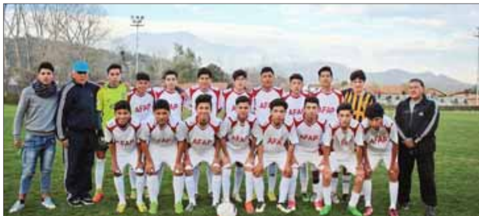
La selección U15 de Putaendo será local frente a su similar de Los Andes.

Panquehue – Santa María Catemu – Hijuelas Grupo 3 Rural Llay Llay – Llay Centro Putaendo – Los Andes