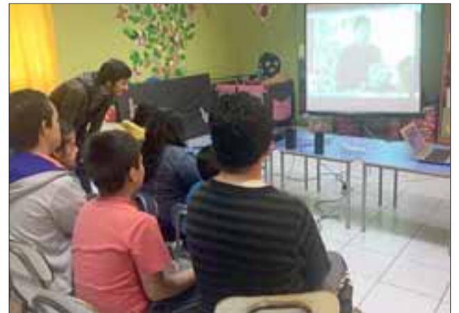
El proyecto ‘Aula en Red’ fomenta la interculturalidad, inclusión e innovación pedagógica, participando con una escuela de Barcelona donde se trabajan distintas temáticas que luego se comparan, interactuando tanto alumnos como profesores.

AVISO: Por extravío quedan nulos cheques desde N° 7875868 al 7875875, Cta. Cte. N° 2230009676-3 del Banco Estado Chile, Sucursal San Felipe. 18/3