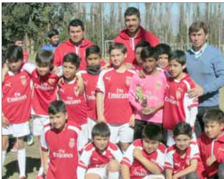
SIEMPRE SOÑANDO. - La Escuela 'Donde nace tu sueño', de San Felipe; impuso respeto y temor, aunque no logró la anhelada copa.