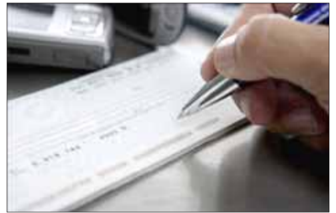
El actual condenado habría mantenido un talonario de cheques falsificados para cometer la estafa que afectó a una empresa sanfelipeña. (Foto Referencial).

Tras el juicio que compete al caso de las víctimas de la comuna de San Felipe, quienes nunca lograron recuperar sus especies, el Tribunal emitió su veredicto considerando culpable al imputado, quien actualmente se encuentra privado de libertad.