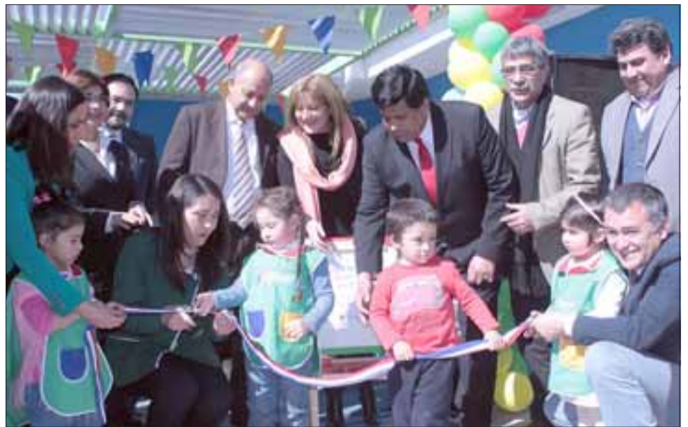
LA ALEGRÍA DE CRECER.- Peques y grandes celebraron con alegría el corte de cinta del nuevo Jardín Infantil y Salacuna Nicanor Parra, ubicado en el centro de Santa María.