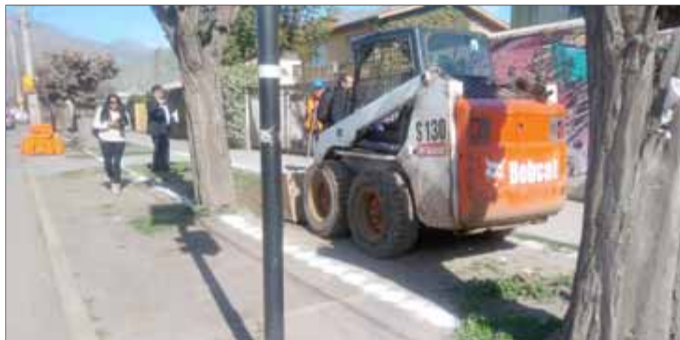
En la esquina de Avenida Maipú con Chacabuco, comenzaron a ejecutarse los primeros trabajos de la segunda fase de Construcción de Ciclovías.

de Tránsito de la Municipalidad de San Felipe, puesto que "en esa calle transita locomoción colectiva mayor y menor, por ende, corresponde esperar otro tipo de permisos, a diferencia de Tocornal y Maipú, donde no se interviene calzada", argumentó.