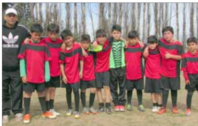
SANESTEBINOS. - Independiente Lo Calvo, de San Esteban, también se dio a respetar en este torneo.