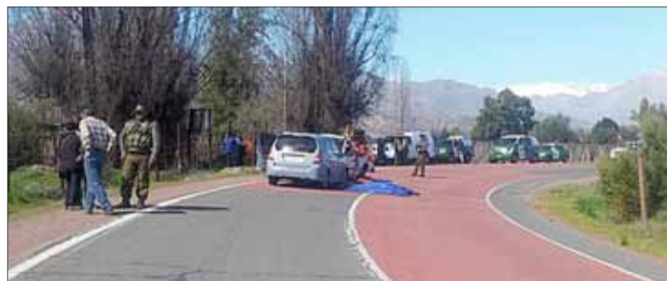
El fatal accidente se registró en plena curva, cuando el automóvil Suzuki se salió de su pista de circulación, por causas que no están determinadas, impactando a la camioneta.