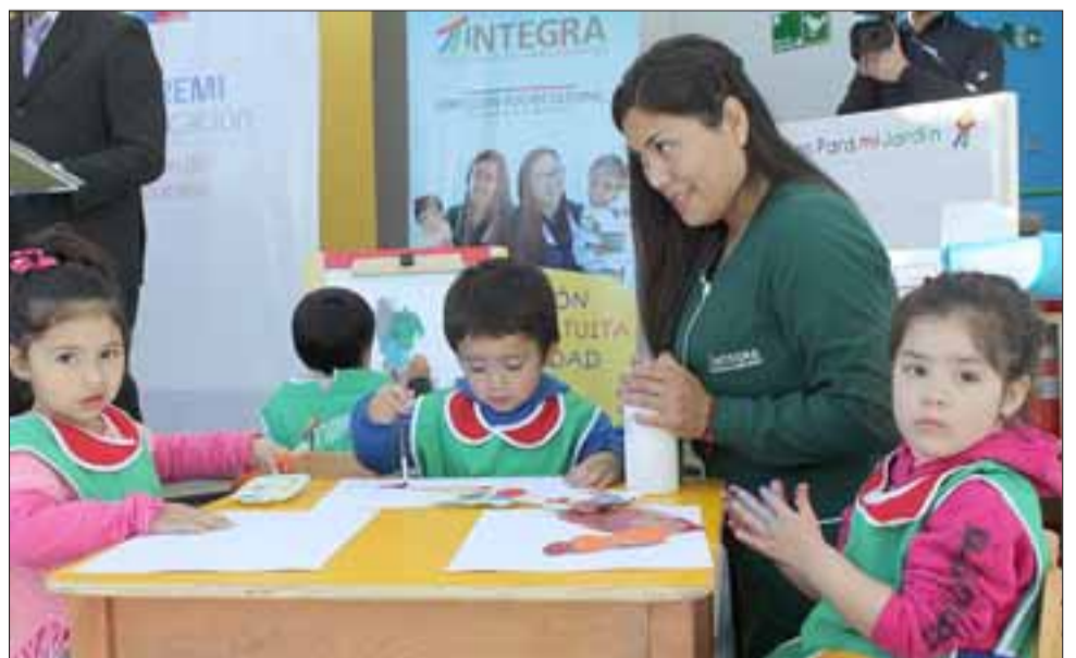
EL JUEGO DE LA VIDA.- Son 172 pequeñitos los que ya están recibiendo atención y educación totalmente gratuita en este jardín infantil.