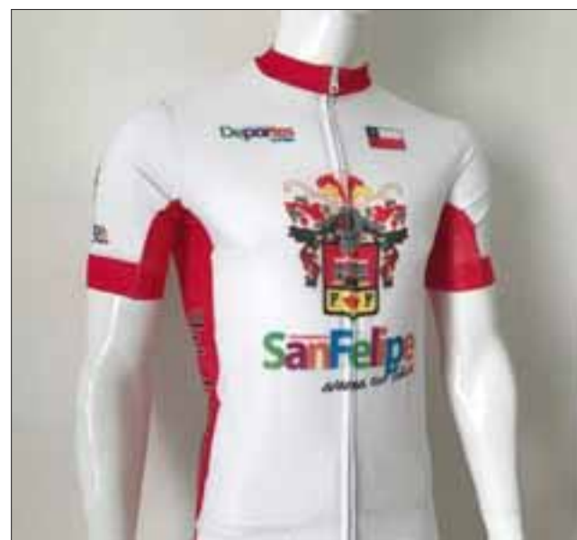
Esta es la nueva indumentaria que exhibirá el Club de Ciclismo San Felipe durante la competencia.

Respecto al circuito que se utilizará, Catalán detalló que "se sale de San Martín, subimos por Curimón hasta el callejón del aeródromo San Rafael; desde ahí atravesamos hasta Los Villares, a la altura de Condoroma; ahí bajamos nuevamente hasta San Martín y regresamos al punto de partida; ese giro es de 19,3 kilómetros, se dan 5 vueltas para completar los 100 kms.", apuntó el deportista, explicando que en el caso de las categorías restantes, se disminuye un giro para completar la distancia exigida en cada caso.