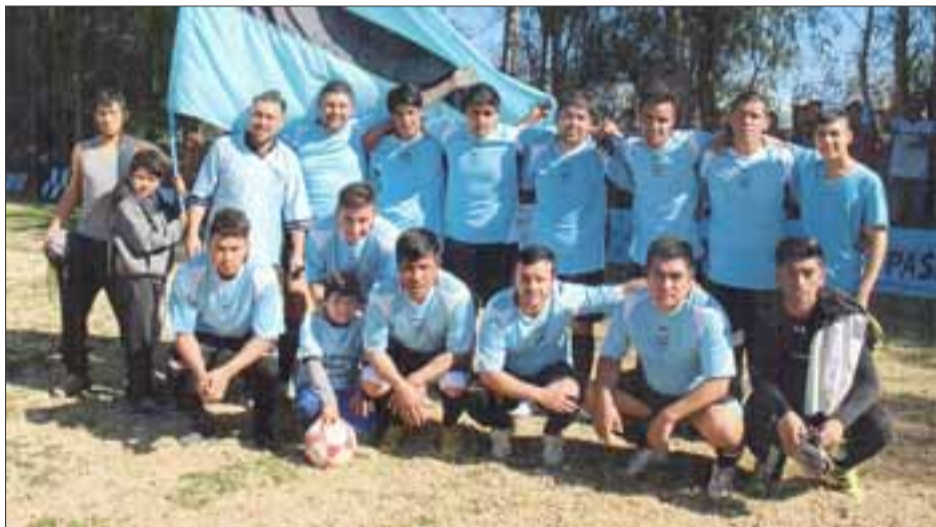
Segunda serie del club O'Higgins de Las Coimas.

El club O'Higgins compete en el torneo de la Asociación de Fútbol Amateur de Putaendo, y en esta ocasión ocupa un lugar preferente en las páginas deportivas de Diario El Trabajo, gracias a que nuestro colaborador Roberto Valdivia capturó estas dos impecables imágenes que ahora compartimos con nuestros fieles lectores.