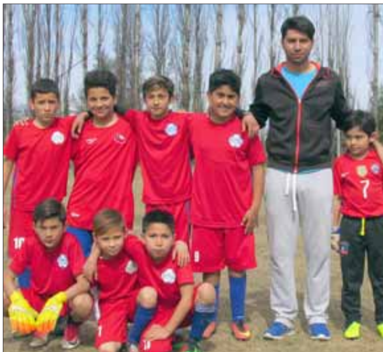
BIEN MANTECOSOS. - La Academia de Fútbol 'Manteca' González, de San Felipe, fue la más resbaladiza, pues sus jugadores demostraron gran destreza para llegar al arco contrario.

El pasado fin de semana se desarrolló en la cancha de La Troya, la primera Copa Roberto Alegría Martínez , organizada por el Club Deportivo Juventud La Troya. En este torneo amateur de fútbol se vieron las caras seis escuelas de fútbol, tanto del Valle de Aconcagua como una de Santiago. Se trata de una iniciativa deportiva en la que las mejores escuelas de fútbol muestran a sus mejores cuadros deportivos para conquistar los trofeos y títulos en juego, logrando de esta forma una gran convocatoria en La Troya.