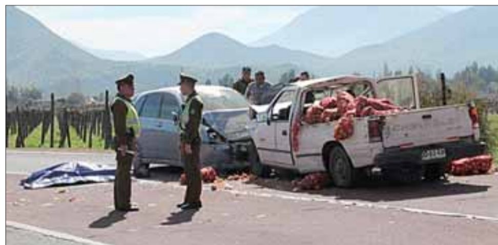
La imagen revela la violencia del impacto que costó la vida a uno de los conductores, sufriendo ambos vehículos importantes daños.