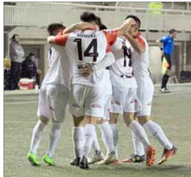
Unión San Felipe espera celebrar su primer triunfo este domingo cuando enfrente a Iberia.