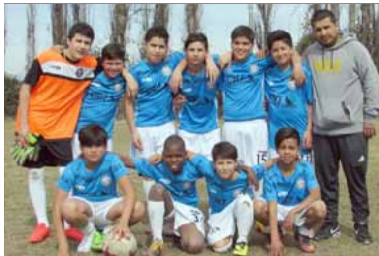
LOS CAPITALINOS. - El Club Deportivo Buenaventura, de Santiago, llegó a sembrar el terror entre los clubes del valle, finalmente sus integrantes regresaron satisfechos con el trabajo desempeñado.