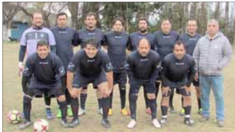
OTROS CAMPEONES. - Durante esa jornada también los Séniors del Club Juventud La Troya disputaron otro torneo, y lo ganaron.