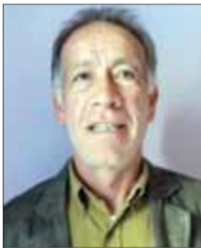
Licenciado en Educación Física y (CD) de la Universidad de Girona

Mediante la creatividad y el talento es posible la variedad, cuanto más creativos sean los técnicos, los niños tendrán más posibilidades de auto realizarse, ya que una forma de detectar talentos es hacer pensar a los deportistas de forma diferente. Ser creativos es importante en la enseñanza y