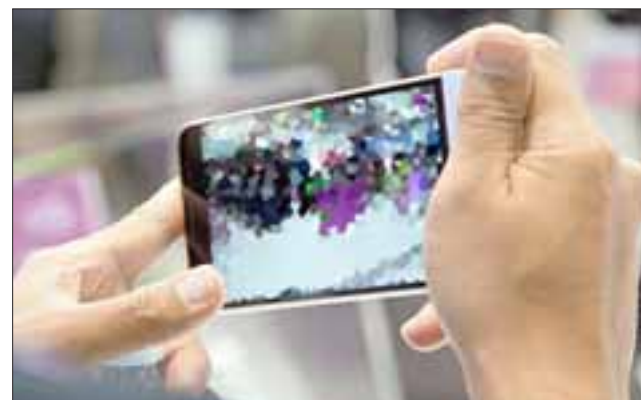
El sujeto registró mediante un video de su teléfono celular el abuso sexual contra una menor de 4 años en Catemu. (Foto Referencial).

“Se le atribuyeron dos delitos de abuso sexual a menor de 14 años y producción de material pornográfico infantil. El imputado además confesó con muchos detalles de cómo había