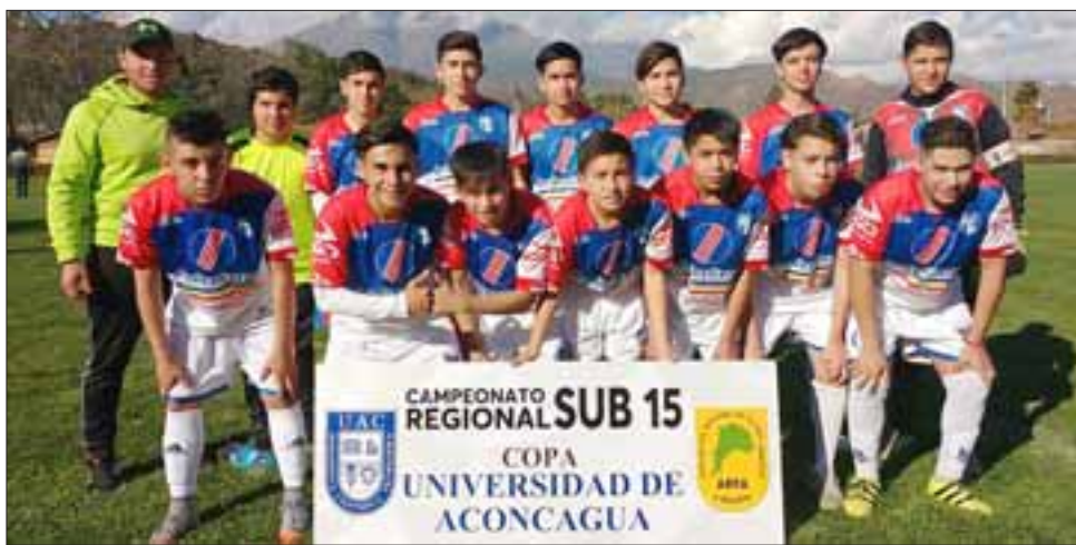
La selección de Los Andes se muestra cada vez más sólida en el Regional Copa Universidad de Aconcagua U15.