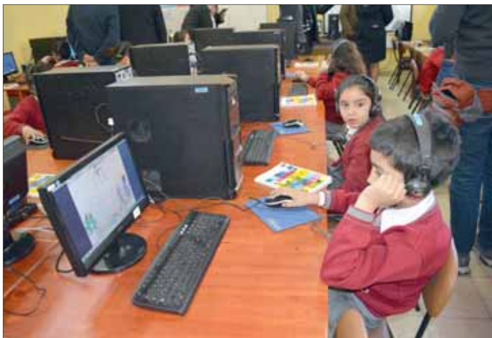
Dos salas temáticas de Inglés, un aula común y un laboratorio de computación equipado con tablets, computadores, impresoras, pizarra interactiva, equipos de sonido, material didáctico, mobiliario y un software de inglés de Imagine Learning, contempla el plan GO4 que se implementó en Santa María.

Desde el 2016 el Programa GO4 Valparaíso, enfocado a la enseñanza efectiva del idioma inglés, cuenta con 40 establecimientos municipales pertenecientes a 35 comunas de la región y beneficia a 78 docentes de inglés, a 160 docentes colaboradores y a 15.800 estudiantes. El Programa cuenta con una inversión inicial de $780 millones aportados por el Fondo de Apoyo a la Educación Pública Valparaíso del Ministerio de Educación y de $190 millones del Programa Inglés Abre Puertas del Ministerio de Educación.