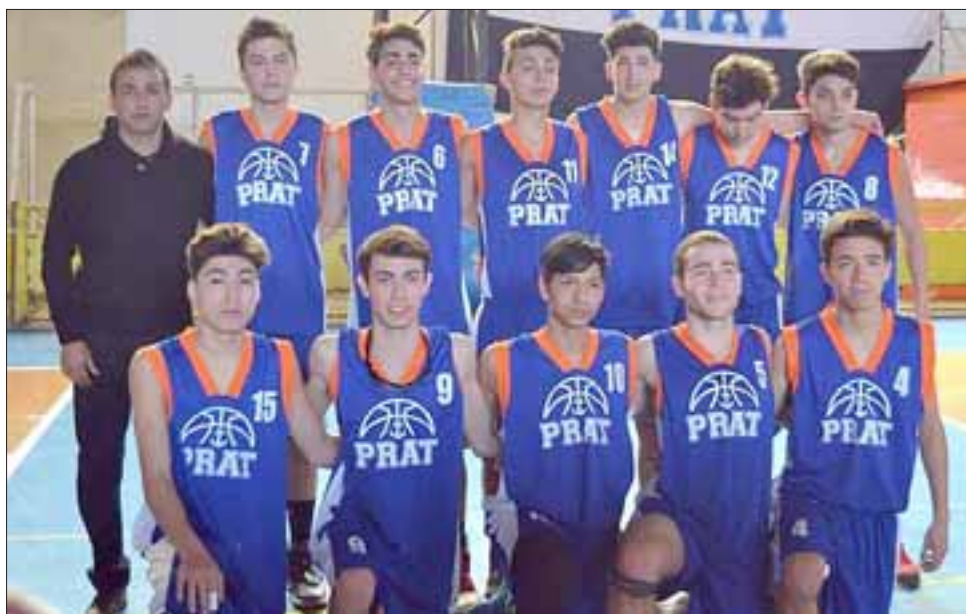
El Prat terminó en el segundo lugar del Top 4 de la Libcentro Menores.

Con esto el básquetbol sanfelipeño demostró que está viviendo un presente