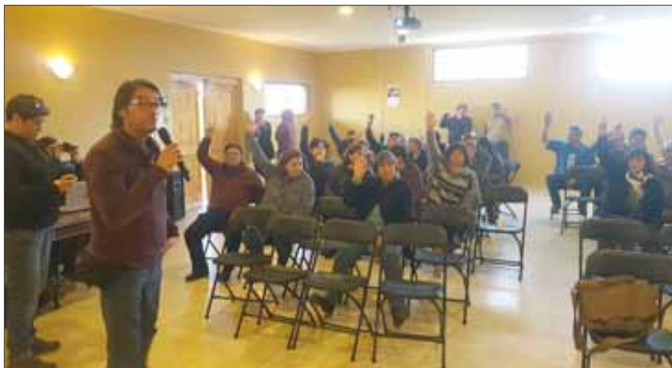
Los asistentes a la Asamblea apoyaron las acciones a seguir por la directiva del APR El Asiento para frenar las tronaduras.

a esta reunión, porque creo que en general fue una reunión exitosa, la gente se fue muy contenta, creo que los expositores estuvieron a la altura, tratamos aspectos legales, ambientales, sociales, respecto a lo que estaba ocurriendo en El Asiento y también lo que tenemos que presentar; la gente salió empoderada, creo que eso es positivo”, dijo el dirigente.