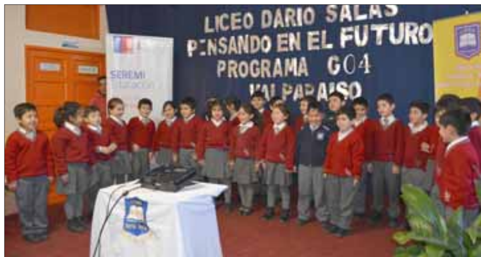
Los más pequeños serán los principales beneficiados con el programa que a futuro podría llevarlos a dominar el idioma Inglés.