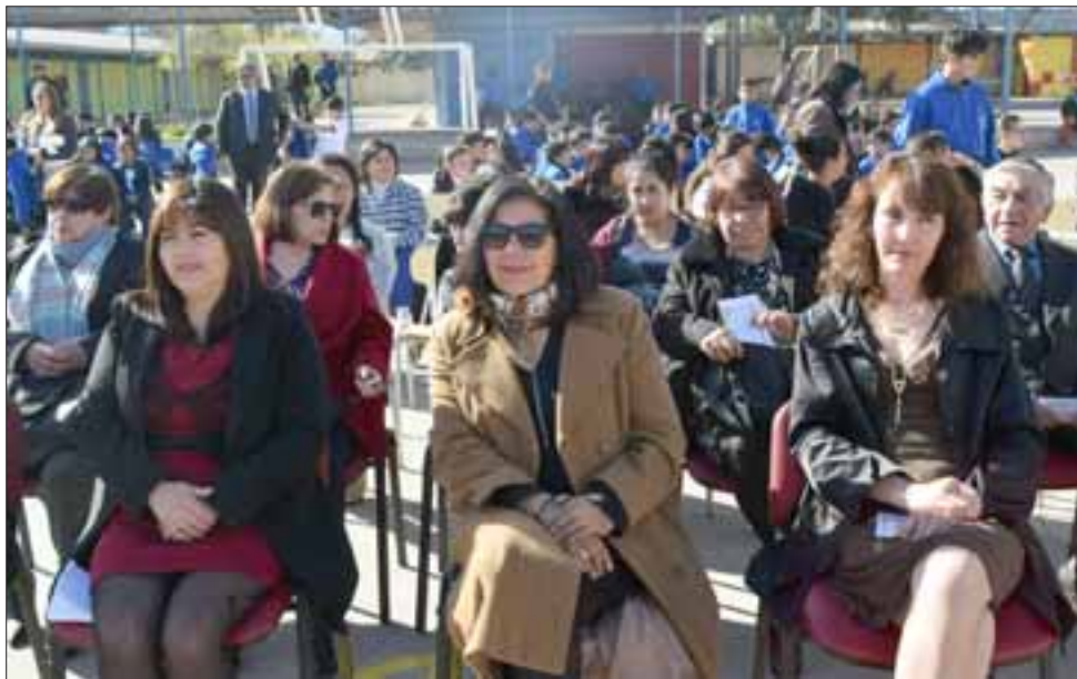
INVITADOS ESPECIALES. - Los apoderados y autoridades de educación también se dieron cita a esta fiesta del aniversario 127 de la Escuela Bernardo O'Higgins.