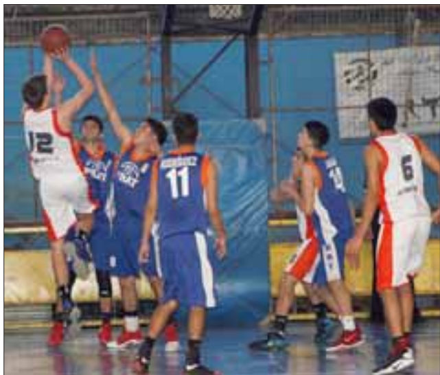
Pratinos y universitarios fueron protagonistas de una final intensa y muy disputada.

1º.- Universidad de Chile 2º.- Arturo Prat 3º.- Boston College 4º.- Español de Talca