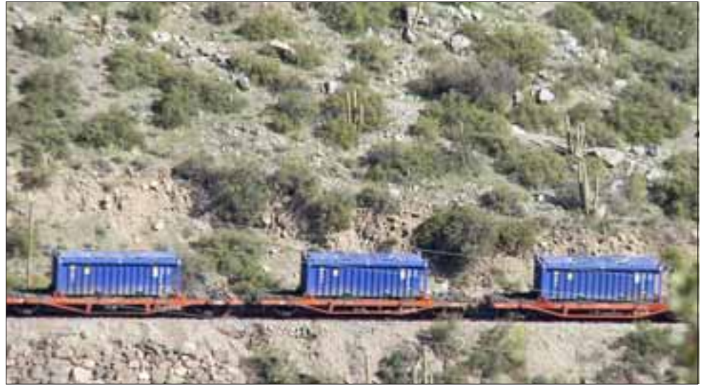
División Andina comenzó el recambio de sus antiguas ollas de transporte de concentrado por contenedores herméticos, que entregan una mayor seguridad a la operación.