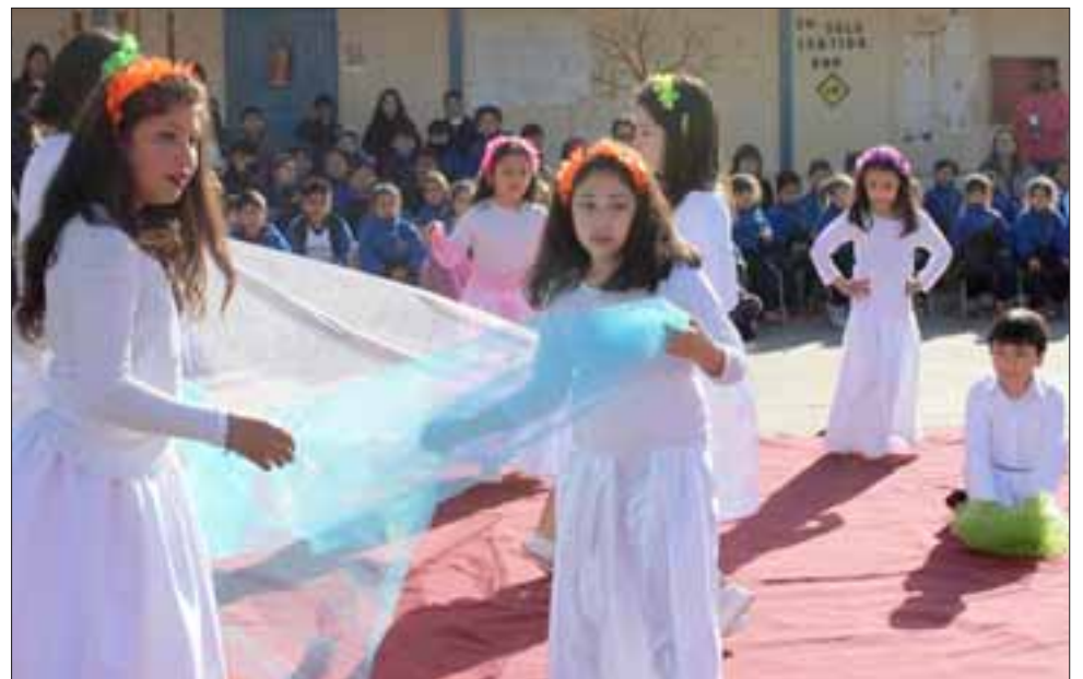
PEQUEÑAS ARTISTAS. - Aquí tenemos a estas niñas, interpretando bailes que han aprendidos en los cursos de arte de su escuela.