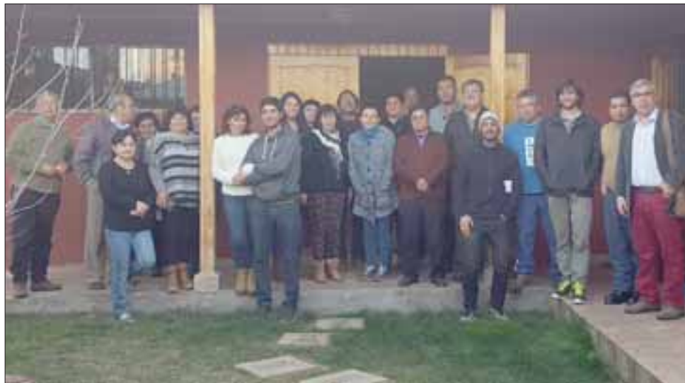
Los vecinos junto a expositores y representantes de Fundación Mi Patrimonio.

“La reunión fue bastante positiva porque se informó a las personas sobre el patrimonio que poseemos, cuál es el patrimonio que está en peligro de sufrir algún impacto ambiental producto de la actividad minera y de las últimas determinaciones y básicamente que eso incide en la calidad del agua que nosotros debemos brindarle a las personas. Lo bueno que contamos con el apoyo de la comunidad para actuar sensatamente, respecto a temas de demandas, o respecto a reclamos que vamos a hacer en forma más pensada y consensuada con el mandato que nos dieron las personas asistentes