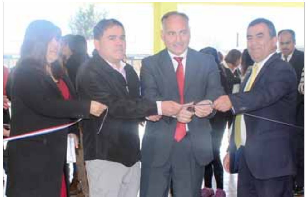
MEJORAS EN LA ESCUELA. - El director de la Escuela Bernardo O'Higgins procedió al corte de cinta para inaugurar las obras de mejoramiento del hall de entrada al establecimiento.

Candia explicó que esta labor no es sencilla, com-