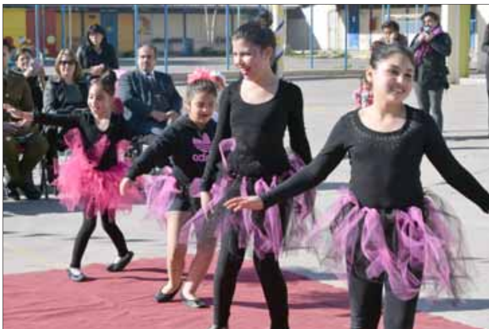
DESTREZA INFANTIL. - Estas coquetas amiguitas también se lucieron con sus danzas y graciosas piruetas artísticas.