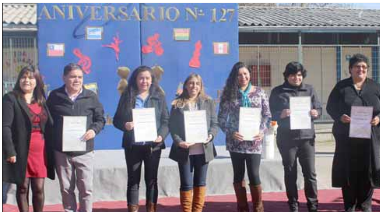
CENTRO GENERAL DE PADRES.- Ellos conforman el Centro de Padres de esta escuela sanfelipeña, casa estudiantil que alberga a 255 niños matriculados y que es atendida por 47 personas en total.