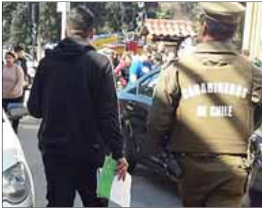
Carabineros lograron evitar una tragedia