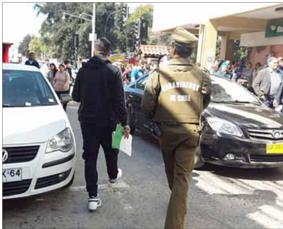
Al centro de la fotografía, el joven víctima de esta violenta agresión junto a los carabineros, quienes adoptaron la denuncia.