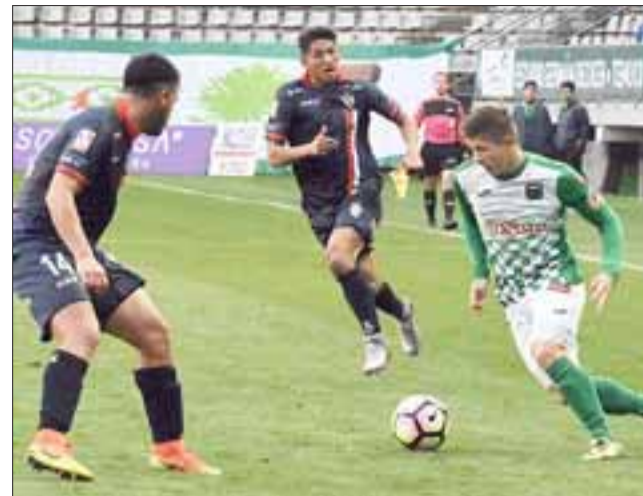
Después del buen periplo por las regiones octava y novena, este domingo el Uní enfrentará a Unión La Calera por el Torneo de Transición.

En el pleito de mitad de semana, el Uní se mostró como un equipo pragmático y en varios pasajes del cotejo entregó el protago-