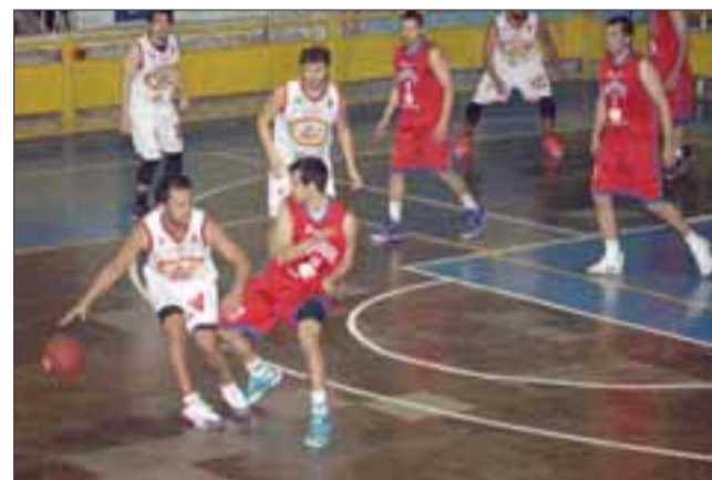
El Prat está obligado a ganar el sábado a Puento Alto para forzar un cuarto partido en la final de la Libcentro A.