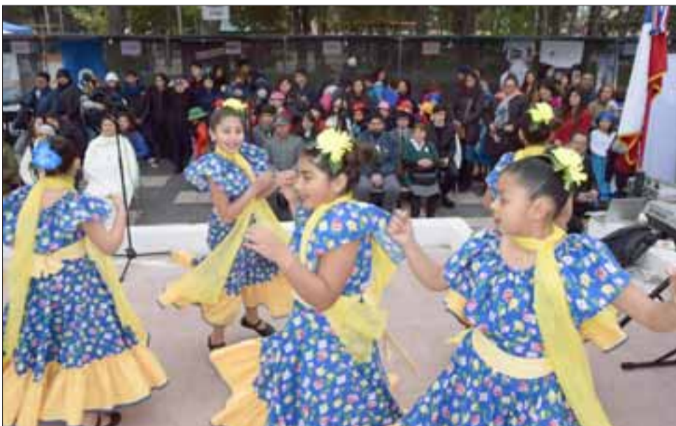
FANTASÍA Y CANDOR.- Sus vestidos lo dicen todo, niñas alegres, bien entrenadas y con un espíritu propio del candor de su edad.