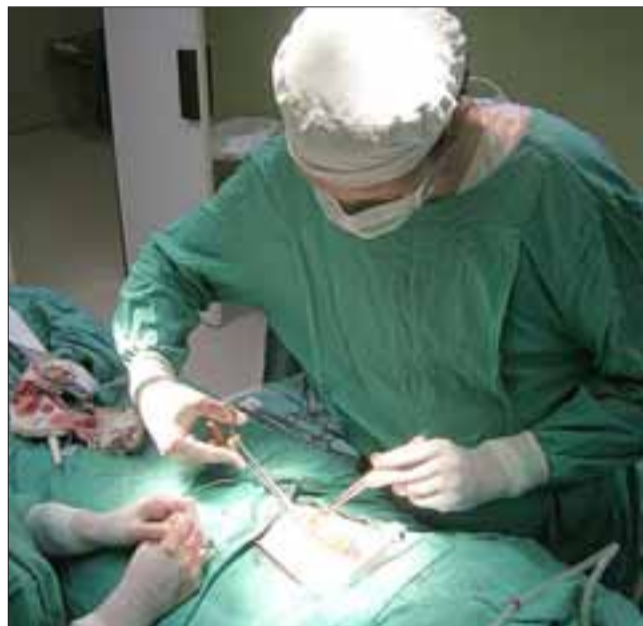
La intervención se realizó en los pabellones del establecimiento, hasta donde llegó el equipo a cargo de trasplantes.

te, ya que siempre se trata de una decisión difícil y dolorosa que debe ser tomada en el momento más triste, pero que conlleva enormes retribuciones al entregar vida y salud a otras personas, destacando además, la importancia de manifestar en vida la decisión de ser donante, ya que finalmente