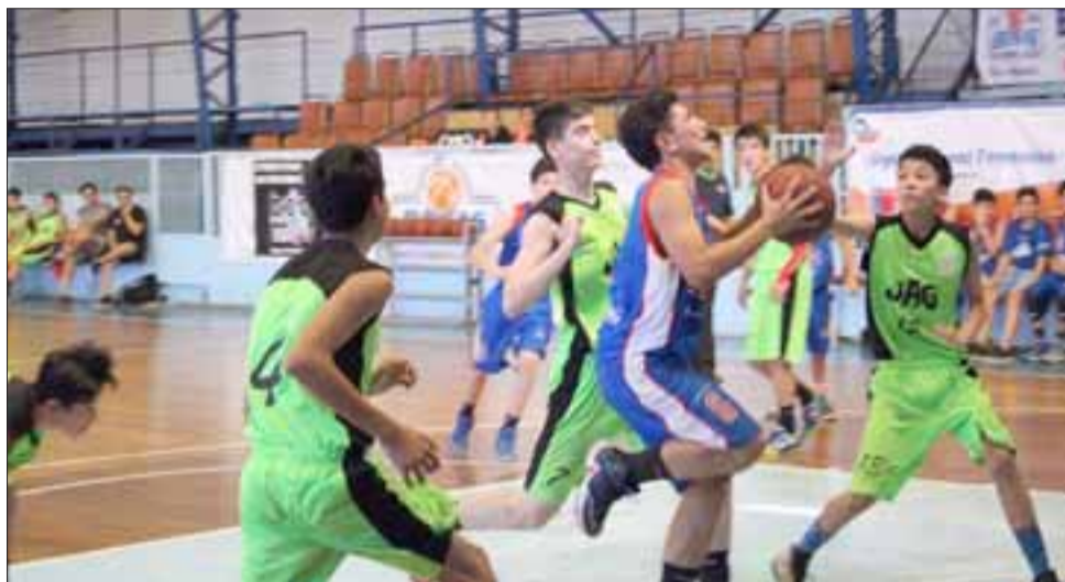
Parte de los mejores equipos de básquet masculinos en las series U14 y U19 de Chile, animaran la quinta edición del Torneo Aniversario San Felipe.

San Felipe Básquet, Villa Alemana Basket, Escolar Tome, San Juan de Las Condes, Arabe de Valparaí-