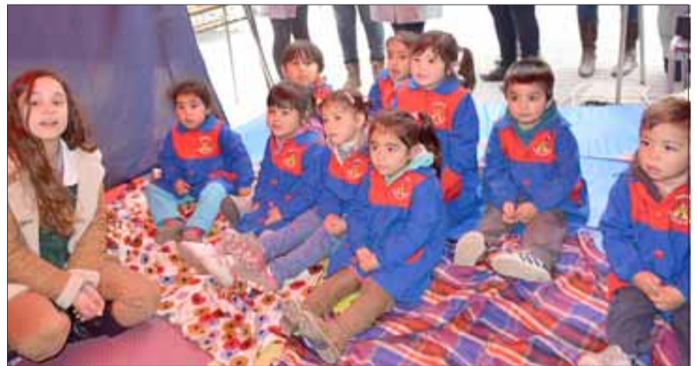
EN SU MUNDO MÁGICO.- Ellos lo pasaron muy bien mientras esta educadora les contaba un divertido cuento.