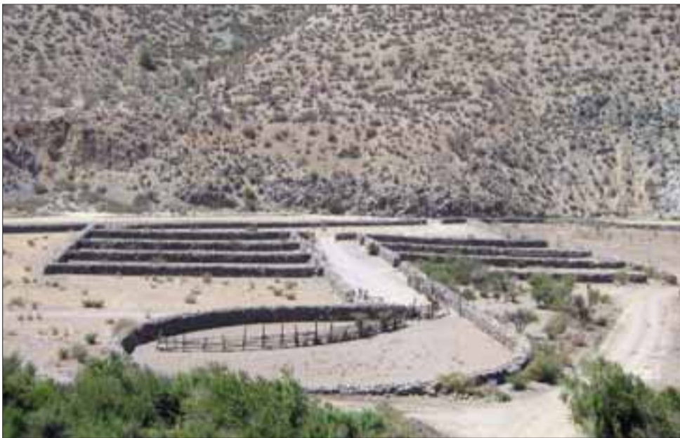
Por fin estos corrales putaendinos pasan a ser un monumento nacional, el que será aprovechado por todos los chilenos.

El alcalde y el Concejo Municipal invitaron a toda la comunidad aconcaguina a la primera actividad a realizar en el recién declarado Monumento Nacional. Para el próximo 1º de octubre, el municipio organizará una gran fiesta costumbrista para festejar este histórico hecho. El evento ya tiene un primer invitado de lujo: Los Jaivas serán quienes pondrán la mística y calidad musical a la jornada.