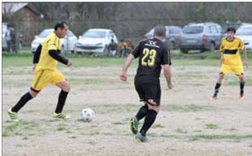
El fútbol amateur sanfelipeño solo tiene agendado para este fin de semana partidos por la Lidesafa y la Liga Vecinal.

Debido al Super Clásico del fútbol chileno entre Colo Colo y la Universidad de Chile, la Asociación de Fútbol Amateur de San Felipe decidió suspender la fecha correspondiente a esta semana y sólo se jugará el partido pendiente entre Juventud La Troya y Juventud Antoniana, en una jornada que partirá a las 14:00 horas del domingo en la cancha de La Troya.