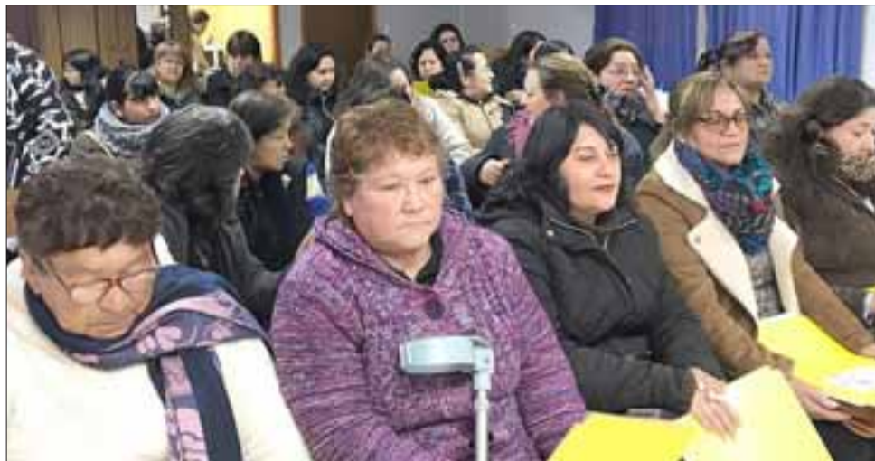
Más de 50 mujeres de Catemu participaron en una reunión en la que se destacaron los avances que ha logrado el programa Mujeres Jefas de Hogar, impulsado por el Sernameg.

En ese sentido, los 250 municipios a lo largo del país suscritos en el Programa Mujeres Jefas de Hogar han sido claves para articular