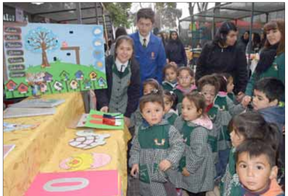
CHARLAS VALIOSAS.- Ya estos pequeñitos saben todo sobre el uso de un calendario, meses, años y días de la semana.