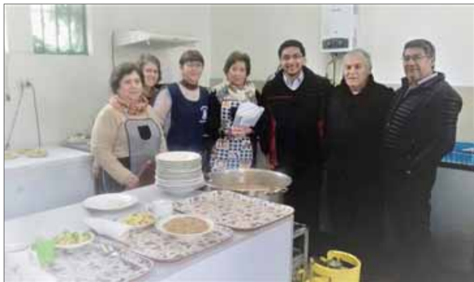
Voluntarios particulares y de la misma Iglesia Andacollo preparan y sirven diariamente los alimentos, como promedio a unas 100 personas.