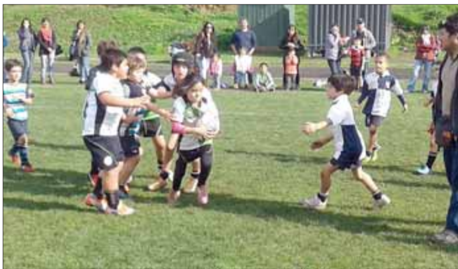
Un festival de Rugby donde los más pequeños serán los protagonistas se realizará este domingo en Calle Larga.

Universidad de Chile, San Felipe Básquet, Estudiantes de Las Condes, Árabe de Valparaíso.