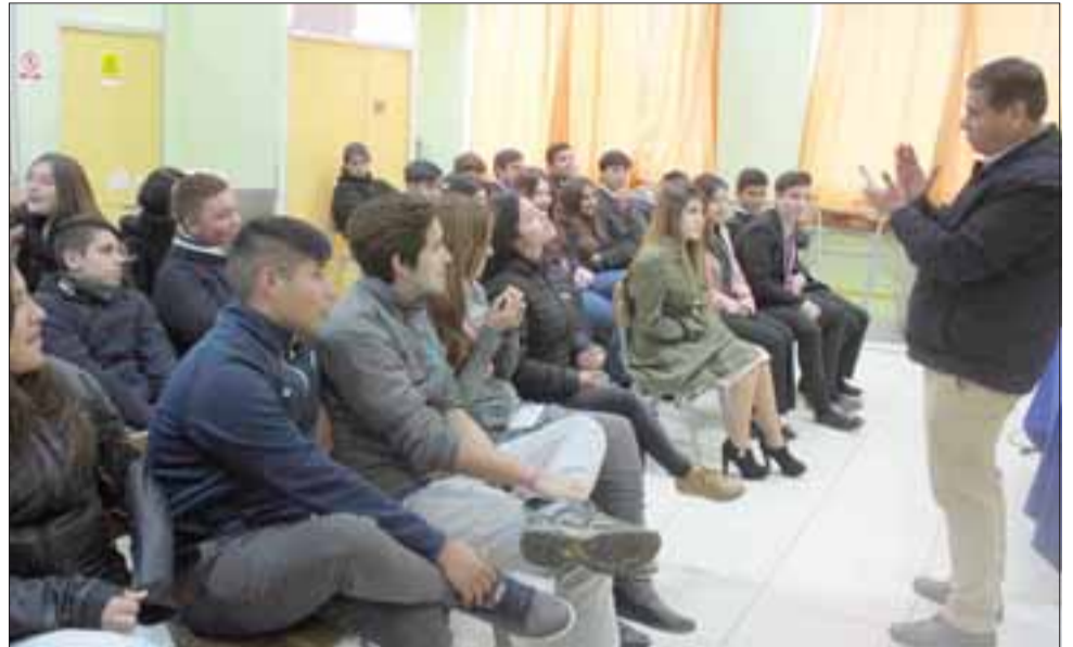
En el marco del Programa Andina Más Cerca, profesionales de Codelco Andina realizaron charlas vocacionales para estudiantes del Liceo Técnico Pedro Aguirre Cerda de Calle Larga.