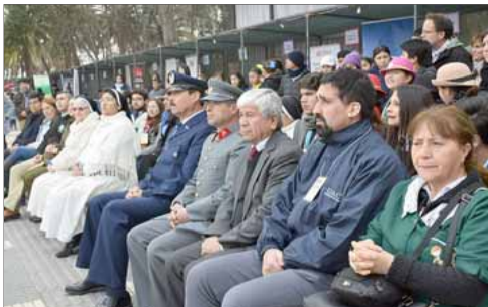
TODOS PRESENTES. - Otros directores de jardines infantiles y de escuelas de Santa María se dieron cita en la Plaza de Armas.