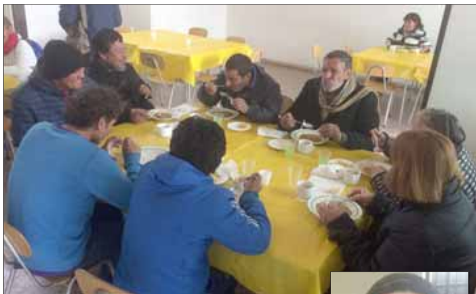
El Comedor Solidario de la Parroquia Andacollo ha llegado a recibir 140 personas en un sólo día.

los propios Laicos de nuestra comunidad, quienes han visto cómo distintas personas sufren producto de la falta de trabajo en los meses de invierno, el desempleo, los fríos, mucha gente en situación de calle, de drogas, de pobreza, quienes se acercan buscando un plato de comida, alimentos para pasar estos fríos meses», expuso el seminarista.