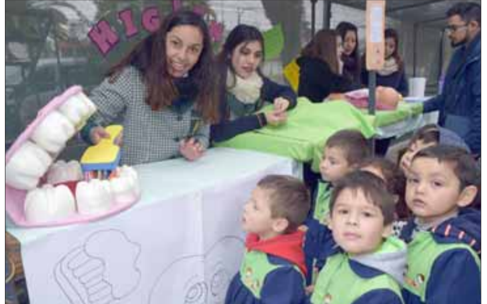
DIENTES LIMPIOS.- Estos pequeñitos aprendieron de manera divertida mucho sobre la higiene bucal, gracias a este stand instalado en esta Feria Tecnológica del Colegio Santa María de Aconcagua.