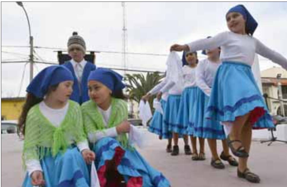
HERMOSOS TRAJES.- También estos bailarines pudieron lucir los trajes de las zonas de Chile, porque el Folklore también es color y elegancia.