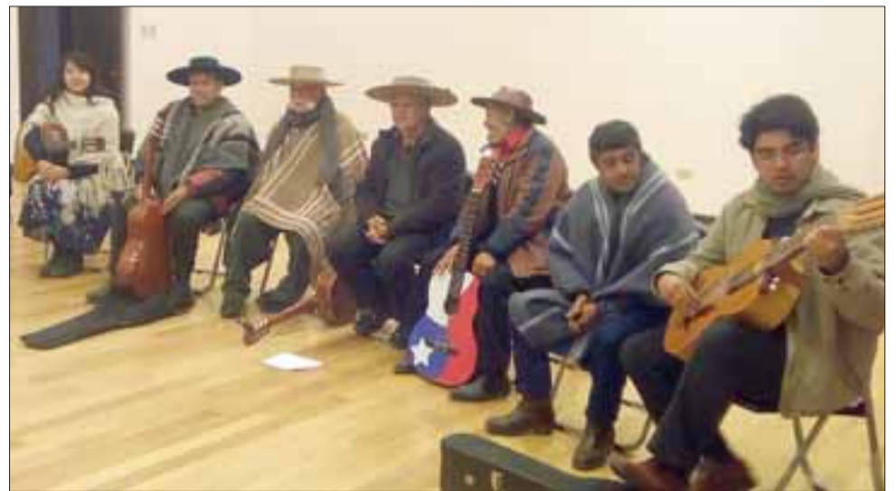
FUERZA Y CULTURA.- Aquí tenemos a los payadores locales y nacionales, dando vida y fuerza a este II Encuentro Nacional de Payadores 2017.