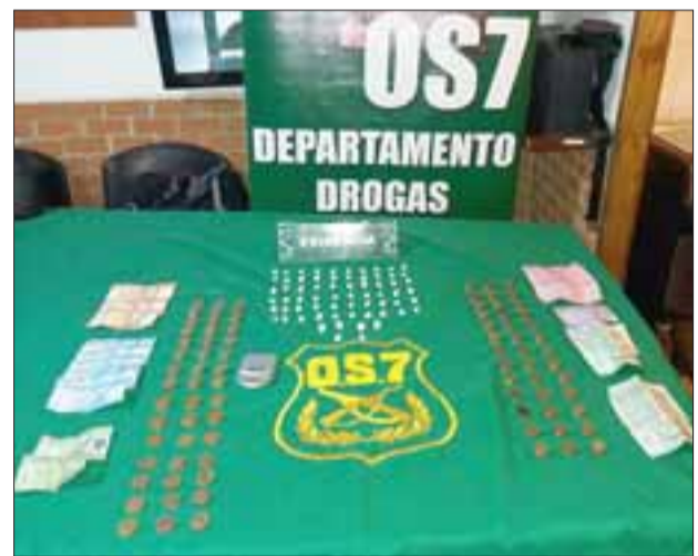
Personal de OS7 de Carabineros Aconcagua incautó pasta base y clorhidrato de cocaína desde el domicilio de la imputada apodada 'La Tía Tencha', en Putaendo.

Asimismo durante la jornada de este miércoles, Carabineros detuvo a un sujeto por el delito de Cultivo ilegal de 58 plantas de cannabis sativa dentro de su domicilio en la comuna de Santa María.