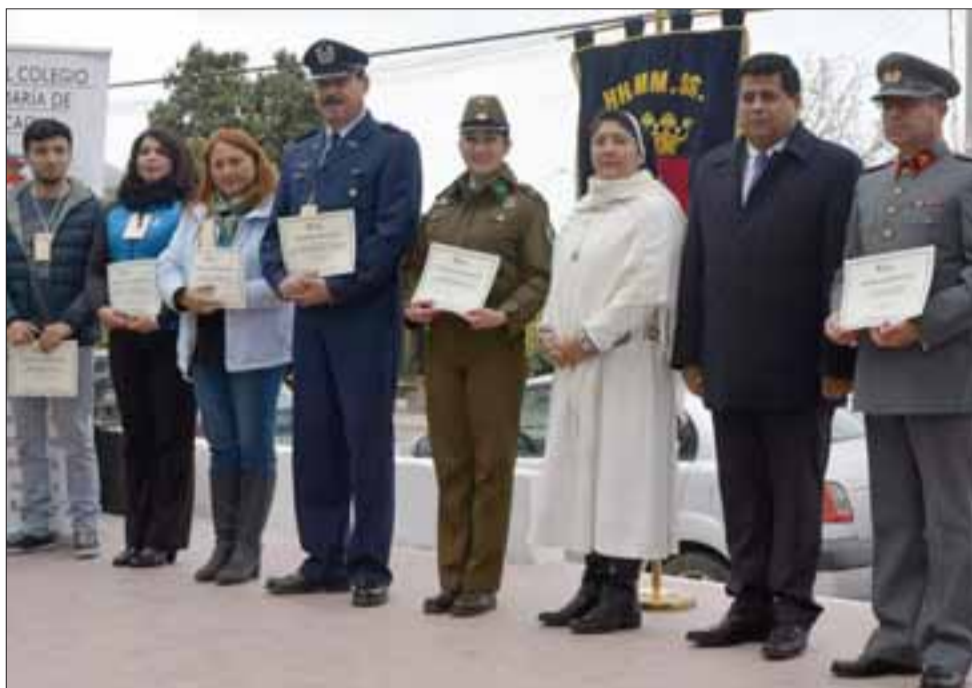
RECONOCIMIENTO ESPECIAL. - Autoridades y colaboradores cercanos al Colegio fueron destacados por el personal del Colegio Santa María de Aconcagua.

llaran su trabajo en cuidado de párvulos, bailes típicos de nuestro país, la Oficina de la Mujer, Senda Previene, Cpech y el Aiep, entre otras importantes instituciones», dijo la religiosa y académica.