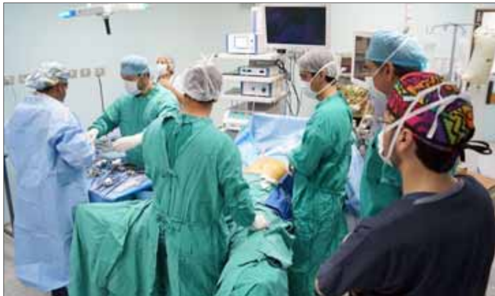
La familia de una paciente fallecida por accidente vascular decidió donar sus órganos, gracias a lo cual fueron trasplantados sus riñones a dos pacientes de la lista de espera nacional.

Por lo anterior, junto con agradecer el compromiso de los funcionarios que apoyaron este procedimiento, la directora también agradeció el noble gesto de los familiares de la donan-