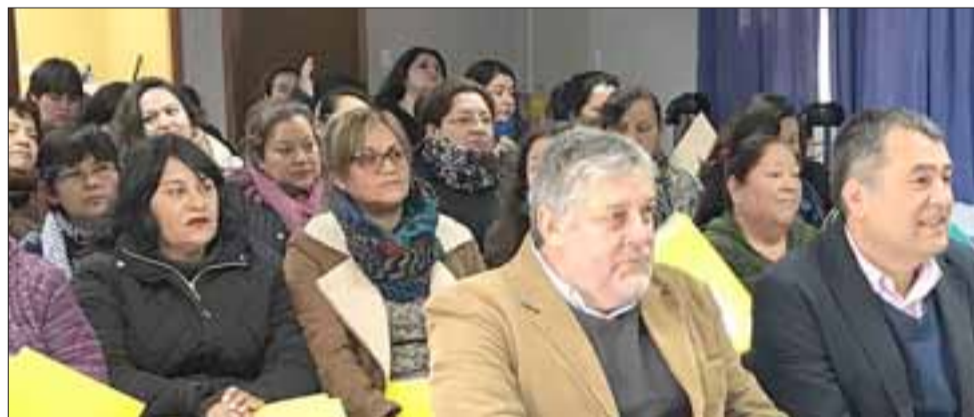
El Programa Mujeres Jefas de Hogar en Catemu lleva funcionando nueve años y ha logrado brindar una serie de iniciativas para las participantes, orientadas a lograr que las mujeres se incorporen en mejores condiciones al mercado laboral.

las chilenas, mediante la inserción laboral a través de talleres, capacitaciones y proyectos de micro empresas. El Programa se implementa en el territorio local, siendo los municipios los ejecutores.