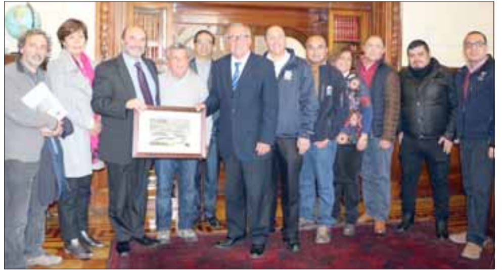
El alcalde Guillermo Reyes y el Concejo Municipal estuvieron presentes en la aprobación unánime del Consejo de Monumentos Nacionales.

«Ha sido una alegría informarle al alcalde y a la comuna de Putaendo, que Los Corrales del Chalaco han sido reconocidos por el Consejo para que se dicte el decreto de que sean Monumento Histórico. Es el primer sistema de corrales de