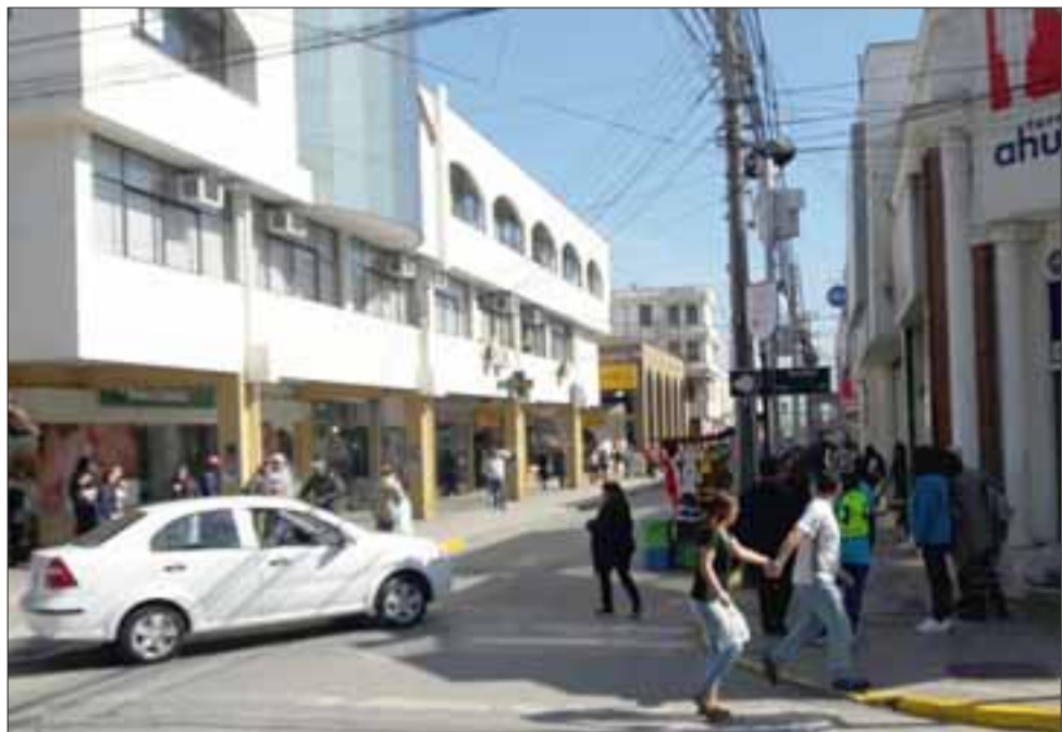
Conmoción causó en la ciudadanía el violento hecho ocurrido en pleno centro de la comuna de San Felipe.