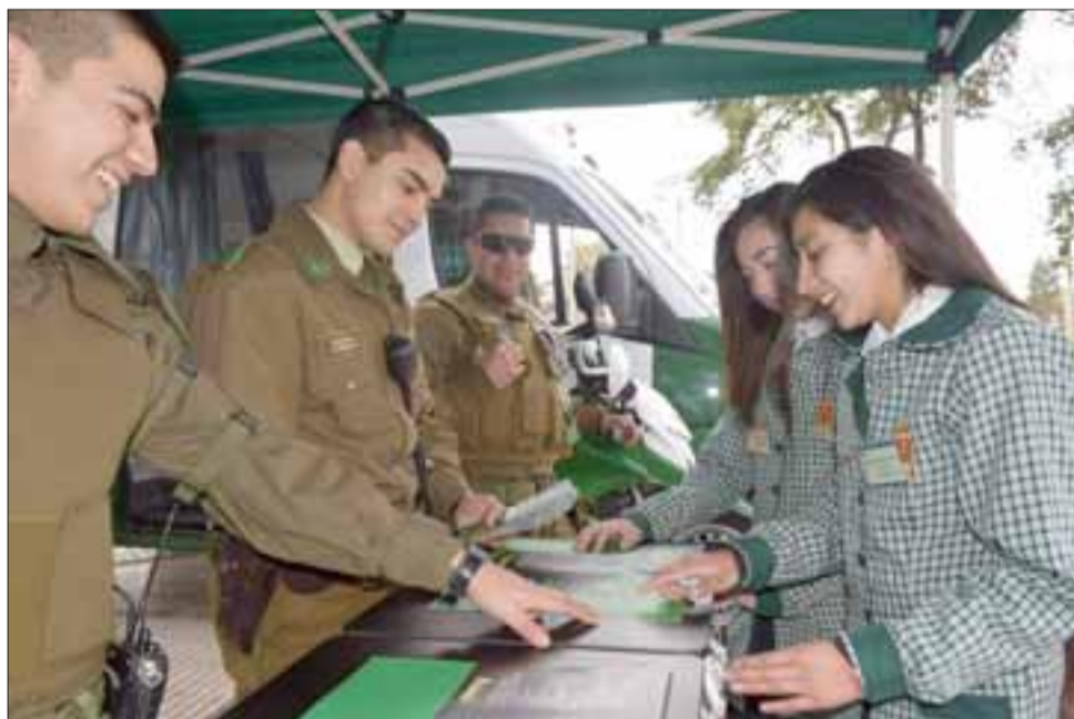
LA ALEGRÍA DE SERVIR. - Carabineros también mostraron a los estudiantes interesados la dinámica de postulación y trabajo dentro de tan insigne institución.