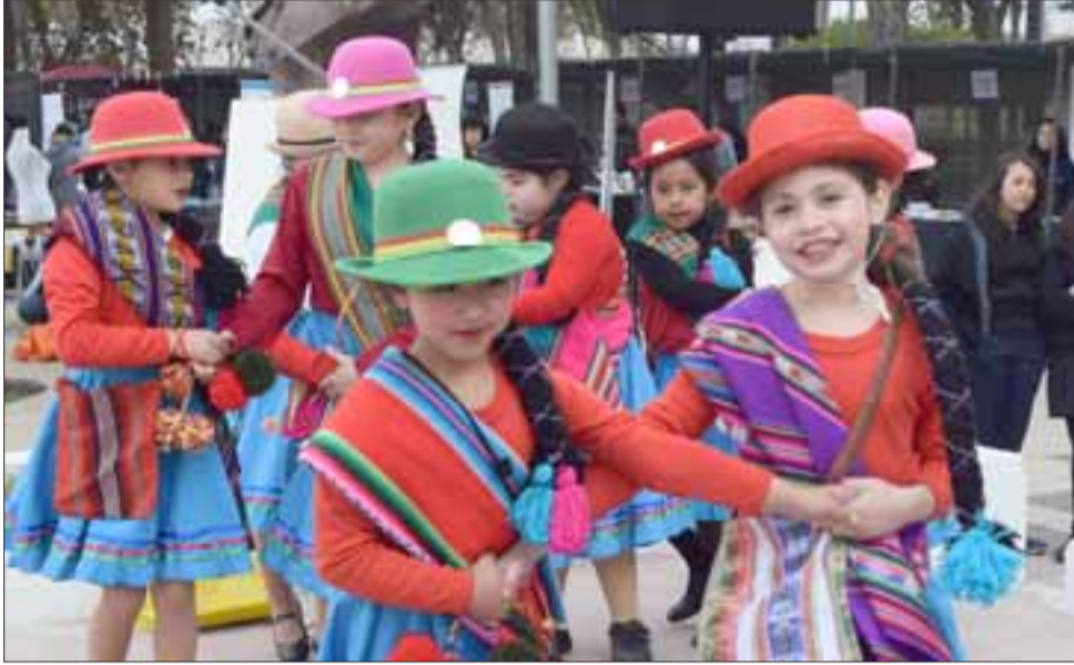
PURO FOLKLORE.- Estos son bailes típicos de nuestro país, interpretados por los mismos estudiantes de escuelas y jardines infantiles de la comuna.

Nuestro medio también habló con la Hermana