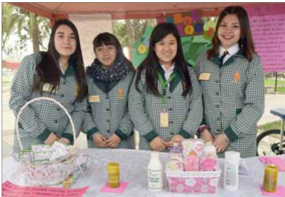
APRENDIENDO DE TODO. - También estas niñas ofrecieron un amplio aprendizaje para el hogar a todos quienes preguntaban sobre este tema.