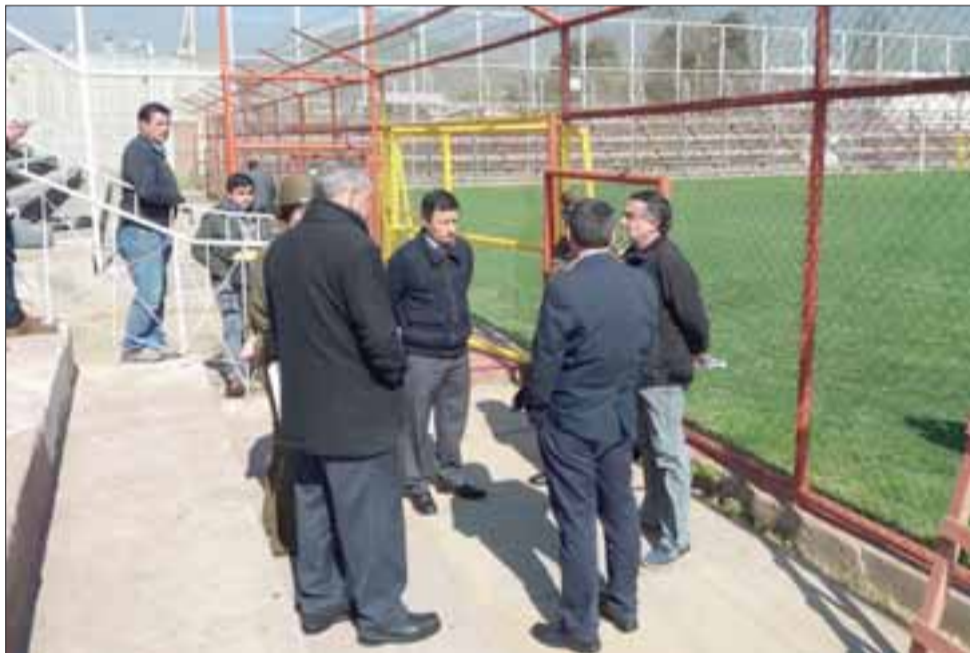
Luego de una visita de inspección al estadio municipal se realizó ayer pasado el mediodía.