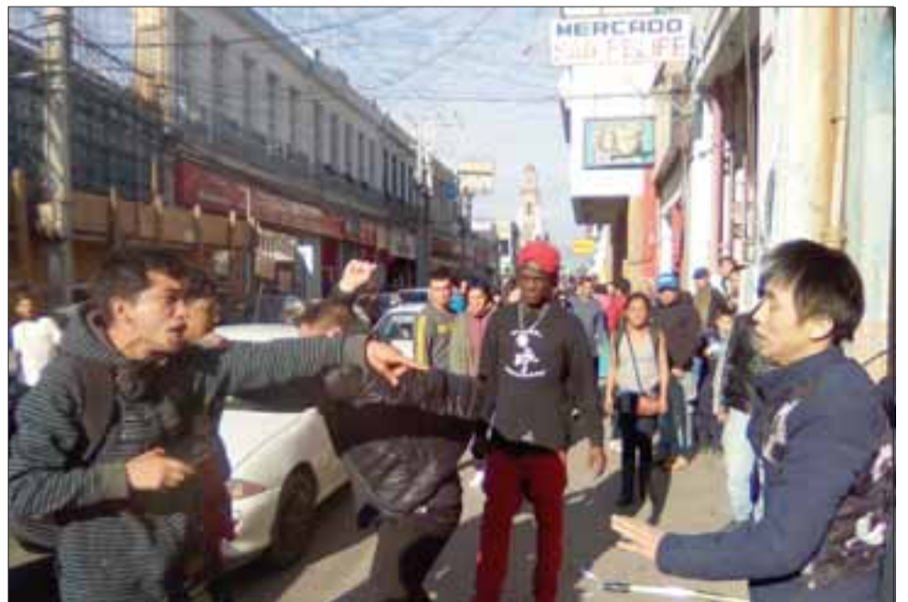
LAS CALLES CALIENTES.- Los reclamos, insultos y golpes entre los chinos y las personas señaladas como ladrones fueron intensos. De momento no hay detenidos.