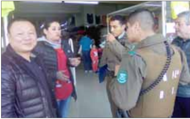
UNA DENUNCIA MÁS.- El empresario chino interpuso la demanda correspondiente con Carabineros.