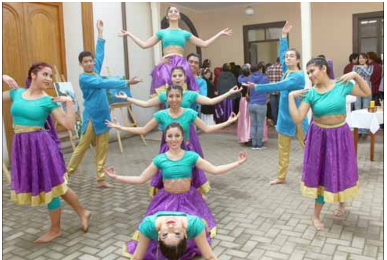
TALENTO LOCAL.- Belleza, talento y juventud es lo que ofrecieron estos artistas sanfelipeños durante la colorida actividad.

También en su discurso el alcalde Patricio Freire destacó que «... generar un espacio que alberga las distintas actividades artísticas que desarrolla la Muni-