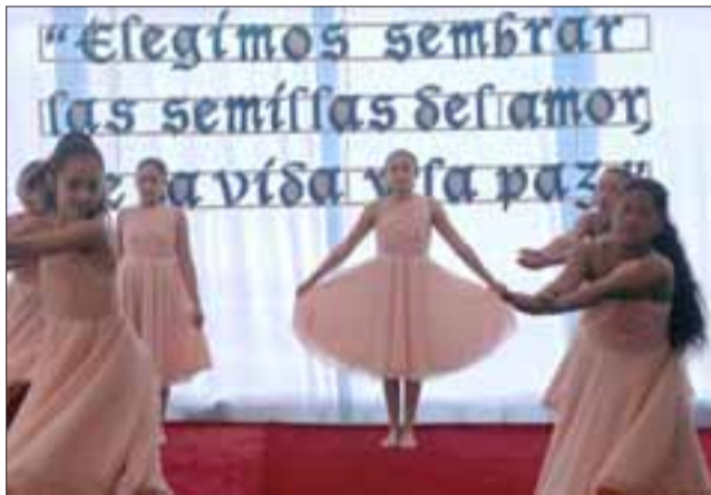
Las niñas también ofrecieron un ramillete de arte y cultura durante la actividad.