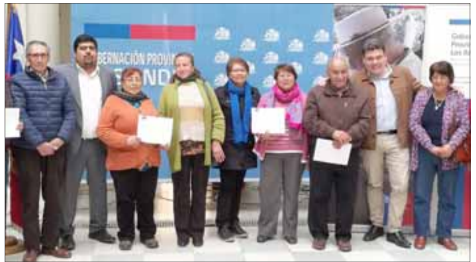
Unos 56 clubes de personas mayores de Los Andes recibieron el Fondo Nacional del Adulto Mayor, con una inversión total que supera los 40 millones de pesos.