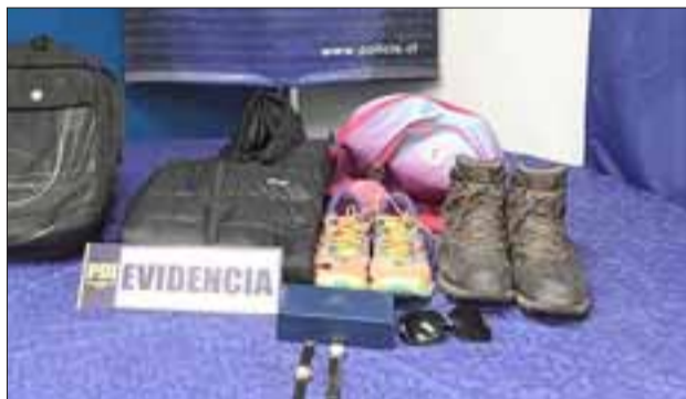
La Bicrim de la PDI de San Felipe capturó a la pareja que mantenía estas especies evaluadas en $400.000 producto de un robo cometido al interior de una vivienda de Población Yungay de esta comuna.

derivados hasta el Juzgado de Garantía de San Felipe para ser formalizados por la Fiscalía por Receptación. En