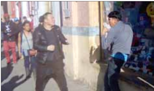
A PUÑO LIMPIO.- Como vemos en esta gráfica, el comerciante chino está seguro de que su adversario le robó.