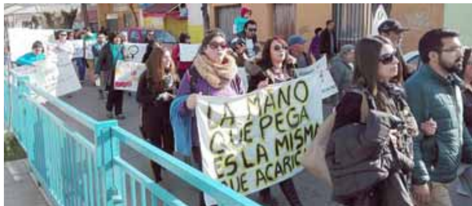
Varias calles y alamedas de San Felipe fueron recorridas en esta marcha comunitaria.