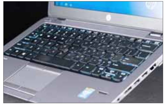
Todo apunta que sería personas con acceso limitado a la bodega quienes robaron un notebook como este. (Foto referencial).

El subprefecto puntualizó que fue el jefe de la bodega, quien la semana pasada se percató que había una cierta cantidad de equipos, «pero posteriormente pasan los días, vuelve a pasar por el lugar y se da cuenta que había una cantidad