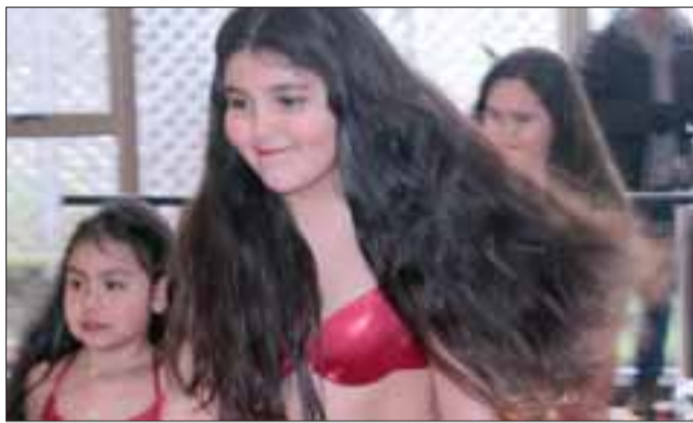
DANZA ÁRABE INFANTIL.- Las más chicas también cautivaron a todos con su danza árabe, ya que tienen muchos meses ensayando.