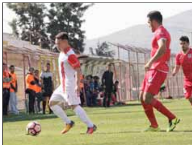
La derrota frente a La Calera hizo poco feliz fue el retorno del Uní al Municipal.