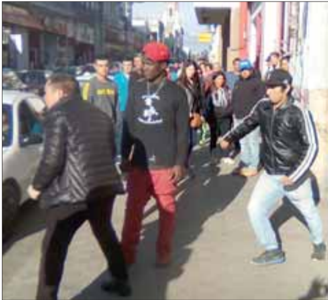
ESCENARIO CONFUSO.- Aquí vemos a este hombre, no sabemos si participó o no en el robo, pero sí se muestra muy interesado en atacar al chino por la espalda.