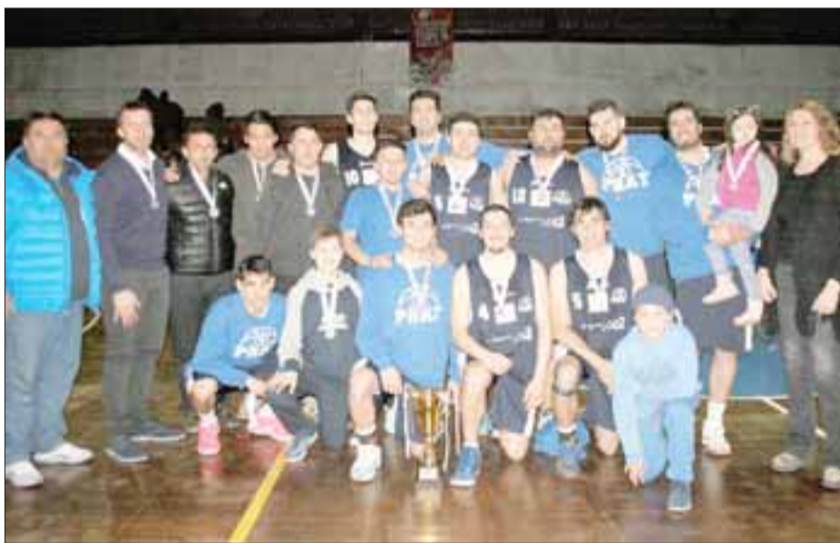
El Prat cerró con un vicecampeonato la participación en la Libcentro A.