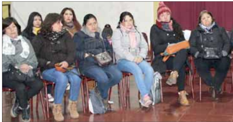
En la actualidad son 80 las mujeres que participan de las distintas actividades que ejecuta este programa, que se realiza a través de profesionales de la Dideco de la Municipalidad de Panquehue.