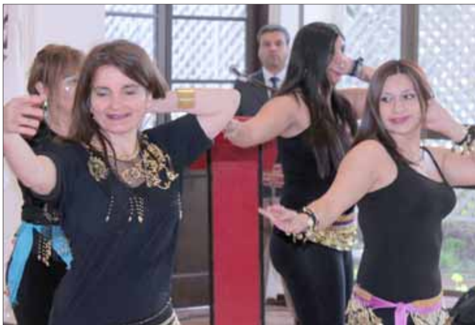
IMPEQUE. - Estas bellas artistas sanfelipeñas desarrollaron varios números artísticos en danza árabe.