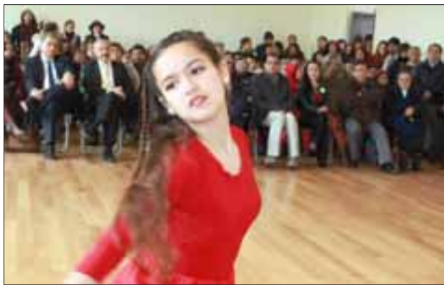
CANDOR JUVENIL.- Esta bella jovencita deleitó a los presentes con su danza pura, dulce y bien ejecutada.