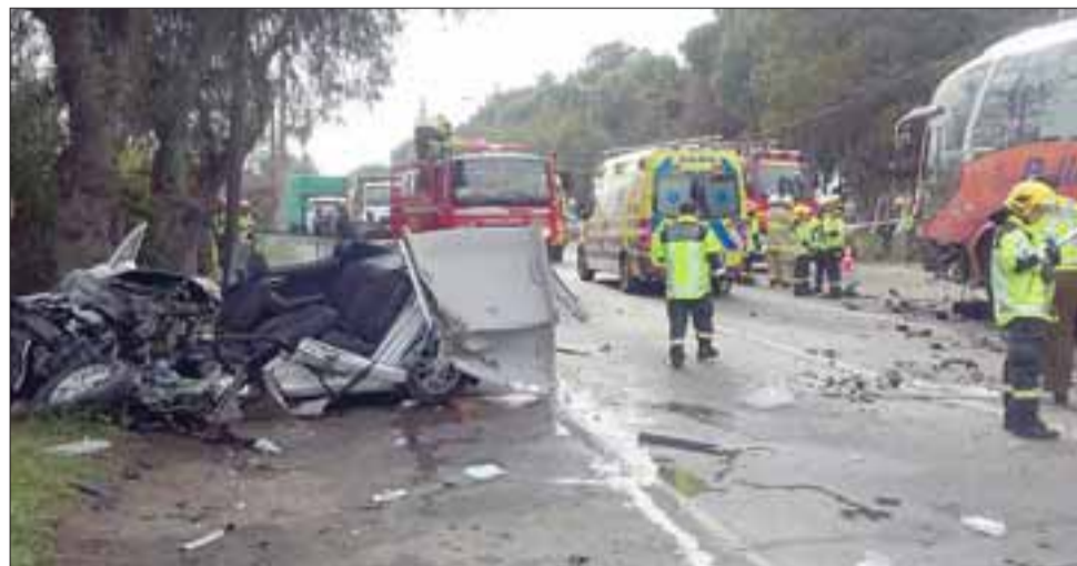
El lamentable accidente ocurrió la mañana de este viernes en la Ruta 60 CH en el sector La Pirca de Panquehue.

A la emergencia concurre Carabineros, personal del Samu y la Unidad de Rescate de Bomberos de