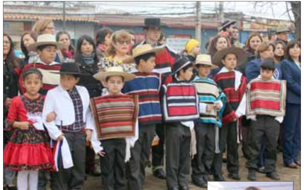
FELIZ CUMPLEAÑOS.- Peques y grandes celebraron los 174 años de existencia de su casa estudiantil.

Al ser consultada por el trabajo de integración que ha desplegado el establecimiento a partir de la incorporación de alumnos hijos de migrantes, de los cuales ya hay 45 de varias nacionalidades, Baquedano explicó que «tenemos un alto número de niños venezolanos, colombianos, haitianos, peruanos y bolivianos, quienes se han ido incorporando a la escuela con mucho interés y de-