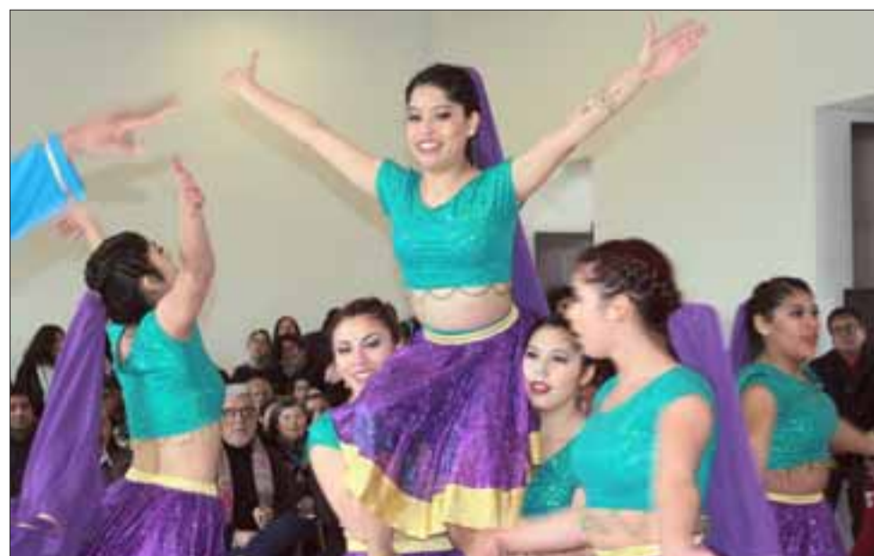
VUELAN ALTO. - Estas chicas en verdad que sorprendieron al público, pues su explosividad e histrionismo fue algo fuera de serie.