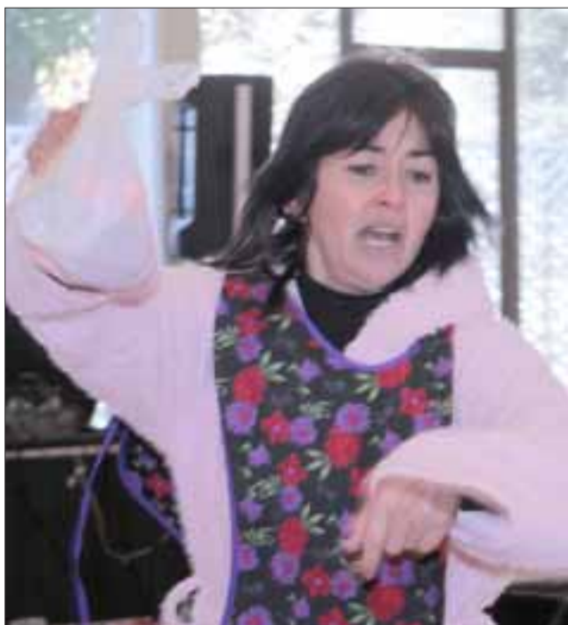
TEATRO Y HUMOR.- Hubo también teatro y mucho humor, a carcajadas el público aplaudió el talento local de esta actriz.