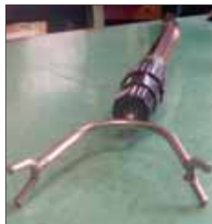
PELIGRO.- Con esta varilla los comerciantes chinos enfrentaron a quienes ellos aseguran que son los ladrones.

Lo insólito en este caso, es que el público, sanfelipeños por cierto, apoyaban a los delincuentes, algunos gritaban a los chinos 'no los golpeen, sólo son niños', pero en realidad se trataba de personas adultas. Una situación bastante inusual, ya que finalmente los sospechosos escaparon sin ser detenidos, como casi siempre, y a los chinitos sólo les quedó ir a curarse las heridas y limpiarse la sangre del rostro, sangre derramada por defender lo que es suyo de quienes no trabajan y prefieren en cambio robar a quienes sí lo hacen. Carabineros en pocos minutos se hizo presente en la importadora, tomando registro de