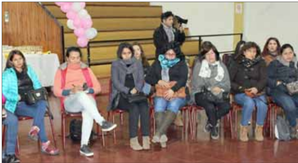
Fue en la sala cultural donde cada una de ellas compartió sus experiencias, desde el momento de haber ingresado al programa.

con los logros alcanzados a través del programa mujer trabajadora y jefas de hogar, pues muchas de ellas han recibido de parte del municipio, las orientaciones y apoyo necesario para lograr emprendimientos. Indicó que gran parte de ellos dependían de los beneficios sociales del municipio, en cambio a través de estas líneas de intervención hay un perfil totalmente distinto e independiente.