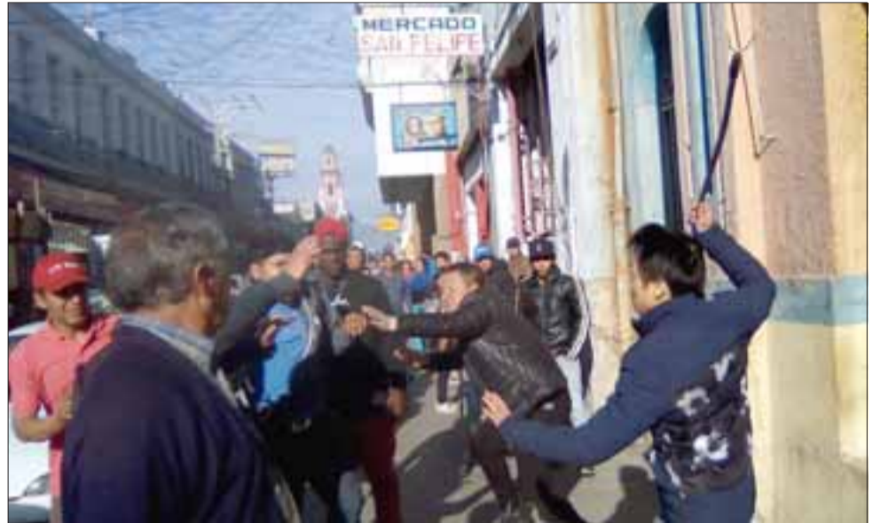
SIGUEN LOS ROBOS.- Fue una batalla campal, en esta gráfica vemos a los orientales en franca pelea callejera intentando recuperar lo que les robaron.