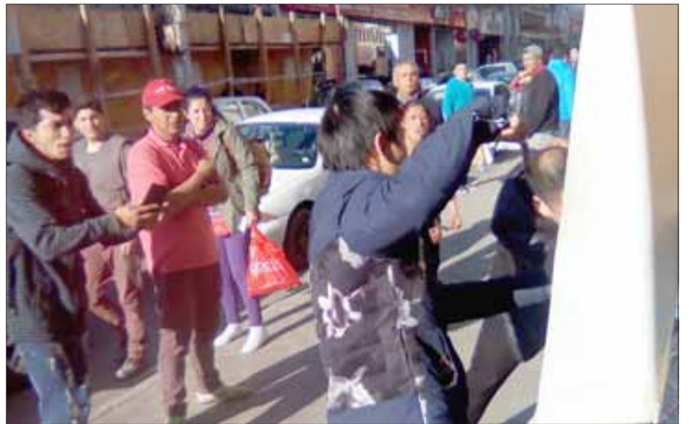
Como lo muestra esta gráfica exclusiva de Diario El Trabajo, cuando los chinos lograron someter a uno de los sospechosos, otras personas gritaban a favor de los supuestos ladrones.