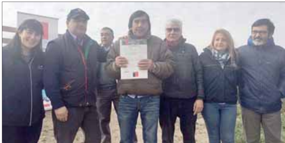
Seis familias fueron bonificadas con un total de $53 millones, que se traducirán en una inversión público privada de unos $60 millones, recursos destinados a la implementación de sistemas de riego y la construcción de estanques.

De igual forma, el Seremi de Agricultura, Ricardo Astorga, sostuvo que esta visita está relacionada con los compromisos que habíamos adquirido como Gobierno de acercar la Comisión Nacional de Riego a la pequeña agricultura, complementando además el esfuerzo del Gobierno Regional para entregar una ayuda integral a los agricultores y asegurar el riego. «Nos comprometimos ante el Consejo Asesor Campesino de que esto se iba a hacer y ya se ven los primeros frutos del trabajo realizado junto con la CNR, que hoy cuenta con oficina re-