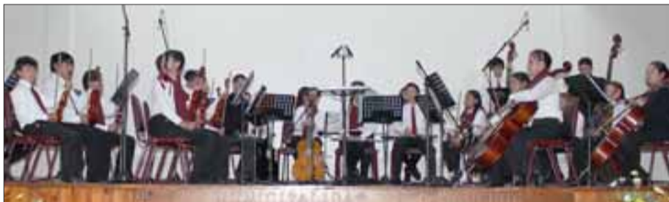
La actual orquesta sinfónica escolar de Panquehue está integrada por 30 alumnos, quienes durante el primer semestre de año realizaron la preparación en instrumentos de cuerda, vientos y bronce.

La presentación del trabajo realizado durante el primer semestre del 2017 de la orquesta de Panquehue, se ha planificado para el día martes 05 de septiembre a las 18:00 horas en la sala cultural de la comuna de Panquehue.