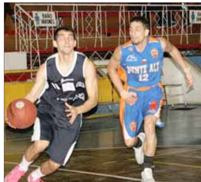
El Prat cayó como local 63 a 78 en el tercer partido de la final de la Libcentro A, que Puente Alto hizo suya por un global de 3 a 0.