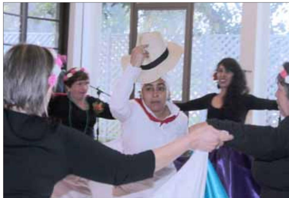
POR SIEMPRE COLOMBIA. - También hubo bailes colombianos llenos de imaginación y excelentes coreografías.