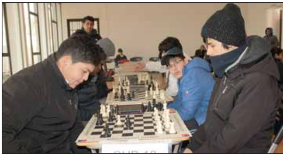
HOY SE JUEGA.- Durante todos estos meses los estudiantes que participarán han estado entrenando duro. Son 60 niños los que darán vida y alegría al torneo, estarán participando chicos del Liceo Mixto de San Felipe; Escuela Vedruna; Liceo Roberto Humeres y el Instituto Marista, de Los Andes.