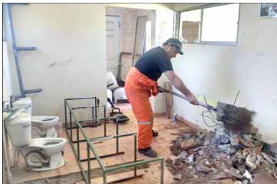
Una inversión de cuatro millones de pesos permitirán renovar por completo los baños de los más pequeños de la Escuela, instalaciones que no eran intervenidas hace 20 años.