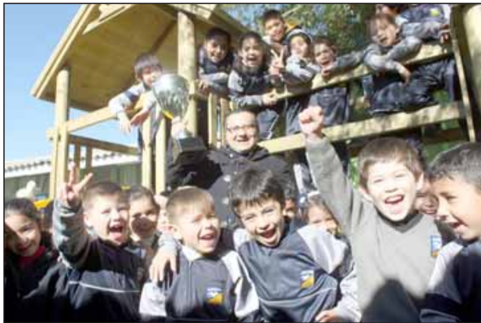
LA TERCERA COPA.- Los niños de la Escuela José de San Martín están como locos de alegría de cara a este tercer campeonato interescolar de ajedrez.