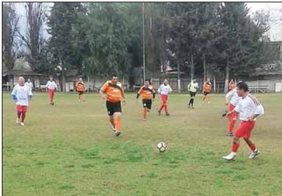
Una fecha donde no se produjeron grandes novedades fue la que se vivió en la cancha Parrasía, campo que es sede de la Liga Vecinal.