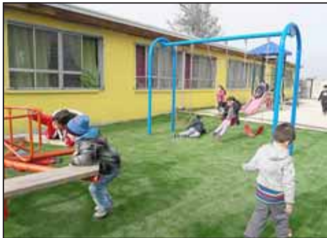
Con fondos SEP fue posible además mejorar el patio de párvulos, el que ahora cuenta con césped.

“Hemos entrado en un proceso de mejoramiento continuo para nuestro establecimiento y dentro de eso está el arreglo completo de los servicios higiénicos para los alumnos de pre kínder y kínder. Estas obras ya comenzaron y demorarán diez días aproximadamente”, dijo la directora.