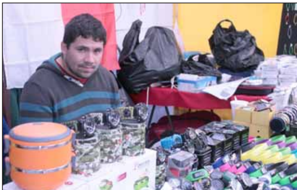
TIERRA DE NADIE. - Este comerciante también fue víctima del hampa, paso a paso pareciera, los delincuentes ganan esta batalla contra el comercio en nuestra ciudad.