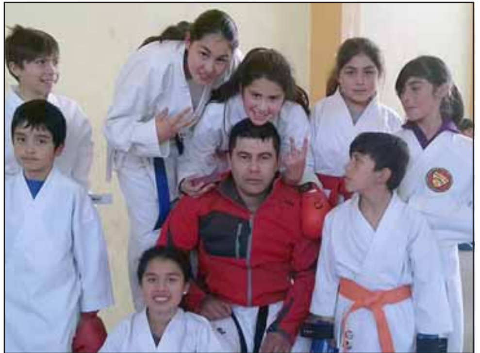
KARATE ACONCAGÜINO. - Aquí tenemos a los jóvenes karatecas cateminos, quienes desde hace un par de años vienen acumulando puntaje y experiencia en todos los niveles.