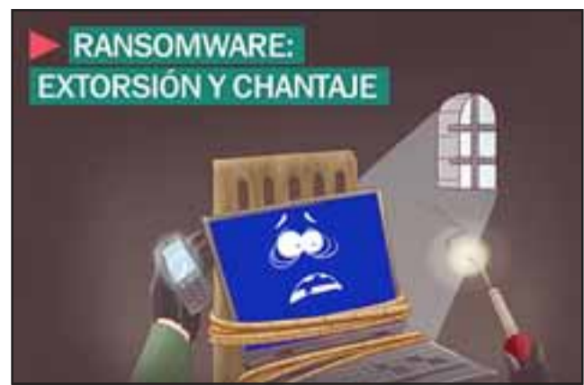
El Ransomware, o rescate cibernético, es uno de los peores dolores de cabeza de la postmodernidad. Nadie está libre del ataque.

En cuanto a si existía respaldo o no de la información municipal y si existía algún método más moderno y efectivo para proteger la digitalización de las bases de datos municipales, González advirtió que "no se tiene claridad porque además estos virus pueden ser introducidos vía correo electrónico desde cualquier computador del municipio, por lo tanto, en una primera instancia, el diagnóstico que se solicitó a Movistar, ellos no pueden asegurar como ingresó el virus, por lo tanto, hay que mejorar los niveles de seguridad, pero a pesar de ello, a ninguna empresa se le puede dar la seguridad