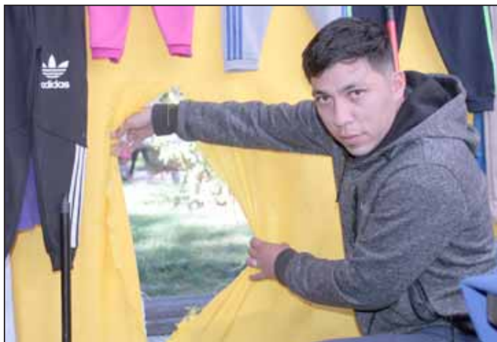
INGRATA VISITA. - Rompiendo la tela de esta carpa los delincuentes lograron llevarse más de un millón de pesos en relojes y otra mercadería.

«Nosotros anoche le advertimos a Carabineros que la gente que lava autos acá