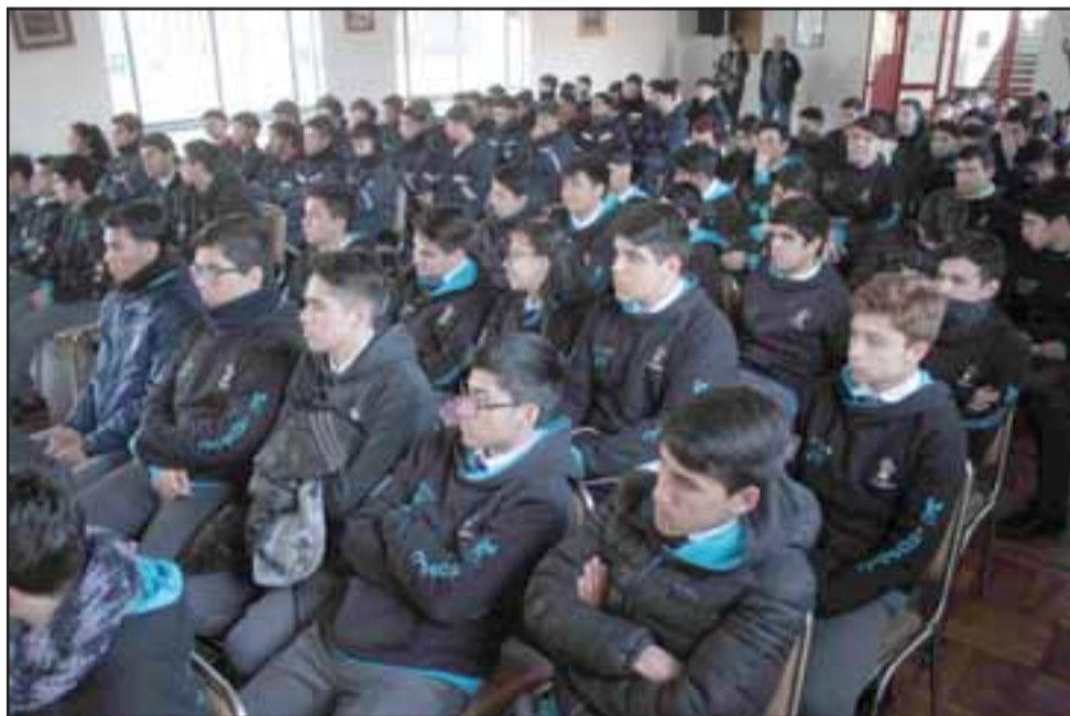
Más de un centenar de estudiantes del Liceo Industrial de San Felipe, dedicados a las especialidades de Mecánica Industrial y Automotriz, fueron parte de la nueva jornada de Andina más Cerca.

clases con lo que se realiza en los ejercicios prácticos y la experiencia de quienes trabajan en el área. «Esto es bien productivo porque demuestra el interés que tiene Codelco porque nosotros surjamos como técnicos», agregó el estudiante.