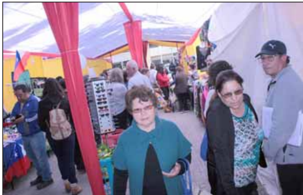
LA FERIA SIGUE. - La feria instalada en nuestra Plaza de Armas continuará funcionando hasta el próximo fin de semana.