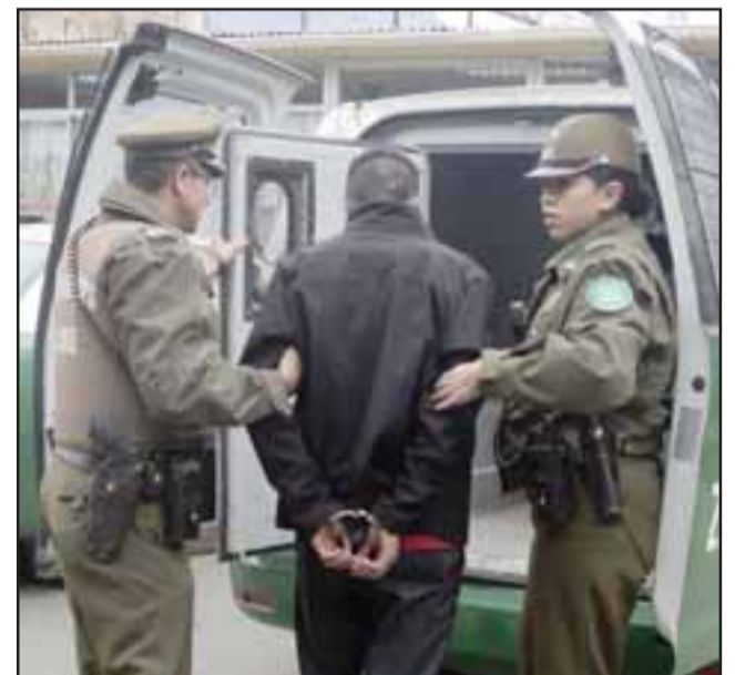
El antisocial fue capturado por Carabineros por robo en lugar habitado, no obstante tras ser formalizado en el Tribunal fue dejado en libertad con mínimas cautelares. (Foto referencial).