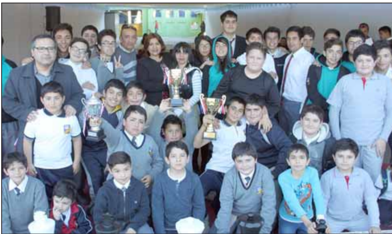
TENEMOS CAMPEÓN. - Todo un reto deportivo representó para los ajedrecistas escolares que ayer dieron vida a la III Copa de Ajedrez Diario El Trabajo 2017 , jornada interescolar organizada por la Escuela José de San Martín en horas de la tarde en los salones de la casa estudiantil. En esta oportunidad se disputaron los premios niños de 6 a 9; 10 a 12; 13 a 14 y 15 a 18 años de edad.

« La Copa de Ajedrez Diario El Trabajo es una idea original que en nuestra escuela empezamos a desarrollar una vez al año en honor a este importante medio escrito del Valle de Aconcagua. Cuando el profesor Guillermo Quijanes nos propuso el proyecto, vimos en él mismo una muy buena oportunidad para destacar en este torneo a los más hábiles ajedrecistas del valle, así, cada año el interés en participar ha ido en aumento, actualmente ya es una tradición