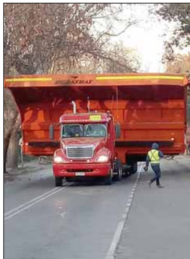
La impactante imagen da cuenta de las dimensiones de la carga que llevaban los vehículos que causaron el caos en Panquehue. (Foto @EmergenciaA).

Agregó el alcalde Pradenas que como medida de seguridad, ambos camiones quedaron estacionados al interior de un servicentro en la comuna de Panque-