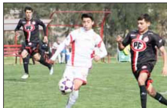
Entre mañana y el domingo los cadetes del Uní se medirán con sus similares de Coquimbo Unido.

Después de los irregulares resultados obtenidos la fecha pasada cuando debieron enfrentar a Deportes Copiapó, un rival al que se estaba acostumbrado a ganar en casi todas las series; este sábado y domingo próximos las series cadetes del Uní buscarán su rehabilitación ante las fuerzas básicas de Coquimbo Unido, club ante el cual suelen darse partidos muy estrechos y de pronóstico muy incierto.