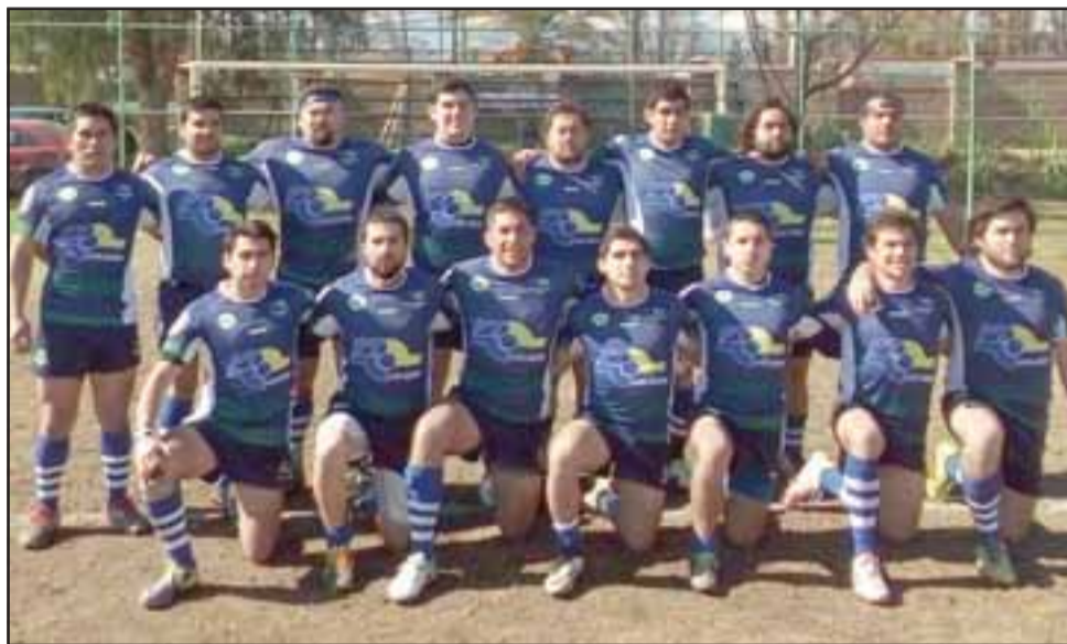
Los Halcones deberán salir airosos en La Serena para seguir en lo más alto de la Copa de Oro.