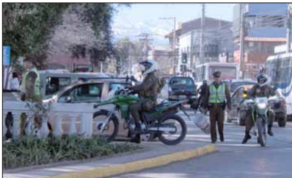
Carabineros de San Felipe resguardando la seguridad en la Plaza de Armas de la comuna ante los últimos acontecimientos delictuales ocurridos.

Afortunadamente una patrulla policial que circulaba por ese sector, advirtió lo sucedido, interviniendo en la captura de un segundo sujeto, quien esperaba a su cómplice a bordo de una motocicleta marca Keeway, con el motor encendido, a metros del lugar de los hechos.