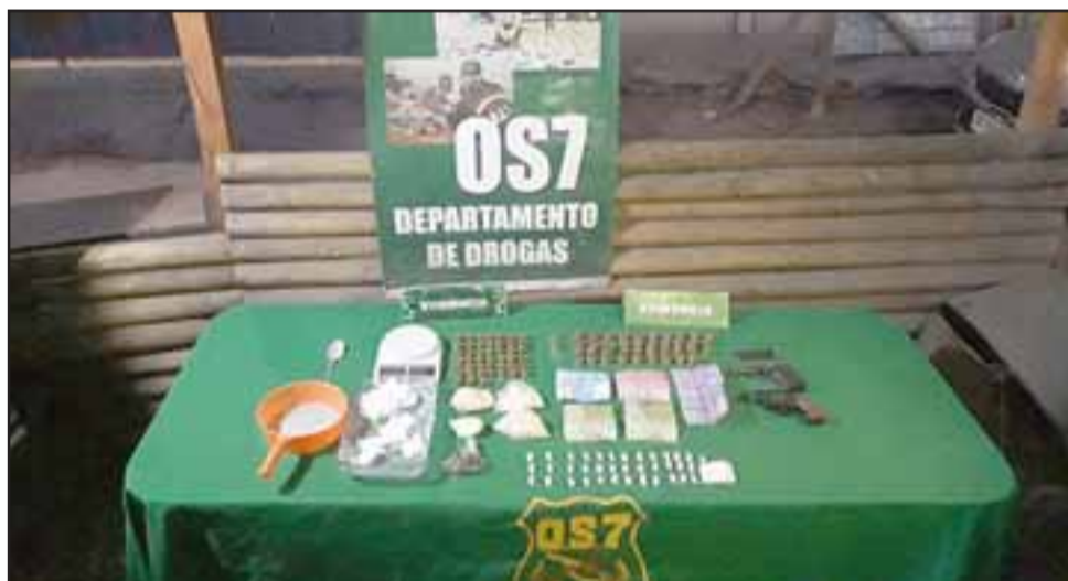
Personal del OS7 de Carabineros efectuó el allanamiento este miércoles al interior de la vivienda de la imputada ubicada en la población René Schneider de Los Andes, incautando pasta base, marihuana y armamento de fantasía.