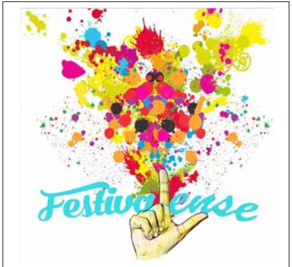
Un festival inclusivo, el primero en su tipo, para estudiantes sordos, se estará desarrollando el 26 de octubre en San Felipe.

La invitación está hecha para que disfruten de este original festival que se desarrollará el jueves 26 de octubre.