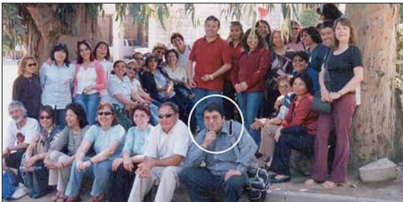
UN LÍDER NATO.- Esta fotografía nos muestra al profesor, en compañía de sus profesores cuando era el director de la Escuela 62, ahora José de San Martín.