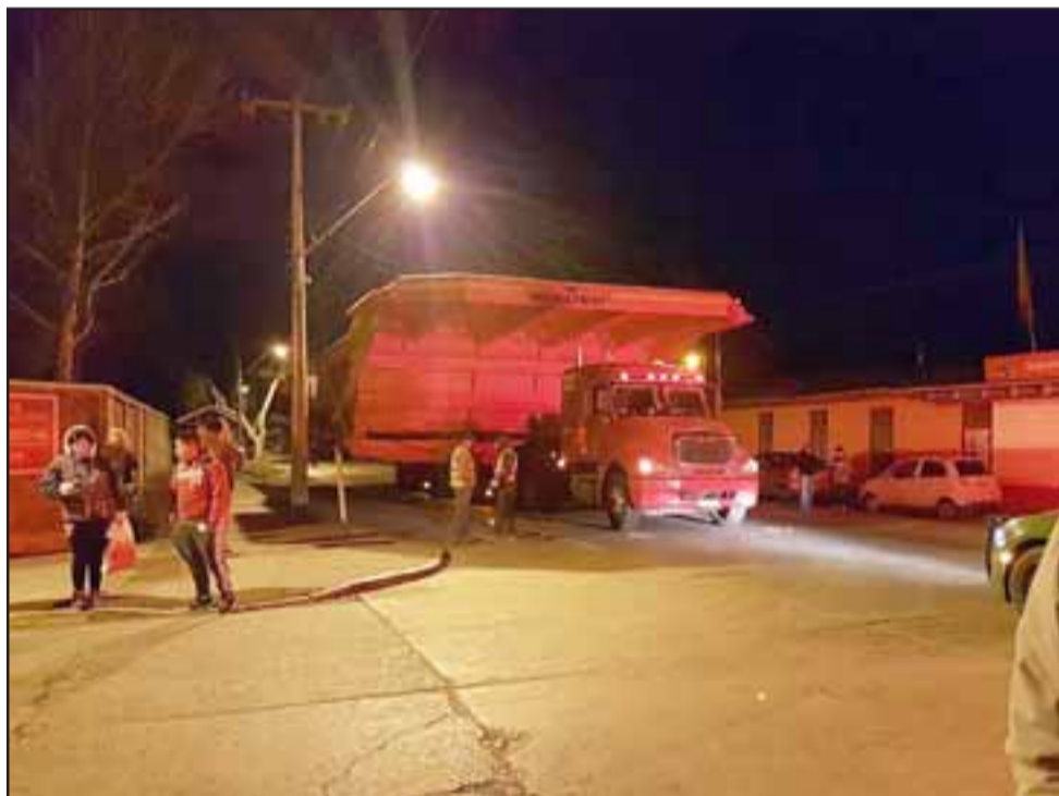
Las gigantes bateas ocupaban ambas calzadas en Panquehue centro, en las cercanías de la Municipalidad.

mes, una inspección en todo el trazado, con el fin de cuantificar los daños.