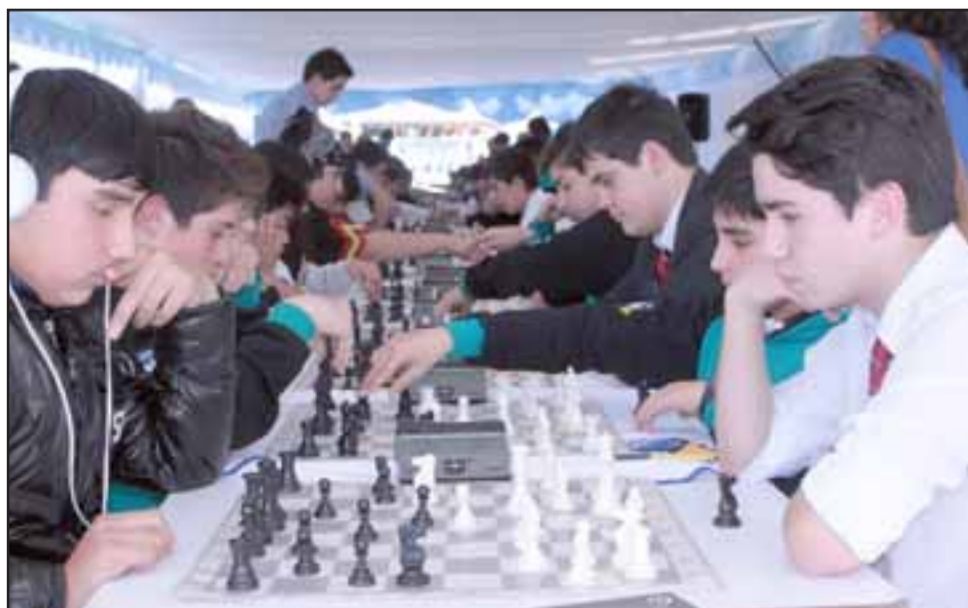
JÓVENES DEL AJEDREZ. - Fueron instantes de nervios, alegrías y frustraciones durante la jornada de la III Copa de Ajedrez Diario El Trabajo 2017 .