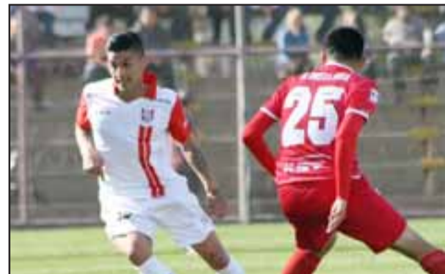
El conjunto sanfelipeño debe sumar para comenzar a escapar de la parte baja de la tabla de posiciones.

San Marcos 10 Unión La Calera 10 Coquimbo Unido 10 Ñublense 8 Santiago Morning 8 Cobreloa 8 La Serena 7 Iberia 7 Puerto Montt 6 Valdivia 5 Unión San Felipe 5 Barnechea 4 Cobresal 4 Rangers 2 Magallanes 2