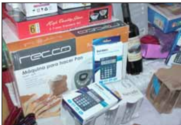
Los premios han sido donados por amigos y el comercio sanfelipeño, entre los muchos premios hay vinos, línea blanca, electrodomésticos, calculadoras, máquinas para hacer pan, ropa, juguetes y hasta una alfombra nueva gigante.