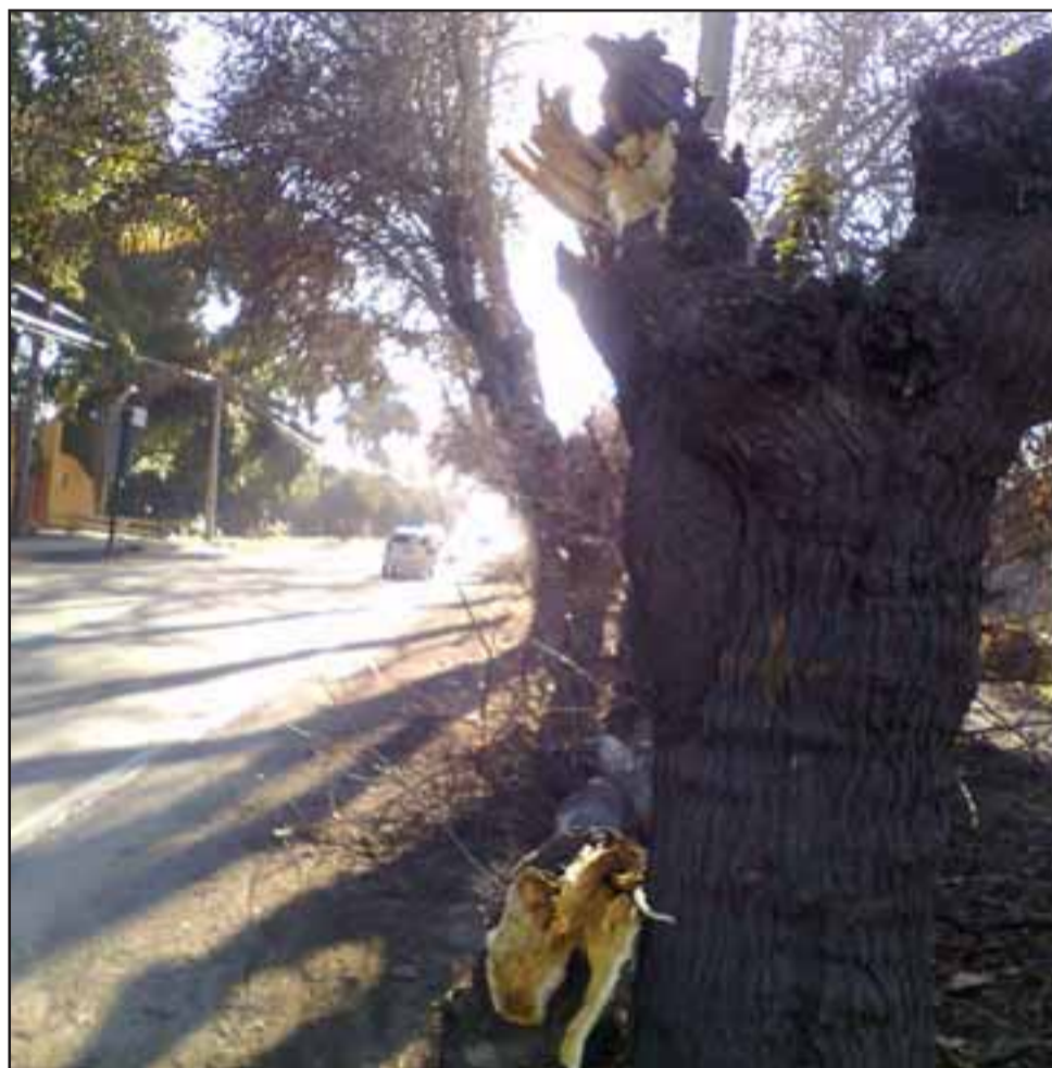
Numerosos árboles resultaron dañados por el paso de la gigantesca carga... ¿y quién responde? (Foto @aconcaguaradio).