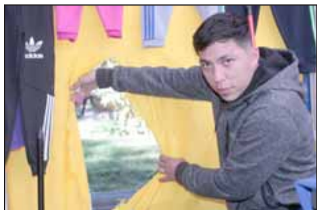
Recordemos que este miércoles un locatario de la Plaza de Armas de San Felipe, denunció el robo de especies por desconocidos que se apoderaron de diversas especies y dinero en efectivo.

OS7 sacó de circulación 1500 dosis de pasta base y marihuana: