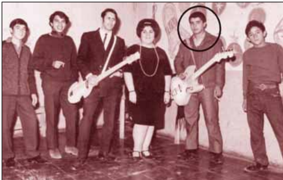
TAMBIÉN ERA MÚSICO.- Aquí lo vemos cuando amenizaba el popular y desaparecido grupo musical 'Los Celos'.