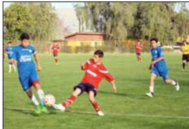
A punto de llegar a su fin se encuentran los Regionales U13 y U15 organizados por Arfa.

Grupo 3: Rural Llay Llay – Los Andes; Putaendo – Llay Llay Centro.