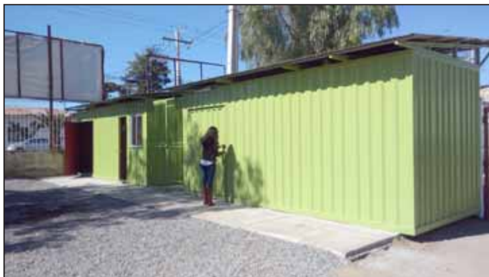
En la parte posterior del cubículo, habrá una oficina donde un operario guiará a los vecinos sanfelipeños al momento de depositar los residuos.