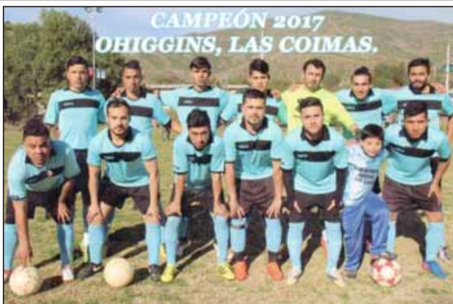
Los equipos de Honor y Segunda aportaron puntos valiosos para que el O'Higgins se convirtiera en el mejor del Apertura del torneo de Putaendo.