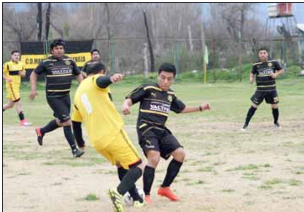
Partidos por la Lidesafa, Liga Vecinal y torneo Asociación se jugarán durante el sábado y domingo en todo San Felipe.