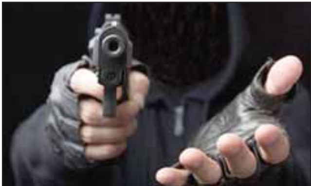
El sentenciado asaltó un minimarket de la Villa Bernardo Cruz en San Felipe, llevándose sólo una cajetilla de cigarros. (Foto Referencial).