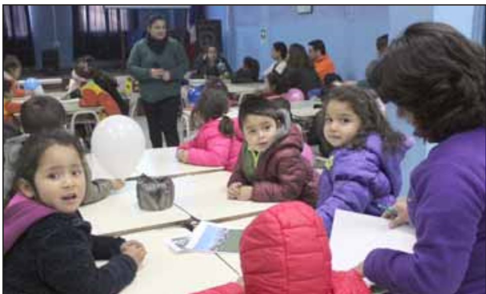
OTRA GENERACIÓN. - Estos niños ya están aprendiendo a opinar y expresar lo que esperan del mundo de los adultos para su beneficio y el de su jardín.