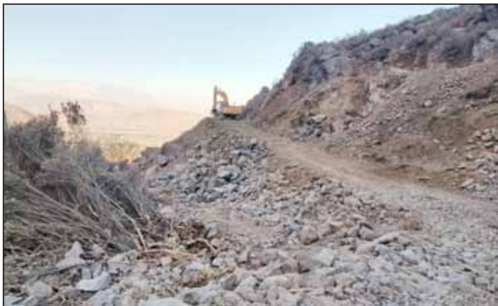
Los cerros El Tabaco en El Asiento y Piguchén en Putaendo, son dos de los puntos de extracción que más preocupan por el daño irreparable a las comunidades afectadas.

que se había asumido el tema desde las autoridades comunales y provinciales, que una vez más no han sabido hacerse cargo de esta problemática. De tal modo que hemos logrado la fiscalización de los distintos seremis que se relacionan con el tema, para que constaten en terreno el daño irreparable que se ha producido en el Santuario de la Naturaleza Serranía del Ciprés”.