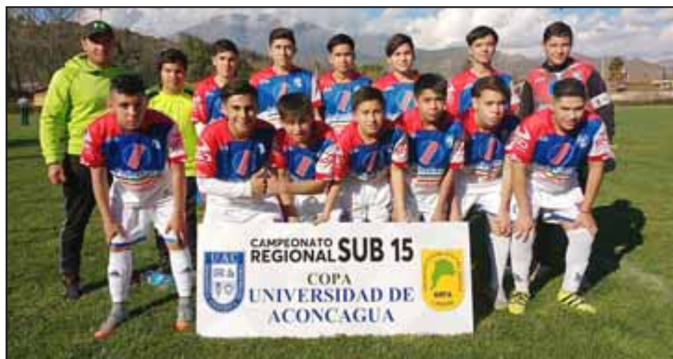
La selección de Los Andes fue por lejos la de mejor rendimiento en la primera parte del Regional U15.

*Programas dobles en todas las canchas, jugando primero los equipos U13.