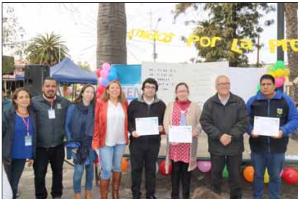
Las escuelas Eduardo Becerra de Casablanca, Gastón Ormazábal de Granallas y Colegio Marie Poussepin, también llamadas 'escuelas focalizadas', tuvieron parte en la organización.