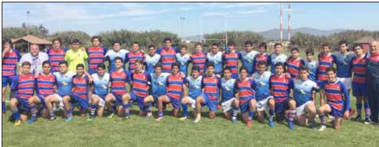
De ganar su partido de mañana los Halcones se harán del liderato de su grupo en la Copa de Oro.