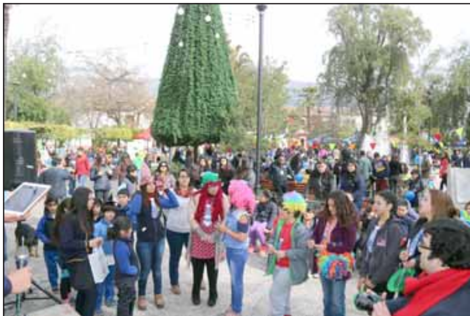
La Plaza Prat de Putaendo se repletó de alumnos y transeúntes que se hicieron parte de esta jornada de prevención en drogas.