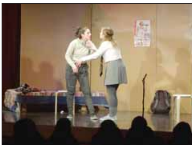
Actrices de la compañía Creces Teatro protagonizan una de las escenas de la obra 'In tensiones' , la que fue del gusto de los numerosos alumnos asistentes.