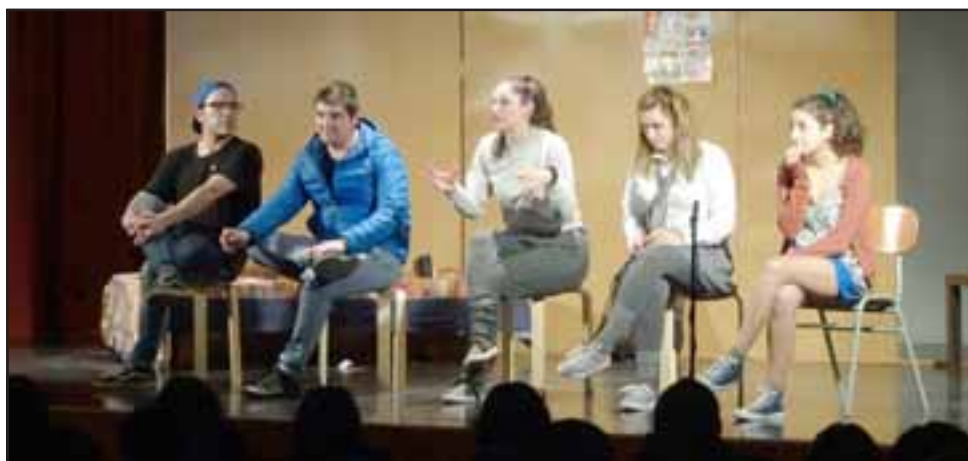
La compañía Creces Teatro está trabajando por la equidad de género y creó esta obra que aborda la violencia en el pololeo.

«Este año realizamos un trabajo preventivo que nos llevó a aproximarnos a los liceos y colegios, poder realizar una serie de talleres para abordar temáticas como género, sexualidad, violencia en el pololeo y terminar con esta obra de teatro, en la cual se pueden visualizar las diferentes manifestaciones de violencia, con el objetivo que los jóvenes las identifiquen, y con ello, poder entregarles ciertas herramientas para recono-