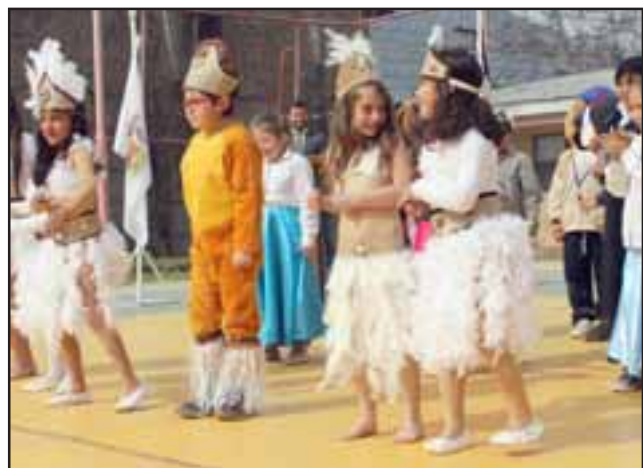
Los escolares también ofrecieron a los presentes varios bailes pascuenses para el deleite de todos.