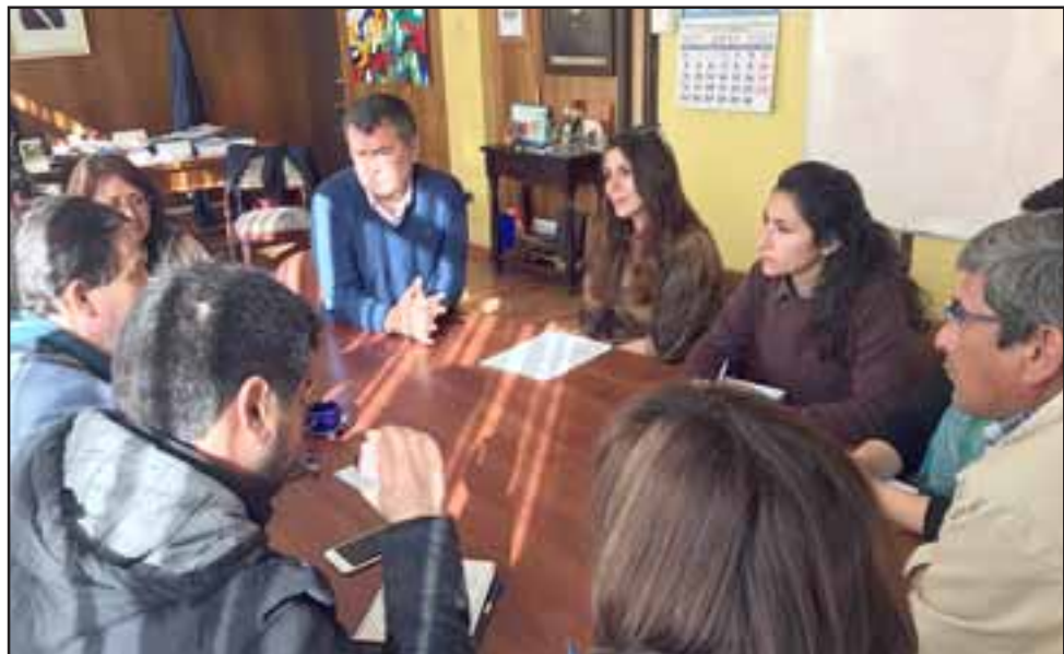
Representantes de Fundación Soñarte se reunieron con autoridades de Gobierno para resolver exclusión de niños con TEA del sistema de educación formal.

«Queremos encontrar una solución: cómo se pueden mejorar los recursos, cómo se puede capacitar a los profesores, a la gente del PIE (Programa de Integración Escolar)... no hay alternativas ni en educación pública ni privada, cuando llevamos a nuestros hijos y les presentamos el diagnóstico, nos dicen que no hay cupo, entonces queremos saber la verdad, si es verdad que no hay cupos en esos colegios donde hemos consultado por matrículas», argumentó la vicepresidente de Fundación Soñarte.