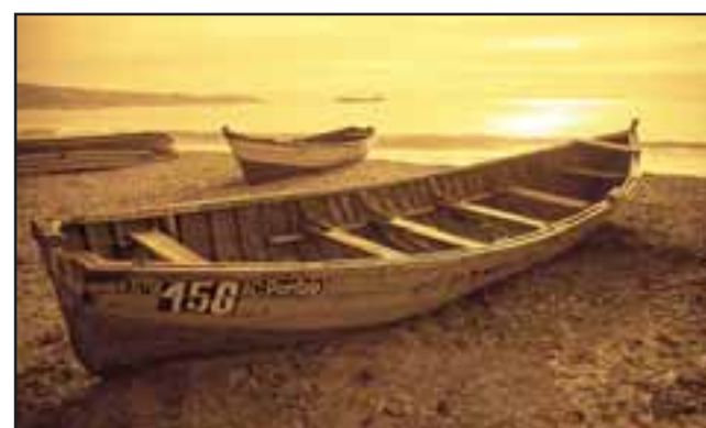
La fuerza del color y adecuada saturación, hacen de este trabajo una joya visual.