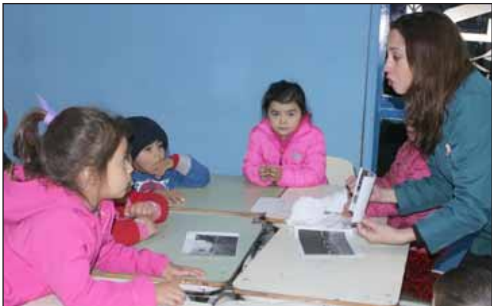
APRENDIENDO A PENSAR. - Para desarrollar este conversatorio, los profesionales usaron ideas, imágenes y la libre opinión de los niños.