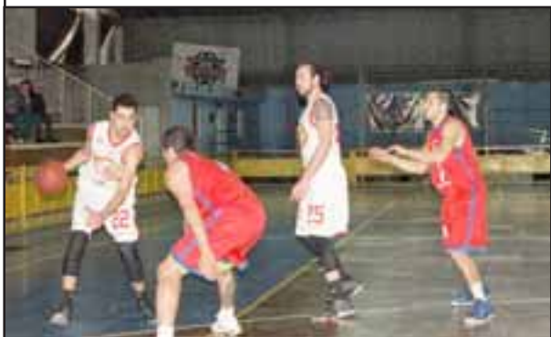
Este domingo en el Fortín Prat comenzará a jugarse la Copa Juan Arancibia Yáñez en serie de Honor.