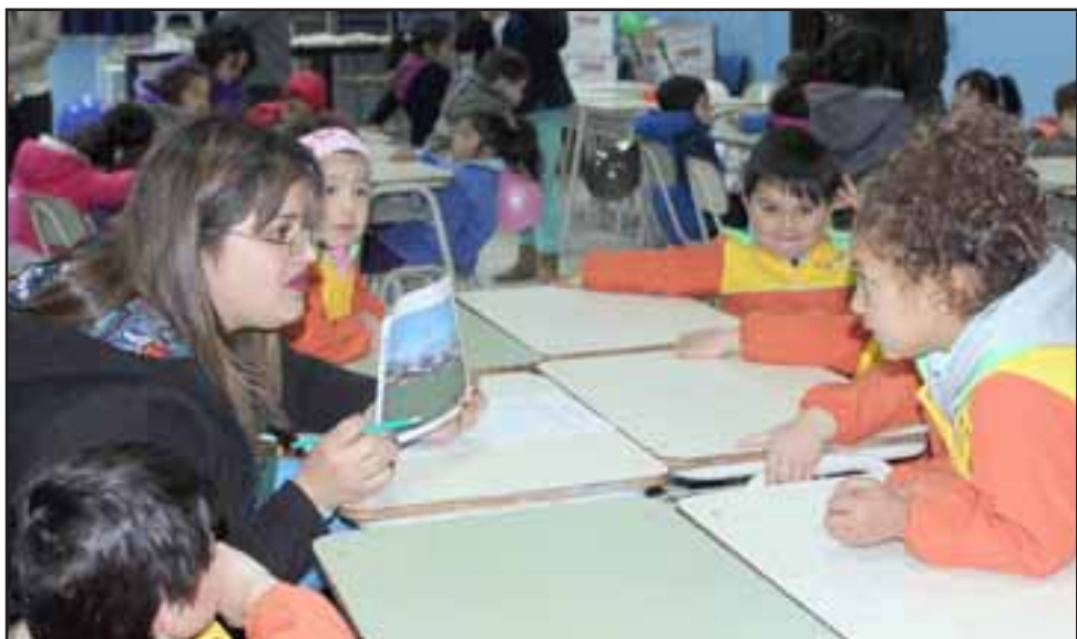
NIÑOS EN SINTONÍA. - Esta profesional parvularia logró sostener una conexión fluida con estos chicos de Cuncunitas.