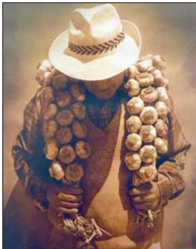
Esta es una de las 18 fotografías que estarán para que el público las disfrute, en la galería de arte en Buen Pastor.