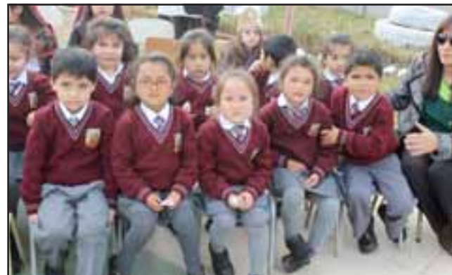
Estos pequeñitos son la fuerza de esta generación estudiantil, misma que celebraron con alegría los 59 años de su casa de aprendizaje.