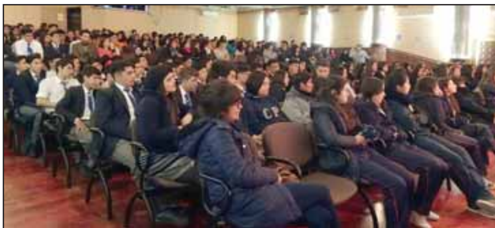
Masiva fue la asistencia de estudiantes a la interesante obra de teatro, cuya presentación fue organizada por el Centro de la Mujer.