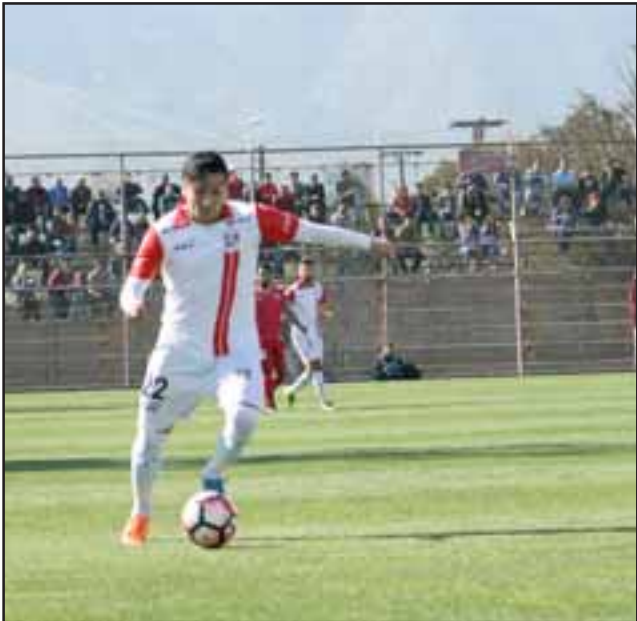
El conjunto aconcagüino cargará con la obligación de ganar a Cobresal para despegar del fondo de la tabla.