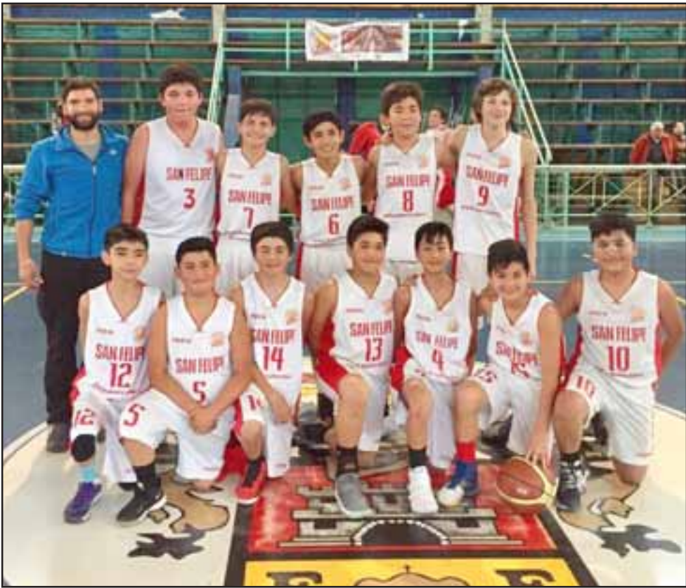
La serie U13 de San Felipe Basket buscará en Valparaíso mantener su estreno arrollador de la semana pasada.