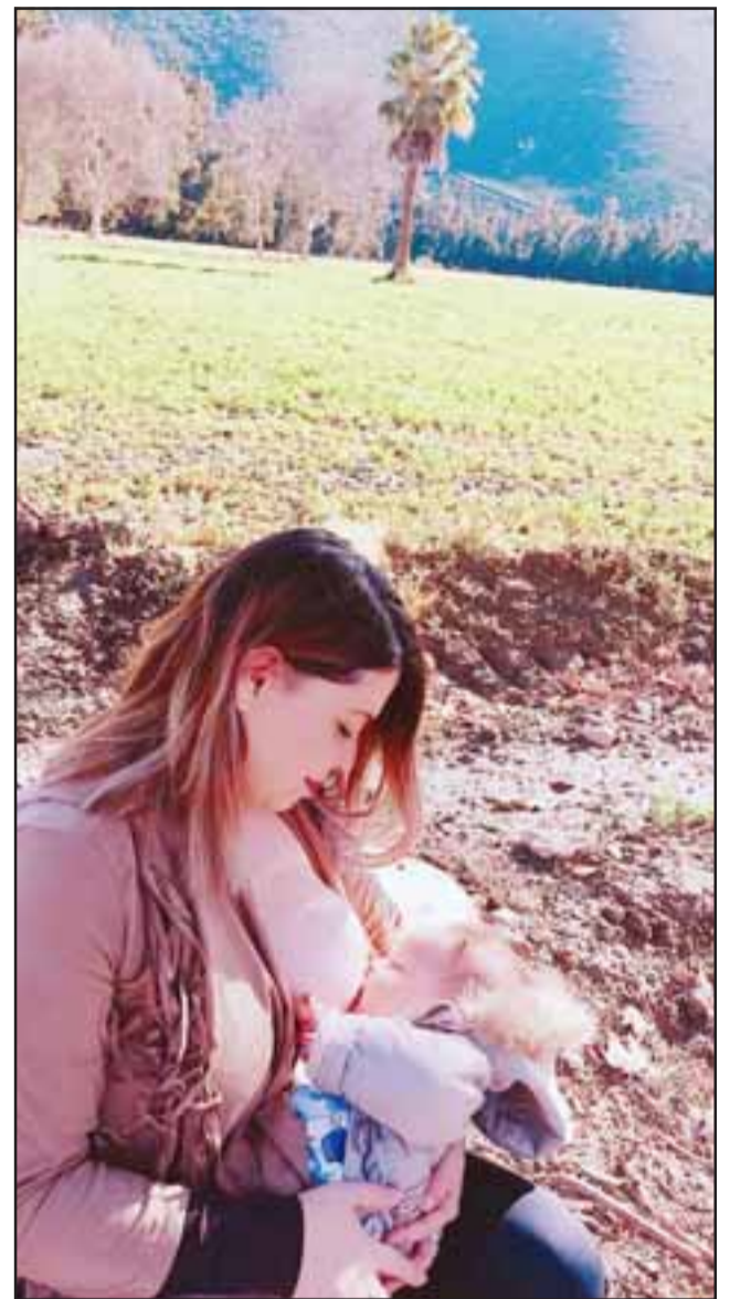
Esta es la foto que se adjudicó el primer lugar en el concurso sobre lactancia materna.

Agregó la personera que la fotografía ganadora será exhibida a través de un afiche en distintos lugares de mayor afluencia de público en la comuna de Panquehue, tal es el caso del Cesfam y el mismo municipio.