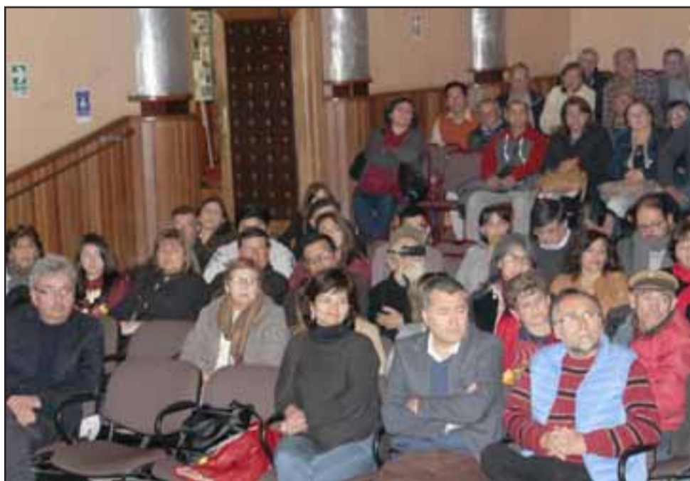
En el Teatro Municipal de San Felipe se desarrolló la actividad que recordó a las víctimas del 11 de septiembre.