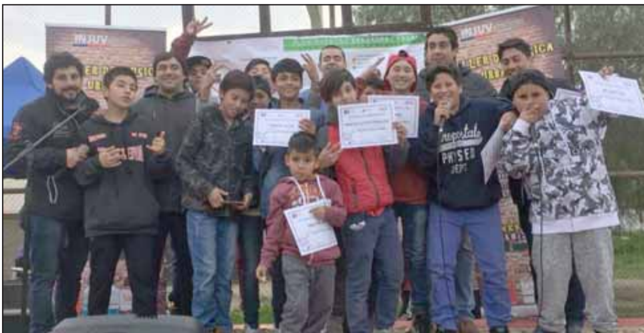
Ellos son parte de los participantes de esta fiesta urbana dirigida a desarrollar Hip-Hop y otros ritmos de nuestra ciudad.