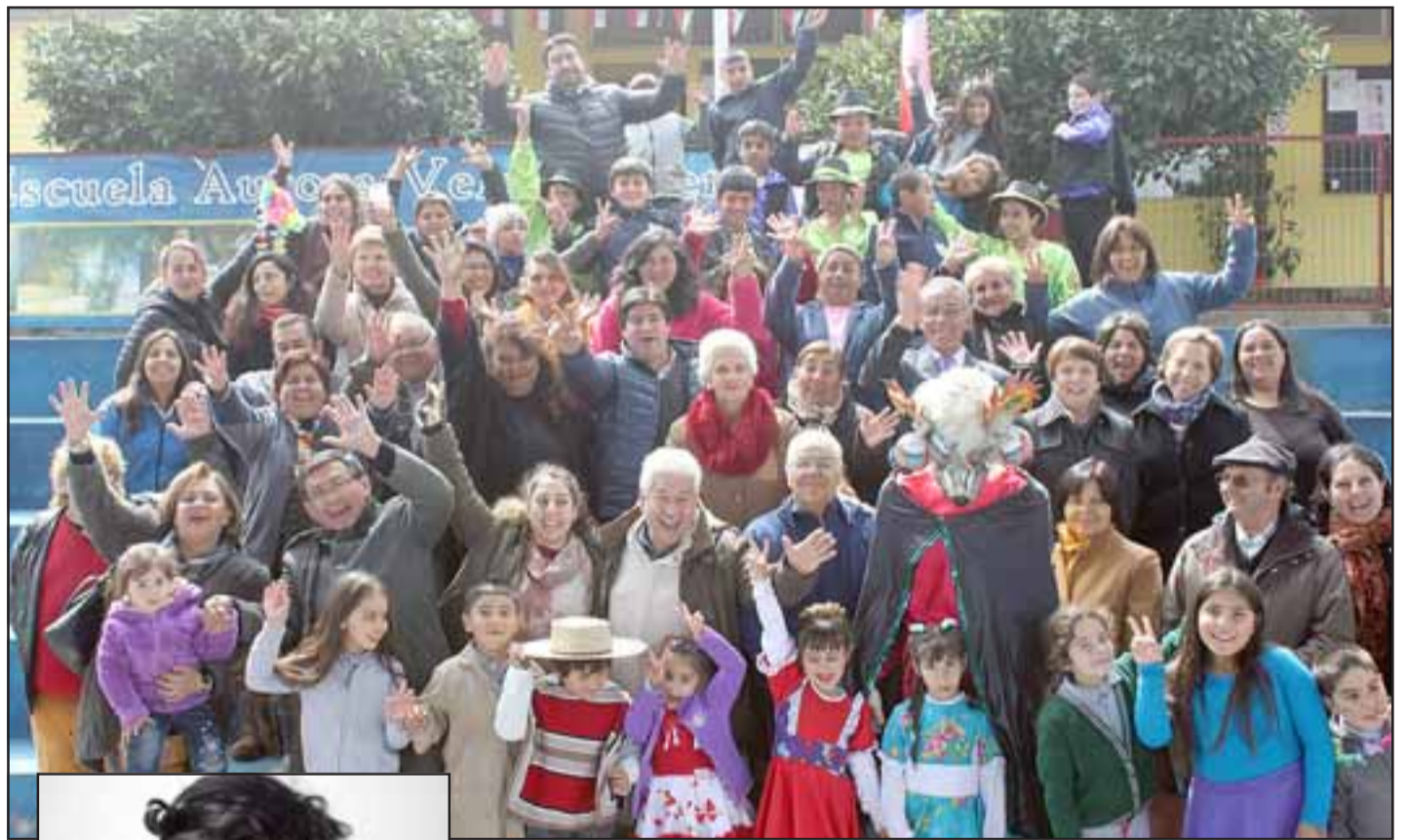
FIESTA DE LA CHILENIDAD.- Con gran alegría la Escuela Aurora Velasco, de Las Cabras en Santa María, celebró la Fiesta de la Chilenidad 2017. Hubo bailes típicos y hasta pascuenses, comidas típicas y un lleno total con mucha cueca. Las autoridades de la comuna y apoderados disfrutaron así del inicio de Fiestas Patrias, mismas que ya toman fuerza y vigor conforme se acerca el 18 de Septiembre.