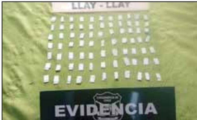
Un total de 77 envoltorios de pasta base de cocaína fueron incautados por Carabineros.

Tras una denuncia anónima Carabineros sorprendió al imputado en la vía pública aparentemente comercializando estas sustancias en la comuna de Llay Llay.