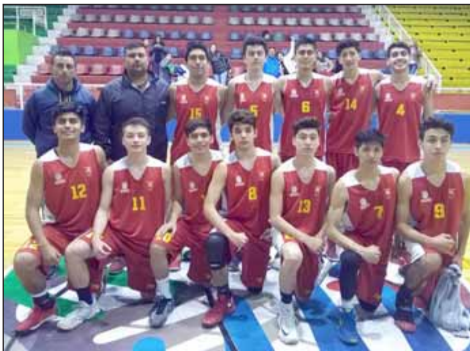
La Selección U17 de San Felipe logró clasificar al torneo Nacional de su serie que se realizará en la austral Punta Arenas.