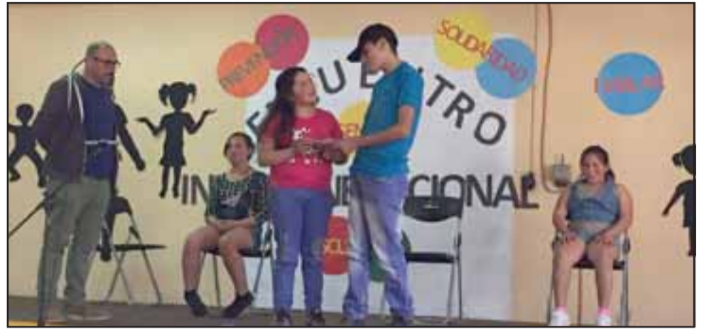
Los niños del Taller de Teatro de la Escuela Manuel Rodríguez presentaron una obra que trata sobre la inclusión.

En la oportunidad, tanto niños como jóvenes, adultos y adultos mayores disfrutaron de la velada, en la que destacó la participación de la comunidad no sólo como público, sino también entre los artistas invitados a presentarse en el escenario.