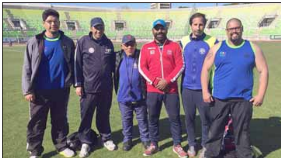
La delegación de la Escuela de Atletismo de Llay Llay cumplió una destacada actuación en el Zonal de atletismo realizado en Valparaíso.