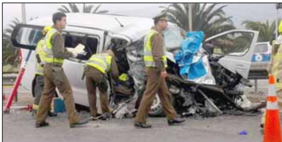
La violencia del impacto deformó la cabina del furgón, provocando la muerte de cuatro de sus ocupantes.

- Claro, iban hacia el norte, pero el camión bajó por un camino rural para hacer entrega, venía de Arica, entonces él bajó por un callejón que se llama San Cayetano, para entregar a la empresa donde tenía que entregar la carga, en ese instante, cuando el camión ve-