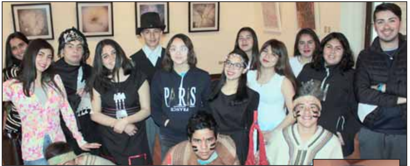
ACTORES LOCALES. - Ellos son los actores infantiles y juveniles del Taller de Teatro de la Escuela José Bernardo Suárez, de El Asiento.