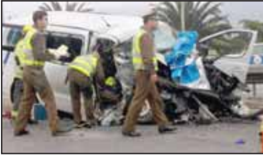
Destruído quedó el furgón

Nuevamente la Ruta 5 Norte se tiñe de rojo