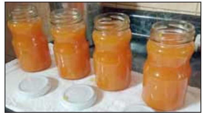
DULCE EMPRENDIMIENTO.- Estas son las ricas mermeladas que prepara este joven sanfelipeño, mientras termina sus estudios en Cocina Internacional en Inacap Santiago.