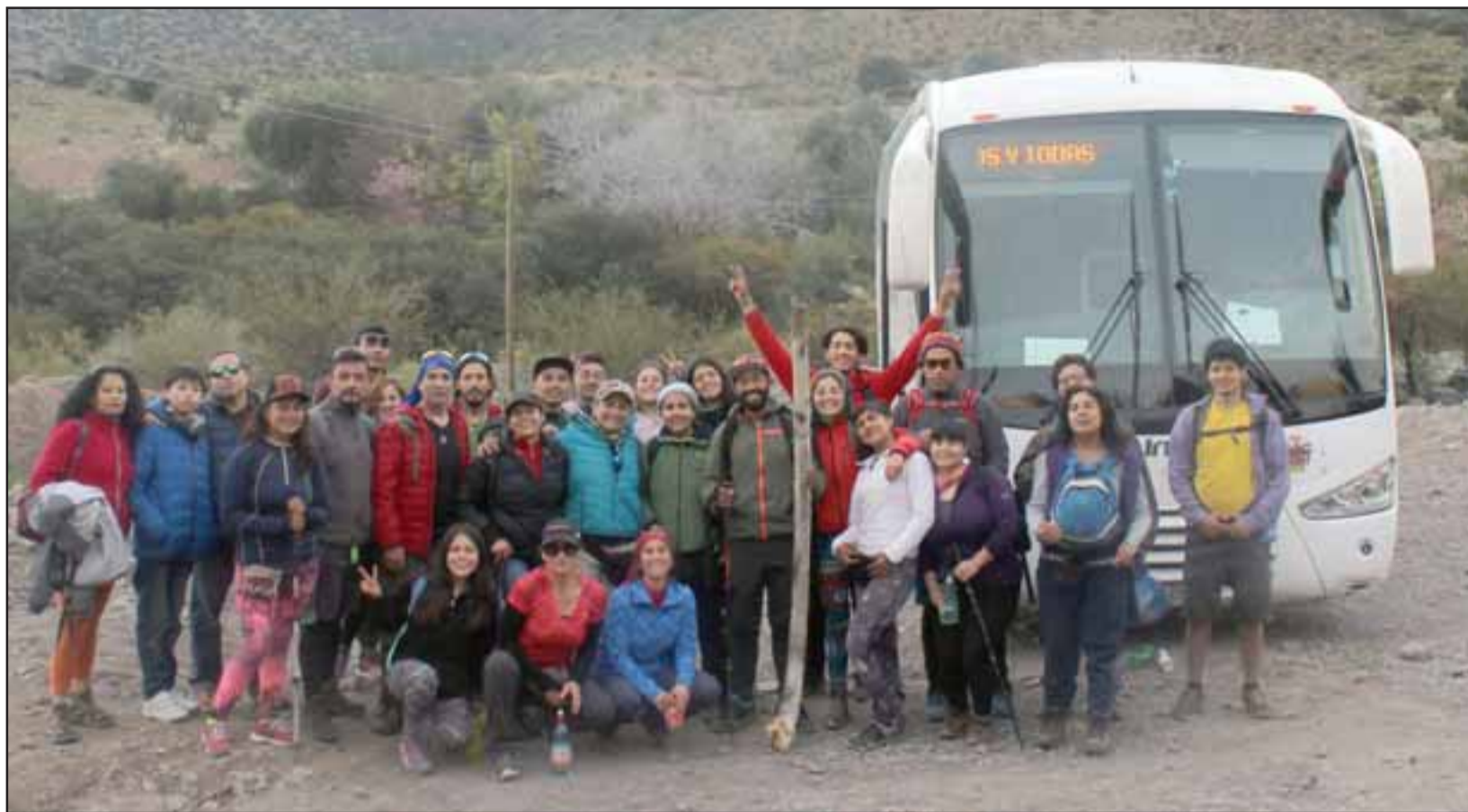
TODO GRATIS.- El Municipio de San Felipe pone el autobús para el traslado completo de los amantes al treking.

Según explicó este experto de Cordada Newén, todos los meses se desarrolla una Salida Cultural a distintas partes del Valle de Aconcagua, «por ejemplo este sábado 23, después de las Fiestas Patrias, tendremos otra Salida, esta vez subiremos a Laguna El Copín, saldremos a las 9:00 horas en el bus municipal, desde el frontis del municipio. Cada participante debe llevar al menos dos litros de