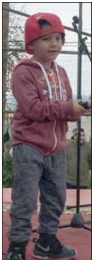
TALENTO INFANTIL. - Este jovencito hizo de las suyas en el escenario, el público le aplaudió a más no poder.

Hace pocos días se realizó en la multicancha de Población La Escudra, la gala artística de música urbana Mc Boys 2017 , actividad que organizó el programa Quiero mi barrio, con el objetivo de mostrar los resultados del proyecto que postuló la junta de vecinos Villa Argelia al fondo Injuv denominado 'Villa Argelia, música y jóvenes presentes' .