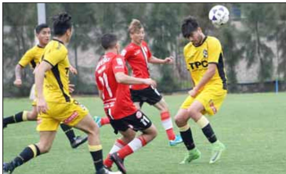
En la antesala a las festividades patrias, las canteras del Uní Uní deberán enfrentarse a Deportes La Serena y San Marcos.

U17; 12:15 horas: Unión San Felipe – San Marcos.