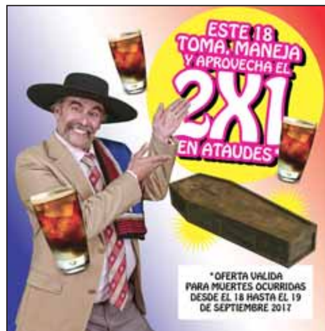
Esta es una de las imágenes de la campaña que a través del modelo conductista de psicología inversa, busca que las personas hagan totalmente lo opuesto, es decir no conducir si van a beber alcohol.

Se trata de 'Matta y Matta Funerarias', una empresa ficticia que ofrece excelentes ofertas dieciocheras para quienes van a tomar y luego manejar.