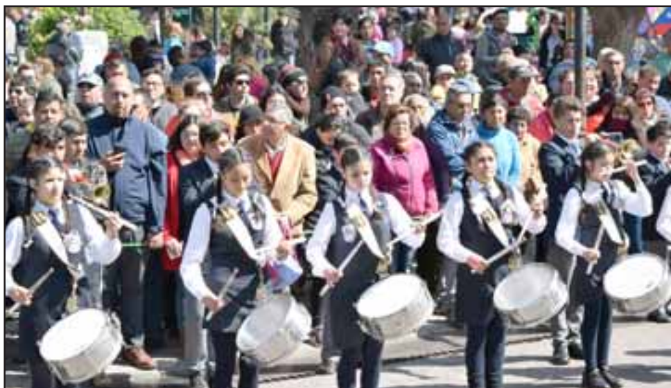
TALENTO JUVENIL.- La Banda Estudiantil de Putaendo hizo de las suyas frente a las autoridades, pues todo se movió a su ritmo.