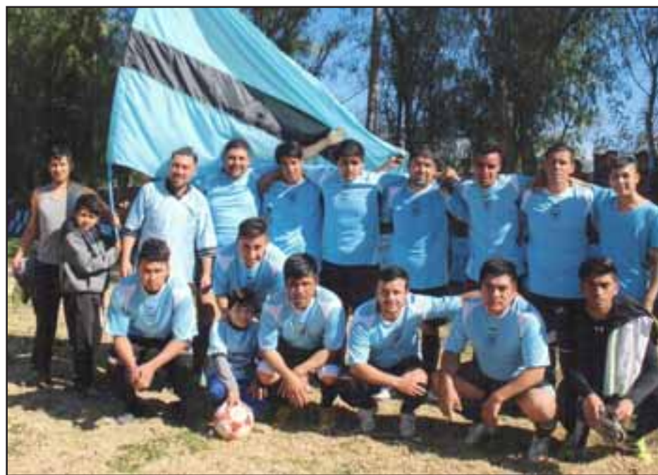
Las series Tercera y Sénior colaboraron con importantes puntos para que el O'Higgins se convirtiera en el monarca del balompié aficionado de Putaendo.