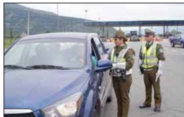
Los controles vehiculares se intensificarán en distintos puntos de la provincia de San Felipe, especialmente en ruta 60 CH y Ruta 5 Norte.

Para quienes abandonen sus hogares durante este largo fin de semana, los propietarios deberán intercambiar números de telé-