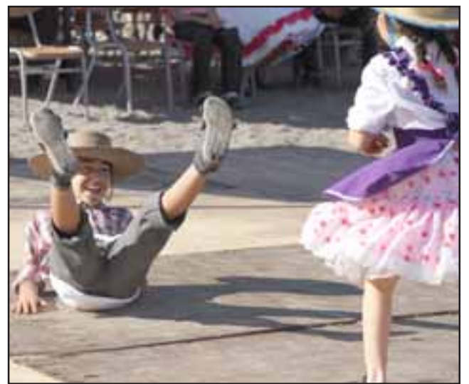
Las Fiestas Patrias se viven en Putaendo, con alegría, diversión y un largo programa de actividades típicas chilenas.

El domingo 17 de septiembre, es la inauguración de la Fonda y Rodeo Oficial de Sahondé . La destacada fiesta huasa, contará con juegos criollos, carreras a la chilena, música y comida típica en el Parque del Huaso de Sahondé. Comenzará a las 12:00hrs y estará hasta el 19 de septiembre.