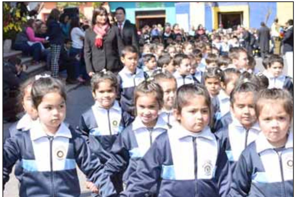
NUESTROS NIÑOS.- Estas es la cara de la Niñez putaendina que marcha a paso firme hacia el Futuro, niños llenos de ilusiones y trabajando por sus metas.