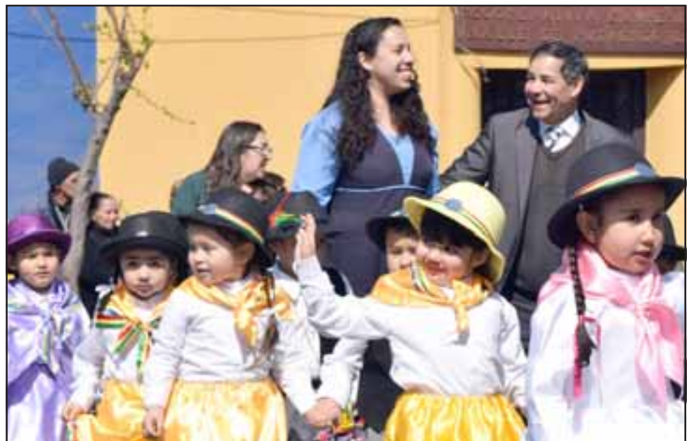
REGALONAS.- La Prebásica del Liceo Marín Fritis también ofreció una gran sonrisa a los presentes.