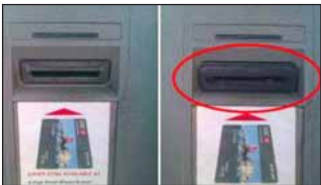
Un cajero automático en donde el skimmer (derecha) apenas se puede distinguir.

de aparece la fecha y la hora, si después se realiza otra transacción, ahí ya te das cuenta que el dispositivo pudo estar intervenido", aclaró el policía.