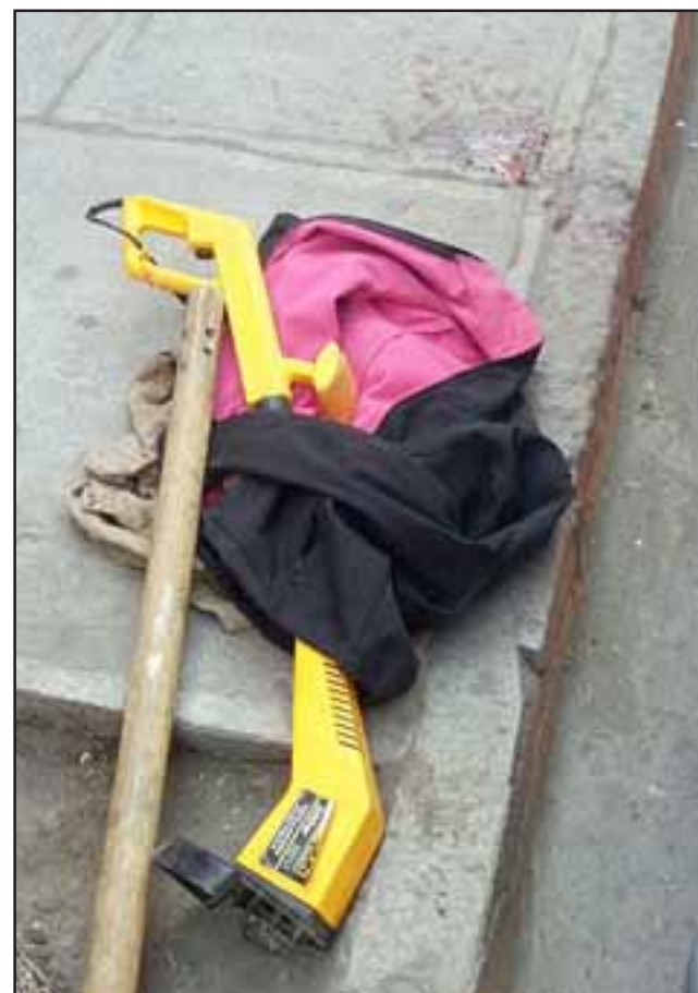
En el sitio del suceso se ven las huellas de sangre que perdió la víctima de 73 años de edad, como también parte de la pala que mantendría la atacante.

No obstante hasta el lugar y después de mucho esperar concurrió personal de Carabineros, quienes adoptaron la denuncia por agre-