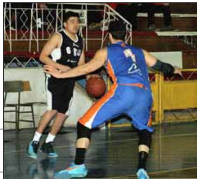
El Prat jugará en la Segunda División de la Liga Nacional de Básquetbol.

El torneo tiene agenda a partir el 14 de octubre y en su primera parte se jugará de manera grupal, para después pasar a la respectiva postemporada.