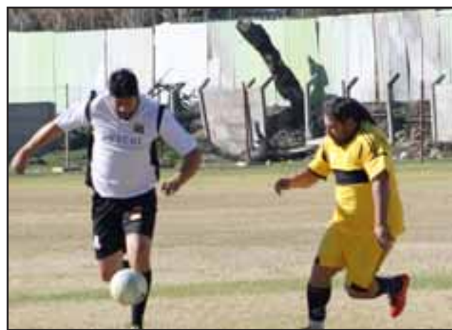
El fútbol amateur sanfelipeño entrará en un receso durante este fin de semana.

Es claro que este fin de semana la gran mayoría de los chilenos estarán celebrando un nuevo cumpleaños de Chile, y el balompié local no está ajeno a tan importante fecha. Ante eso los torneos de la Liga Deportiva San Felipe de Aconcagua (Lidesafa), Liga Vecinal y Asociación de Fútbol Amateur de San Felipe, harán una para momentánea para volver con todo y todos la próxima semana.