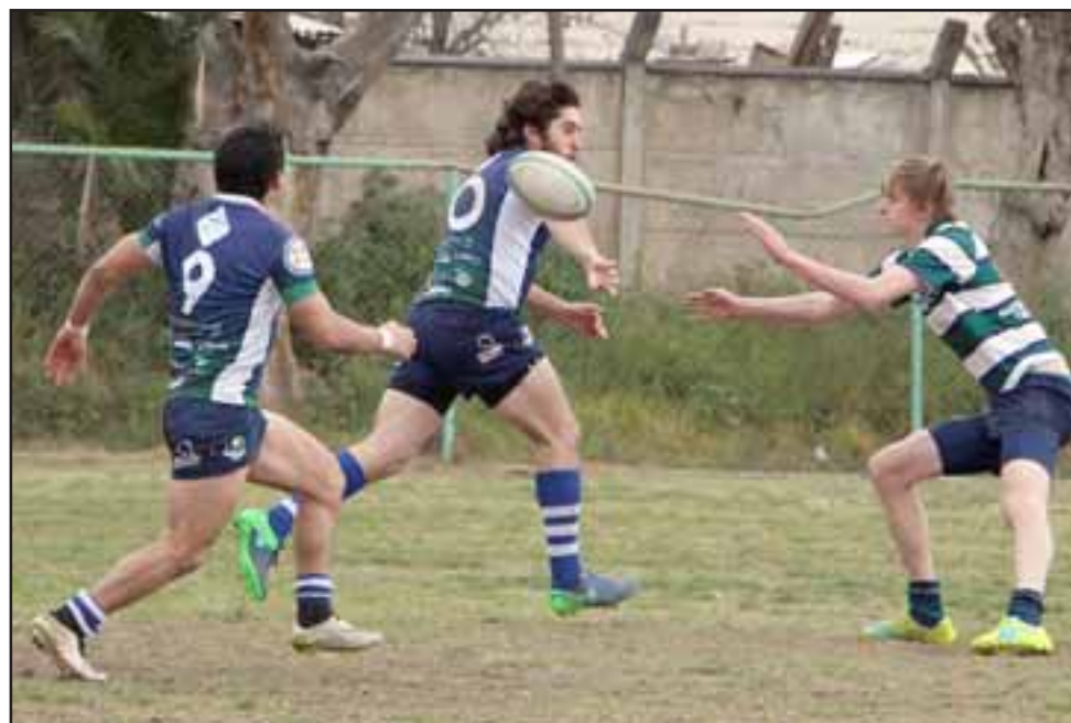
El equipo de rugby aconcagüino domina y se impone en la Copa de Oro de Arusa.