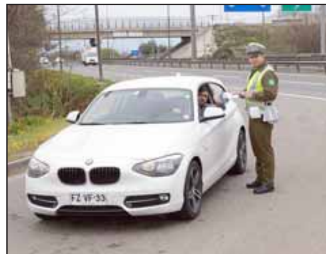
El objetivo de Carabineros es evitar la ocurrencia de accidentes de tránsito durante las celebraciones de Fiestas Patrias.