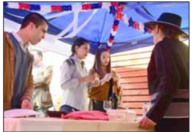
La 'ingrata' tarea de definir las mejores empanadas recayó en tres profesionales llayllaínos ligados al mundo gastronómico.

Patrias anticipadas, con estas comidas tan típicas y quiero agradecer además el apoyo de los concejales en estas actividades, en definitiva entregar un saludo de Fiestas Patrias a todos y cada uno de los vecinos y vecinas de Llay Llay, que tengan un feliz 18 de septiembre", concluyó la máxima autoridad local.