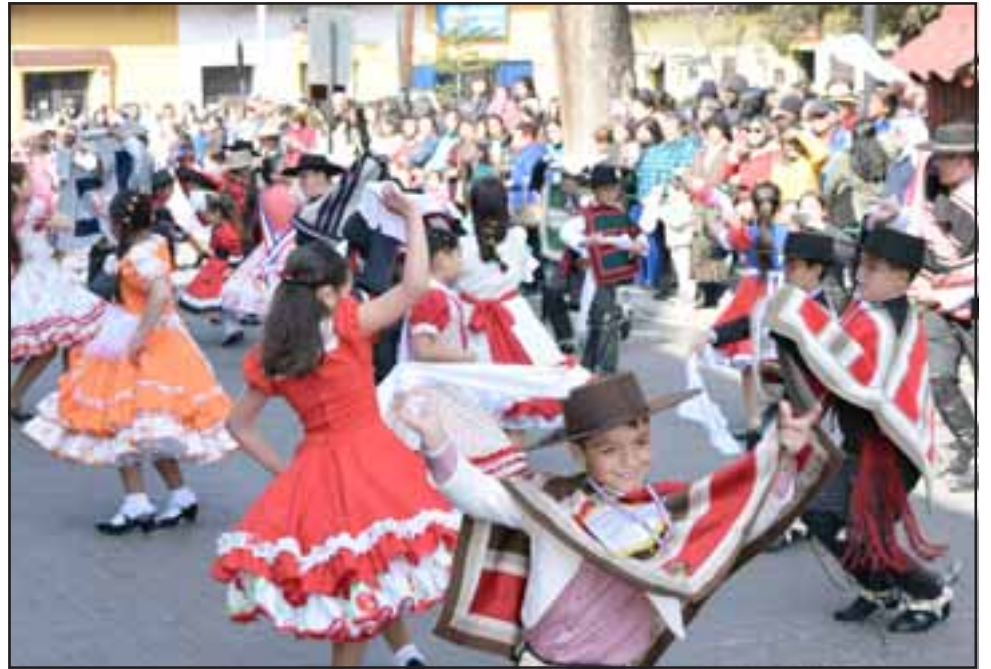
PUTAENDO ES FOLKLORE.- Como nunca antes en Putaendo, las Fuerzas Vivas se tomaron la ciudad para gritar al mundo su amor por su país.

Una conocida familia del sector también hizo de las suyas, pues en la parte final de la actividad ofreció un rico asado a los presentes y autoridades, aplausos por montones; los papás de los niños como locos por tomarles fotos desfilando y los fotógrafos también haciendo su trabajo. Orden, bailes,