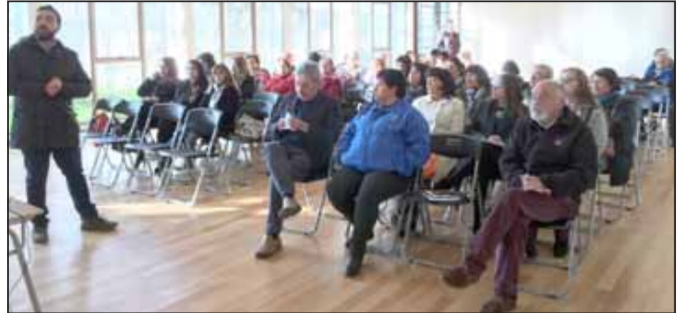
Una destacada participación tuvo la jornada de Presupuestos Participativos 2017.

Se cumplen así 10 años en los que representantes de la sociedad organizada ejercen su derecho a decidir el destino de recursos de salud.