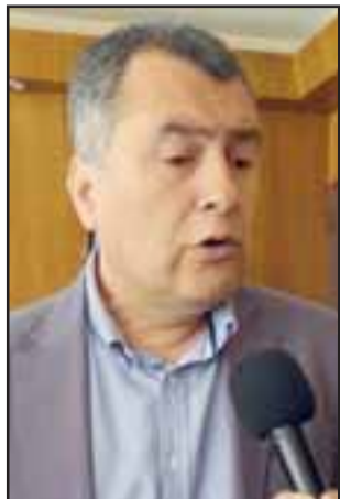
Eduardo León, Gobernador de la Provincia de San Felipe.

El Prefecto de Carabineros en Aconcagua, Coronel Pablo Salgado, informó que durante las cinco noches del fin de semana de celebración de fiestas patrias, se registró un saldo de 25 denuncias por violencia intrafamiliar, situación que marca un aumento ostensible respecto de las sólo seis denuncias efectuadas durante las cuatro jornadas ferias del mismo período en 2016.