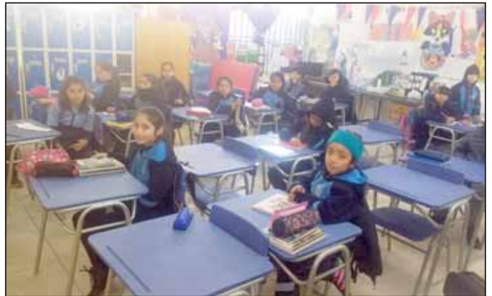
Los pequeños alumnos cuentan con nuevos muebles, lo que de por sí es una mejora en la calidad de la educación que están recibiendo.

Así, en esta escuela, como en otras de la comuna de San Felipe, se apostó por aprovechar los recursos del Fondo de Apoyo a la Educación Pública (Daep) y en una rápida gestión de la Daem, sumado a un trámite de compra que demoró cerca de dos meses, se logró la adquisición de mobiliario, ajustado a cada edad, de color azul y que por cierto