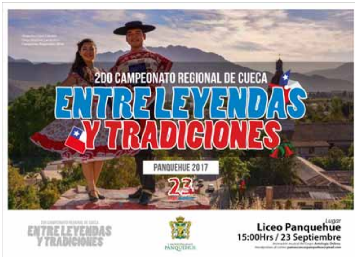
Este es el afiche promocional del certamen regional de cueca que se realizará este sábado en Panquehue.