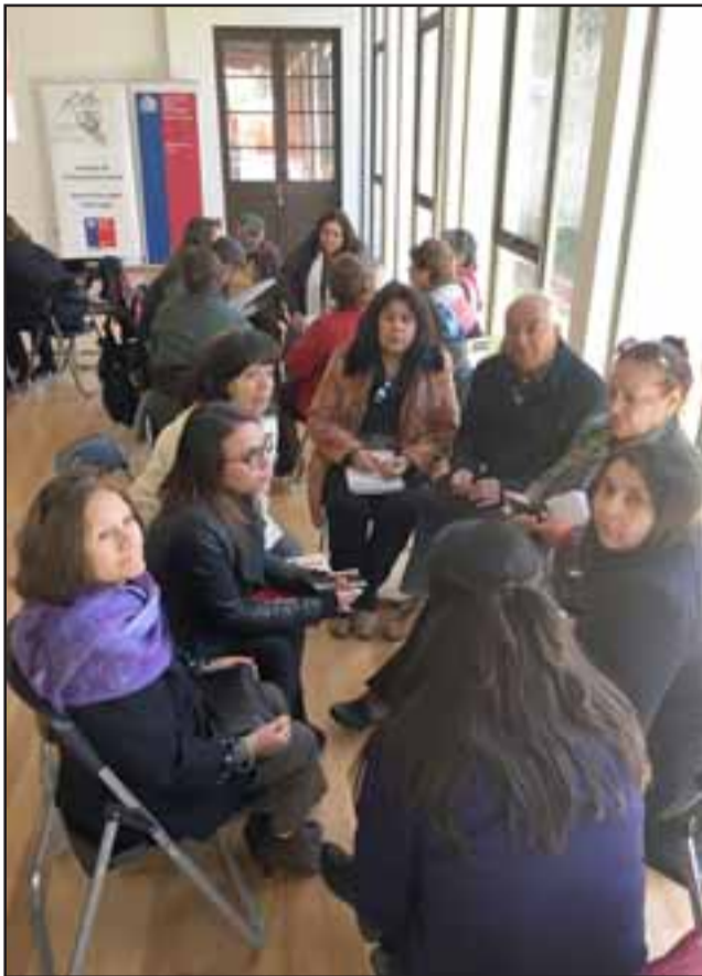
Los diferentes actores sociales trabajaron para definir los proyectos que postularán a financiamiento.

Con una destacada participación de representantes de la comunidad, como así también de los diferentes establecimientos que integran la red del Servicio de Salud Aconcagua, se realizó la jornada de trabajo con la cual se oficializó el lanzamiento de los Presupuestos Participativos 2017.