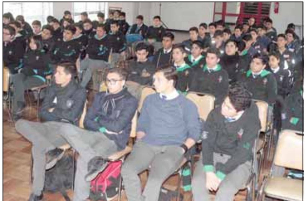
Por medio del convenio de cooperación los estudiantes han recibido charlas sobre diversos temas de minería y también han conocido las instalaciones de la empresa.