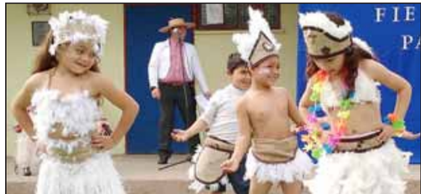
BAILES PASCUENSES. - Estos pequeñitos participaron bailando este baile típico de Isla de Pascua.