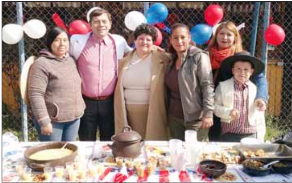
COMIDAS TÍPICAS. - Profesores y apoderados prepararon los más ricos bocadillos para el disfrute de toda la comunidad escolar.