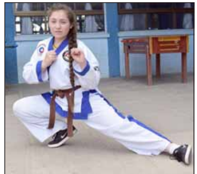
LA HORA DE LA VERDAD.- Aquí tenemos a Hillary calentando motores para este gran compromiso internacional.