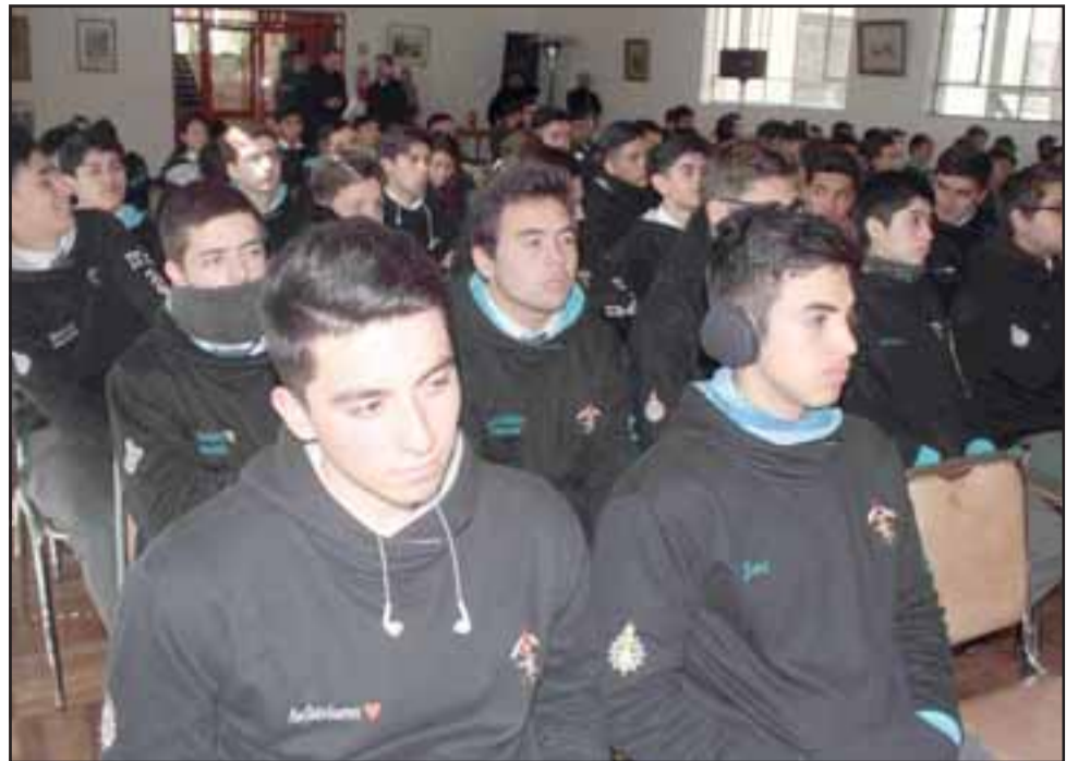
Más de cincuenta alumnos participaron de la charla que los acercó al manejo responsable de residuos y al marco legal vigente sobre esta materia.

La actividad se realizó en el marco del programa educativo Andina más Cerca, el cual busca aportar a la formación académica de los estudiantes. En este caso, el establecimiento educacional firmó un convenio de cooperación con Codelco Andina, el cual contempla charlas y visitas a las instalaciones de la empresa que son guiadas por profesionales y trabajadores voluntarios.