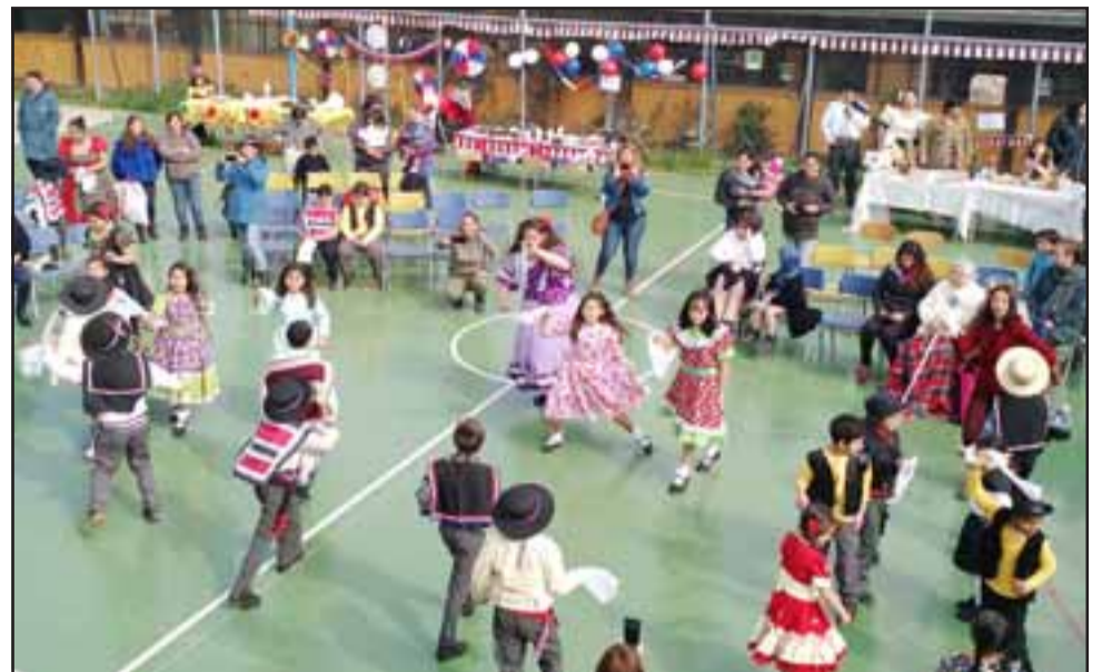
FIESTA ESCOLAR. - Familias enteras disfrutaron de esta actividad escolar, en la que destacaron las comidas y bailes típicos.