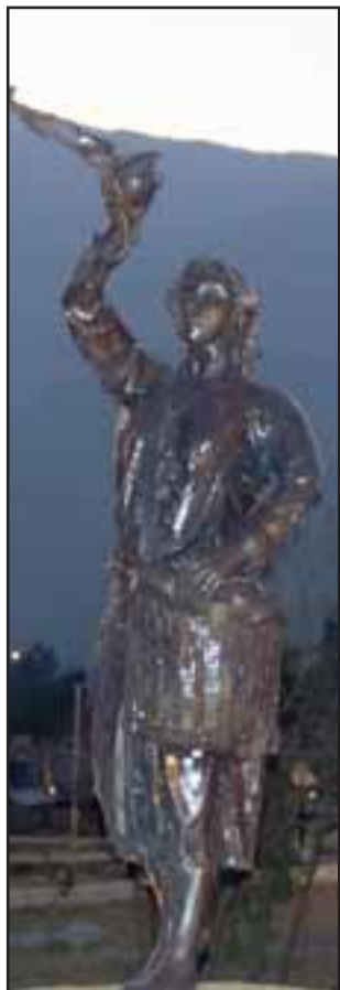
En el Parque Puente Cimbra quedó ubicada la estatua de la mujer temporera, una obra de gran valor no solo artístico, sino también simbólico.

Con la presencia de la Ministra del Trabajo, Alejandra Krauss, el municipio encabezado por el Alcalde Guillermo Reyes presentó al público un monumento que busca inmortalizar el legado de miles de mujeres campesinas de la comuna y Aconcagua.