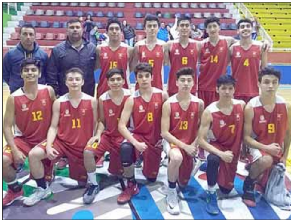
El seleccionado de San Felipe no tendrá descanso en el Nacional U17 de Punta Arenas.

Tras este compromiso y de acuerdo a los resultados previos se sabrá la posición final del team juvenil que tendrá la responsabilidad de representar a la quinta región en la cita máxima de los cestos en la categoría menor de 17 años.