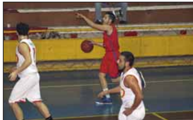
Cuatro son los partidos programados para este fin de semana en la Copa Juan Arancibia .

17:30 horas: Árabe – Amigos del Básquetbol 19:00 horas: Prat – Ibañ