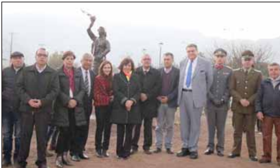
Autoridades presentes en la inauguración del monumento de tres metros de altura que rinde homenaje a la mujer temporera.

“Estoy feliz de compartir con la gente de Putaendo, porque para la presidenta Michelle Bachelet las