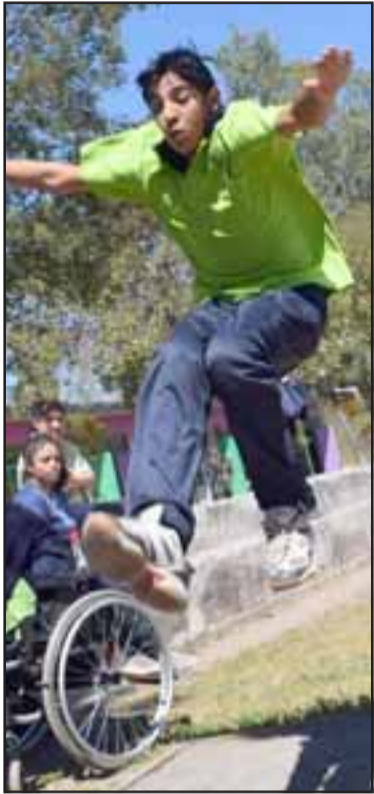
LA HORA DE LA VERDAD. - Este chico no salta, vuela por los aires cuando de competir se trata.

Mucho es lo que en todos los medios del Valle de Aconcagua se ha dicho sobre los categóricos Juegos Deportivos Escolares, lo que es muy bueno, sin embargo