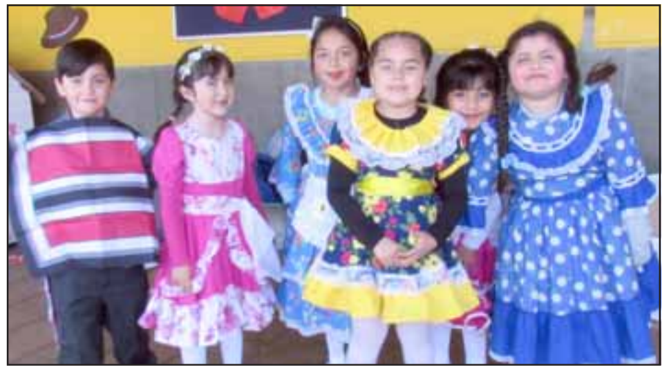
Estas pequeñitas fueron las más regalonas de la fiesta, pues bailaron con gran elegancia nuestro baile nacional.