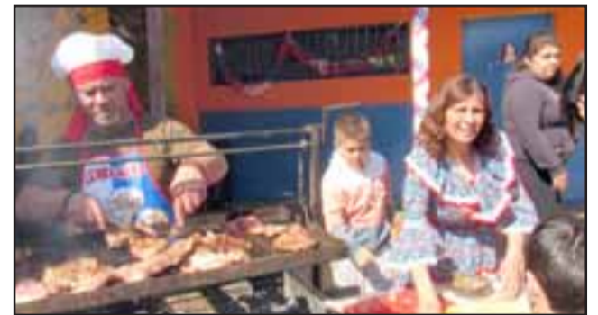
ASADO PARA TODOS.- El asado principal fue degustado por los presentes con alegría, aquí vemos al faenador de la jornada.

fotos de esta actividad, misma en la que hubo ricas comidas típicas, cuecas, muestras gastronómicas de distintas partes del país y mucha gente feliz con la actividad.