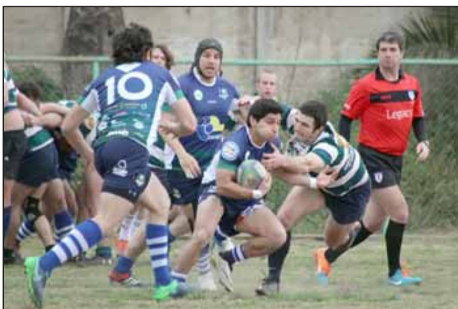
Los Halcones de Calle Larga son sólidos líderes de la Copa de Oro.