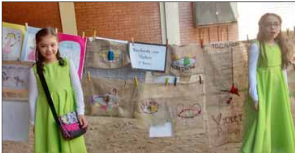
Estas niñas de 3° Básico también fueron creativas, creando estas arpilleras tan hermosas.

cieron diario-murales, dibujaron, pintaron y bordaron a la Violeta. Del escenario colgaban réplicas de las obras de arpillera 'Contra la guerra', que la cantautora, pintora, escultora, bordadora y ceramista chilena hiciera en 1962, junto a ello se leía: Chile saluda a Violeta Parra .