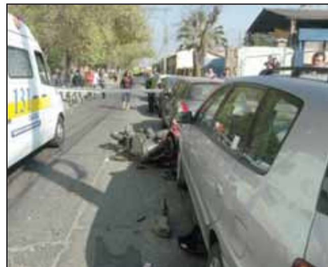
El fatal accidente ocurrió en la avenida Chacabuco de San Felipe, falleciendo un niño de 7 años de edad.