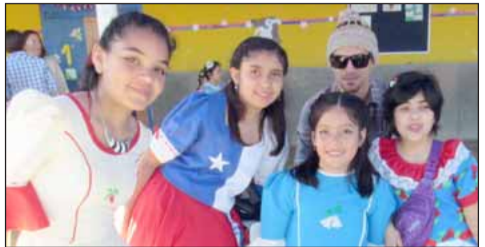
FIESTAS PATRIAS.- Trajes típicos, comidas y bailes a más no poder, todo esto en la Escuela Artística República Argentina, de El Tambo.