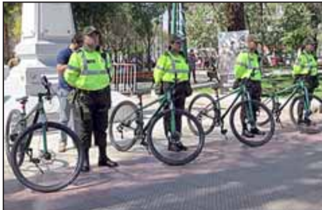
Las bicicletas fueron adquiridas por la Municipalidad con el apoyo de empresas privadas y traspasadas en comodato a Carabineros.

Finalmente, el Prefecto de Carabineros de Aconcagua, Coronel Pablo Salgado, comentó que con estos vehículos Carabineros puede patrullar de manera silenciosa el centro de la ciudad y acceder más rápidamente al lugar donde se esté cometiendo un delito, a diferencia del Retén Móvil que está estacionado en un solo lugar o las motos que tienen también dificultades para desplazarse, debiendo hacerlo solo por las calles. Añadió que la presencia de estos Carabineros en bicicleta también servirá como un elemento disuasivo.