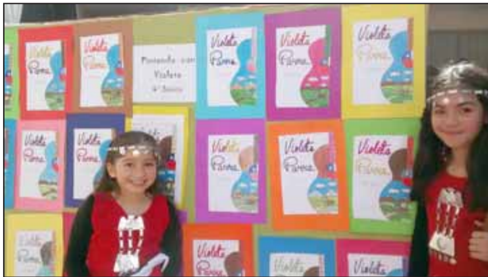
Aquí tenemos a estas pequeñitas de 4° Básico, presentando a los lectores de Diario El Trabajo sus artesanías en honor a Violeta Parra.

El espectáculo contempló desde obras de teatro, cantos de la artista, bailes de sus canciones y una clase magistral sobre Parra. Un recorrido por su vida a través de la obra dramática. El encanto de las pequeñas