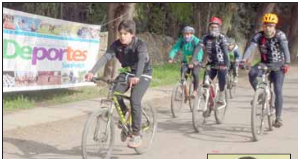
En la foto de archivo, la tercera cicletada familiar rural, organizada por el departamento de Deportes y Actividad Física municipal y la Mesa de Promoción de la Salud, realizada el domingo 27 de agosto en Bellavista.

El martes, el Estadio Municipal de San Felipe será escenario de un partido internacional, pues des-