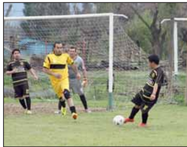
Luego del receso por las festividades patrias, este fin de semana volverán las competencias en las distintas ligas de fútbol aficionado en San Felipe.

20 de Octubre – Fénix; Deportivo GL – Los del Valle; Bancarios – Casanet; Derby 2000 – 3º de Línea; Estrella Verde – Grupo de Futbolistas; Libre: Magisterio