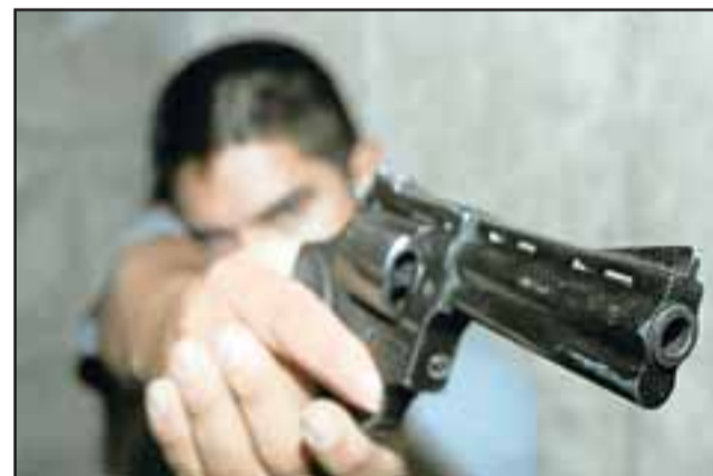
Los sujetos intimidaron con un arma de fuego al bombero del Servicentro Copec de la comuna de Catemu la tarde de este sábado, apoderándose de un total de $200.000 en efectivo. (Foto Referencial).

Al respecto el Teniente de Carabineros de San Felipe, César Bustamante, precisó a Diario El Trabajo que «la Sección de Investigación Policial SIP analizó las grabaciones de las cámaras de seguridad del servicentro con el fin de lograr algún antecedente, pero hasta el momento no tenemos identidades, se presume que estos indivi-