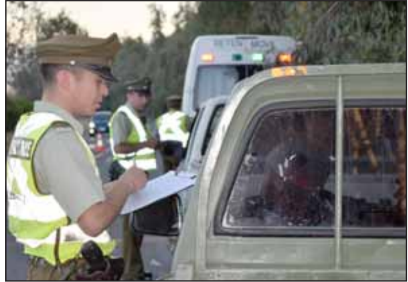
BIEN PORTADITOS.- Los oficiales de Carabineros hicieron su pega en carretera, pero esta vez los conductores fueron muy responsables a la hora de conducir.

Entre las acciones puntuales que los oficiales de Carabineros desarrollaron estuvieron los controles en la identidad y documentación de conductores, examen de Intoxilyzer, dispositivo que tampoco detectó a conductores manejando en estado de ebriedad. Al final de la jornada: Cero ebrios, cero detenidos, cero infracciones y multas.