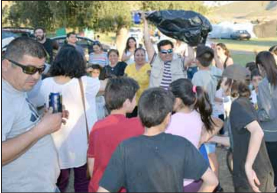
FIESTAS MASIVAS.- La fiesta se armó al aire libre, hasta rifas de pierna de vacuno hubo como premios.

El Trabajo captaron tanto las actividades a campo abierto, como también los operativos policiales en carretera, no reportándose por parte de Carabineros irregularidades que alteraran el orden público vial.