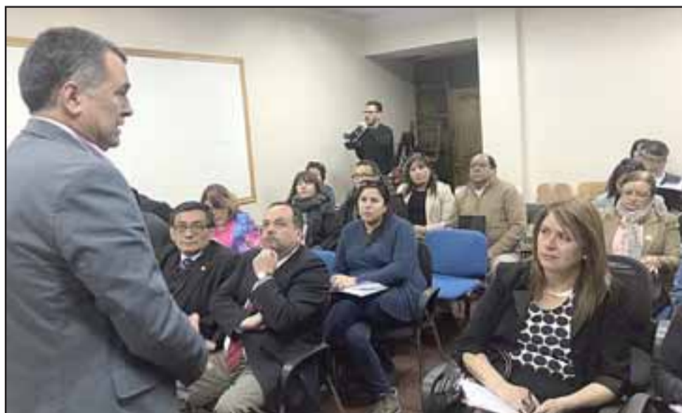
Directores de escuelas de nuestra provincia atendieron con diligencia este llamado para desarrollar este plan.