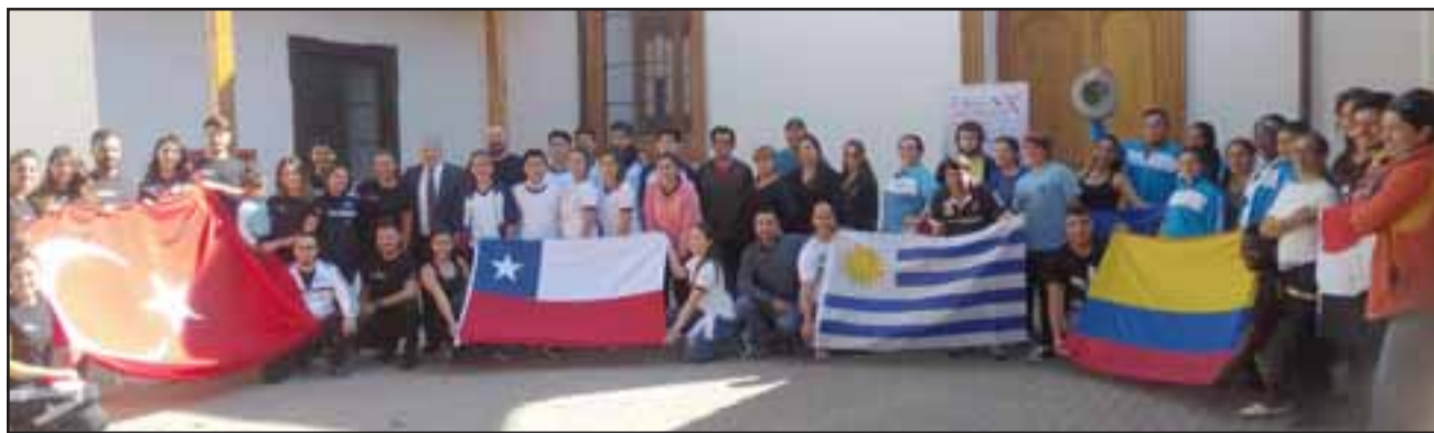
Nueve países participan en el X Encuentro Internacional de Folclore de San Felipe.

El evento considera itinerancias con diversas propuestas escénicas, musica-