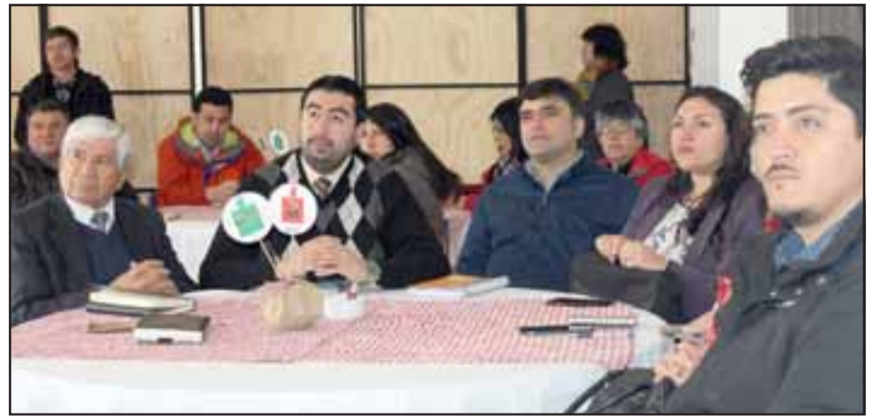
Séptima reunión de sostenedores permitió a la Dirección de Educación Municipal de San Felipe dar a conocer su modelo de gestión técnico-pedagógico.