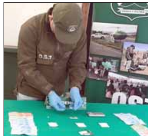
Todo partió en un control vehicular en el sector del peaje Las Vegas, en donde el residente en el inmueble transportaba coca y LSD.

De esta manera, la diligencia permitió la incautación total de 20,1 gramos de clorhidrato de cocaína; 22 dosis de LSD; 01 dosis de «éxtasis», 3,5 gramos de marihuana elaborada, además de dinero efectivo, 1 pesa digital y 1 automóvil marca Toyota, modelo Tercel de color rojo, el que no contaba con la documenta-