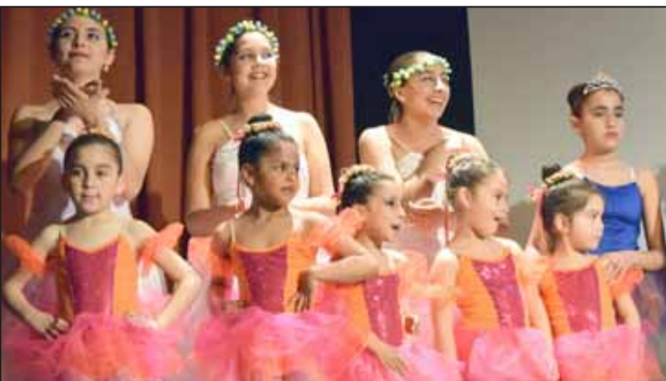
LINDAS PROMESAS. - Ellas son las más pequeñas del Taller, vivas promesas artísticas que ya brillan como hábiles bailarinas.