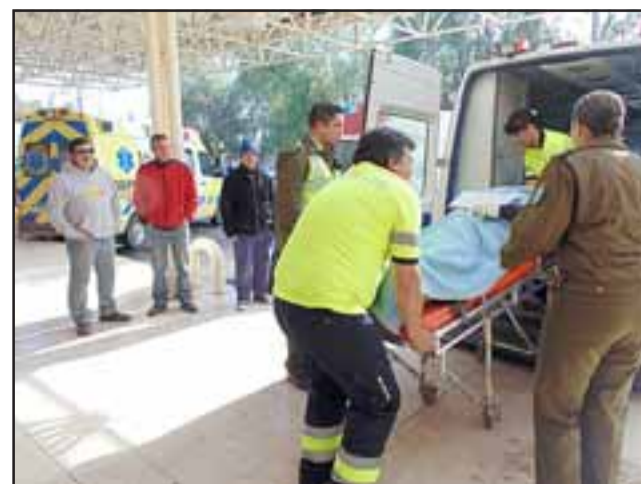
El lesionado fue derivado en ambulancia hasta el Servicio de Urgencias del Hospital San Camilo de San Felipe. (Foto Referencial).

Hasta el cierre de esta edición la detención del im-