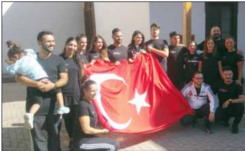
La delegación de Turquía destaca dentro de los países participantes.