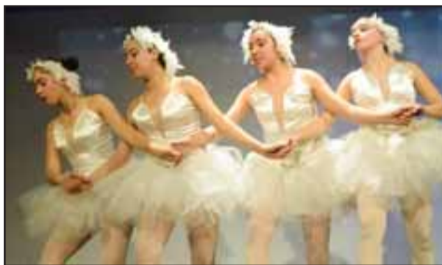
SAN FELIPE TIENE TALENTO. - Las más grandes hicieron de las suyas ante el público, pues su dominio escénico fue de lo mejor.