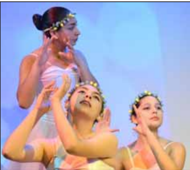
BELLEZA Y TALENTO. - Así ejecutaron cada uno de sus movimientos estas bellas damitas, sólidamente y con gran alegría.