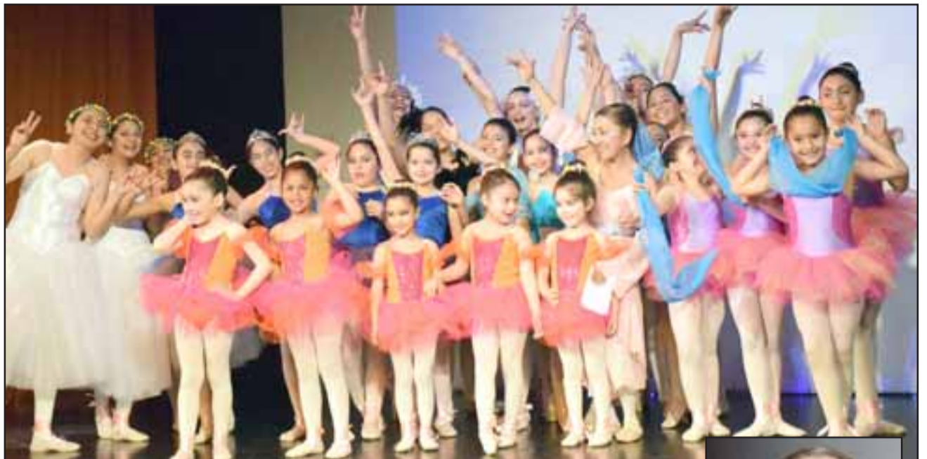
SIEMPRE NIÑAS. - Aquí tenemos el cierre final de la jornada artística, las niñas del Taller Experimental de Ballet Clásico posaron junto a su profesora para las cámaras de Diario El Trabajo .

- Tengo varios grupos nuevos, las más chiquititas llevan ya entre cuatro a cinco meses, y otras más grandes que llevan ya tres años, mientras que algunas en el elenco tienen ya entre cinco a seis años, en total son 30 chicas las que componen