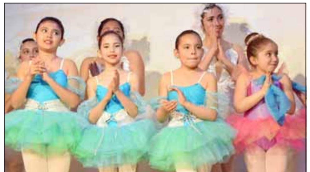
EN CRECIMIENTO. - Aquí tenemos a las más grandecitas, también talentosas niñas que van creciendo como personas y artistas locales.