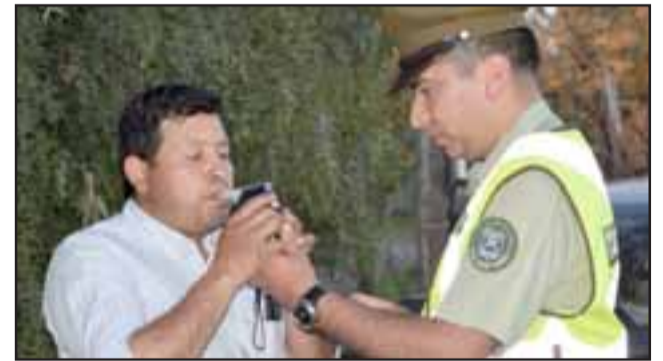
ALCOTEST.- Las cámaras de Diario El Trabajo tomaron registro del accionar policial este fin de semana en La Higuera.