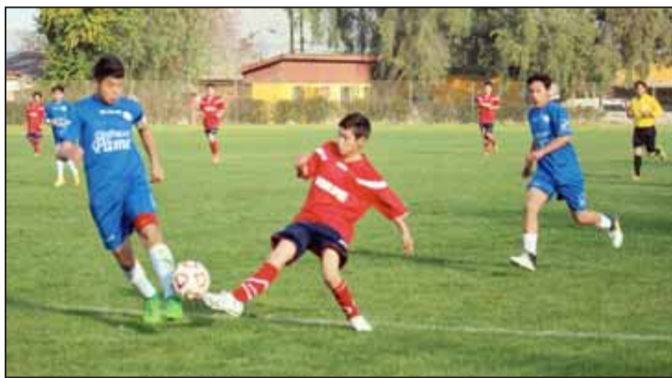
El sábado se jugaron los partidos de ida correspondiente a la segunda fase de los Regionales U13 y U15.

El sábado pasado en diversas canchas de toda la Quinta Región, largó la segunda fase de los campeonatos Regionales de fútbol en las categorías U13 y U15, certámenes en los cuales el Valle de Aconcagua tiene mucho que decir debido a que ha sido dominador durante los últimos años.