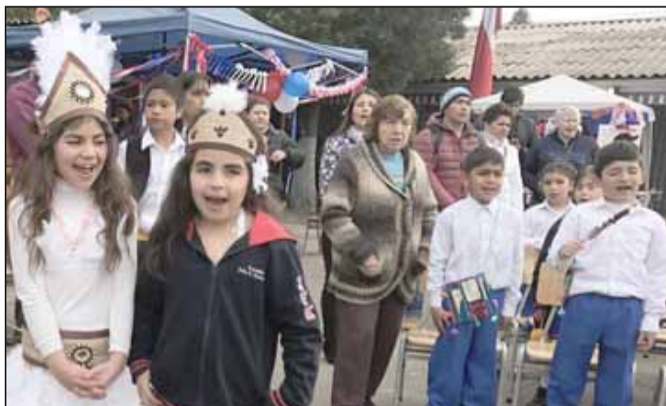
Los niños de la Escuela JFK disfrutaron de un día muy especial en esta Fiesta de la Chilenidad.

«Tuvimos la tremenda noticia que nos llegó todo el mobiliario nuevo, tenemos recambio de todo el mobiliario, de primer nivel, por Fondos FAEP con un aporte de siete millones, así que estamos felices. Acá todos estamos trabajando muy contentos en bien de que la escuela vaya mejorando en todo el sentido de la palabra», dijo la directora.