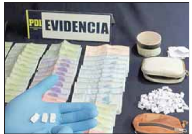
La Briancó incautó un plato con pasta base a granel y 56 envoltorios de la misma droga listos para su venta. También fueron incautados 82.000 pesos en billetes de baja denominación, los que se presume son ganancias por la venta de estas sustancias ilícitas.

de la Briancó procedieron a allanar la casa, encontrando bajo la cama de uno de los dormitorios un plato conteniendo pasta base a granel y 56 envoltorios de la misma droga listos para su venta. También fueron incautados 82.000 pesos en billetes de baja denominación, los que se presume son ganancias por la venta de estas sustancias ilícitas.