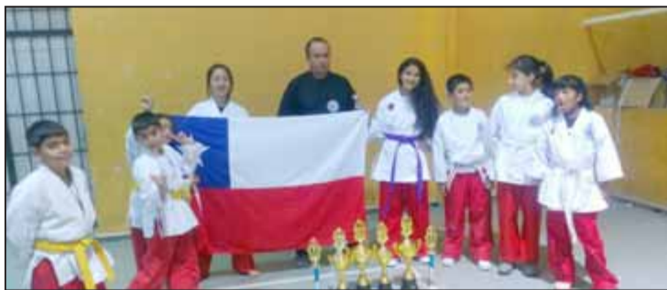
Con la bandera de Chile, parte de los 15 alumnos que viajaron hasta Mendoza, Argentina, para participar del torneo.