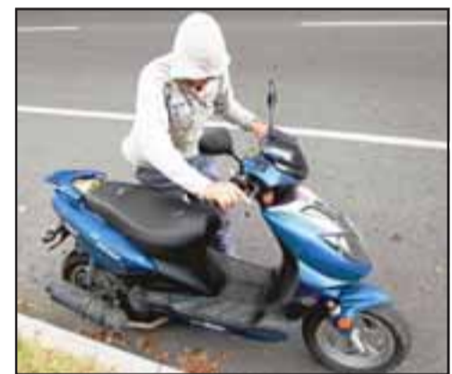
El enjuiciado deberá cumplir tres años y un día de cárcel tras conducir una motocicleta robada el año 2016. (Foto Referencial).

La Fiscalía acusó estos hechos por el delito de receptación de vehículo motorizado por parte del enjuiciado, quien actualmente se encuentra cumpliendo condena por otro delito en la cárcel de San Felipe, siendo considerado culpable por la terna de jueces del Tribunal Oral.