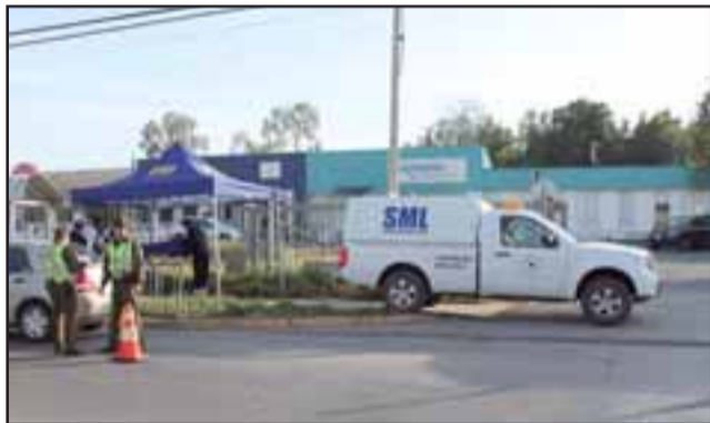
El cuerpo fue encontrado tendido en un paradero de la locomoción colectiva en Av. San Rafael, frente a las dependencias de la Fiscalía de Los Andes.

Gracias a ello se pudo establecer la identidad del occiso, quien era oriundo de la Séptima Región y desde hace dos años había llegado a la zona.