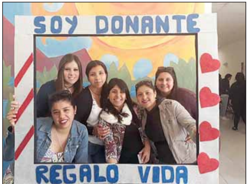
Alumnas de la Universidad de Aconcagua posan en el marco de la celebración del Día del Donante.