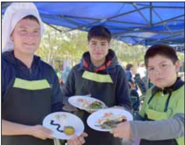
SABOR Y SALUD. - Aquí vemos lo más fresco de las frutas, y medio huevo duro, aperitivos bien preparados y muy saludables.