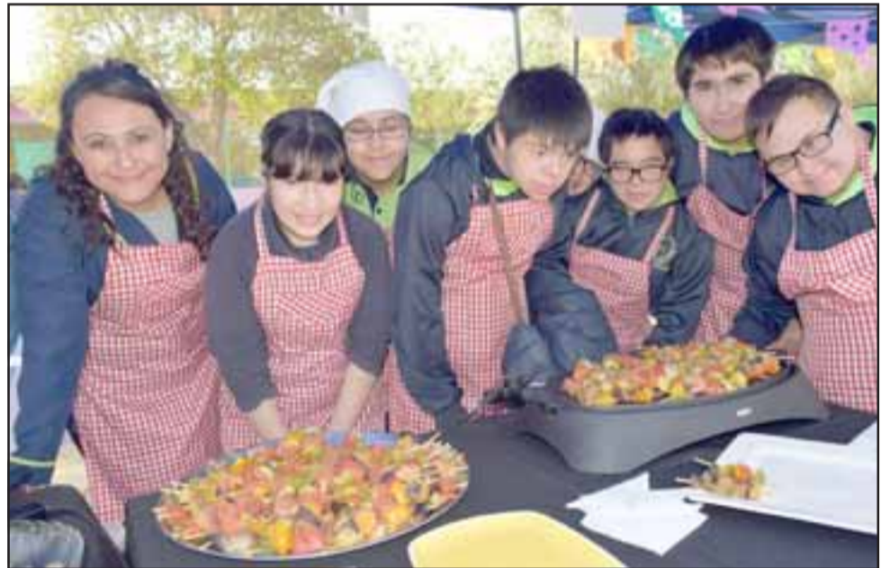
TAMBIÉN LAS COCINAN. - Así quedan finalmente las verduras cultivadas en los huertos de esta escuela sanfelipeña.