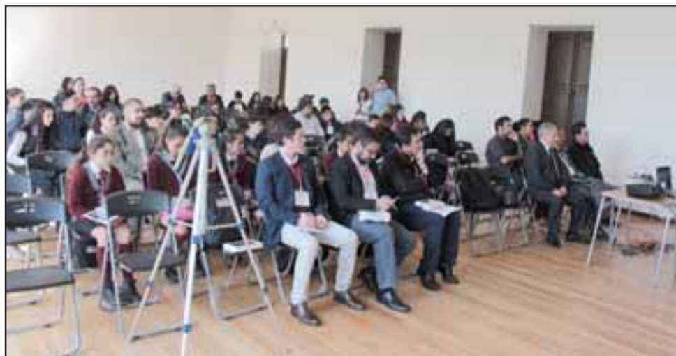
Alumnos de distintos colegios del valle participaron en el IV Congreso Provincial Escolar de Ciencia y Tecnología realizado en el Buen Pastor.