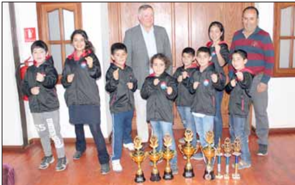
Alumnos de la escuela de Karate Pianan Panquehue llegaron con numerosos trofeos para agradecer al Alcalde de Panquehue por el apoyo recibido.

Para el alcalde de Panquehue, Luis Pradenas, está toda la disposición del municipio en apoyar a todas las disciplinas deportivas de la comuna. «Existe un claro respaldo para que los menores que juegan Básquetbol viajen hasta la ciudad de Arica, cuyo traslado en avión fue financiado por el municipio. Ahora se