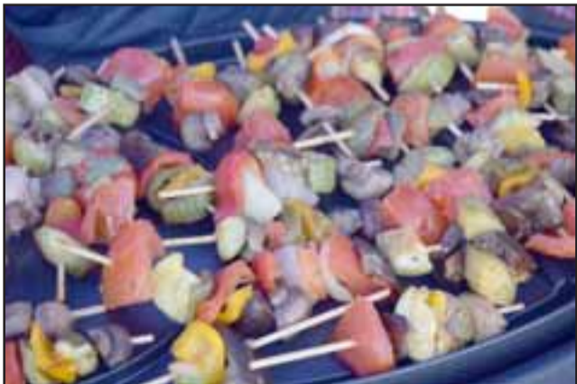
SALUDABLES BOCADILLOS. - Mil colores y ricos sabores, todo esto preparado con verduras y hortalizas cultivadas por ellos mismos.