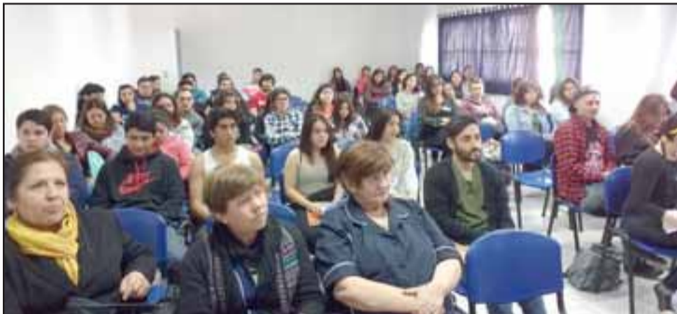
Numerosos alumnos de las diferentes carreras de la Universidad de Aconcagua, especialmente las pertenecientes a la facultad de Salud, participaron de la actividad.

de vital importancia apoyar las actividades que realizan los establecimientos de la red de salud de Aconcagua y en especial cuando son temas de altísima sensibilidad ”, destacó el Directivo.