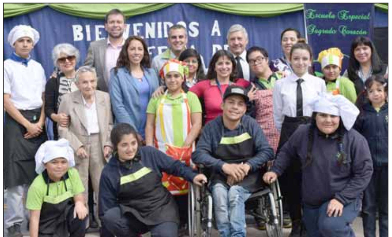
AHORA, A SEMBRAR. - Autoridades de Educación, Salud y de la misma Escuela Sagrado Corazón, posaron con estudiantes para las cámaras de Diario El Trabajo .