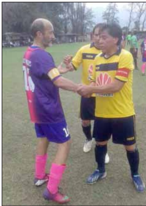
Más allá de la competencia propiamente tal, el torneo de la Liga Vecinal es un lugar de encuentro y amistad entre los jugadores de los distintos equipos.

Con ese triunfo, Los Amigos llegaron a 51 puntos; 6 más que Tsunami que está segundo en la tabla.