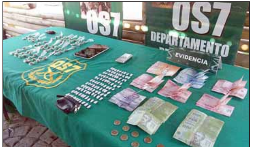
Tras el operativo ejecutado por el OS7 de Carabineros en la Villa Departamental de San Felipe, dos hermanos fueron detenidos por el delito de microtráfico de marihuana y pasta base de cocaína.

foco de microtráfico de drogas en la Villa Departamental, el cual se estaba llevando a cabo por parte de dos individuos del parentesco hermanos, los que se dedicaban a la venta de marihuana y pasta base de clorhidrato de cocaína, con estos antecedentes y las diligencias investigativas se pudo comprobar el hecho ilícito. Se logró la detención de estos dos antisociales además de la incautación de drogas con especies asociadas al delito consistente en pesas digitales y una suma de dinero en efectivo", precisó el Jefe del OS7 de Carabineros, Capitán Felipe Maureira.