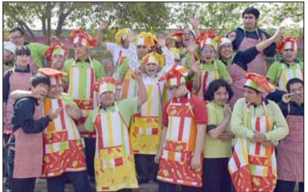
TODO LO APROVERCHAN. - Ellos son estudiantes de la Escuela Sagrado Corazón, encargados de sacarle el máximo provecho a estos huertos escolares.