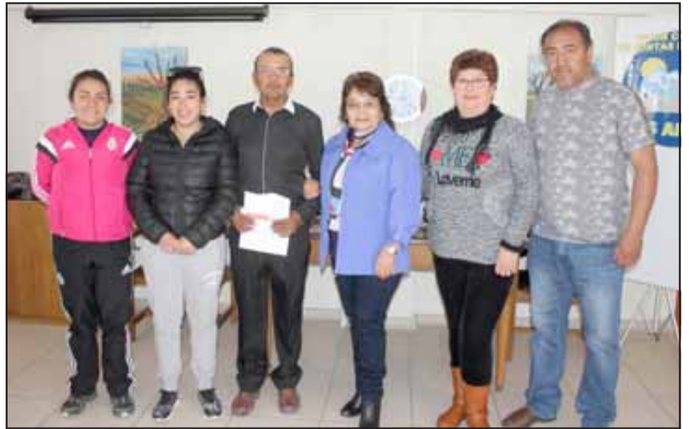
Los fondos estarán destinados a mejoras en infraestructura, sustentabilidad y emprendimiento de las 27 agrupaciones.