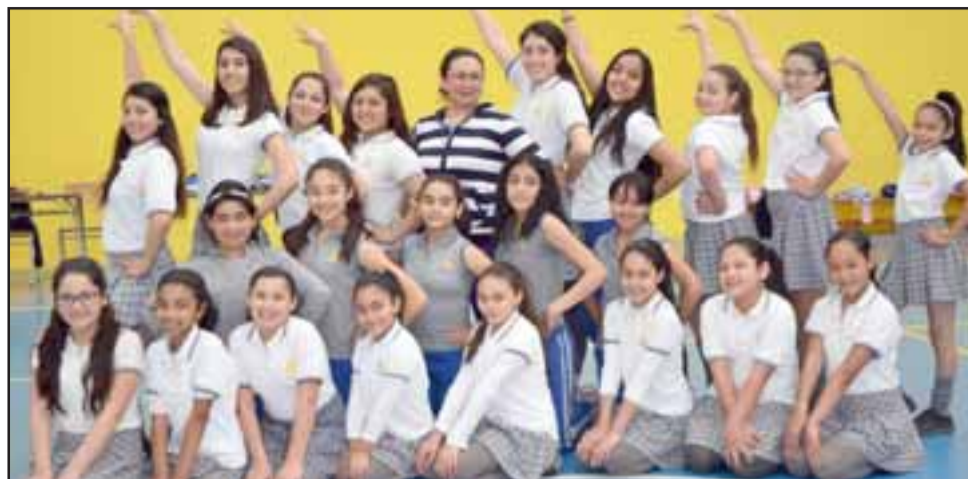
SUERTE CHIQUILLAS. - Aquí tenemos a las niñas que viajan hoy jueves a Puerto Montt, ellas serán las animadoras más alegres en esta jornada nacional de Cheer Dance.