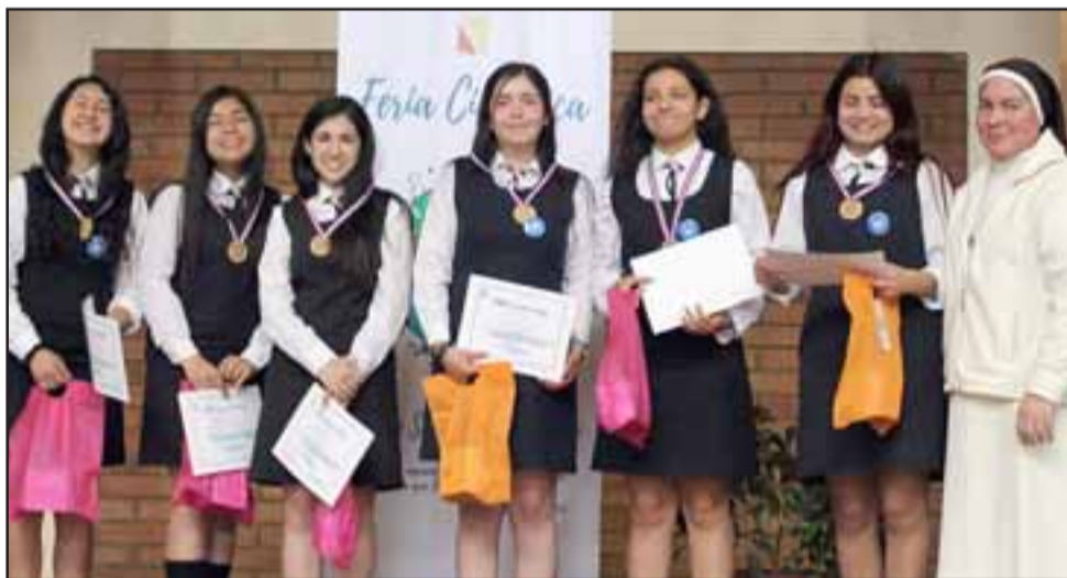
Primer Lugar en la categoría de 2° y 41 medio. Proyecto Megamenta de estudiantes de 3° medio A.