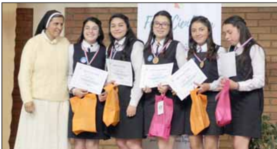
Primer Lugar en la categoría de 8° básico a 2° medio. Proyecto Giralápiz de estudiantes de 2° medio.