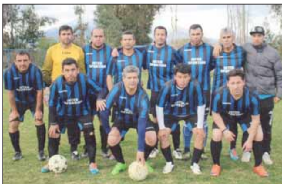
Serie Sénior del club Inter Sporting