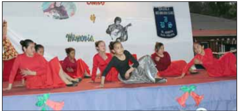
HOMENAJE A VIOLETA.- Así brillaron los alumnos de la Escuela José Bernardo Suárez, de El Asiento.

leta , instalación colectiva de flores nativas, a cargo de segundo básico; acompañaron esta muestra los trabajos de Retratos fotográficos creativos , a cargo de quinto básico y Collage surrealistas , a cargo de cuarto año básico.