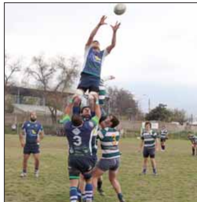
El quince de los Halcones fue claro dominador de la fase regular de la Copa de Oro de Arusa.