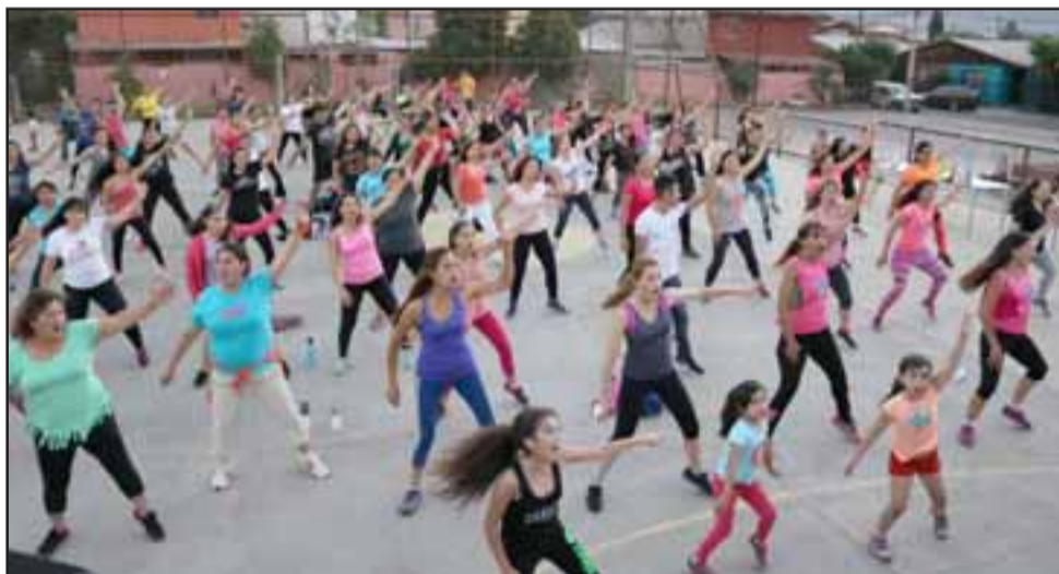
La zumba al aire libre partirá a las 10:30 horas del sábado en la esquina de Chacabuco con Maipú.

«Por supuesto los agradecimientos a nuestro Alcalde y a todo el Concejo Municipal que permiten que estos deportes y la actividad física se desarrollen no sólo los fines de semana, sino que a través de los distintos talleres deportivos que se realizan durante la semana», finalizó el coordinador de Deportes.