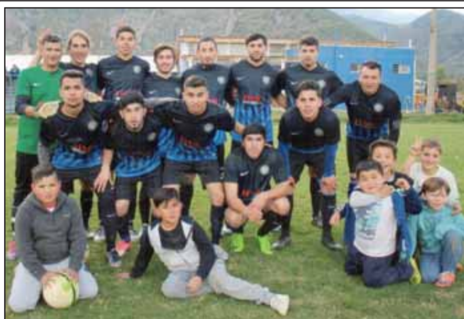
Serie de Honor del Inter Sporting