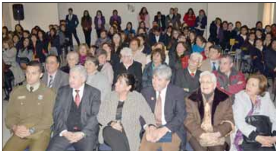
DIRECTORA SE VA.- Ayer en horas de la mañana, autoridades de Educación acompañaron a la comunidad educativa del Liceo Corina Urbina en la gala de sus 115 años de existencia.