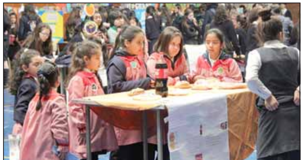
Estudiantes de segundo ciclo básico del Colegio Santa Juana de Arco, exponiendo sus trabajos en la Feria Científica del establecimiento.