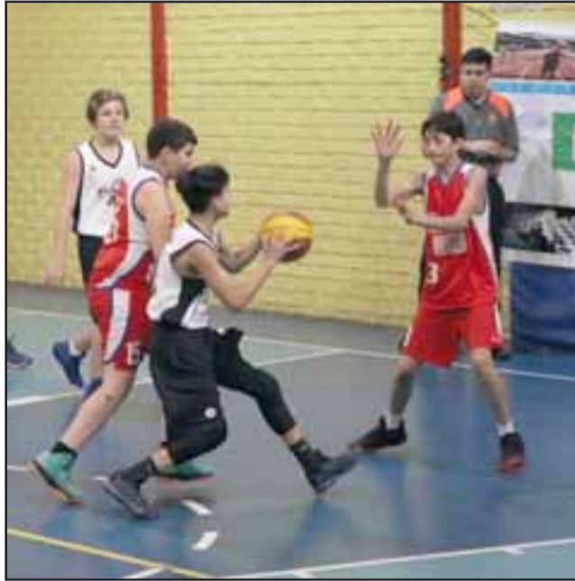
Entre las 10:00 y las 22:00 horas, en el gimnasio del Liceo Roberto Humeres, tendrá lugar el básquetbol 3x3.

Las actividades cuentan con el apoyo de la Municipalidad de San Felipe, a través de su departamento de Deportes y Actividad Física.