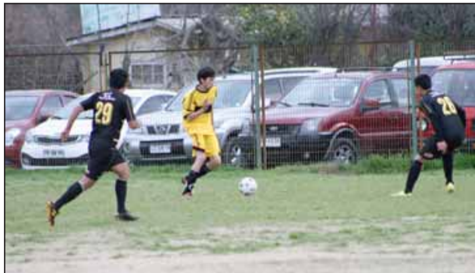
Durante el fin de semana el balón rodará en las competencias de la Liga Vecinal, Lidesafa y Asociación de Fútbol.

Unión Sargento Aldea - Unión Delicias; Ulises Vera - Alianza; Libertad - Mario Inostroza; Juventud La Troya - Arturo Prat; Juventud Antoniana - Alberto Pentzke.