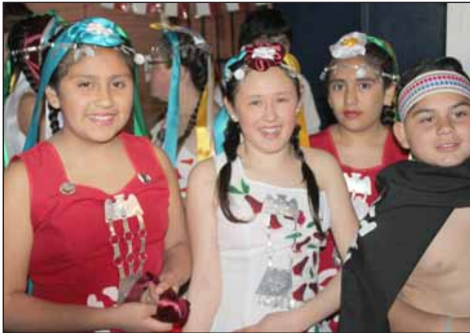
ANSIOSOS POR ACTUAR.- Aquí vemos a estos pequeñitos esperando su turno para presentar su trabajo artístico.