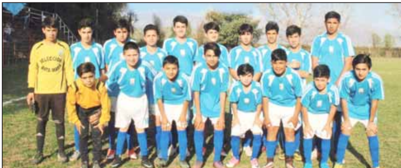
Como forastero el combinado de Santa María buscará sus pasajes a la tercera ronda del Regional Arfa.

La lluvia que el sábado pasado cayó sobre el valle de Aconcagua y prácticamente toda la zona central del país, obligó a suspender los partidos de revancha correspondientes a la segunda ronda de los torneos regionales de fútbol que organiza Arfa Quinta Región y en los que estaban involucrados los seleccionados de nuestra zona.