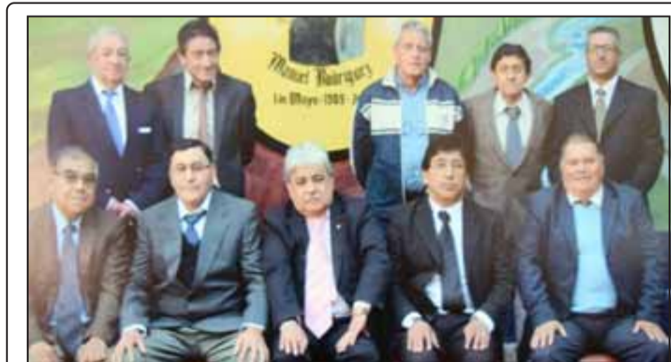
ACTUAL DIRECTORIO. - Ellos conforman la actual directiva de la Sociedad de Socorros Mutuos Manuel Rodríguez, de San Felipe.