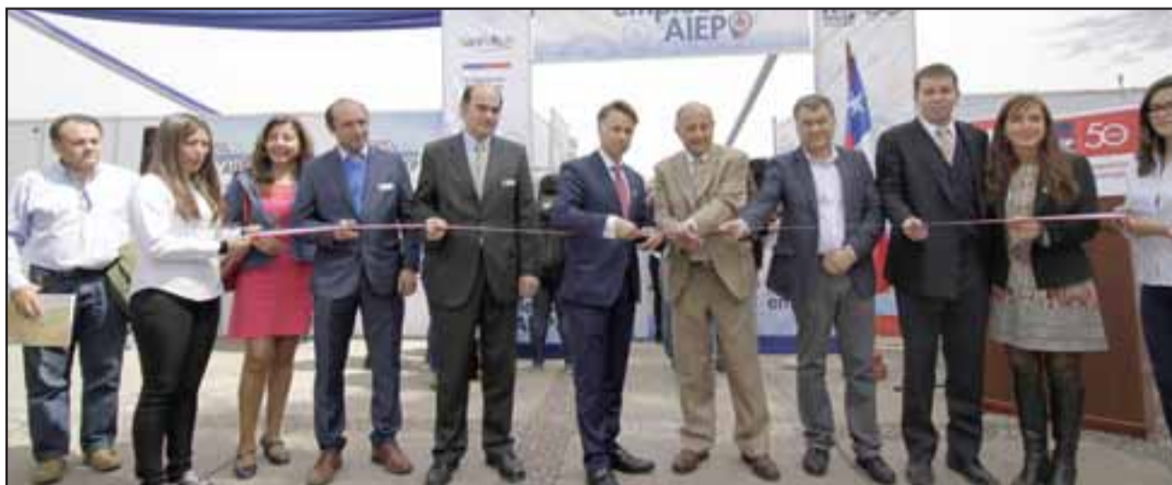
Autoridades en corte de cinta Expo Empleos San Felipe.