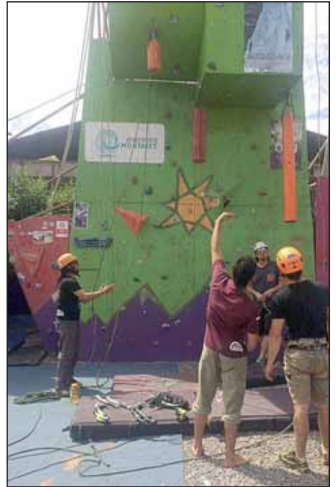
La Escalada abre la jornada sabatina a las 9:00 horas en el Consejo Local de Deportes, ubicado en calle Merced.

Las actividades continuarán con la zumba al aire libre, la cual se realizará a partir de las 10:30 horas en la esquina de Chacabuco con Maipú. «Están todos cordialmente invitados a participar y ojalá puedan llegar al lugar en bicicleta