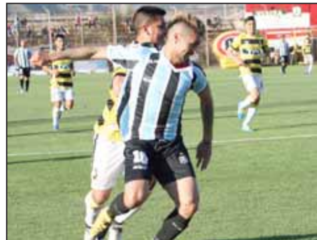
El cuadro sanfelipeño tendrá otra oportunidad para dejar los tres puntos en casa.

12:00 horas: Unión La Calera – Deportes Copiapó 17:00 horas: San Marcos – Ñublense 17:00 horas: Cobresal – Cobreloa 18:00 horas: Unión San Felipe – Puerto Montt